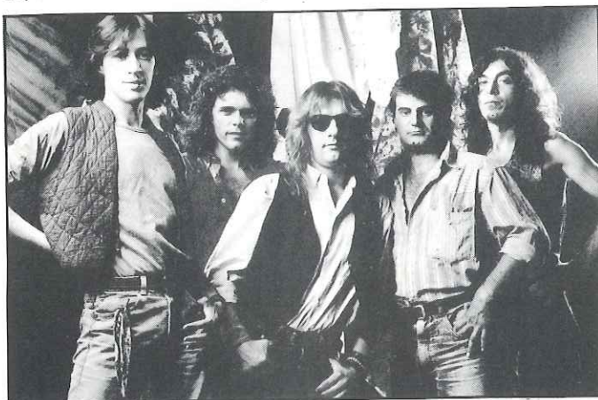
El grup de rock català Sopa de Cabra, el més famós de l'actualitat, actuarà dins de la III Setmana de la Joventut

Tots els joves interessats a participar-hi poden passar els dimarts per la conselleria o bé demanar informació a les entitats juvenils de Castellar.