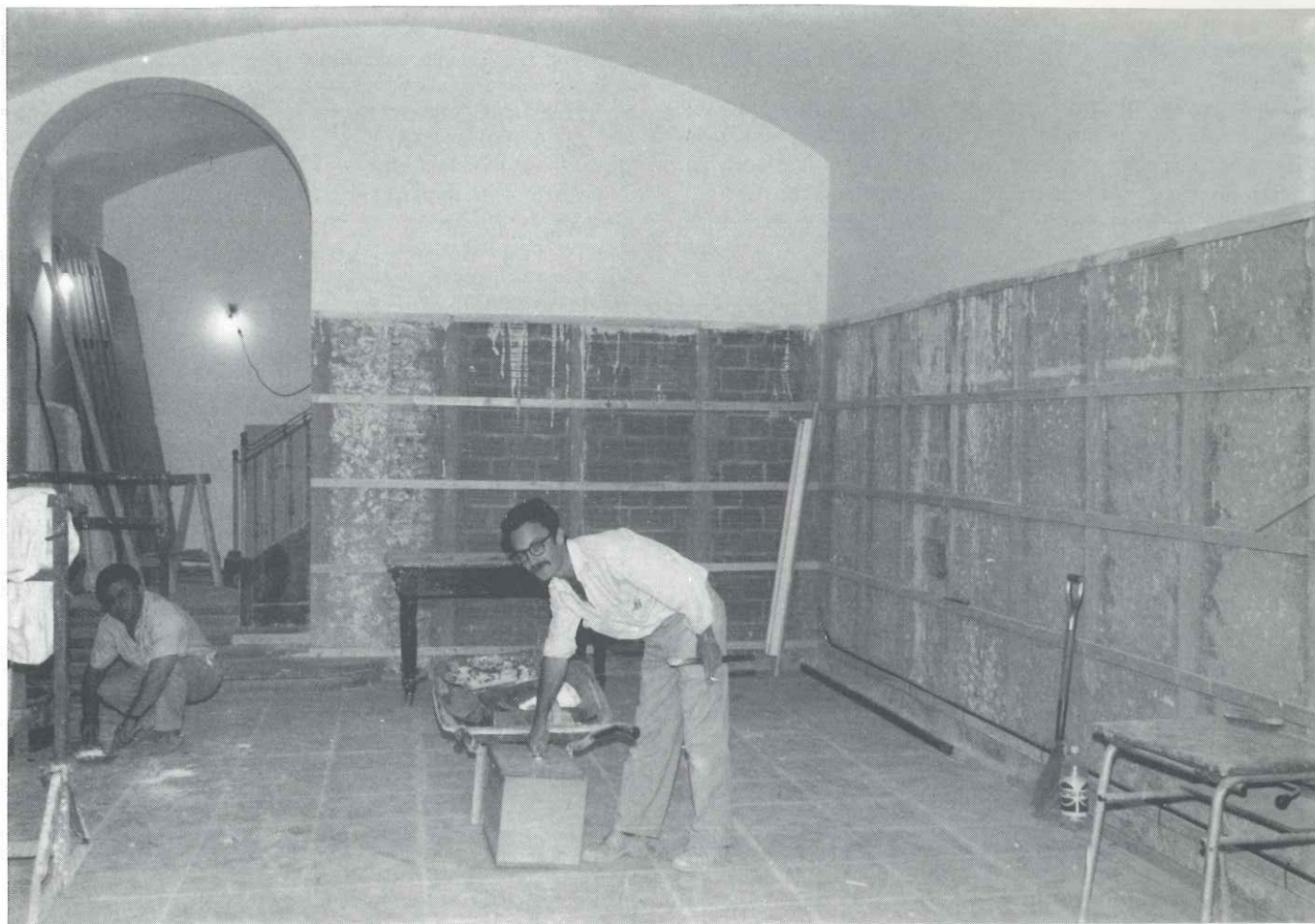
El vestíbul de l'Ateneu pel carrer Major serà totalment reformat i s'hi instal·larà una sala d'exposicions permanent

Un cop s'ha consolidat a la nostra vila el magnífic Auditori Municipal Miquel Pont, la Conselleria de Cultura i els serveis tècnics municipals estan inciant una fase per remodelar l'antic Ateneu i adequar-lo a la nova realitat castellanca seguint, com és lògic, el camí traçat l'any 1953 quan l'empresa Viuda Tolrà i l'Ajuntament de l'època van decidir que aquest edifici fos un casal de cultura i el local social d'una de les principals entitats culturals de l'època: l'Ateneu Castellarenc.