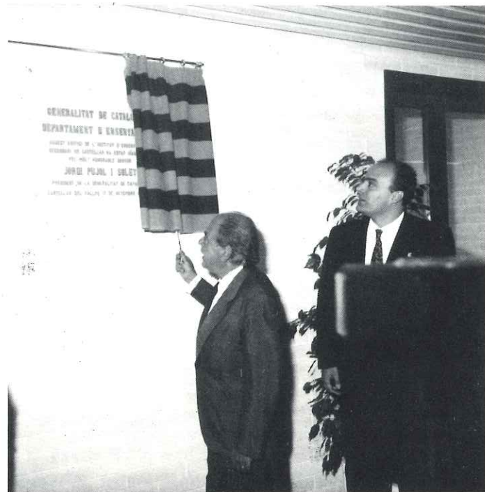
L'Institut d'Ensenyament Secundari (IES) de Castellar ja és una realitat

tothom un major patriotisme i respecte a la llengua, la bandera i l'himne, si vo-