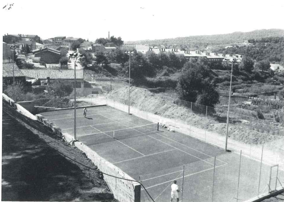
Castellar ja compta amb pistes de tennis de terra batuda

Per a més informació truqueu al telèfon 714 48 62 (Club Tennis Castellar) o bé al 714 87 81 (Antoni Domènech).