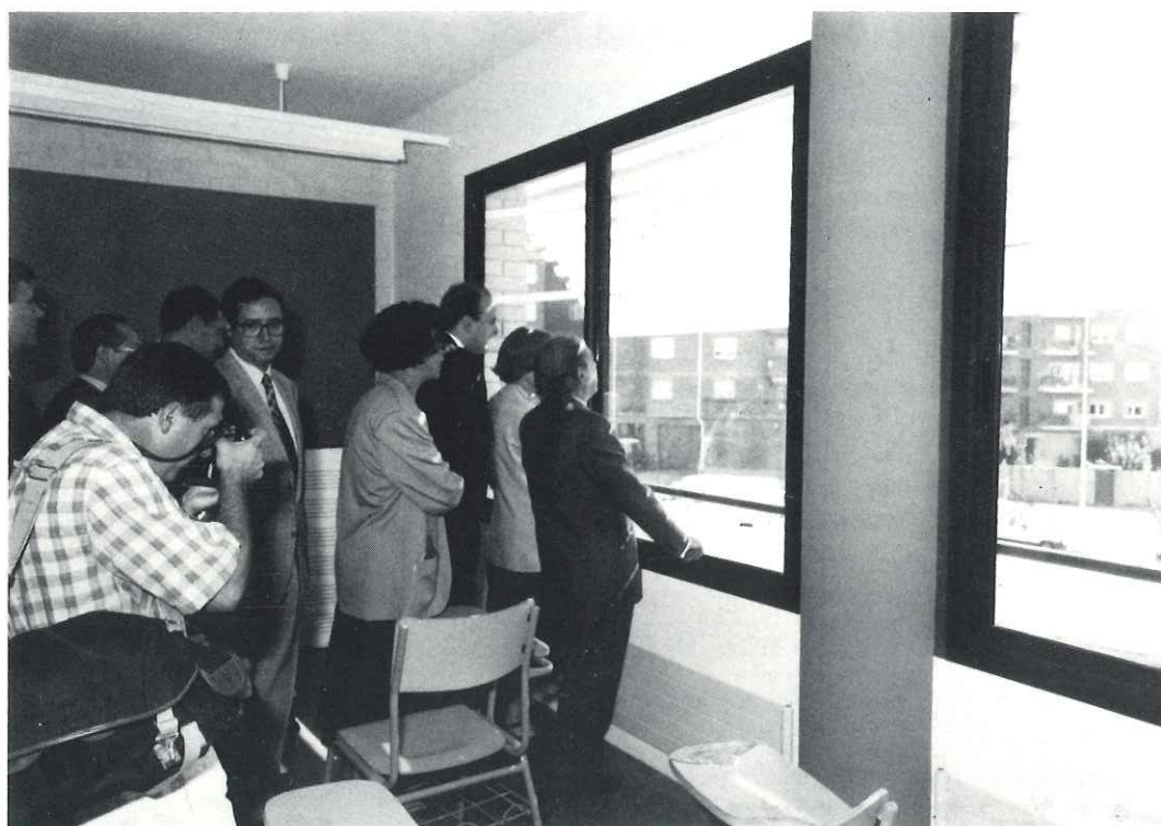
L'Institut destaca per la seva bellesa arquitectònica i pel seu emplaçament assolellat

L'edifici, de dues plantes, és molt funcional i els diferents espais es distribueixen a través d'un passadís central que dona a les diferents aules, laboratoris, audiovisuals, aules-taller, informàtica, etc. Té una capacitat per atendre l'activitat docent de 950 alumnes si bé en aquest primer curs solament hi cursaran els seus estudis uns 600 alumnes de Castellar i Sant Llorenç Savall, distribuïts en 3r curs d'ensenyament secundari obligatori (ESO),