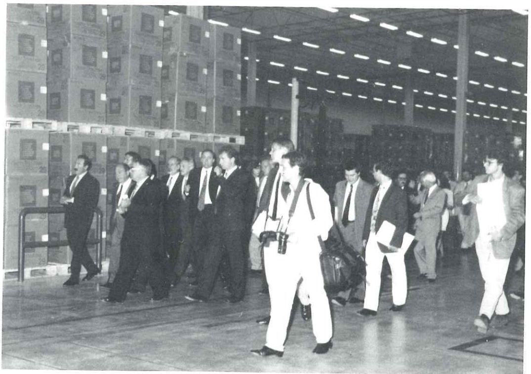
La modernitat de l'empresa Sony, tot un símbol per a la nostra zona industrial