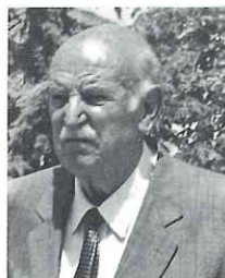
Vicenç Girbau i Vives