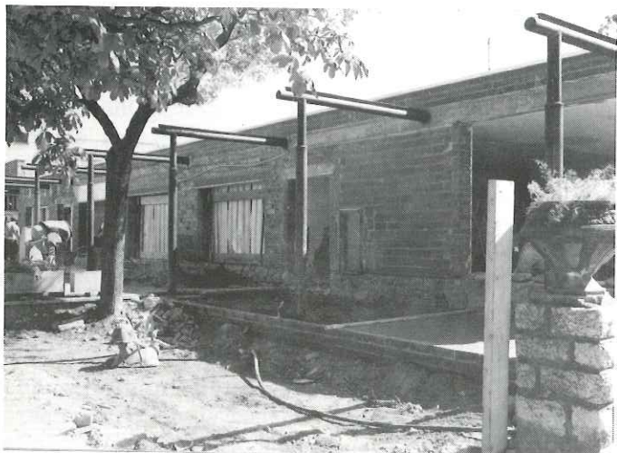
Casal d'Avis de la plaça Major