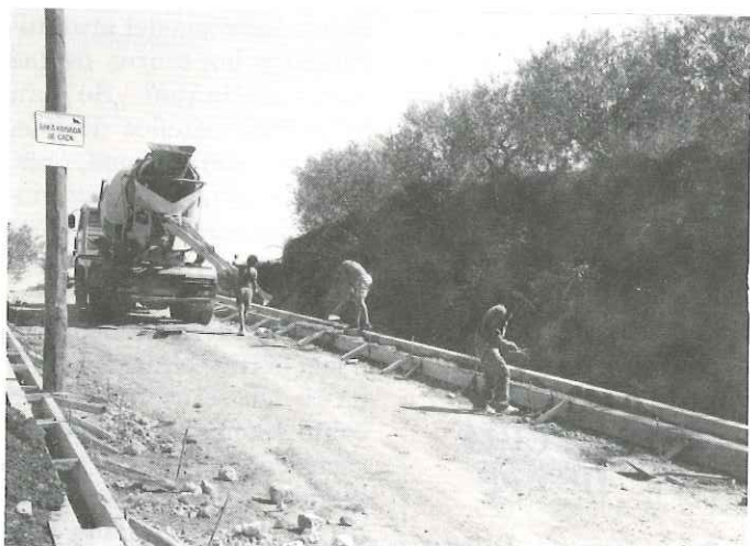
Obres al camí del cementiri