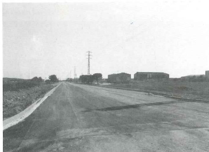
Obres d'urbanització al polígon II del Pla de la Bruguera