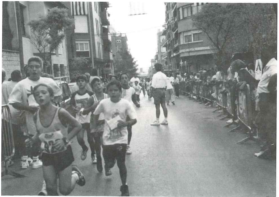
La cursa popular va tornar a la festa major