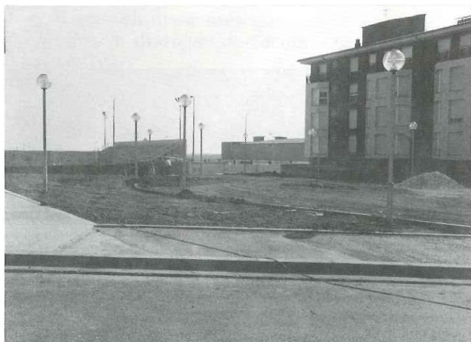
Plaça d'Emili Altimira

Totes aquestes obres públiques tenen per objecte la millora de Castellar, i d'elles en parlarem amb més detall en números successius de Casa de la Vila .