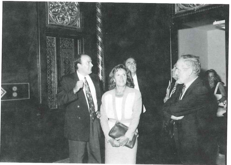
La capella del Palau Tolrà ha estat completament restaurada

La inauguració de l'Ajuntament va continuar amb un concert de sardanes a càrrec de la Cobla Jovenívola de Sabadell en la glorieta del pati. Com a anècdota, val a dir que el presentador de les sardanes va ser un