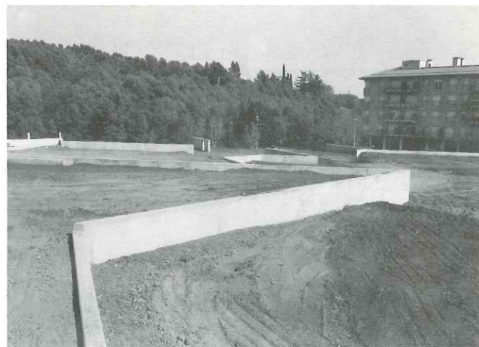
Plaça de Catalunya