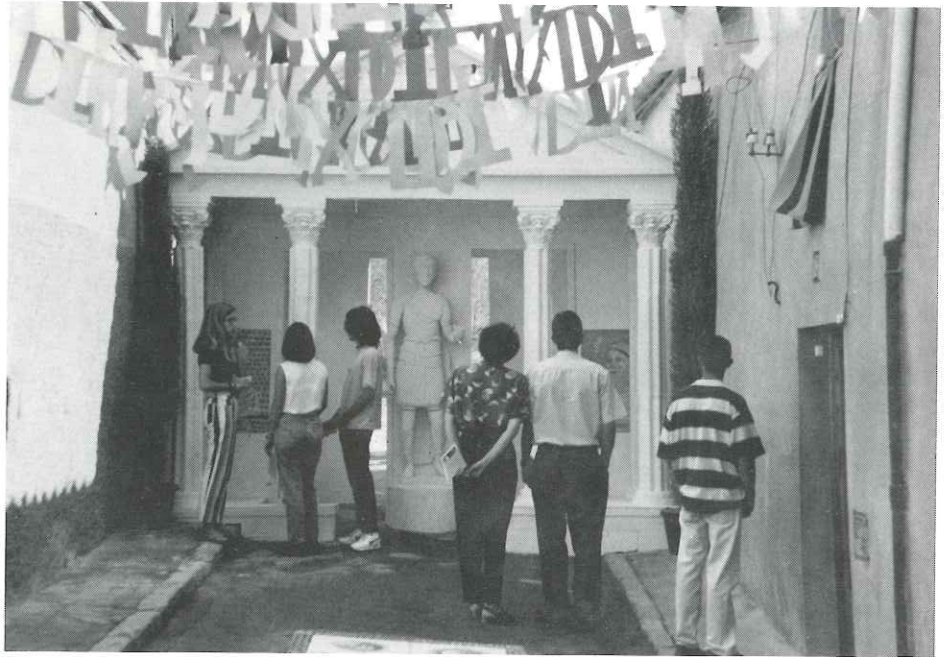
...i el carrer de les Roques el segon

El castell de focs i el ball de fi de festa a la Nau, amb l'Orquestra Cimarrón, van posar punt i final a la festa major 1994.