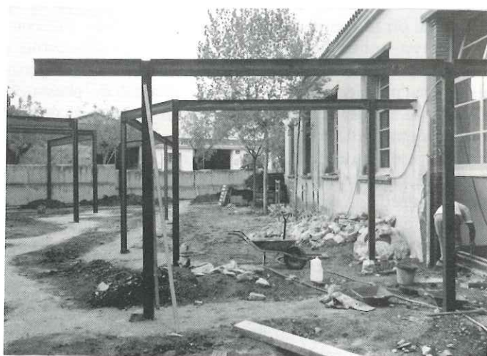
Ampliació de l'Escola Emili Carles-Tolrà