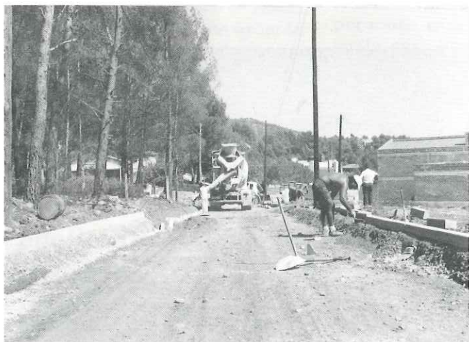
Obres d'urbanització a l'Airesol A i B