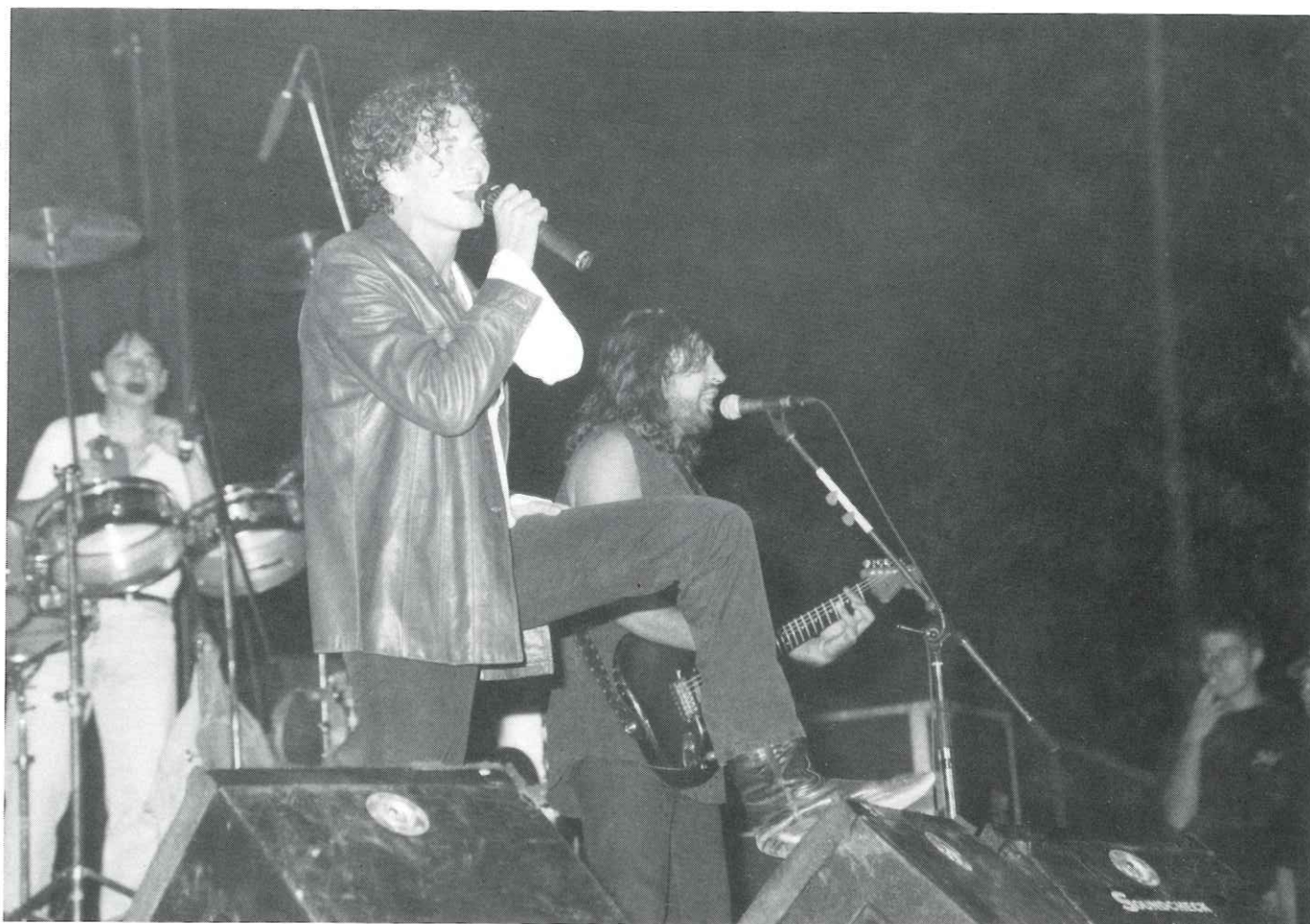
El grup Sau va aplegar més de 2.000 joves al camp de futbol

Dels dies 9 al 12 de setembre, Castellar del Vallès va celebrar la seva festa major, que es va caracteritzar perquè es va superar amb escreix la participació popular de les últimes edicions.