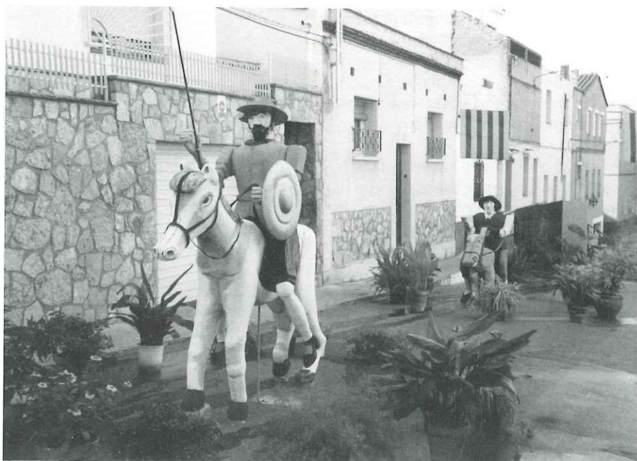
El carrer de Sant Sebastià es va endur el primer premi dels carrers engalanats...

giat pels participants, ja que no hi havia grans desnivells.