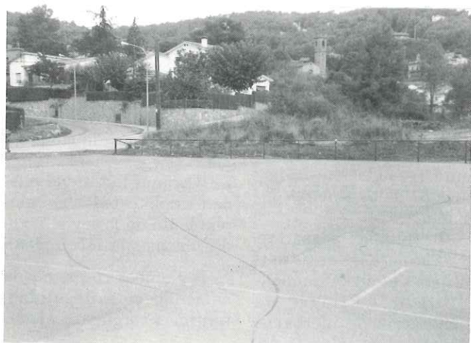
Camp d'esports de Sant Feliu del Racó