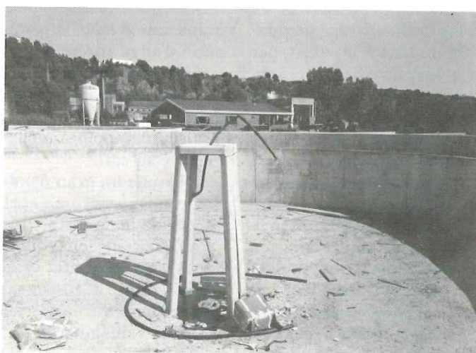
Depuradora del riu Ripoll