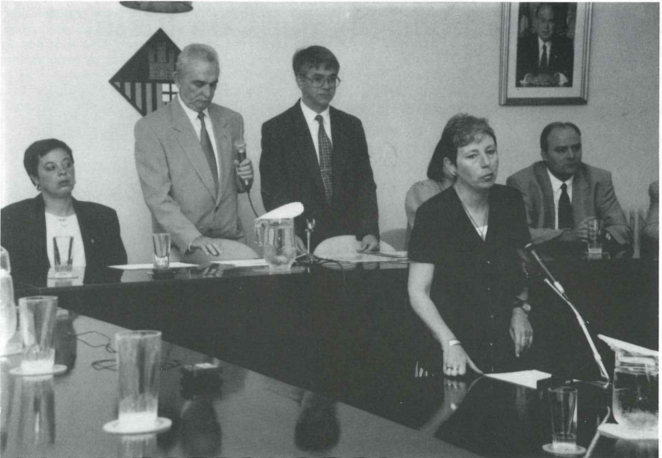
La presència femenina a l'Ajuntament ha augmentat, ja que s'ha passat d'una a cinc regidores