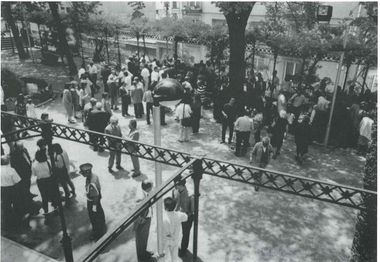
La cerimònia de constitució del nou Ajuntament va acabar amb un pisolabis al jardí