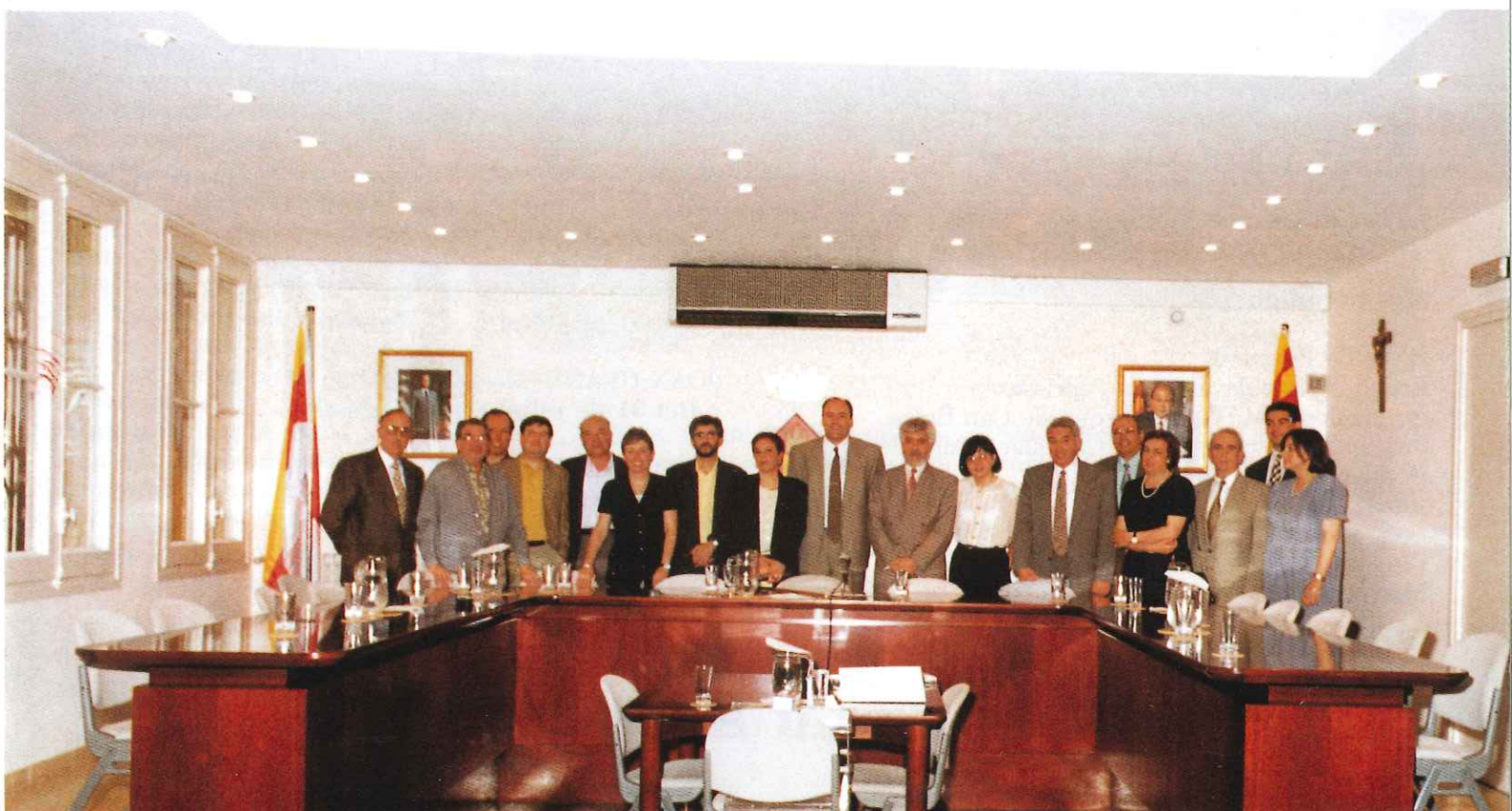
Els integrants de la nova corporació municipal