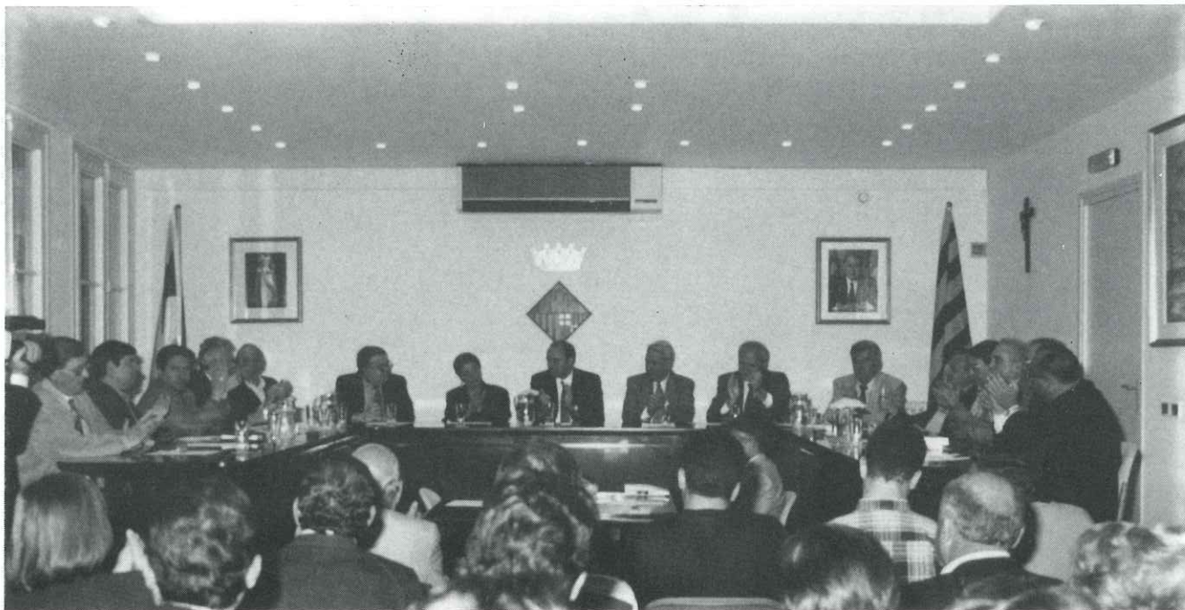
Darrer ple municipal del període 1991-1995

«El bon clima de convivència, la tolerància política i un veritable exercici de pràctica democràtica en els últims quatre anys». Aquests són, en resum, els trets que es van destacar més en el ple municipal celebrat el passat 14 de juny, el darrer de la quarta legislatura.