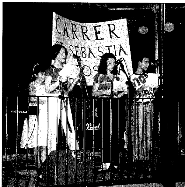
Moment de la lectura del pregó a càrrec dels veïns del carrer de Sant Sebastià.