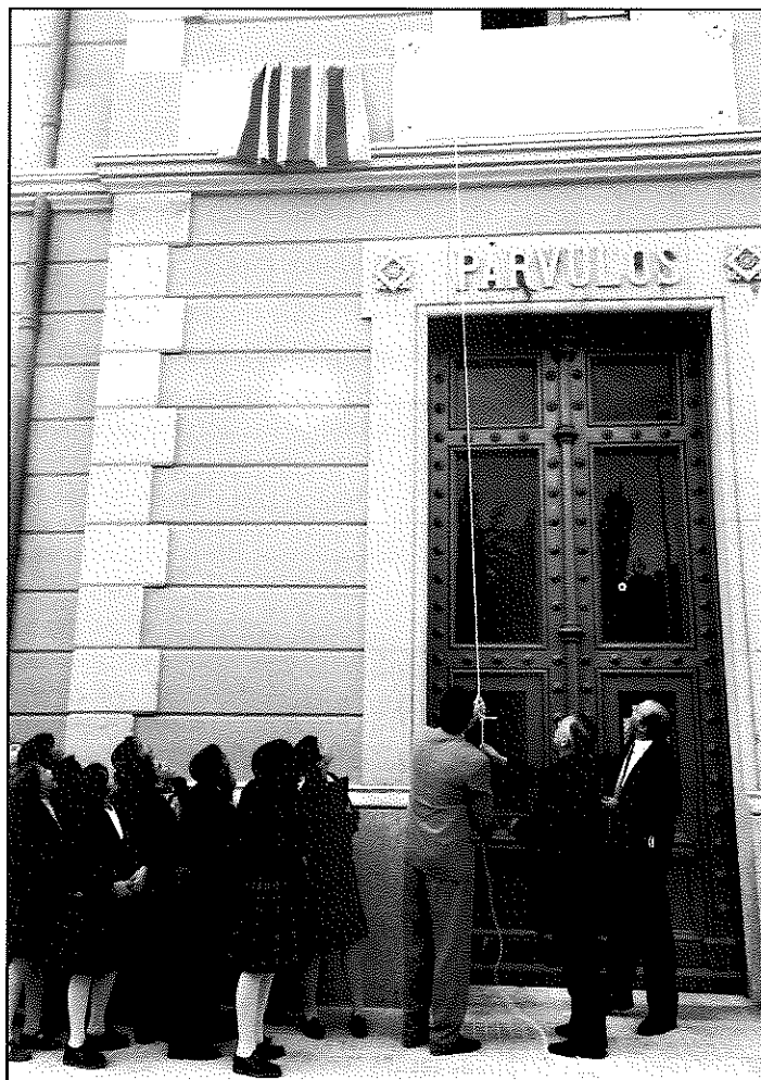
La fotografia recull el moment del descobriment de la placa commemorativa

amb un dinar per a prop de 600 comensals, en el qual es van retrobar exalumnes de les Germanes Dominiques de diverses generacions.