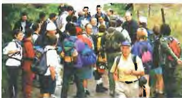
Més de 50 persones van participar en l'última etapa de la travessa d'agermanament