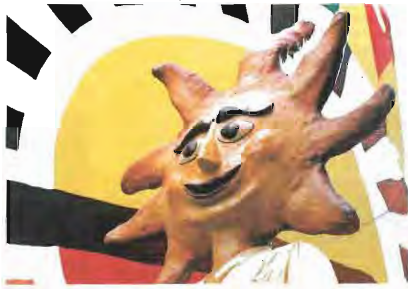
Primer premi del tercer ral·li fotogràfic de Festa Major 1998

Ara, la Regidoria de Lleure i la Comissió de Festes ja treballen activament per ultimar els detalls de la revetlla de cap d'any.