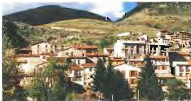
Castellar de N'Hug és un municipi amb menys de 200 habitants i que viu sobretot del turisme