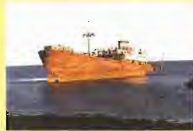
Tercer premi: El mar, de bressol de vida a llit de mort