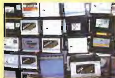
Accèssit: Posa't les piles