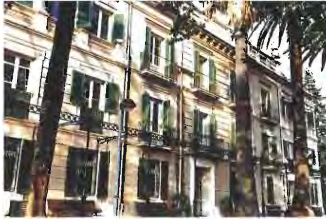
Les dues seus de l'Ajuntament entre 1979 i 1999

Aquest mes d'abril es commemora el vintè aniversari de la reinstauració de la democràcia als ajuntaments catalans. En l'àmbit local, l'Ajuntament de Castellar del Vallès també s'ha volgut afegir als actes commemoratius organitzats per diverses institucions i ha iniciat la preparació d'una sèrie d'actes que tindran lloc a partir d'aquest estiu, just després de les eleccions municipals.