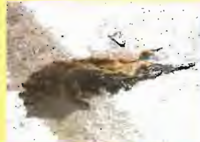
Segon premi: Vida de gossos