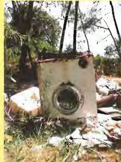
Primer premi: La Rentadora Ecològica