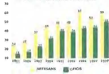
LA MOSTRA MÉS DIVERSA

La Comissió de la Mostra ha fet possible l'organització d'aquesta festa tradicional. Un any més, aquest grup de voluntaris ha preparat fins a l'últim detall.