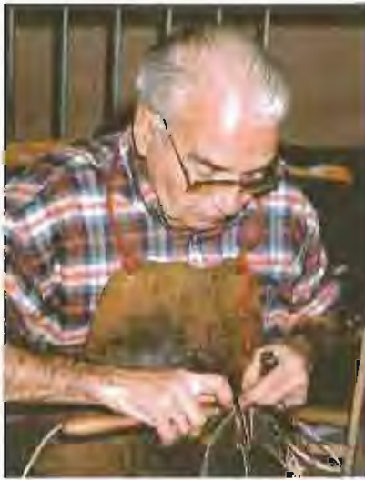
59 artesans s'aplegaran a les naus i aparcament de la Plaça Major amb motiu de la IX edició de la Mostra d'Oficis Artesans

d'aixa procedent de Cadaqués». El mestre d'aixa és el nom que rep la persona encarregada de fabricar barques tan sols amb l'esforç de les seves pròpies mans.