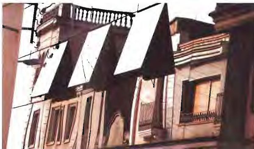
Aquesta és la moderna façana dels nous estudis de l'emissora municipal.