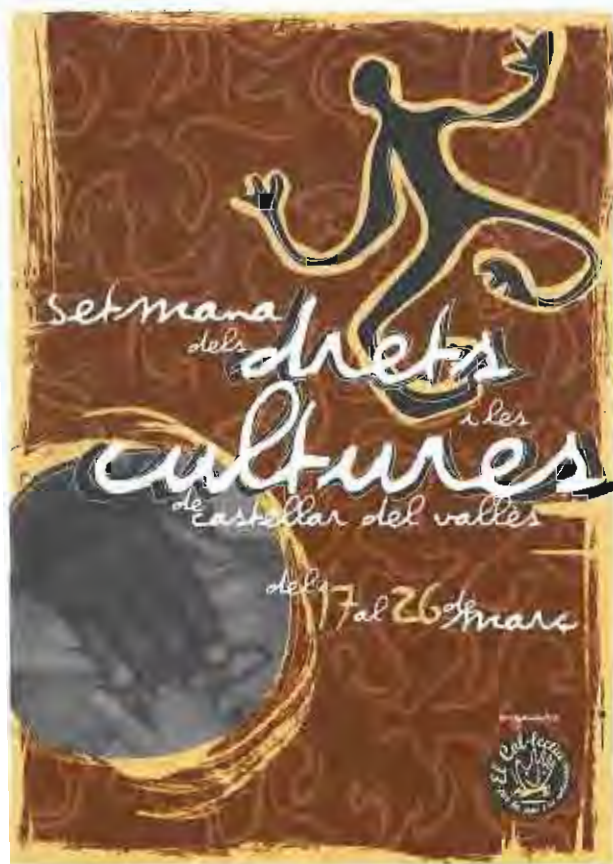
El cartell de la setmana, que tindrà lloc entre el 17 i el 26 de març.

Cal destacar, també, la col·laboració activa de l'Ajuntament, que es traduirà en l'organització d'alguns actes per part de diverses regidories i en el