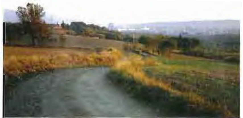
Alguns camins del nostre municipi passaran a formar part d'aquest ambiciós projecte comarcal.

El nostre municipi va iniciar el 26 de març de 1996 amb la signatura de la Carta d'Aalborg al Ple de l'Ajuntament el seu camí cap a la sostenibilitat, és a dir, la seva Agenda 21 Local; a nivell pràctic però Castellar sempre ha desenvolupat actuacions en aquest sentit que ara s'inclouran dins l'Agenda de manera periòdica. Una d'aquestes actuacions és el projecte de l'Anella Verda que unirà a través de camins senyalitzats els municipis del Vallès Occidental.