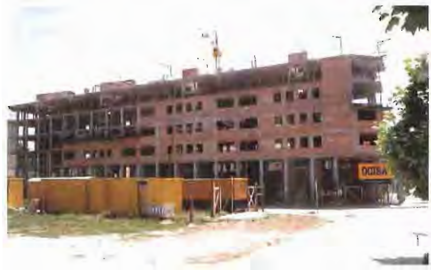
Els dubtes a l'entorn de l'habitatge van ser a l'OMIC un dels temes estrella del 99.

L'OMIC ha atès un important volum de consultes i queixes referents a l'habitatge, els serveis i l'automòbil. Fins i tot, s'han pogut recollir queixes referents als àmbits de la sanitat i l'educació.