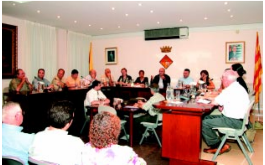
El darrer Ple del mandat 1999-2003 va tenir lloc el passat 10 de juny.

Després de les eleccions del 25 de maig passat, l'Ajuntament de Castellà va celebrar el 10 de juny el darrer ple de la legislatura. Un ple eminentment protocol·lari i institucional que va servir per aprovar l'acta de la sessió anterior i per acomiadar els onze regidors que aquesta legislatura ja no continuen. Durant aquest Ple els regidors que han estat almenys vuit anys al consistori van rebre una insígnia d'or del municipi com a recordatori i com a reconeixement a la seva dedicació.