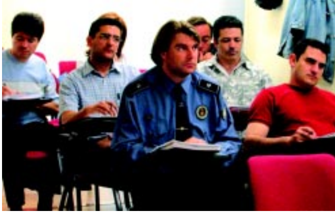
Assistents al curs de formació sobre judicis ràpids.