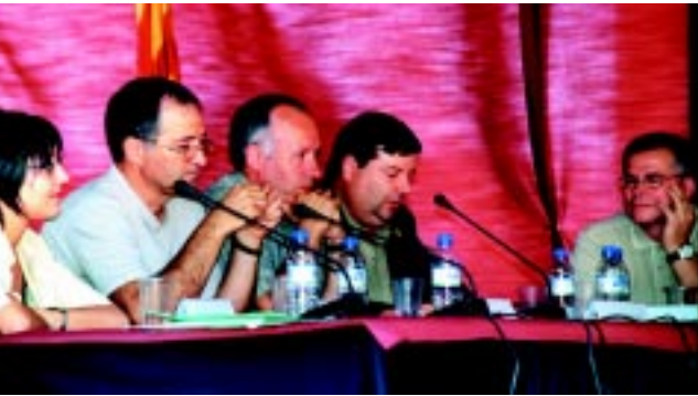
PP, ICV-EUiA i ERC mantenen el mateix nombre de regidors de la passada legislatura.