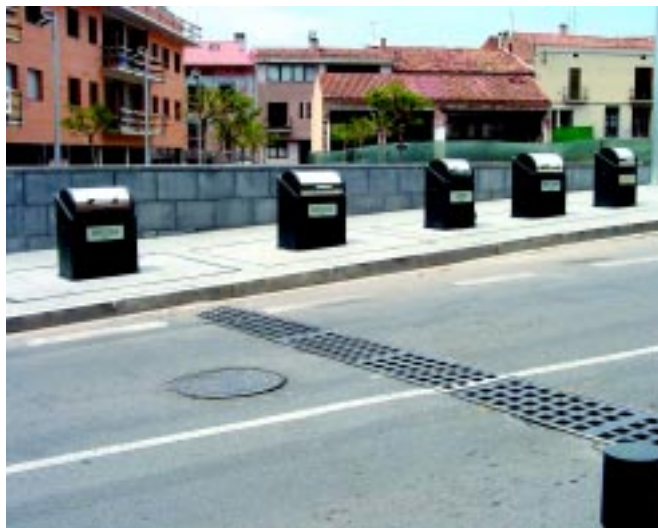
Els primers contenidors soterrats de la vila s'han instal·lat al costat de la plaça de Cal Calissó.

D'altra banda, l'Oficina 21 ha fet balanç de la recollida selectiva de deixalles a Castellar del Vallès durant el 2002. En termes globals, la població