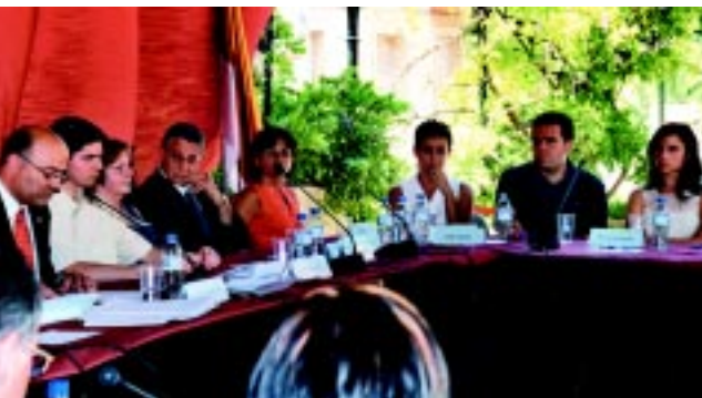
CiU, que no governarà amb majoria absoluta, disposa de vuit regidors a les seves files.