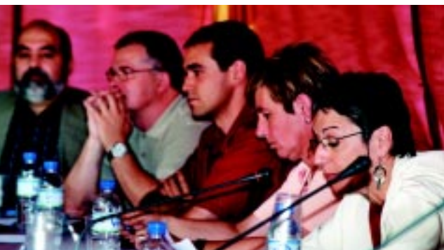
El PSC ha guanyat un regidor però no continuarà a l'equip de govern.

leg i consens ha de ser constant durant tota la legislatura”.