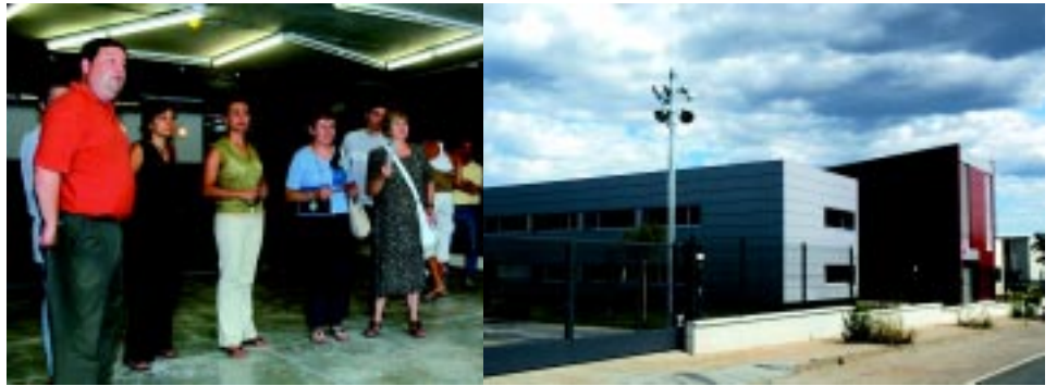
El consistori va fer el 26 de juny una visita d'obres al Centre de Serveis

El Centre de Serveis per a Empreses estrenarà la propera tardor les seves noves dependències. Una vegada finalitzada la darrera fase d'ampliació, enllestida entre l'octubre de 2004 i el maig de 2005, l'equipament triplicarà la superfície de manera que disposarà d'un total de 1.532 metres quadrats. Les obres han tingut un cost de 815.607 euros i el finançament ha anat a càrrec de l'Ajuntament, fons europeus Feder i aportacions privades. Amb aquesta ampliació, l'objectiu és aconseguir que el Centre esdevingui un referent en la prestació de serveis a les empreses del municipi, doni suport a la seva millora competitiva i funcioni com a nexa per a la relació entre les mateixes empreses i amb l'Ajuntament de Castellar.