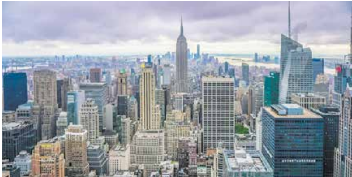
Vistes de NY des del mirador del Top of the Rock del Rockefeller Center. És una de les destinacions preferides pels castellarencs. || JMR

Per a l’estiu, potser encara hi som a temps. “Sobretot ens demanen viatges a l’Àsia, al Japó, perquè és el primer estiu sense restriccions. El que passa és que els preus s’han apujat moltíssim”, subratlla. La responsable de l’agència apunta que el preu d’algunes destinacions, quant a vols i