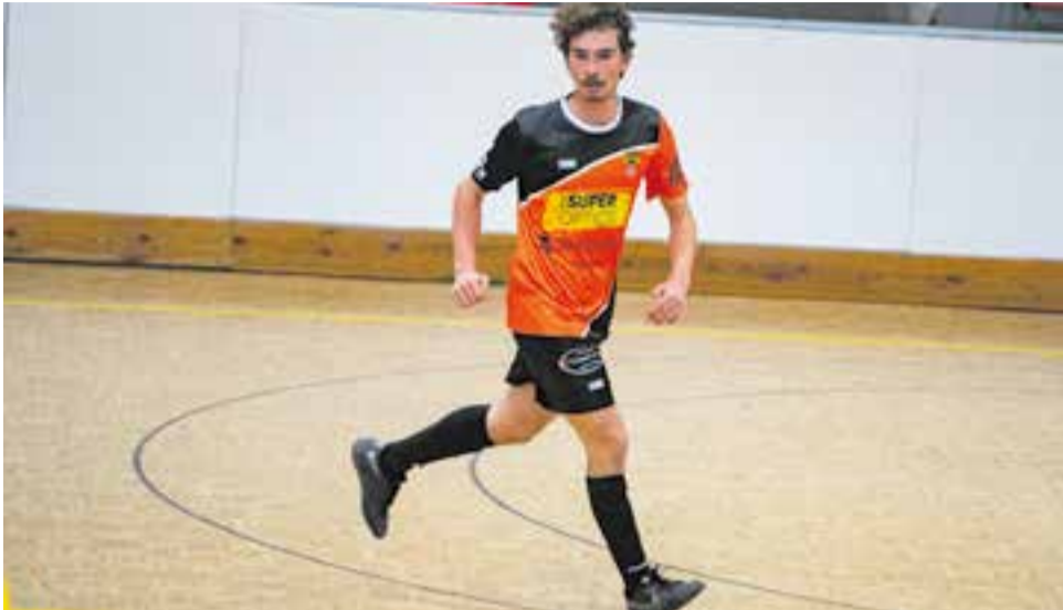
L'FS Castellar no pot fallar més si vol mantenir la categoria. || A. SAN ANDRÉS