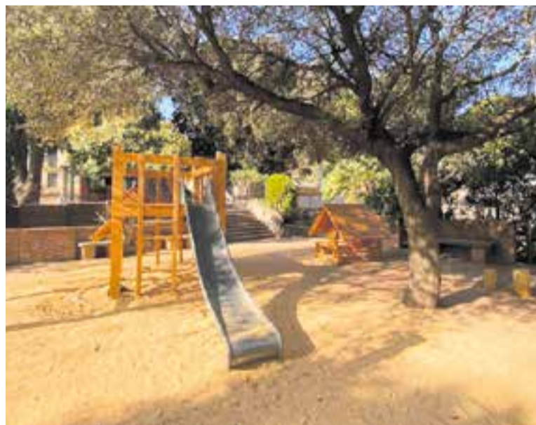
El nou espai de jocs infantils a la plaça de Miquel Pont a Sant Feliu del Racó.

D'altra banda, Castellar compta per primera vegada amb un circuit de parkour que inclou diversos obstacles, barreres i petits murs que permeten realitzar aquesta disciplina esportiva. L'actuació s'ha dut a terme a proposta del Consell d'Adolescents de la vila.