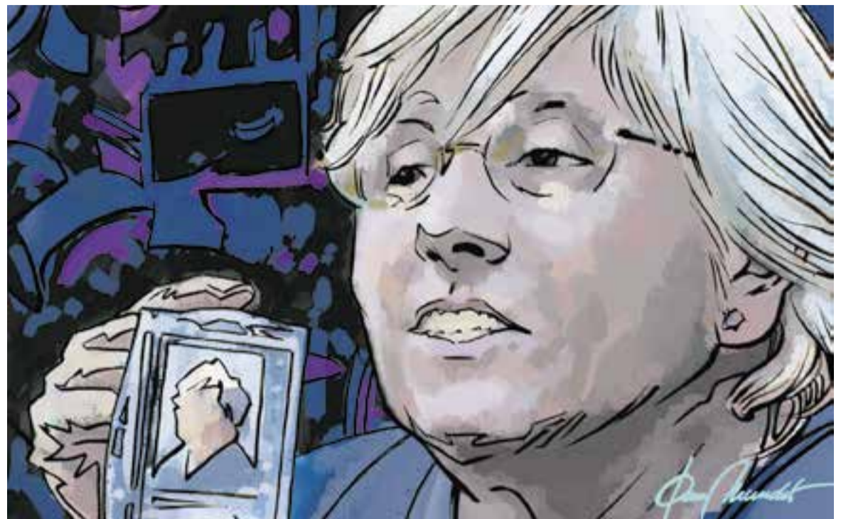
© Amistats perilloses 11. || JOAN MUNDET

Amistats perilloses 6: Cas Mediator. Les xifres del negoci de la prostitució no estan clares, però són suculentos. Economia submergida. Em pot semblar bé pagar per sexe, si les dues parts hi estan d'acord. El