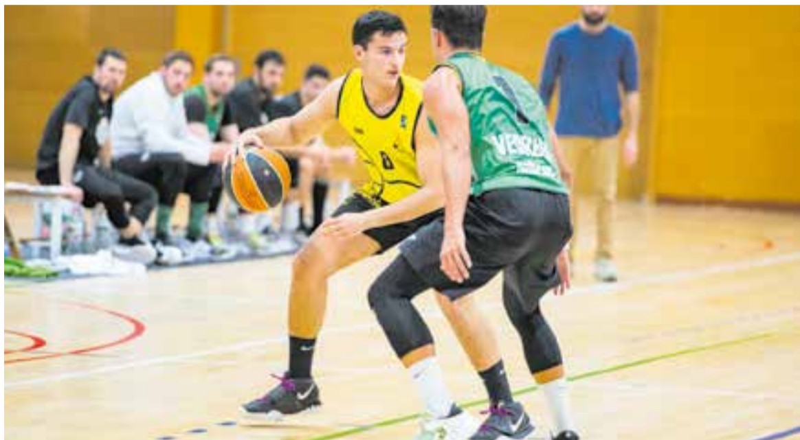
Tercera victòria del CB Castellar, que encara no ha dit l'última paraula en la Lliga. || A. SAN ANDRÉS

Els de Josep Bordas guanyen a Mollerussa i volen lluitar pel play-out