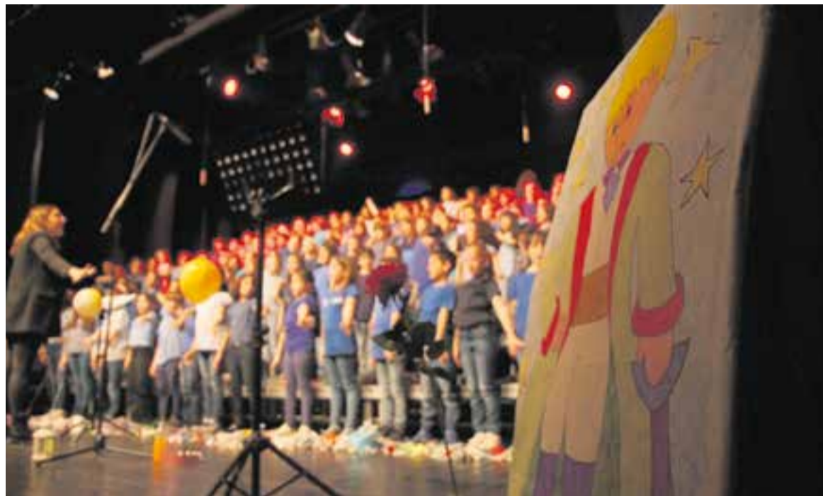
Els alumnes van interpretar la cantata en dues sessions perquè totes les famílies poguessin gaudir de l'espectacle.