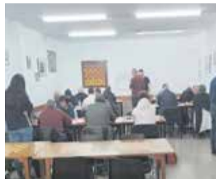
Moment d'una partida del play-off. || CEDIDA

El primer equip del Club d'Escacs Castellar es va enfrontar a l'Avinyó CE en la primera jornada del play-off pel títol de la Lliga Catalana. Amb el títol de Lliga i l'ascens aconseguit, l'equip va empatar a quatre i segons informen des del club, passen a la ronda següent. Dimarts, 4 d'abril (12.00 h) el club coneixerà el seu pròxim rival en el play-off de la Lliga Catalana, que es disputarà el dia 16. El segon equip no va tenir tanta sort i després d'una bona temporada regular es va veure les cares amb el Mojà C, amb qui va caure per 1,5 a 2,5, de manera que va quedar eliminat del play-off. + || A. SAN ANDRÉS