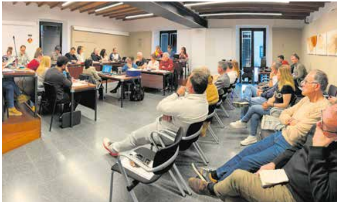
Imatge del ple de març amb presència de veïns d'Stop Playtex i dos membres de l'AV El Balcó.