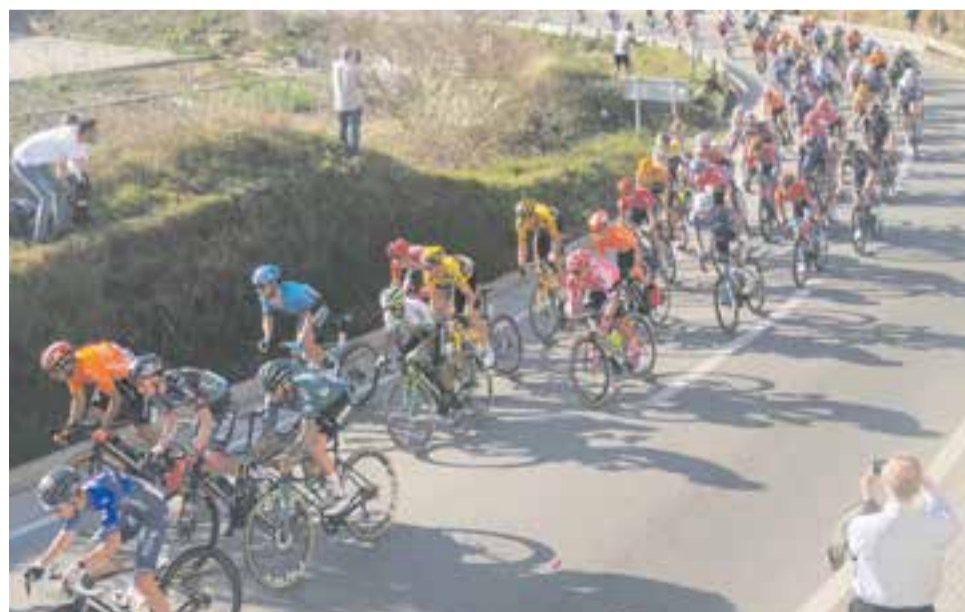
L'edició de La Volta a Catalunya va tornar a passar per Castellar del Vallès.