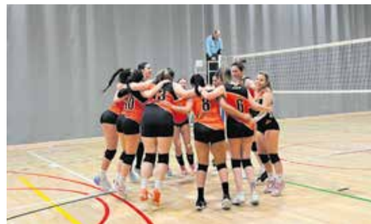
L'equip celebra la victòria i el lideratge després de superar les Panteres.

Les castellarenques no perden des de l'onzena jornada de la primera fase, quan el 14 de gener van caure per 0-3 amb el Vilassar; tercer classificat del grup. Des de llavors, l'equip va sumar tres victòries al tie-break per acabar la primera part de la temporada i cinc més en el que porten de segona. L'equip, que va acabar en últim lloc la primera fase, s'ha recuperat anímicament, canviant per complet la dinàmica de joc i superant equips que van acabar pel davant. Tot i això, cinc dels nou punts sumats, li van servir per a la segona fase, cosa que els va permetre entrar en tercer lloc, per després remuntar els quatre de diferència amb l'Ametlla Verd i l'Olot. Quant a l'equip masculí, els de Rafa Corts no van jugar i aquesta setmana tornaran contra el CV Monjos (dissabte, 20.00 h, al Puigverd). † || A. S. A.