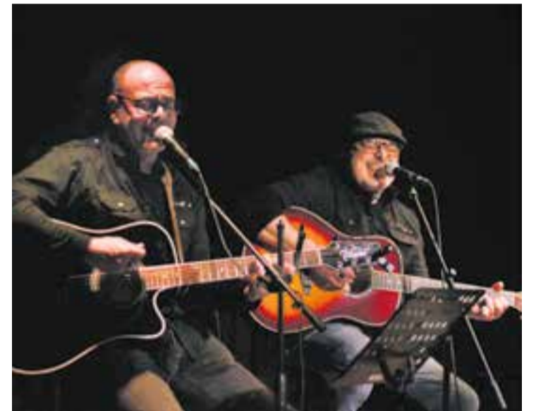
Nothing Re actua aquest divendres al Calissó Cultural.