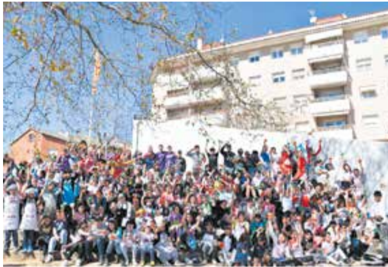
Foto de família dels infants i joves participants a la trobada.