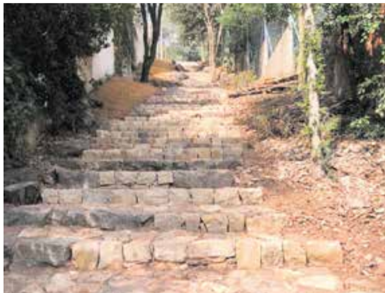
Aspecte del tram de les escales després de la reforma que s'hi ha fet.

L'Ajuntament de Castellar del Vallès ha finalitzat recentment els treballs d'arranjament del tercer tram de les escales del Cim o dels enanitos , que comuniquen el carrer de les Vinyes amb el carrer de la Castellassa. Els treballs han consistit en la restauració i recuperació dels 70 graons existents en aquest tram de 76 metres lineals que salva un desnivell de prop de 30 metres. Per fer-ho, s'ha aprofitat la mateixa pedra que formava l'escala original i s'ha respectat al màxim l'aspecte original de l'escala. Per garantir la durabilitat de l'actuació, s'han amorterat les peces, assegurant-ne així la resistència, en una feina que s'ha dut a terme de manera eminentment manual. Queda pendent completar el tram d'escala amb una barana auxiliar de fusta tractada que es col·locarà properament. L'obra, que ha anat a càrrec de l'empresa castellarenca Naturalea i que ha suposat una inversió de 33.000 euros, s'ha executat amb càrrec a la darrera convocatòria dels Pressupostos Participatius. Com que en aquella edició no va concórrer