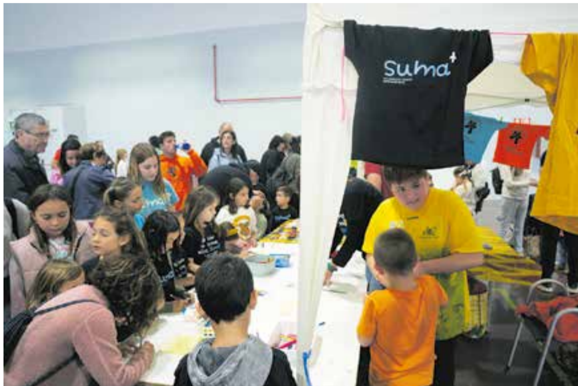
Un dels tallers que es van fer al llarg del matí organitzats per SUMA+ Castellar a l'Espai Tolrà.

“Estem molt contents perquè hi han passat moltes persones. Tot el dia hi ha hagut gent entrant i sortint. I a més, moltes entitats del poble hi han col·laborat. Realment, veiem que Suma ja és una festa que tothom espera, que tothom s'ho passa bé, i que és una manera diferent d'enfocar les activitats, perquè tothom hi pugui