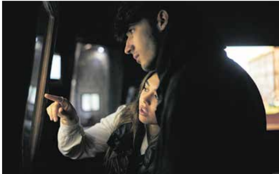
Visitants a la 72a exposició del Grup Pessebrista de Castellar, 'Invents i descobriments de la humanitat'.

Sobre la procedència dels visitants, ja fa uns anys que el públic no és exclusivament castellarenc, sinó al contrari. "Ja fa temps que ho tenim assumit, que venen autocars d'altres entitats i pobles". En aquests moments, Juni afegeix que "la nostra exposició és la mi-