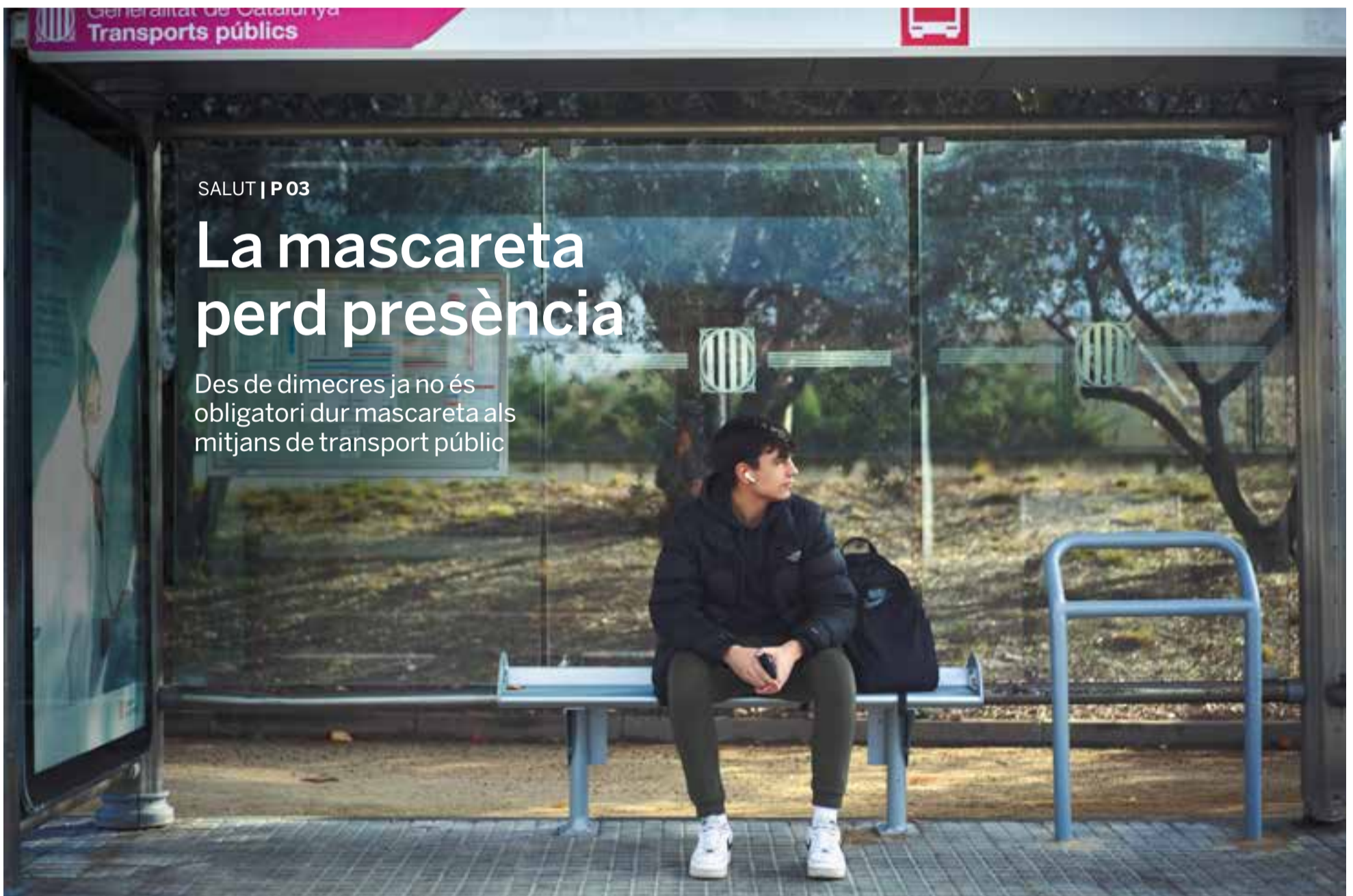
Un jove espera La Vallesana en una parada d'autobús a la carretera B-124. Malgrat ja no és obligatori, molts viatgers continuen fent servir la mascareta.

Des de dimecres ja no és obligatori dur mascareta als mitjans de transport públic