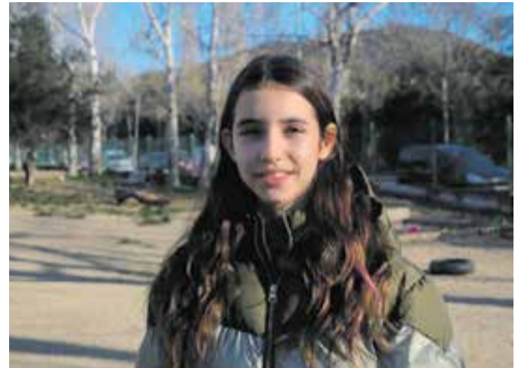
Una de les alumnes de l'IES Sant Esteve organitzadora de la cursa. || C.D.