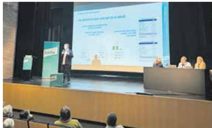
Col·loqui de Junts per Castellar a l'Auditori Miquel Pont. || L'ACTUAL

“Ens hem de posar les piles a l'hora d'apostar per les energies renovables, estem endarrerits”, destaca Juni. “Al col·loqui va quedar en evidència que el nivell d'energia renovable a Catalunya és del 7%, per sota de la mitjana espanyola (sense comptar Catalunya), que ronda el 20%, i dels objectius europeus. És un greuge que cal solucionar amb més plaques solars, entre altres mesures”, afegeix. + || REDACCIÓ