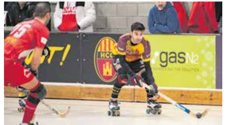
L'HC Castellar guanya la primera fase de la Lliga per segon any consecutiu. || A.S.A.

La setmana que ve arrencarà la fase final, i s'enfrontaran al Capellades (19/2, 18.00 h) a domicili, quart classificat de l'altre grup i, a priori, l'equip més fluix dels quatre amb els quals d'enfrontar. ♦ || A. SAN ANDRÉS