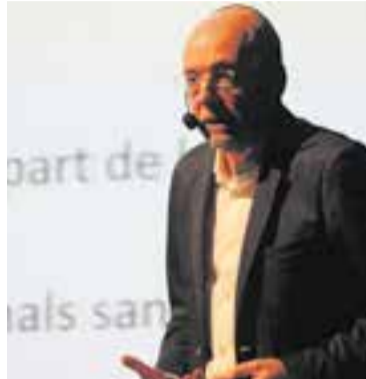
Corominas dimarts a L'Aula. || J. M.

L'estigma també perviu en diversos àmbits com el personal, familiar, social, laboral o educatiu.