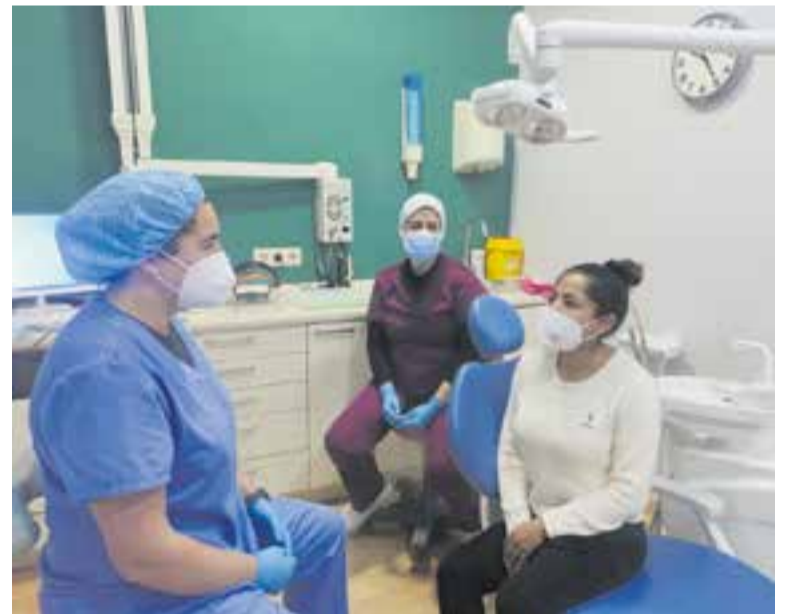
La mascareta seguirà sent obligatòria en centres sanitaris com el dentista.

La mascareta va deixar de ser obligatòria als exteriors fa gairebé un any, el 10 de febrer del 2022. Dos mesos després, el 20 d'abril, també va deixar de ser obligatòria en interiors, menys en centres sanitaris i al transport públic. ➔