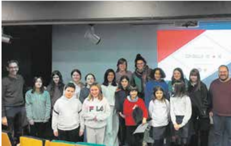
Representants municipals amb els integrants dels dos nous consells.

Estan constituïts per infants i joves de 5è de primària a 4t d'ESO