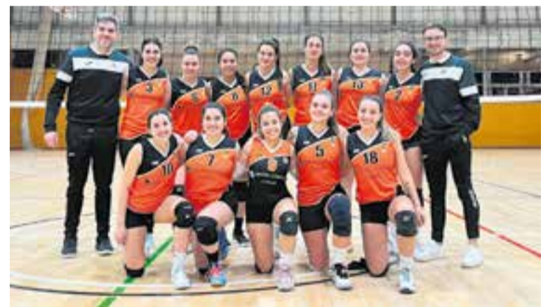
L'equip femení va sumar dos punts al tie-break contra l'Igualada.

Pel que fa a la base, el cadet A i el Juvenil A femenins, van sumar una nova victòria que els deixa a tocar de la fase d'ascens. ♦