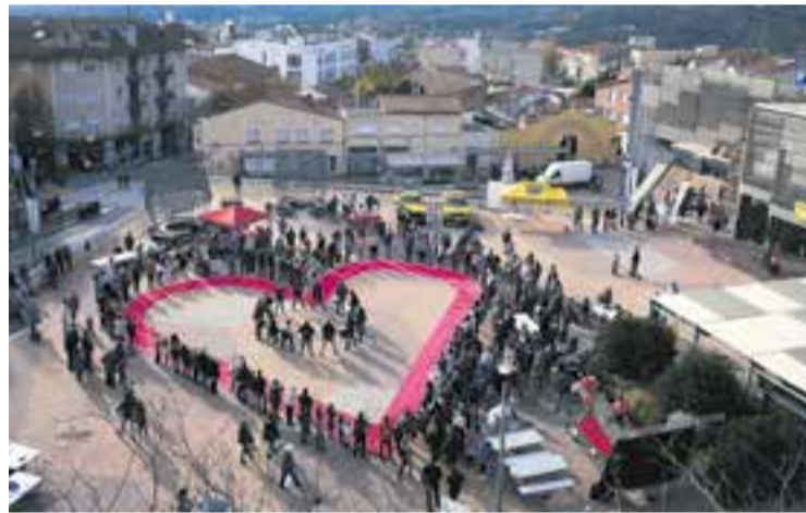
Formació d'un cor gegant a la plaça d'El Mirador el 18 de desembre. || Q. PASCUAL

Des de la Coordinadora Castellar del Vallès amb la Marató de TV3 volen donar les gràcies a totes les entitats i establiments implicats i a les persones que van participar en les activitats de La Marató: "Si no estem equivocats, és el primer any que hem sobrepassat els 6.000 €, tot un rècord", han manifestat molt agraïts. + || C. DOMENE