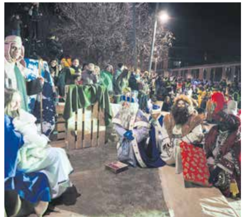
Els tres Reis fent l'adoració al pessebre de Colònies i Esplai Xiribec.

Ambaixadores, i també es van repartir críspetes en una carrossa especial que incloïa una pantalla gegant que retransmetia l'esdeveniment. Jocs per a la Switch, llibres i còmics, una guitarra elèctrica, un ukulele, un karaoke o un casc per al patinet són alguns dels regals que infants com la Bruna, el Ferriol, l'Hèctor, la Maria i la Queralt van apuntar que havien demanat als tres reis. I que anirien a dor-