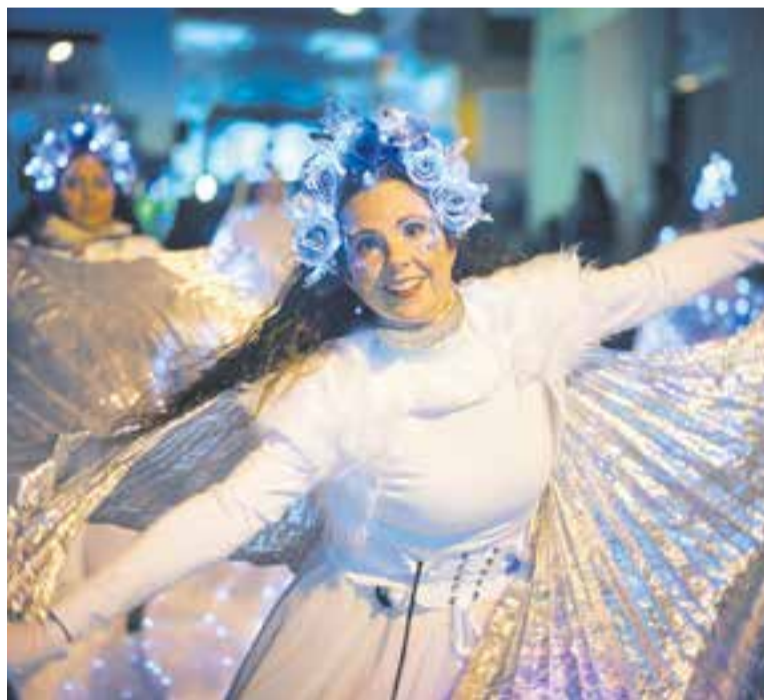
Una de les participants a la desfilada.