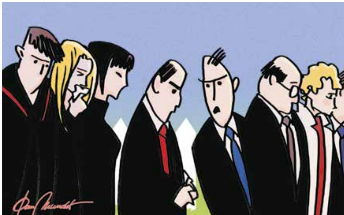
© Molta goma. || JOAN MUNDET

"Una vegada vaig sentir que hom donava a 'fer la goma' un sentit que mai he sabut trobar"