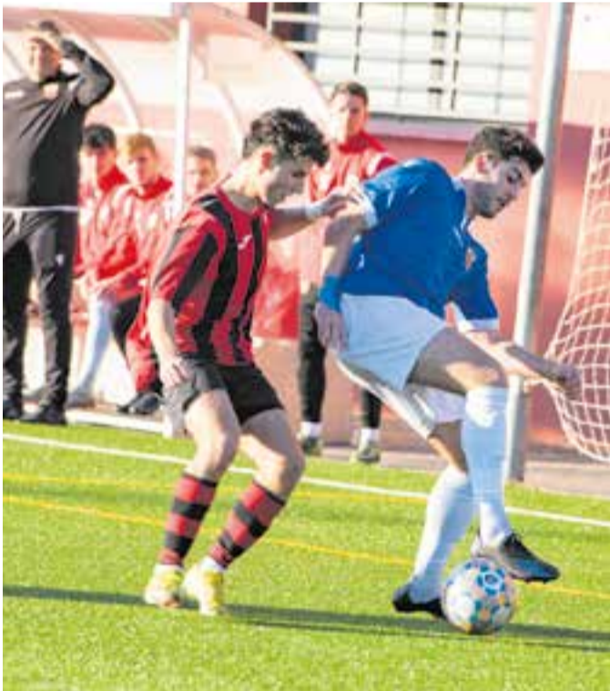
Els blanc-i-vermells van vestir de blau al camp del Gurb i van golejar. || ASA