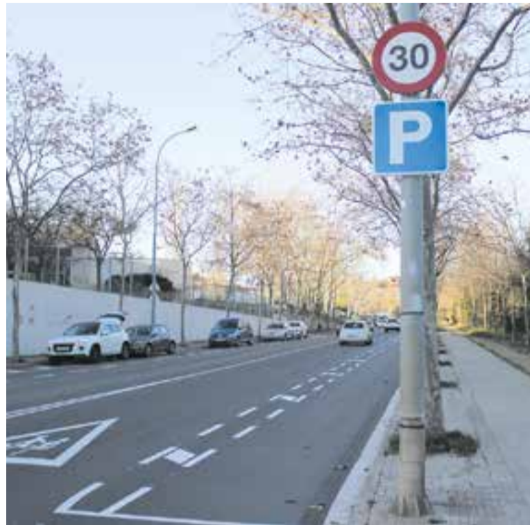
La nova zona d'aparcament de la ronda de Llevant dilluns a la tarda.

La intervenció a l'avinguda de Sant Esteve es farà al tram situ-