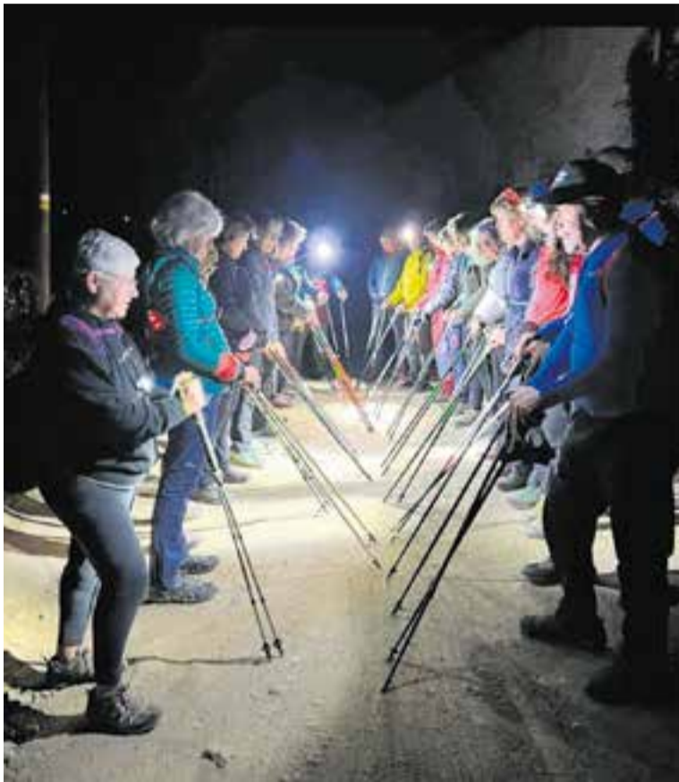
El grup de marxa nòrdica del CEC en una sortida.