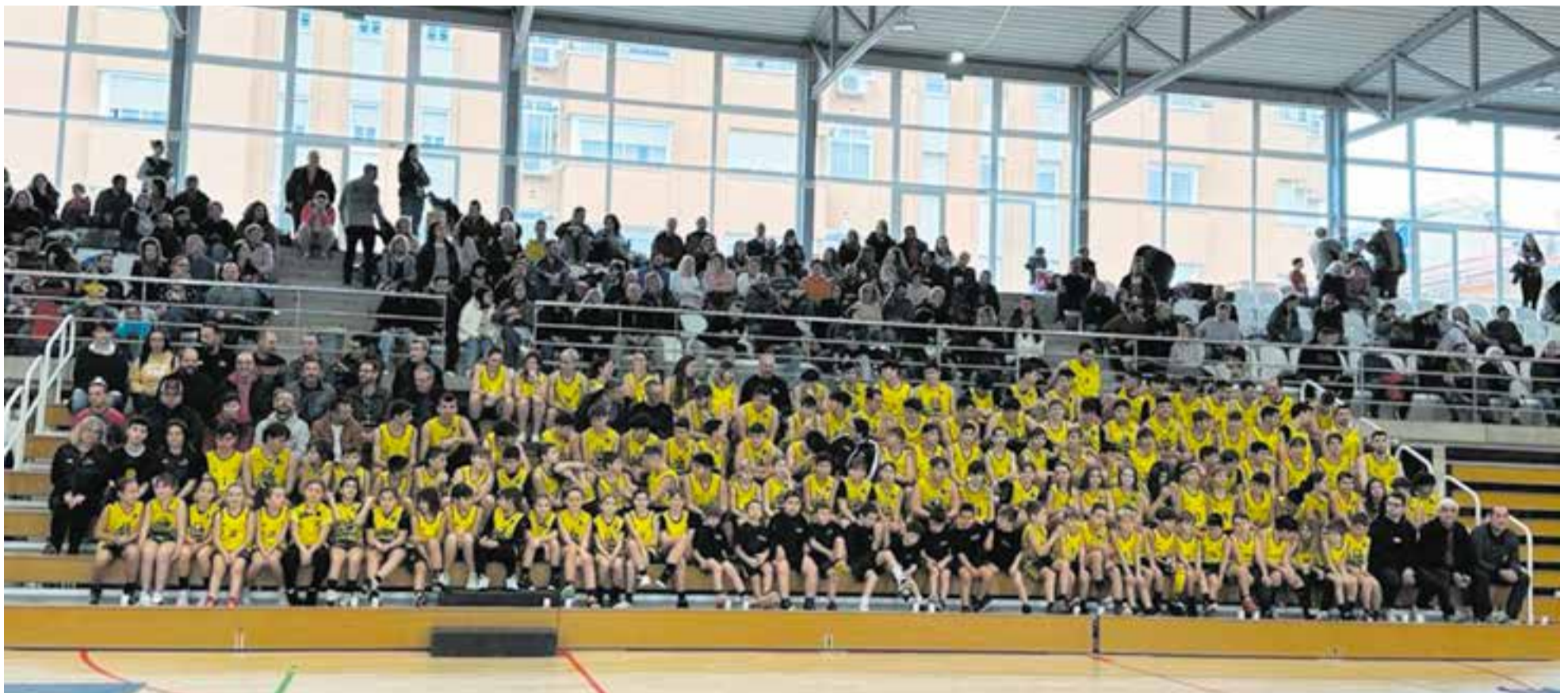
Després de desfilars, els 175 jugadors i jugadores del CB Castellar van tornar a fer la tradicional foto grupal just abans de la victòria del primer equip contra el CN Caldes.