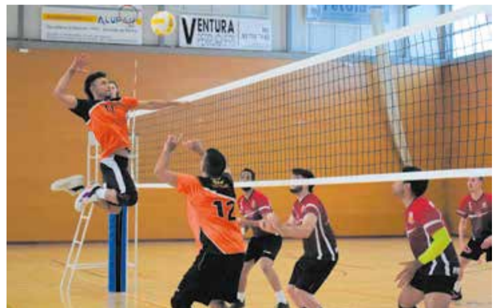
L'equip masculí encara veu factible entrar en la fase de promoció i oblidar-se del descens.

El femení de David Fernández, només un miracle podria classificar a l'equip per a la promoció, ja que en l'últim lloc de la taula i sense conèixer la victòria més enllà del tie-break, l'equip hauria de sumar tots els punts i que el Sant Cugat no sumi cap, així com que la resta tampoc passi dels 17 punts, un aspecte gairebé impossible. † || A. S. A.