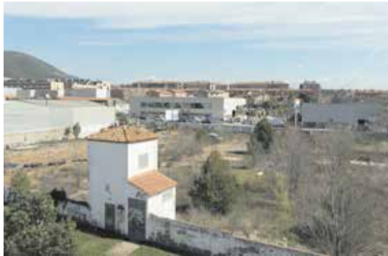
Vista aèria del solar de l'antiga Playtex.

el solar que ocupava l'antiga fàbrica Playtex, situada entre la carretera de Sabadell i la ronda de Turuguet, amb l'objectiu de destinar-lo a la construcció d'habitatge de lloguer. L'Ajuntament i l'Institut Català del Sol (INCASÒL) van acordar la construcció en aquest espai de noranta habitatges plurifamiliars per donar resposta a les necessitats d'usos residencials de la població.