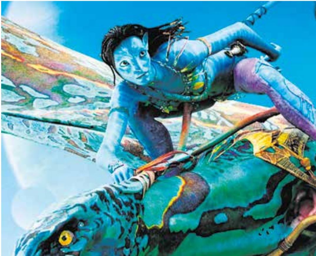
'Avatar. El sentido del agua' es podrà veure diumenge 15, precedida d'Avatar, la primera pel·lícula de la saga.

El primer llargmetratge, Una història de amor y deseo , és la història d'una relació amorosa entre dos joves estudiants universitaris, l'Ahmed, francès d'origen algerià, i la Farah, jove tunisiana plena d'energia que acaba d'arribar a la capital. El film, que és una òpera prima, va rebre una menció del jurat cineclubista al Festival REC de Tarragona de l'any 2021.