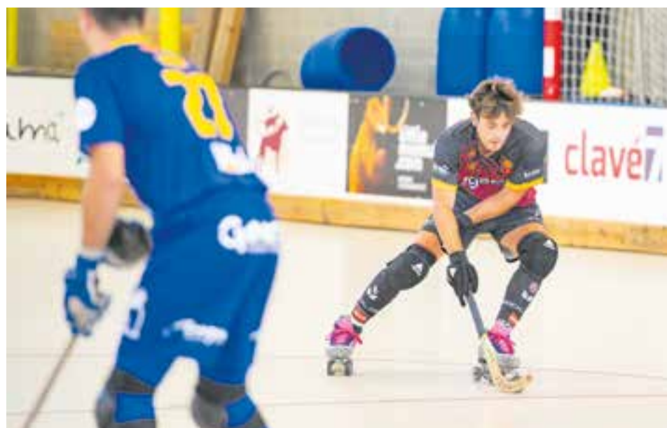
Amb la derrota del Sant Cugat ja oblidada, l'equip lluitarà de nou per ser líder. || A. SAN ANDRÉS