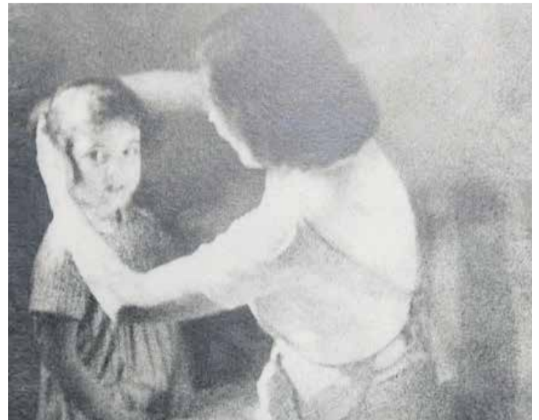
Fotografia de JC. Argilaga, que s'exposa a la mostra 'Bromolis'. || CEDIDA

La seva obra es pot considerar una font històrica d'aspectes etnològics de la ciutat de Terrassa i se'l