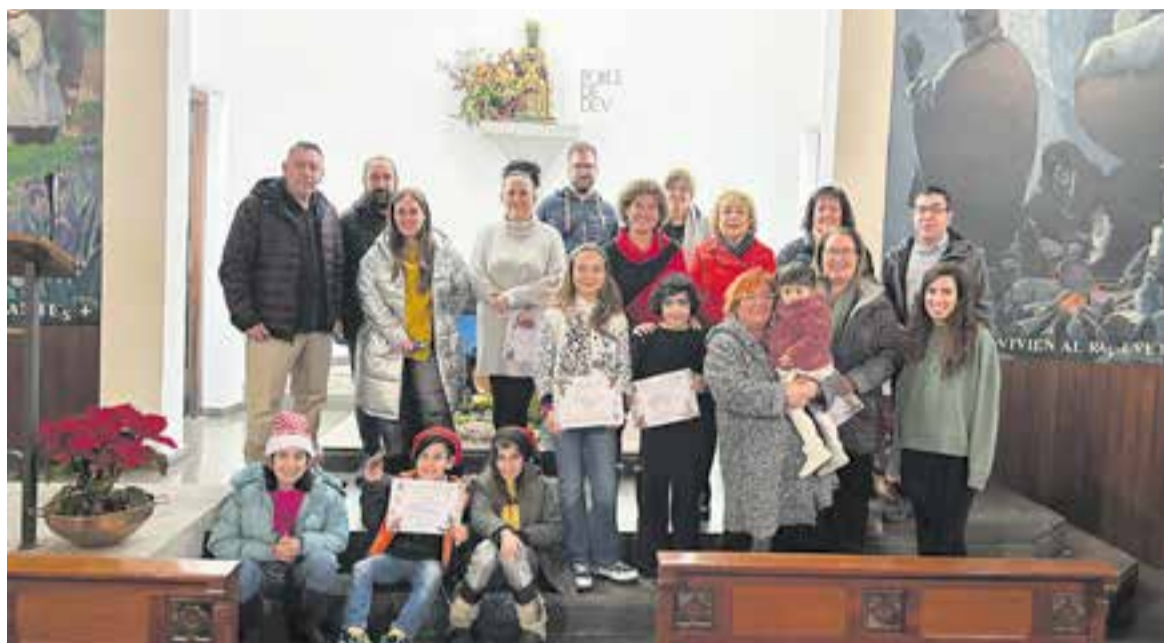
Guardonats al 78è Concurs de Pessebres del Grup Pessebrista de Castellar, a la Capella de Montserrat. || PESSEBRES CASTELLAR

Diumenge, 8 de gener, es va fer entrega dels diplomes i obsequis als participants d'aquest Nadal 2022