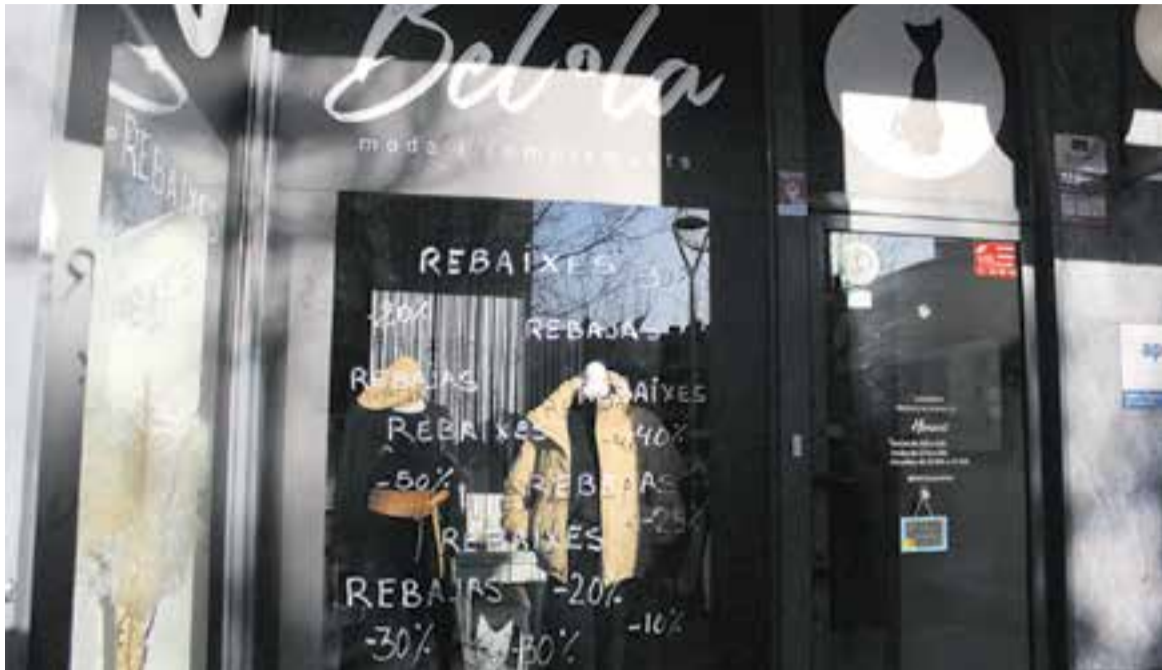
L'aparador de rebaixes de la botiga Bel-la Moda al carrer Sala Boadella.