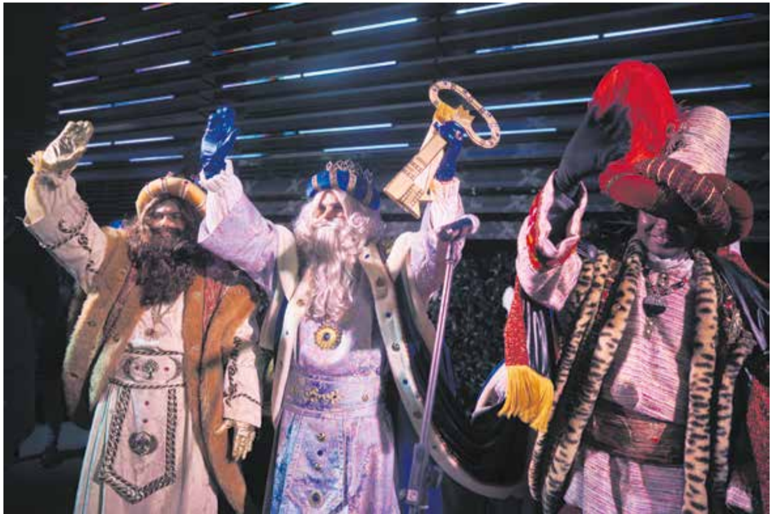
Ses Majestats saludant els castellarencs i castellarenques a la plaça d'El Mirador després de rebre les claus que obren totes les portes de la vila.

Durant la cavalcada els tres reis van explicar a L'Actual que el seu vestuari s'havia personalitzat per a l'ocasió amb motius daurats, alguna joia i bufandes per resistir les baixes temperatures. A més, van agrair la bona rebuda per part de la ciutadania tant a la cavalcada com al campament reial. També van detallar que abans de treballar de valent durant la nit de Reis soparien bròcoli, peix i alguna fruita, perquè esperaven que a les llars de Castellar els deixessin "dolços, torrons i galetes de xocolata" , va dir Gaspar. Els petits ambaixadors que van acompanyar Ses Majestats a les carrosses van esforçar-se per omplir de somriures i de confeti els carrers de la vila amb professionalitat i també amb molta il·lusió, i amb la responsabilitat de ser els ajudants de Melcior, Gaspar i Baltasar en un moment tan important. Els caramels, enguany, es van reservar per a la carrossa de les