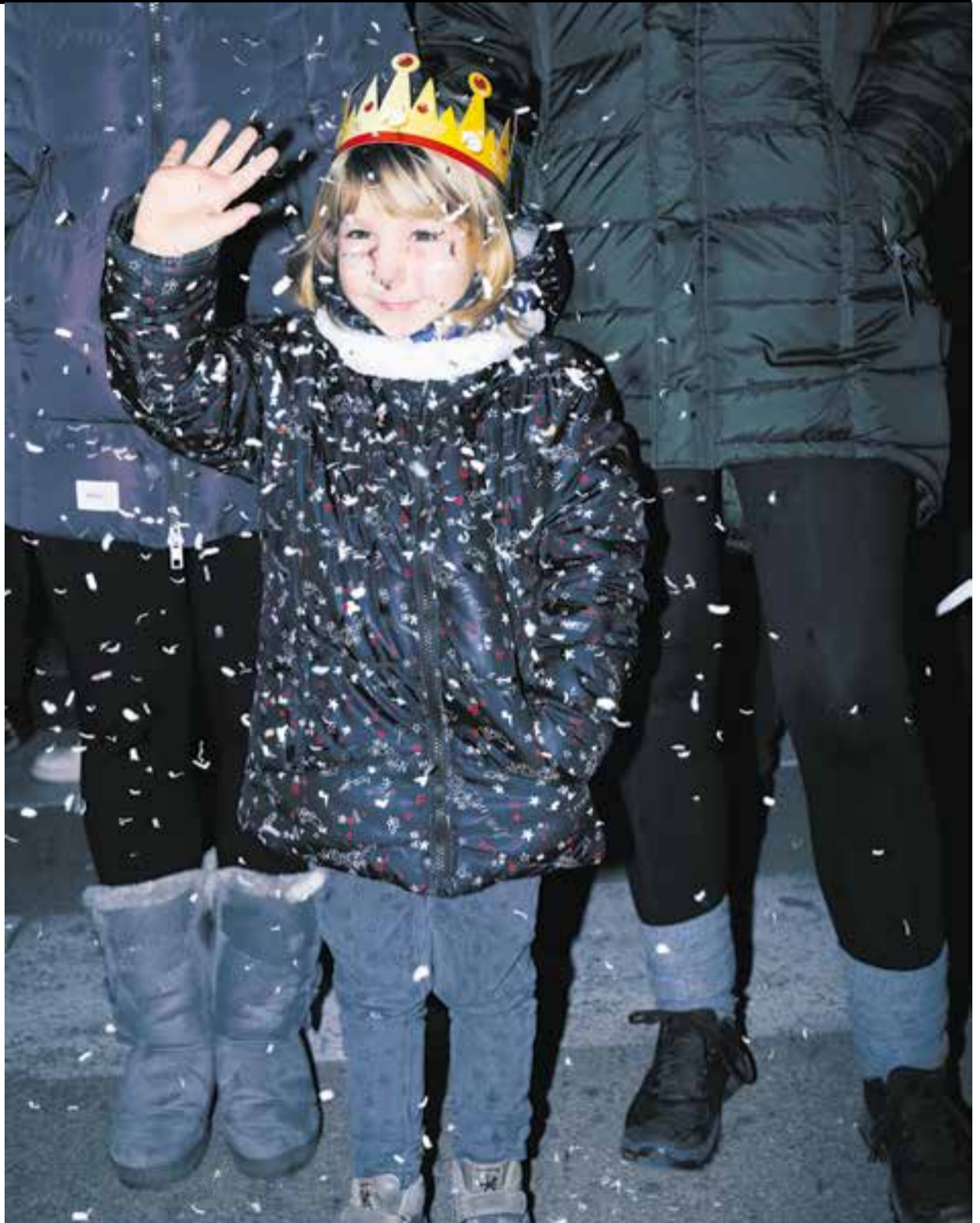
ELS REIS DE CASTELLAR || Una cavalcada multitudinària va emocionar i va fer vibrar petits i grans dijous passat durant la nit de Reis. A la imatge, un infant saluda els Reis al seu pas pels carrers de la vila. || Q. PASCUAL ACTUALITAT | P 02