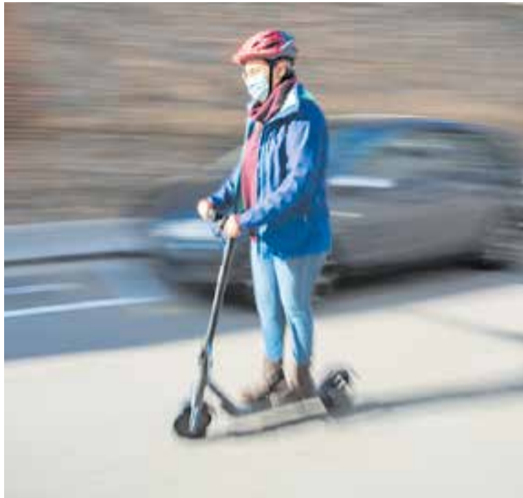
Una dona circulant amb patinet elèctric.

Així, l'ordenança indica que els VMP, és a dir, tots aquells que són monoplaça d'una o més rodes propulsats per un motor elèctric (com ara patinets elèctrics, segway, hoverboards o monocicles elèctrics) i que poden tenir una velocitat d'entre 6 i 25 km/h, han de circular obligatòriament per la calçada, com la resta de vehicles, sense superar els 25 km/h. Per tant, no poden anar per la vorera ni pels passos de vianants. A més, la normativa també indica que, en cas que circulin per espais compartits amb els vianants, com ara parcs públics, àrees de vianants o carrers de plataforma única, ho hauran de fer