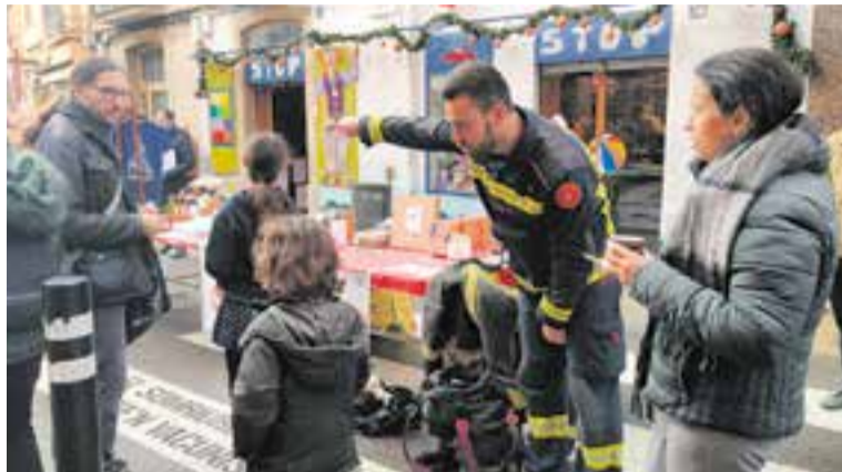
Els bombers van participar en la festa de Nadal de l'Associació del Centre.

La pluja no va poder amb les ganes dels veïns del carrer Major de reunir-se. Dissabte al matí, l'Associació del Centre va organitzar-hi un bon grapat d'activitats per a celebrar la Festa de Nadal, que també es va estendre a la plaça Calissó. Hi van col·laborar diversos comerços i entitats en una jornada que va omplir l'espai de nens i ambient familiar.