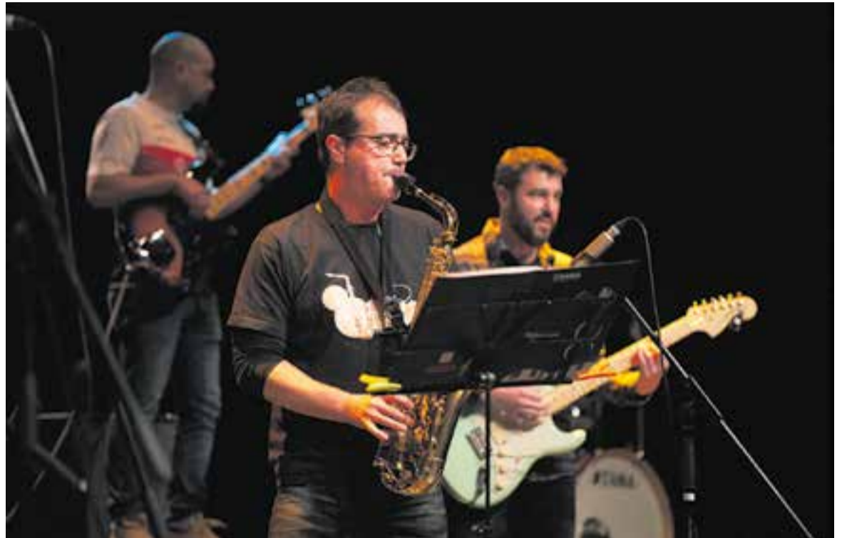
El combo musical Canvi de Plans actuant al concert benèfic de Càritas de dissabte passat.

El repertori, que va combinar estils i gèneres, va propiciar que fos una vetllada entretinguda i diversa. Es-