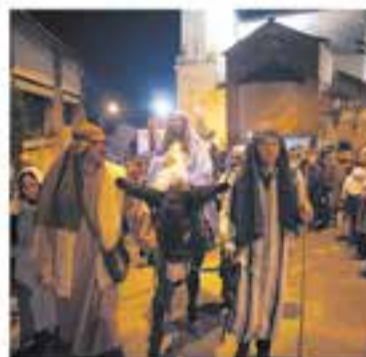
Pessebre Vivent de Sant Feliu