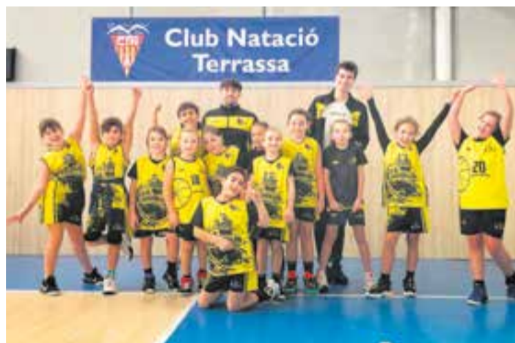
El premini femení s'ha proclamat campió de la primera fase de la Lliga.