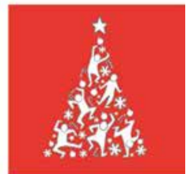
Banc de Sang i Teixits