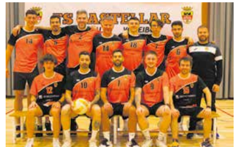
L'equip masculí es jugarà la fase en l'última jornada al gener. || CEDIDA

Pel que fa al femení, les de David Fernández van perdre per 3-1 (25-10/31-29/17-25/25-20) amb un rival directe com el Vòlei Molins, el seu predecessor a la taula, empatat a punts, i no va aprofitar la possibilitat de poder deixar el fanalet vermell de la categoria. ➔ || A. SAN ANDRÉS