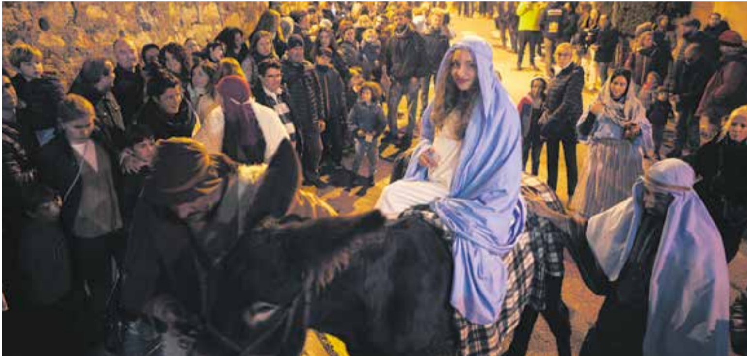
L'arribada de la mare de Déu amb mula a l'entrada del Pessebre Vivent, a la plaça del Doctor Puig.

L'escenificació a Sant Feliu del Racó va comptar, el 18 de desembre, amb 720 visitants