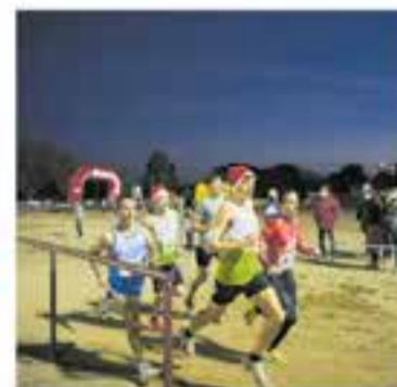
ESCOAC i CAC