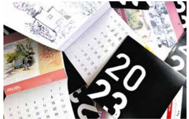
Els calendaris 2023 es poden trobar a dependències municipals.