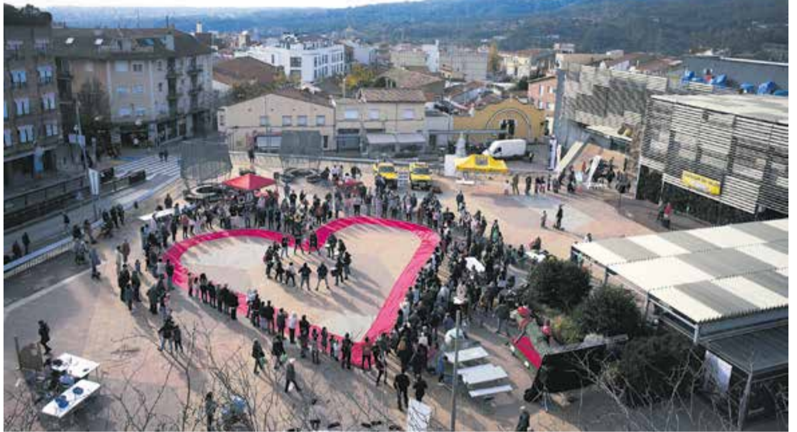
Els membres de les entitats col·laboradores de La Marató van formar un cor gegant al mig de la plaça amb l'acompanyament d'Els Atabalats.

A Catalunya, diumenge es va aconseguir recaptar 8.034.807 euros, segons la darrera actualització del programa solidari de TV3. Els equips de recerca que treballen en salut cardiovascular podran optar als fons recaptats a través de la convocatòria d'ajudes que la Fundació La Marató de TV3