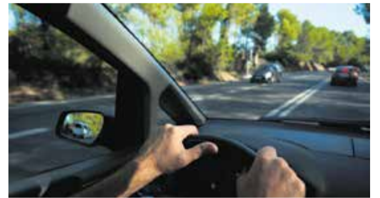
Una imatge d'arxiu de la carretera B-124.

L'acord entre el Govern i comuns incorpora millores en matèries com habitatge, mobilitat, energia, atenció primària i fiscalitat. Aquest pacte fixa avenços importants a nivell social i representa un ferm compromís contra el canvi climàtic. Tant Govern com comuns acorden un Pla de Xoc Social de 555 milions d'euros per pal·liar els efectes de la crisi energètica i la inflació. Per aprovar els comptes, el govern encara necessita 27 vots més a favor, per la qual cosa encara s'ha de buscar el suport dels dos altres grans grups del Parlament, el PSC o Junts. || REDACCIÓ