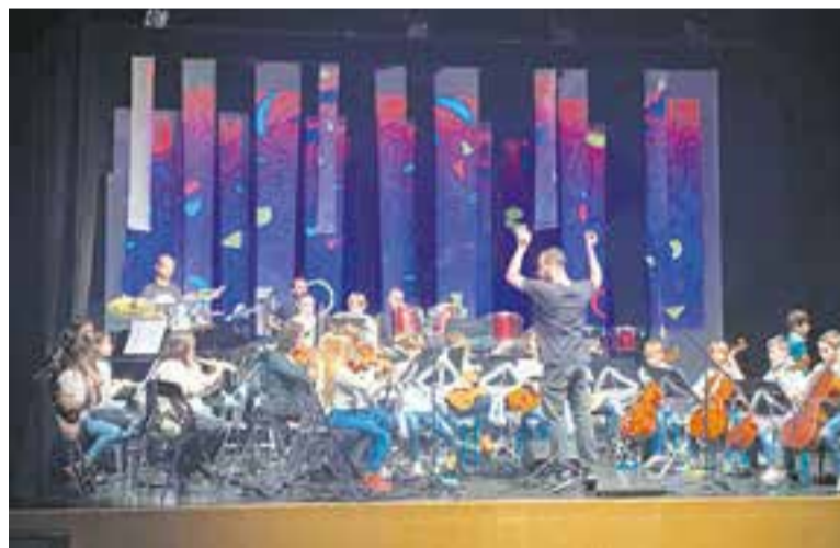
Moment del concert d'Artcàdia a l'Auditori Municipal, dissabte 17.

Dissabte, 17 de desembre, Acció Musical Castellar - Escola de Música Artcàdia van oferir un concert a l'Auditori Municipal amb els diversos grups que formen part de l'escola: l'Orquestra Infantil, el cor de Petits Músics, l'Orquestra i el Cor Juvenil i els grups de percussió. Enguany, van titular el concert Musiquem somnis per Nadal i van lligar la història amb un món imaginari on s'intercalaven els temes musicals, alguns nadalencs, d'altres no. Prop d'un centenar de músics van pujar a l'escenari per celebrar Nadal amb el públic. ➔