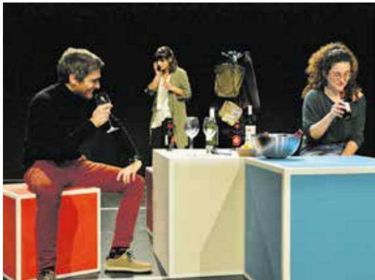
Moment de l'obra 'Kalumba', de La Gàrgola Produccions Teatral.

La Sala de Petit Format va acollir l'obra de La Gàrgola Produccions