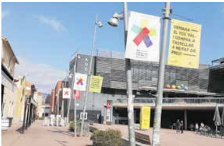
Banderoles amb la imatge de la campanya 'Més comerç que mai'.

A la tarda, amb la foscor, el fred i l'encesa de llums, l'esperit nadalenc va encomanar-se per l'eix central. Malauradament, els compradors van quedar-se a casa per veure la celebració de la final del Mundial de Qatar i això va fer la competència a la Fira de Nadal. +