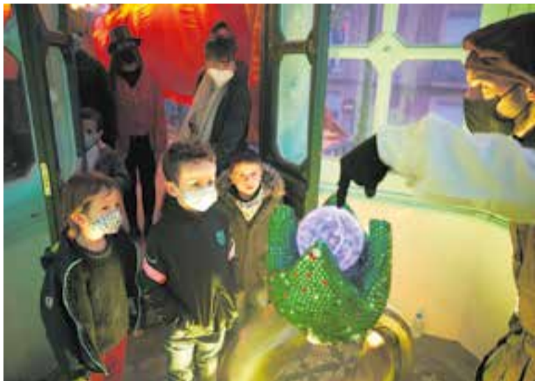
Els infants descobriran al campament l'anell màgic dels Reis d'Orient. || Q. PASCUAL

Les cartes a les Ambaixadores es podran lliurar els dies 1 i 2 de gener