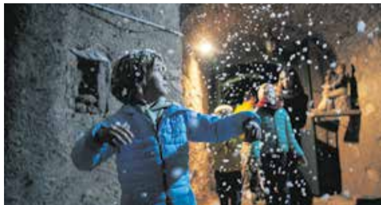
Un infant passejant pels carrers de Sant Feliu durant el Pessebre Vivent.

No hi va faltar tampoc l'escena més moderna dels dimonis, així com la incorporació els darrers anys de les peixateres i els pescadors. Cal destacar que els visitants van lloar el Pessebre Vivent d'enguany, ja que consideren que any rere any se supera. A la plaça del Doctor Puig, a la sortida, segueix instal·lat l'Arbre dels Desitjos perquè tothom qui ho vulgui pugui deixar-hi la seva empremta en forma de postal. Ja hi és des del dia 11 de desembre, quan es va fer l'encesa de llums. Aquesta activitat es va incloure en els actes solidaris per La Marató de TV3. També, a la plaça de Doctor Puig de Sant Feliu, s'hi va instal·lar el carter