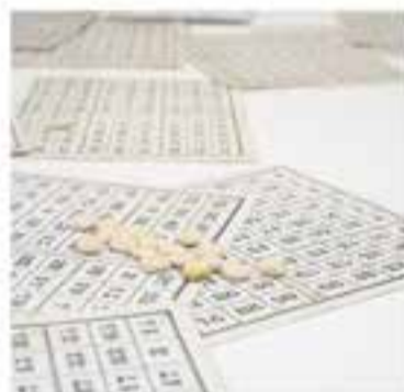
Castellers de Castellar

+ INFO: lalcavot.teatre@gmail.com, tel. 616439985