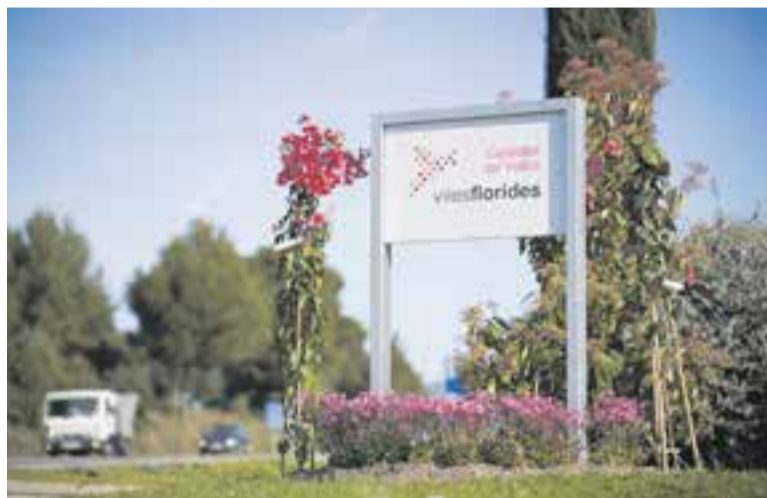
Una imatge d'arxiu del cartell que acredita Castellar com a membre de Viles Florides. || Q.P.

En aquesta ampliació, el servei de recollida porta a porta comercial inclou l'Illa del Centre i els trams de carrers adjacents. †