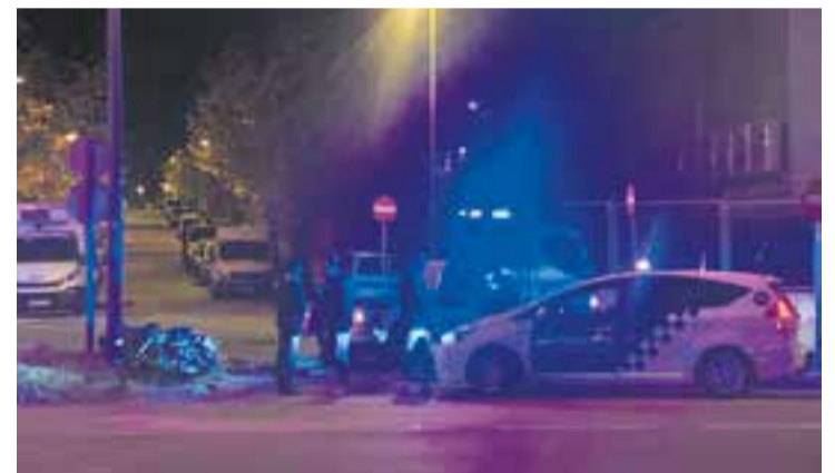
Restes de l'accident que es va produir a la B-124, dilluns al vespre.