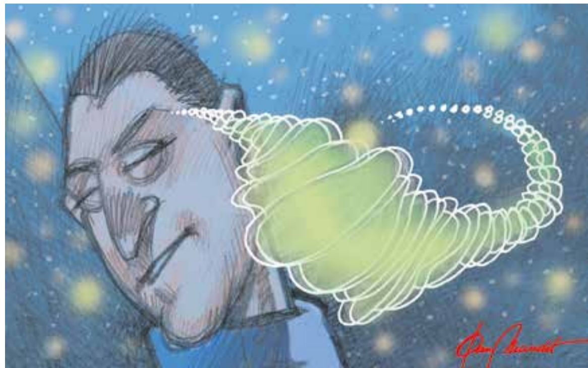
© NGC 2500. || JOAN MUNDET

viuen uns tres dies. Les úniques cèl·lules que ens acompanyen en tot el nostre cicle vital són les neurones, que no tenen relleu quan es moren. Antoine-Laurent Lavoisier (París, 1743-1794), conegut com el pare de la química, va fer famós aquell aforisme que diu: "La matèria no es crea ni es destrueix, es transforma". També d'altres menys populars com: "En una reacció química la suma de la massa dels reactius és igual a la suma de la massa dels productes" o "En una reacció química els àtoms no desapareixen, simplement s'ordenen d'una altra forma". Això ens permet dir que els àtoms de les cèl·lules