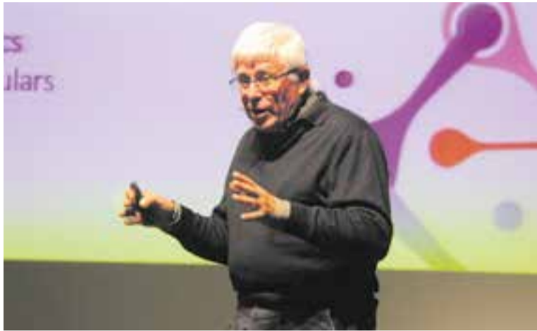
Una de les darreres imatges de Cornet, de fa nou mesos a l'Auditori.

De fet, tot just fa poc més d'un any, el castellanenc va rebre una distinció a la qualitat docent per part del Consell Social de la UB i va ser l'encarregat d'obrir el curs amb una lliçó magistral. Posteriorment, en una entrevista a L'Actual , va confessar la satisfacció tan important que li suposava la distinció "perquè és el reconeixement d'una tasca continuada de professor, molt entusiasta de la meva feina, i per tant, que t'ho reconeix, satisfà" . La seva trajectòria es va orientar en la millora constant dels