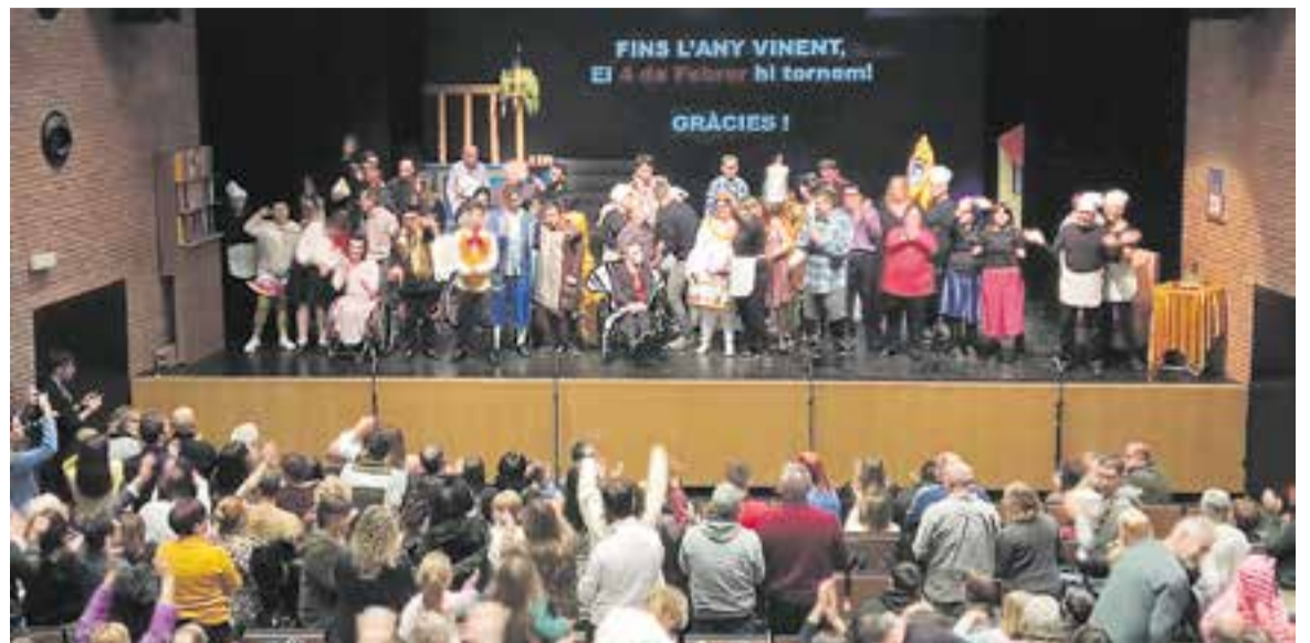
'La bella i la bèstia' del TEB va fer aixecar el públic de les butaques en el moment de la salutació dels actors i actrius.

De fet, es necessitaven 1.030.000 metres i es demanava a les persones que avansessin alguna distància, ho anotessin en metres a un aplicatiu que anava sumant la distància recorreguda. Al mercat hi havia ubicat el marca-