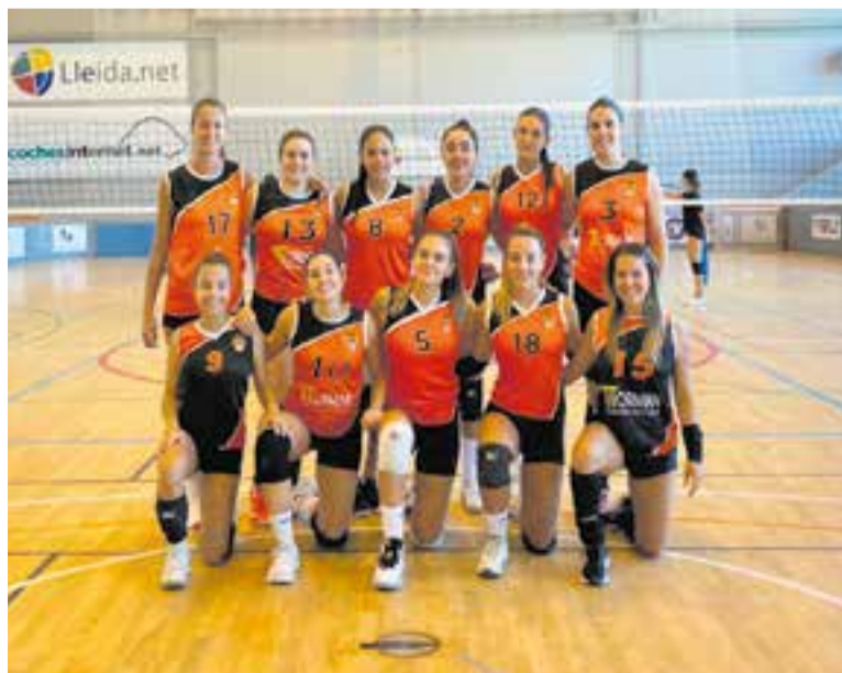
L'equip femení continua sense sumar cap victòria en nou jornades.