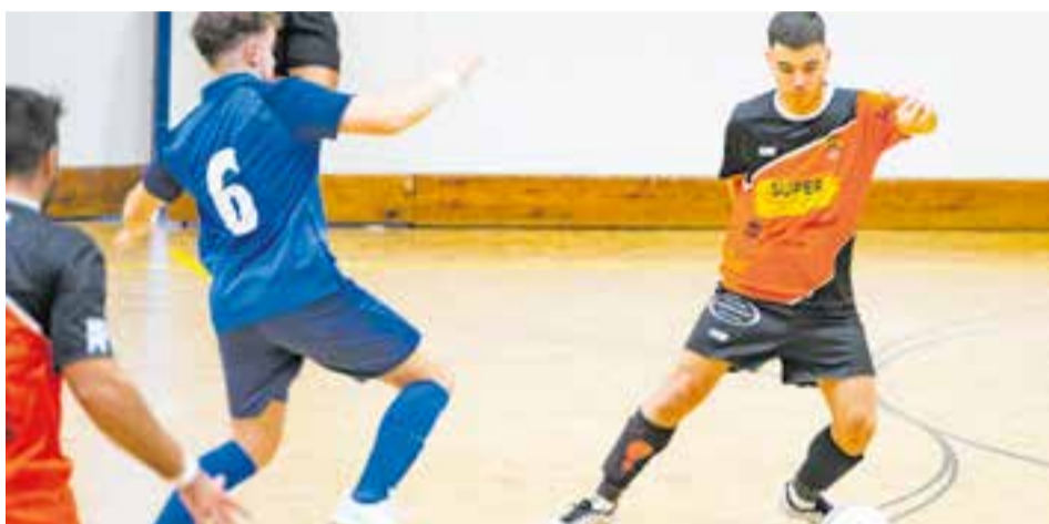
Aquesta temporada l'FS Castellar encara no coneix la victòria al Joaquim Blume. || A. SAN ANDRÉS

En una categoria en què això es paga car, el rival va ser capaç de fer quatre gols en els últims 13 minuts, per emportar-se la victòria del Joaquim Blume, on l'equip encara no ha guanyat. Aquesta derrota els condemna a caure a la penúltima posició, empatats a punts amb el Parets, antepenúltim. + || A. SAN ANDRÉS