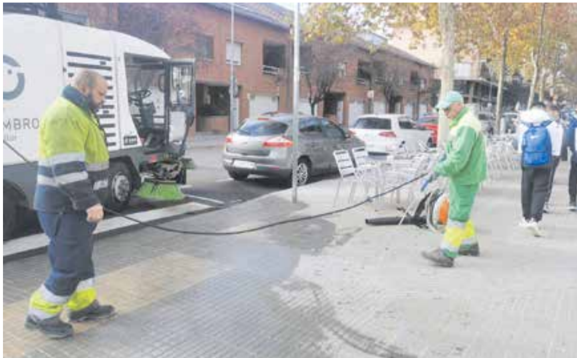
Dos operaris del servei de neteja viària al costat d'un vehicle escombradora utilitzant l'aigua per netejar.

L'equip que utilitza l'escombradora està format per un conductor i un peó. El vehicle que utilitzen és dual, ja que neteja mitjançant el sistema d'aspiració i, com a novetat, s'utilitza d'aigua freàtica no apta per al consum domèstic.