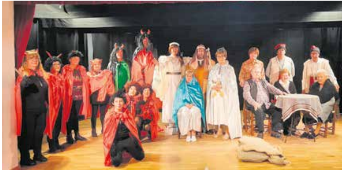
Foto de família del grup de teatre Xitxarel·lo, en un dels assajos de l'obra que oferiran els dies 16 i 23 de desembre.