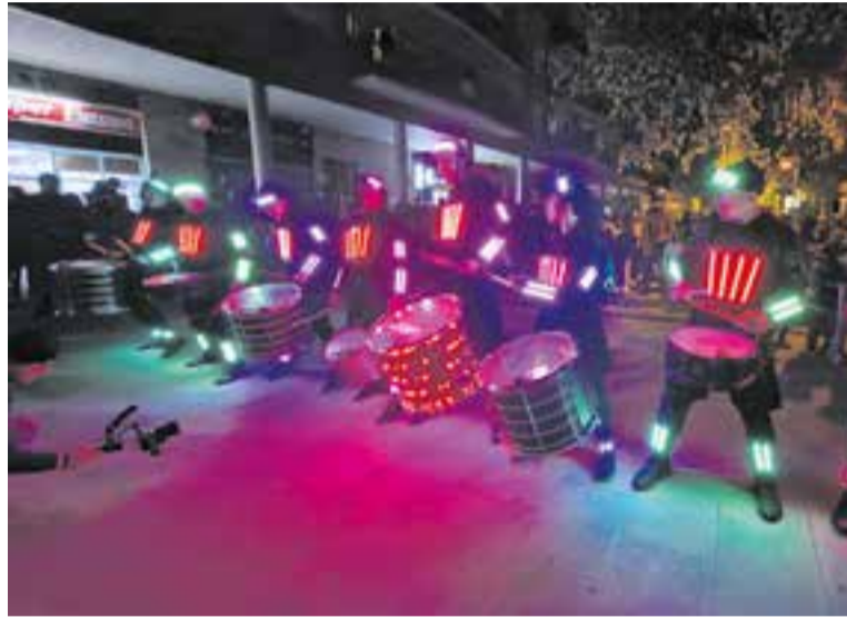
La companyia Brincaderia amb l'espectacle Perculights.