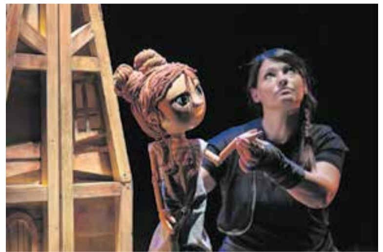
La Nur és el titella protagonista de 'La llàntia meravellosa', de Festuc Teatre. || CEDIDA

La posada en escena de Festuc Teatre és impecable, aquesta companyia fuig de la cursileria i fa una picada d'ullet a les diverses realitats del segle XXI i valors universals: l'amistat, l'amor filial, la llibertat per escollir el seu camí i ser qui vulguem ser; la descoberta del món i l'acceptació. + || M. ANTÚNEZ