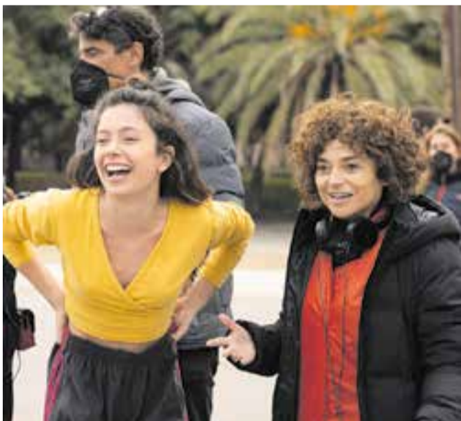
La directora castellarenca, a la dreta, amb l'actriu Anna Castillo.