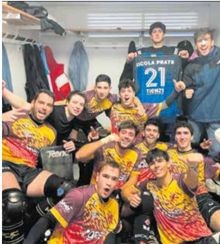
L'HC Castellar celebra al vestidor de la Garriga el 0-3 aconseguit.

Això passa dues setmanes abans -aquesta hi haurà descans- de l'enfrontament directe que pot ser decisiu per aquesta primera fase i en què els granes han de capgirar a casa l'average, després del 4-3 de la primera volta. † || A. SAN ANDRÉS