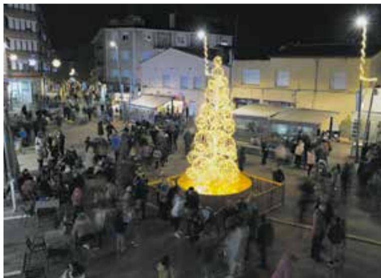
Aquest era l'aspecte de la plaça del Mercat amb l'arbre de Nadal encès.