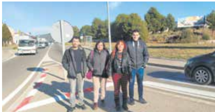
Membres de la CUP a l'entrada del municipi denunciant barreres arquitectòniques. || G.P.