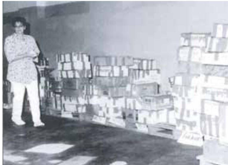
L'antiga Nau 2 va ser el centre de recollida a la Festa Major del 1995. || CASA DE LA VILA

Tot plegat va ser la gènesi de la comissió ciutadana Castellar per Bòsnia, que va tornar a dur a terme una campanya de sensibilització i d'ajuda al poble de Bòsnia el Nadal del 1995 anomenada Gas per a Bòsnia. La comissió va repartir 100 guardioles per diferents establiments per recollir diners per sufragar les despeses de subministrament de gas a Sarajevo. Es van recollir 480.000 pessetes que, sumades al saldo acumulat en el compte bancari, va elevar la xifra a 900.000 pessetes. La comissió de Castellar per Bòsnia, juntament amb el grup de treball per Bòsnia de la Lliga dels Drets dels Pobles de Sabadell, també va organitzar una recollida de cassets gravats pels joves de Castellar per crear una fonoteca a l'Euroclub de Dobrinja a Sarajevo.