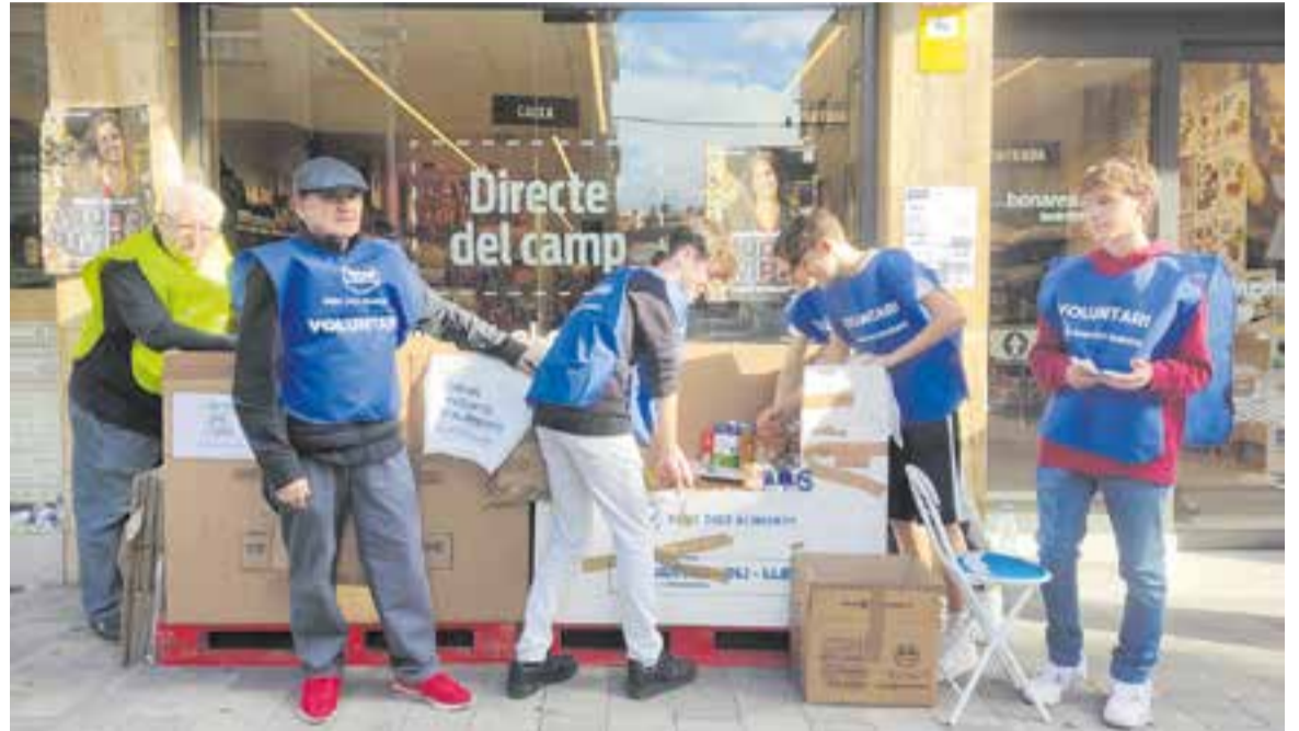
Voluntaris de Càritas Castellar i de l'escola El Casal recollint aliments a la porta d'uns dels establiments participants.

Des de Càritas Castellar també volen agrair l'ajut dels diferents col·lectius de joves que