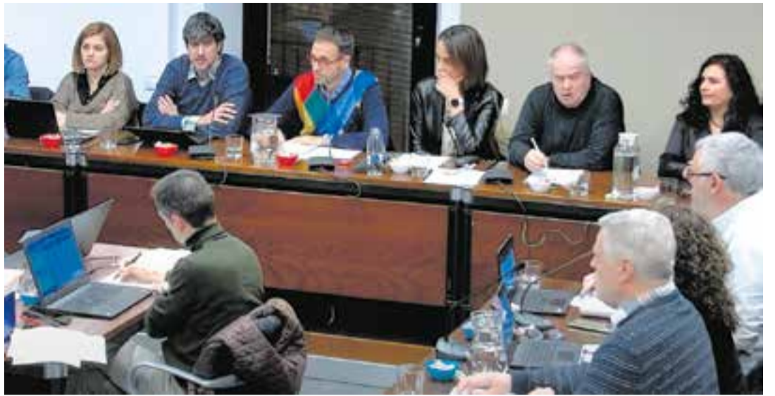
Una imatge del ple de novembre, celebrat dimarts passat a Ca l'Alberola.

L'apartat resolutiu del ple també va incloure un nou tràmit de la transformació d'usos d'unes parcel·les al carrer Itàlia que passaran d'industrials a comercials compatibles amb l'habitatge de l'entorn i que inclourà una nova rotonda a la Carretera B-124. ERC i Junts es van oposar coincidint força en el seu posicionament.