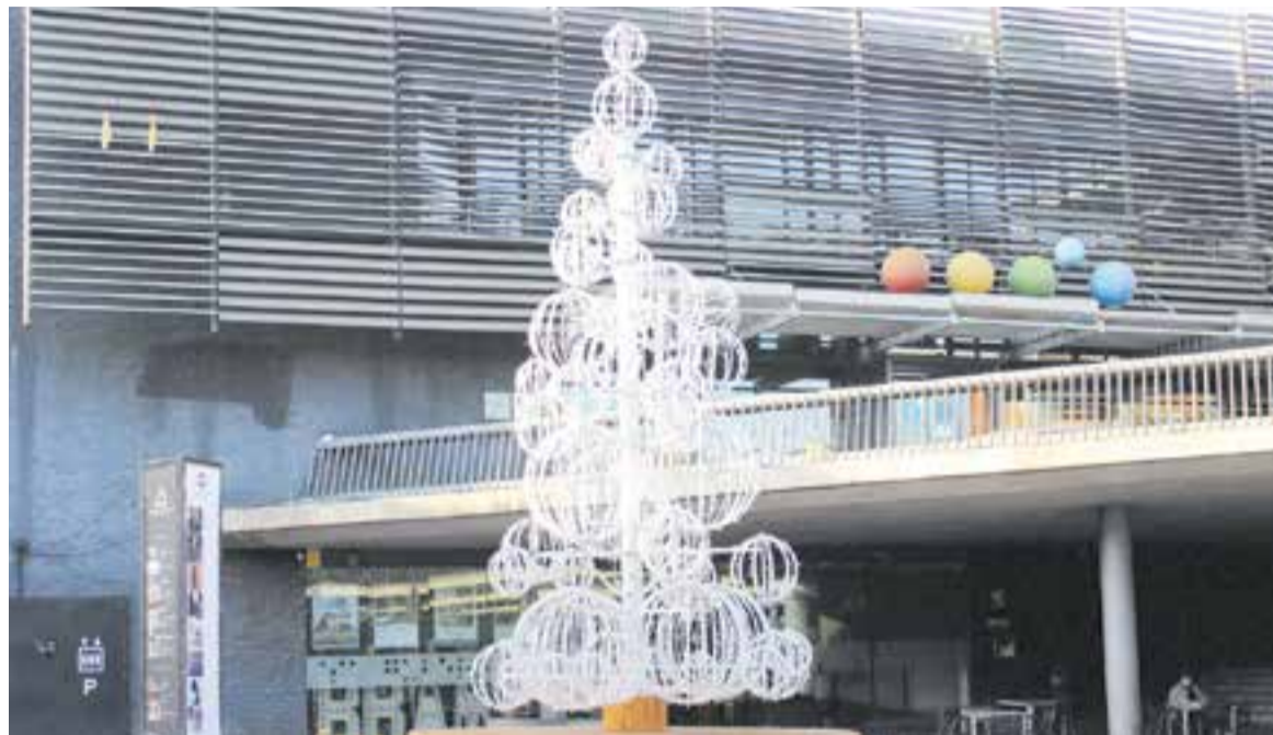
Per quart any consecutiu, la plaça d'El Mirador llueix un arbre de Nadal amb una estructura il·luminada de 5 metres d'alçària.

A la plaça d'El Mirador funcionarà des de les 18 h el Bosc de Llum, una instal·lació interactiva de llum ideada per Eloisa López i Lluís