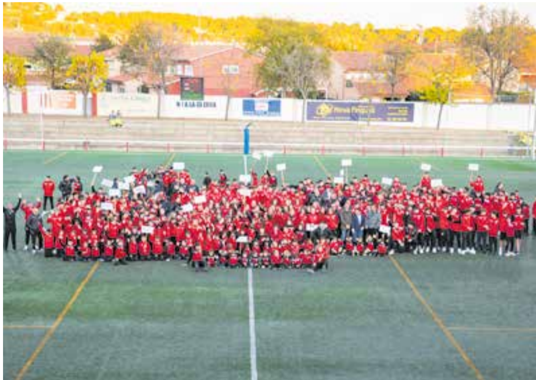
Gairebé la totalitat dels 463 futbolistes es van donar cita sobre la gespa del Joan Cortiella. || A. SAN ANDRÉS

Dissabte a la tarda va tenir de blanc-i-vermell l'estadi castellarenc, amb un espectacle inicial per part de tot el futbol femení, després del qual es va presentar l'equip inclusiu format per 13 jugadors i que jugarà sota l'auspici dels dos clubs de futbol de la vila, la Unió Esportiva i l'FS Castellar, amb la presentació en societat d'una singular samarreta on llueixen els colors dels dos clubs en les dues meitats, escuts inclosos. Dani Ruz va ser el representant del club de