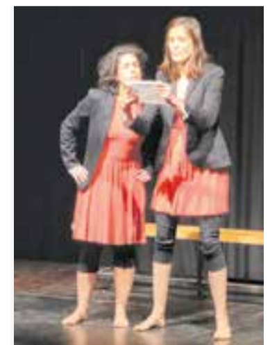
Les Kurtes, a L'Alcavot.