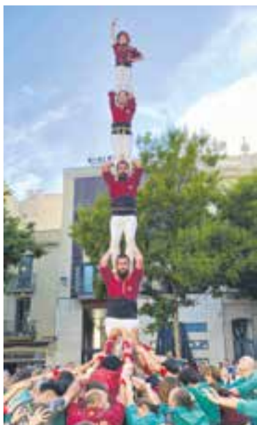
Pilar de 5 dels Capgirats. || CAPGIRATS

La colla celebra la incorporació de canalla però reconeix que la pandèmia encara cueja