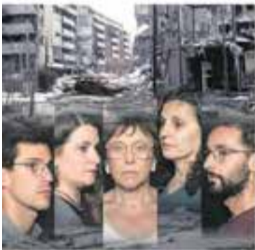
Esbart Teatral de Castellà