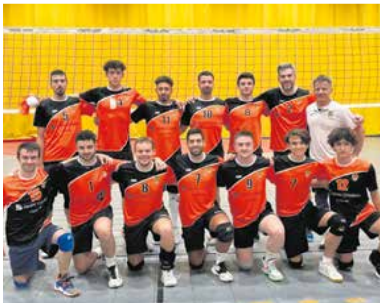
Tot i la derrota, l'equip masculí conserva la quarta plaça al campionat.