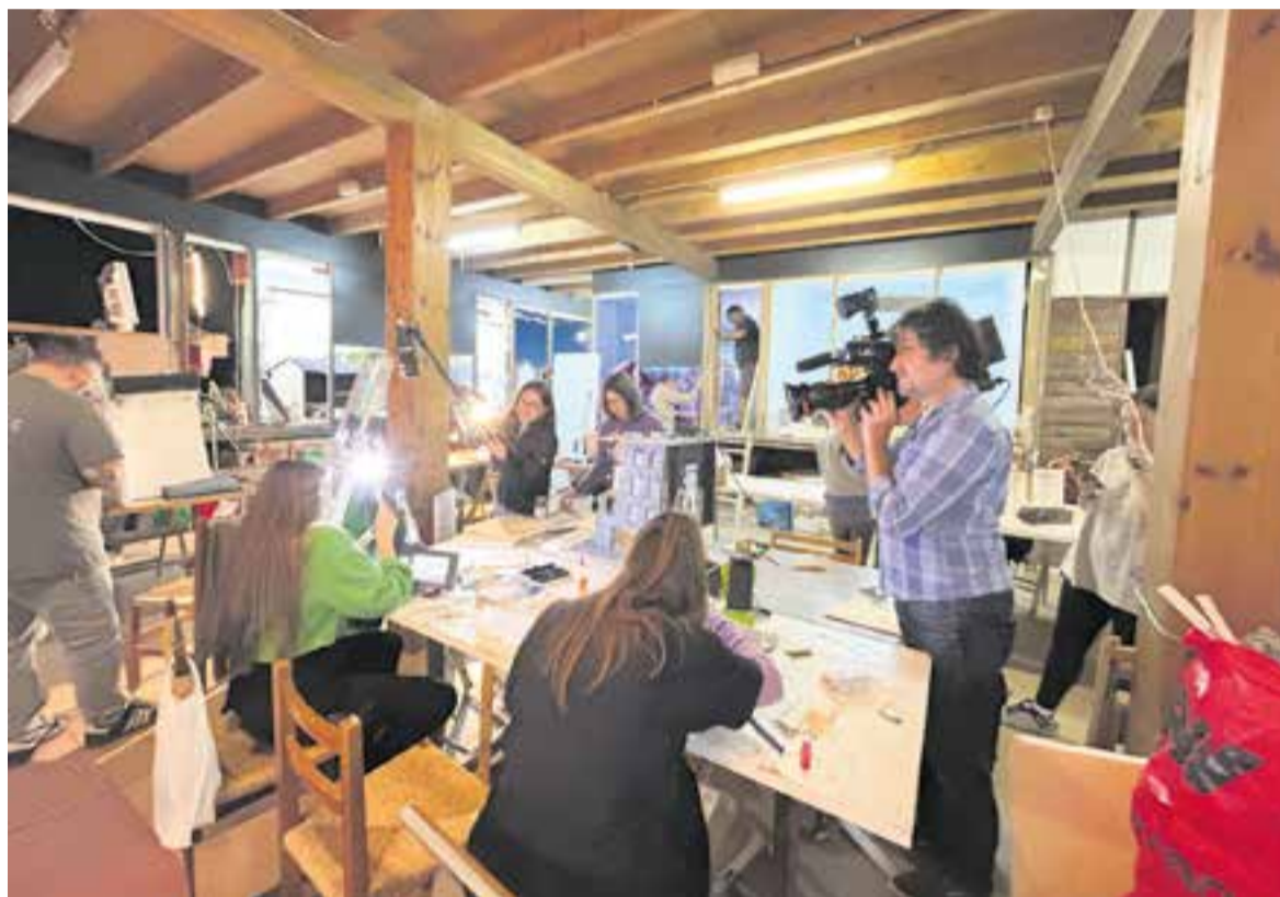
TV3 va visitar els pessebres del Grup Pessebrista de Castellar, diumenge passat, i va gravar una peça que s'emetrà properament.

Hi haurà una mostra d'invents de diverses èpoques històriques. Des del paper o la impremta, fins al wifi o