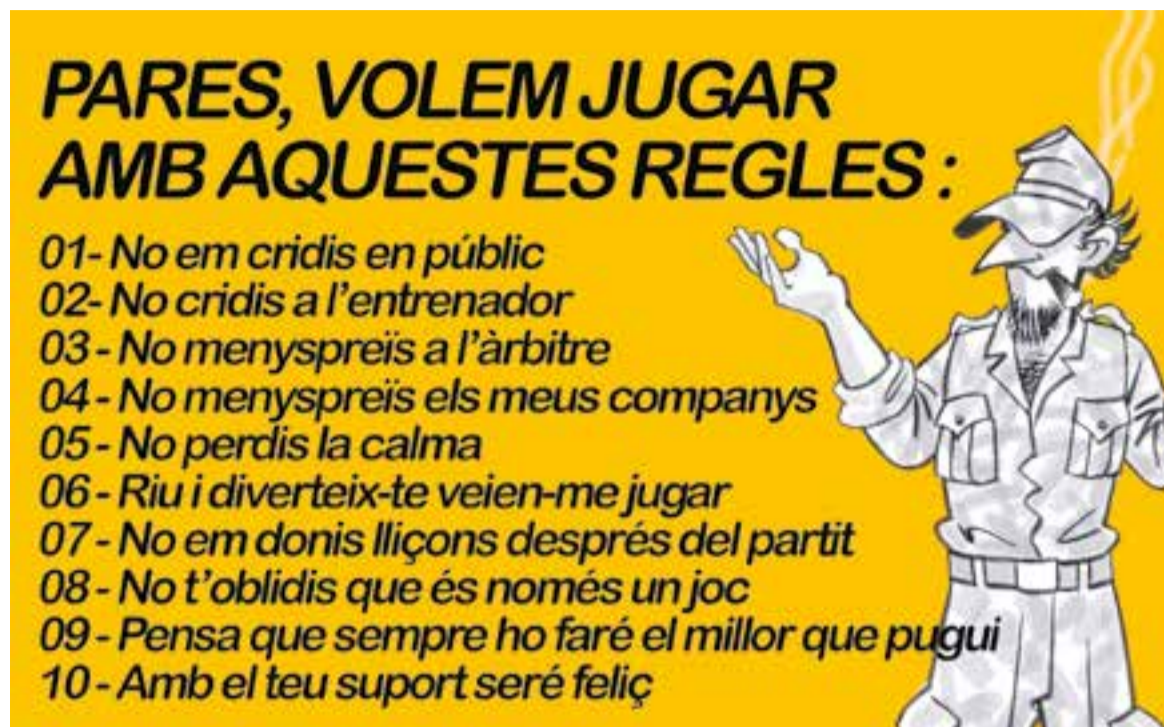
© Doncs això. || JOAN MUNDET

“Tenim la necessitat peremptòria de remarcar allò que és prou evident”