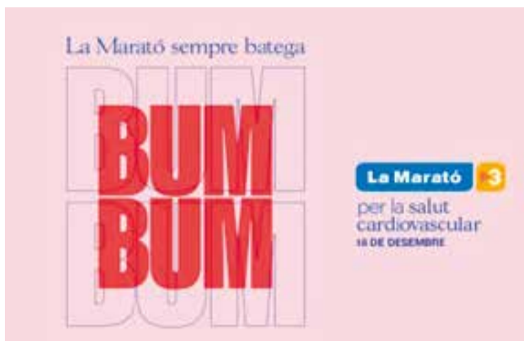
Cartell de La Marató d'enguany, dedicada a la salut cardiovascular. || CEDIDA

Associació del Centre, Ball de Bastons, Ball de Gitanes, Castellars, Centre d'Estudis-Arxiu d'Història, Centre Excursionista, Club Tennis Castellar, Esplai Xiribec, Fundació Obra Social Benèfica, Unió Esportiva Castellar, Gegants ETC, Grup Il·lusió, Grup Pessebrista, l'Hoquei Club, La banda, Majorets, Pessebre Vivent de Sant Feliu, Suma Castellar, Suport Castellar, Swing Band i Teatrer@s. + || REDACCIÓ