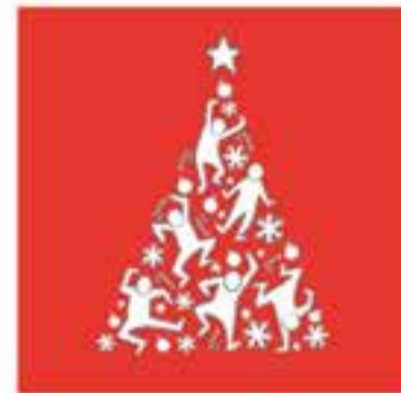
Banc de Sang i Teixits

+ INFO: a/e lalcavot.teatre@gmail.com , tel. 616439985