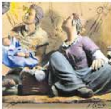
Grup Pessebrista de Castellà

+ INFO I ENTRADES: a/e esbartteatralcastellar@gmail.com