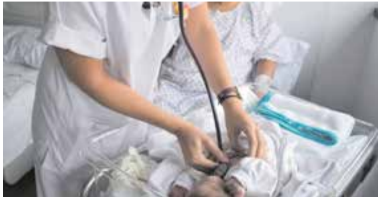
Es preveu que el pic de l'epidèmia de bronquiolitis arribi aquesta setmana || C. C.

La bronquiolitis és causada pel virus VRS i els símptomes més freqüents s'assemblen als d'un refredat: mucositat nasal, febre o febrícula i tos. “Pot evolucionar a dificultat respiratòria si hi ha secreció que obstrueix els bronquióls. El nadó