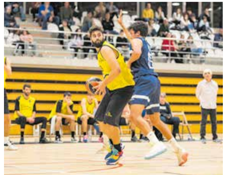
El CB Castellar es complica la vida, només ha sumat una victòria en la temporada. || A.S.A.

van fer un triple per quart i no van tenir opció de reacció amb la seva millor arma. En el tercer, el parcial de 19-13 va deixar pràcticament sentenciat el partit, que va iniciar els últims 10 minuts amb 67-44 al lluminós. No hi va haver reacció en l'última part i es va encaixar la derrota més dolorosa de la temporada. Marc Figueras, amb 10 punts, va ser el màxim anotador per als castellarens. La segona victòria consecutiva del Mollerussa contra el Vilatorrada (62-59) els ha fet caure al penúltim lloc de la taula, una posició, però, que encara pot empitjorar si el cuer, el Bàsquet Molins, guanya algun dels dos partits que té pendents contra el Mollerussa i l'Espanyol. † || A. SAN ANDRÉS