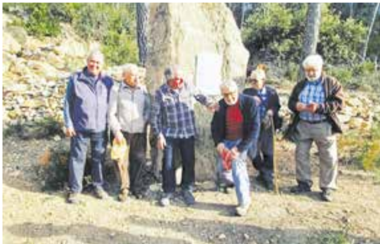
Membres del Grup de la Pedra Seca del CEC, guies de l'itinerari. || M.A.

El Centre d'Estudis Castellar, amb la col·laboració del Centre Excursionista, van fer un itinerari i una xerrada centrats en la pedra seca