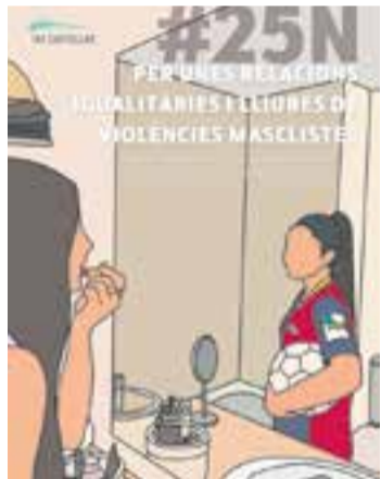
Cartell de l'exposició de l'INS Castellar.

A l'Institut Puig de la Creu es llegirà un manifest i es farà un minut de silenci al pati a partir de les 12 del migdia. Prèviament, els alumnes treballaran a classe un mural i escriuran uns lemes relatius a la violència masclista. ✦ || REDACCIÓ