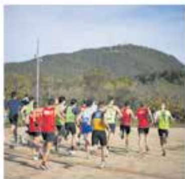
Club Atlètic Castellà

+ INFO: a/e laalcavot.teatre@gmail.com, tel. 616439985