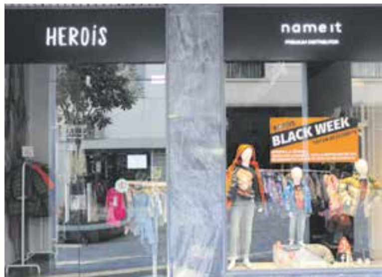
L'aparador de la botiga Herois amb les ofertes en descompte.