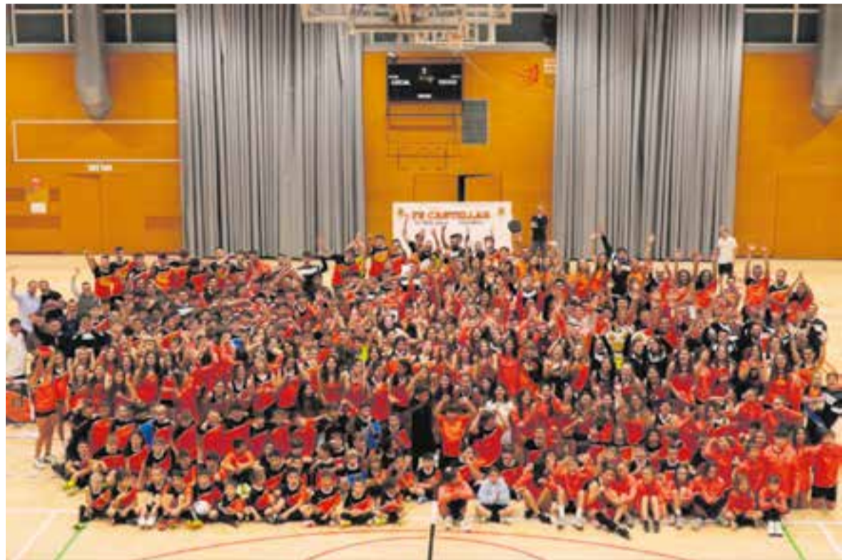
La foto de germanor de tots els esportistes que van assistir a la presentació de l'FS Castellar.