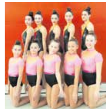
Les integrants del Clau de Sol.

El Clau de Sol va tenir un bon paper en el Campionat de Catalunya de Conjunts de Tardor a Santa Coloma de Farners. En categoria infantil 5-5 cèrcols, l'equip va assolir la quarta posició amb 18,7 de nota, una competició que va guanyar el CR Viladecans (20,3), que va sumar el mateix lloc en infantil 5 - mans lliures amb 19,8, en què es va imposar el CGR Cerdanyola (22,25). En júnior 6-3 pilotes, 4 maces, l'equip es va quedar a les portes de la victòria amb 20,2 de nota, a només 0,45 de les guanyadores del CR Gavà. + || REDACCIÓ