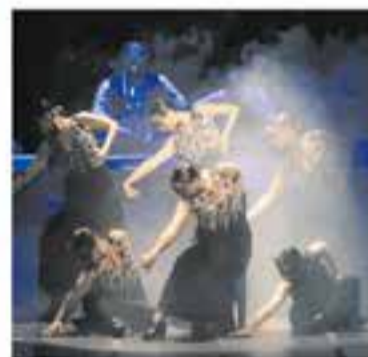
Casa de Andalusia de Castellà

+ INFO I INSCRIPCIONS: a/e cacastellar@gmail.com, clubatleticcastellar.cat