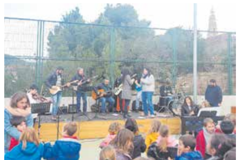
Els familiars i tot l'alumnat canten plegats la cançó de l'escola. || C. D.

La cloenda del Dia de la Música es va fer a la tarda a la pista de bàsquet de l'escola. Els familiars van tocar un tema de The Beatles en comú i després tots plegats, amb música en directe, van cantar la cançó de l'escola. “Han assajat molt poc junts, però ha quedat genial. Crec que d'aquí podria sortir alguna cosa. Igual que hi ha un grup de famílies teatreres, podria haver-hi un grup de música”, va dir rient, la directora. + || CRISTINA DOMENE