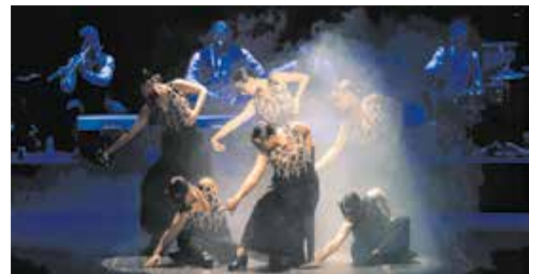
Moment de l'espectacle 'Luxúria', que es podrà veure a l'Auditori.