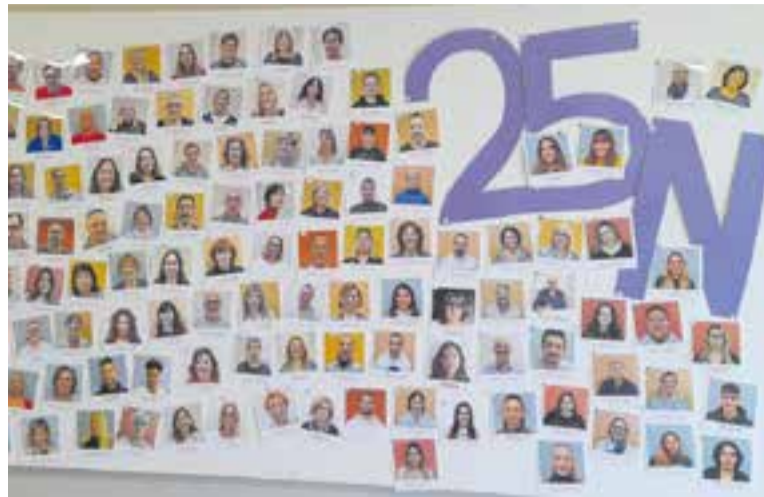
L'Escola d'Adults ha preparat la mostra "Construïm l'exposició Només sí és sí".

Avui, 25N, les activitats s'han traslladat al carrer. S'han instal·lat uns estands informatius al carrer de Sala Boadella, en què, d'una banda, es repartiran bosses amb el lema de