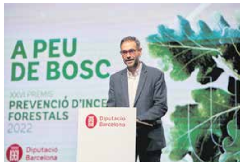
L'alcalde de Castellar va obrir l'acte com a amfitrion dels premis als ADF.

Satisfets i agraits, però sobretot, motivats.