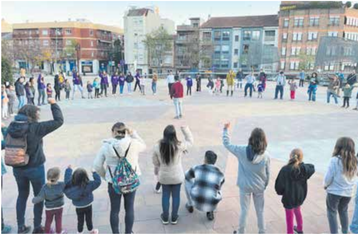
Els esplais Xiribec i Sargantana organitzant una activitat conjunta a la plaça d'El Mirador.