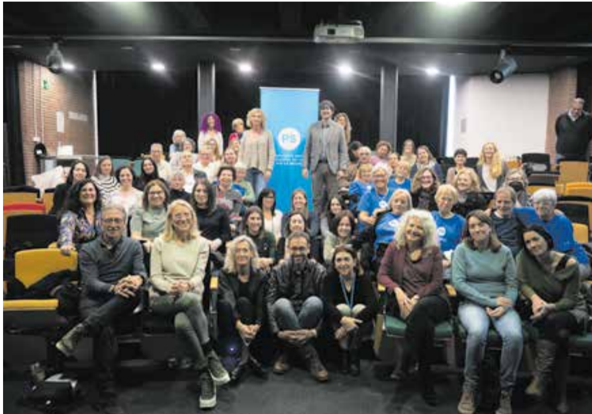
Els diferents prescriptors, usuaris i participants del projecte de prescripció social després de celebrar-se la jornada.

La trobada va servir per posar en valor un projecte que compta amb un catàleg amb una trentena de propostes lúdiques, socials i culturals que els professionals sociosanitaris recepten per promoure hàbits saludables, prevenir malalties i millorar les condicions de vida de la ciutadania. Entre setembre del 2021 i agost