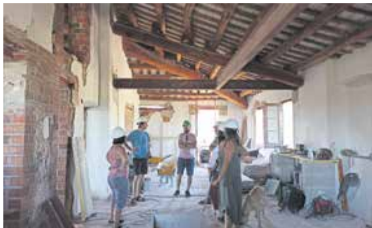
Les obres a la masia de Can Carner van començar al mes de maig.

La recerca se centra en famílies de menys de 40 anys i amb fills