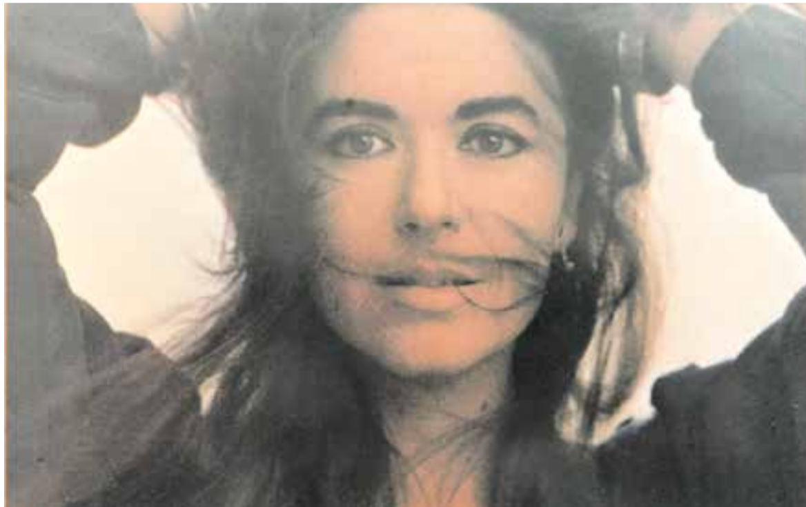
Foto de Toni Catany per a la contraportada del disc 'Anells d'Aigua' (1985). || L'ACTUAL

La simbologia, de la qual es val tan bé aquesta cantant per musicar la profunditat de sentiments, l'extreu en aquells primers discos d'un imaginari popular balear i de cançons de pagesia. D'una tradició d'elements mediterranis que s'apropia per fer-la contemporània –i moderna– unint així en el seu primer disc Maria del Mar Bonet (1970), fet amb el segell Con-cèntric, aquesta dualitat que ja hi és en la mística del doble retrat de la portada. A "Fora d'es sembrat" personifica solemnement en la lluna un avenir tràgic i solitari, intimida cantant a la fúria amorosa a "Cançó d'es segar", amb "Jota marinera" fa ballar paraules de terra, mar i aire per descriure amb enginy un sentiment amorós o fascina l'encadenament de