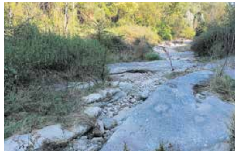
El riu Ripoll sec al seu pas per Les Arenes, després de l'estiu passat.

Fins ara, segons les dades de l'estació meteorològica de Cal Botafoc, la pluja acumulada durant el 2022 és de prop de 370 l/m 2 . El 2021, juntament amb el 2015, han estat els més secs dels últims 30 anys, amb només 394 l/m 2 i 387 l/m 2 de pluja acumulada, respectivament, molt per sota de la mitjana anual de 650 litres. El 2015 va ser el primer any, segons les dades de l'estació, en què Castellar no va arribar als 400 l/m 2 . "Aquests tres registres per sota del 400 l/m 2 es concentren en aquests últims anys, però amb un episodi de pluja intensa la situació podria canviar. Ara bé, quan ens apropem a l'hivern la pluja és menys probable, però de vegades passa com