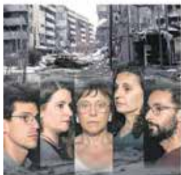
Esbart Teatral de Castellà