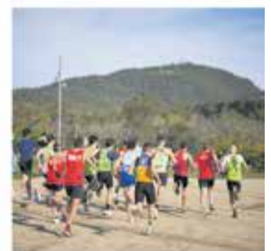
Club Atlètic Castellar

+ INFO I ENTRADES: a/e esbartteatralcastellar@gmail.com