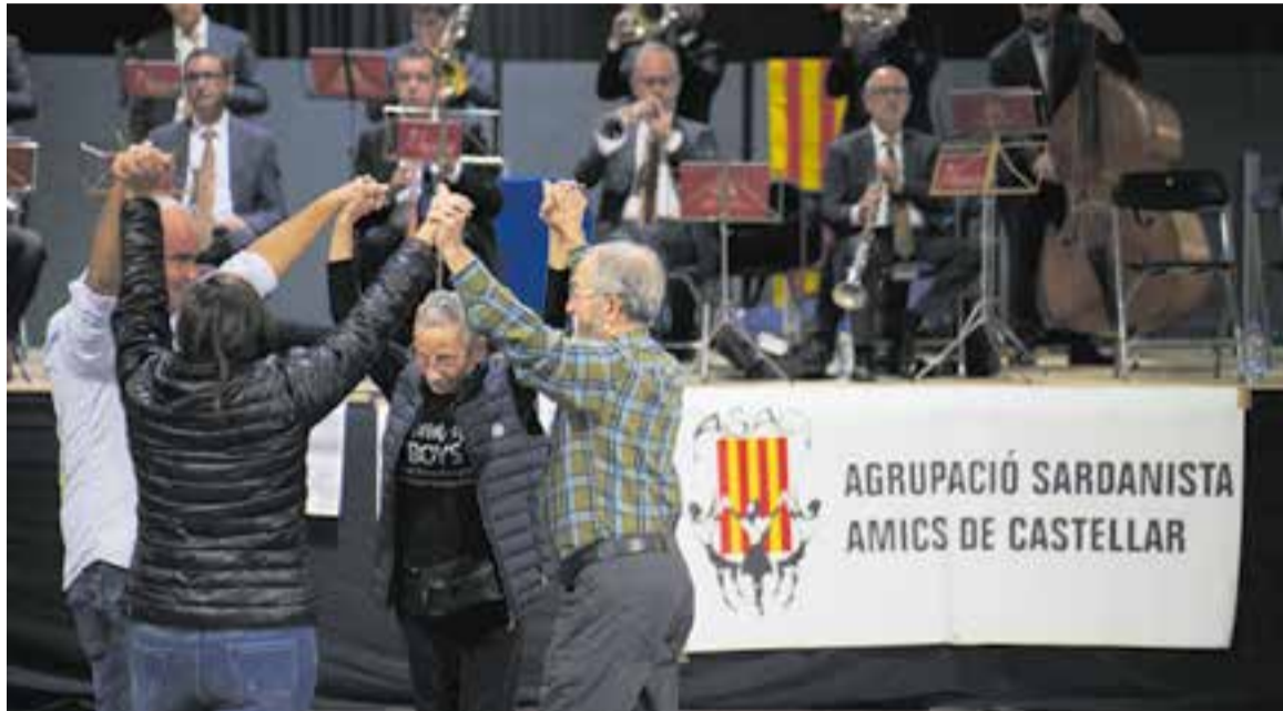
Les cobles Sant Jordi-Ciutat de Barcelona i Jovenívola de Sabadell van posar música a la cita sardanística de la Sala Blava.

“La valoració de la diada és molt bona. Al llarg de la tarda, s'ha anat animant cada vegada més amb sardanes balladores” , afegia. La pròxima cita sardanística