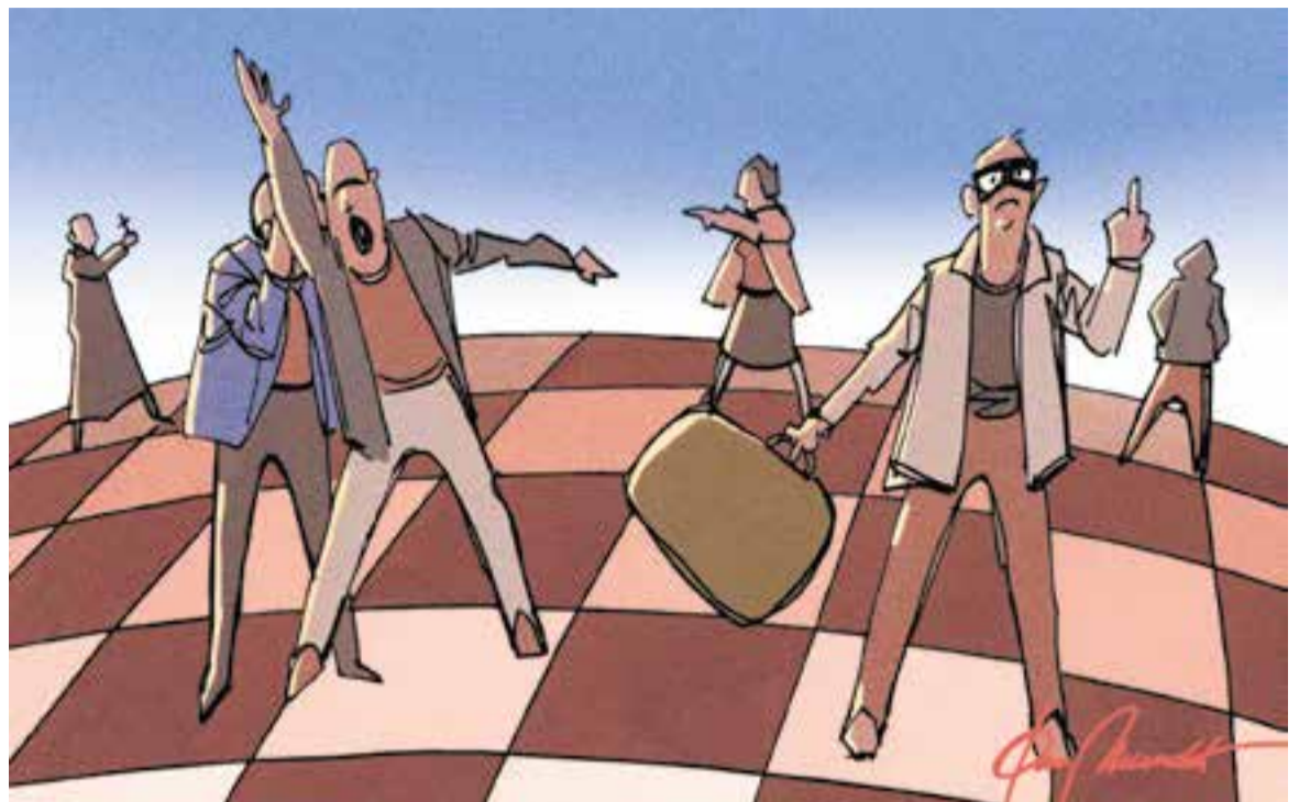
© Els diplomàtics. || JOAN MUNDET

"La guerra és l'exaltació d'uns greuges personals en què es vol fer participar tothom"