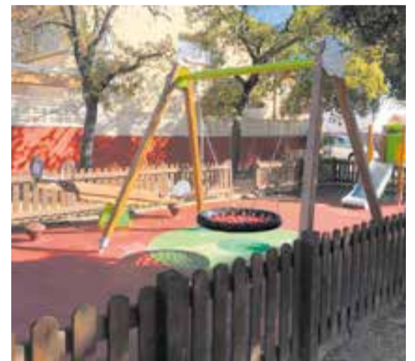
Imatges dels nous jocs infantils a les places Catalunya, Europa, Francesc Macià i Pau Casals. || L'ACTUAL

REVISIÓ AUDITIVA GRATUÏTA prova-ho un mes sense compromís