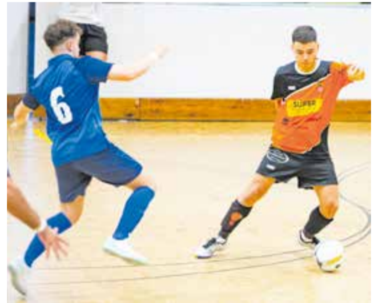
L'FS Castellar va reaccionar tard als dos gols matiners de la Prospe. || A. S. A.

Segona derrota del curs de l'FS Farmàcia Catalunya Castellar, que van caure a Nou Barris contra el CEFS Prosperitat per 3-2.