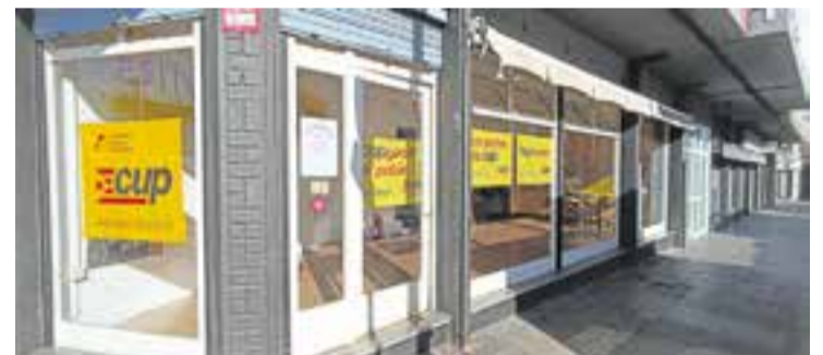
La nova seu de la formació de la CUP a Castellar va obrir el 21 d'octubre.

A partir d'aquest dilluns, 21 de novembre, el nou local de la CUP Castellar, situat a l'avinguda Sant Esteve, serà a disposició de les associacions i entitats de la vila. D'aquesta manera, "la CUP pretén ajudar les entitats que no compten amb un espai físic per reunir-se o desenvolupar les seves activitats" , ha explicat la formació en un comunicat. Les associacions que vulguin fer servir l'espai poden sol·licitar-lo a través d'un missatge privat al Twitter de la formació (@CUP Castellar) o al seu Instagram (@cupcastellar) tot indicant el nom de l'entitat, els seus membres i una breu descripció de l'activitat que desenvolupa. De la mateixa manera, en el mateix missatge caldrà indicar el dia i hora que l'entitat vol utilitzar la sala. La CUP Castellar va presentar el seu nou local el 21 d'octubre passat i des del primer moment ha assegurat que "la intenció és compartir-lo amb les entitats" . "En els últims anys, l'Ajuntament ha fet tot el possible per apropiarse de les iniciatives de les associacions del poble, afeblint-les d'aquesta manera i fent-les més dependents del consistori" , diuen els cupaires. Amb aquesta cessió de l'espai, la CUP pretén "fomentar l'autogestió i l'enfortiment del teixit associatiu de Castellar per tal de recuperar la riquesa associativa de la qual havia gaudit el poble anys enrere" . + || REDACCIÓ