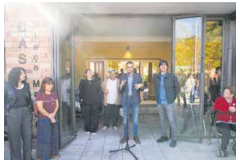
Parlaments institucionals en la reobertura del casal de la plaça Major. || Q. PASCUAL

els espais i sales més grans per desenvolupar-hi activitats. Hi ha una sala polivalent principal destinada al col·lectiu de la gent gran, servei de consergeria, cafeteria i cuina, a més de dues sales específiques per a l'Espai d'Atenció a la Diversitat Funcional. D'altra banda, s'han creat dues aules taller que es podran utilitzar de manera flexible des de diferents col·lectius com ara gent gran, persones amb diversitat funcional i familiars i usuaris del programa de prescripció social. Des de fora, també es noten els canvis, ja que el porxo de fora ha quedat renovat i funciona com una galeria annexa que es podrà utilitzar durant tot l'any. ➔