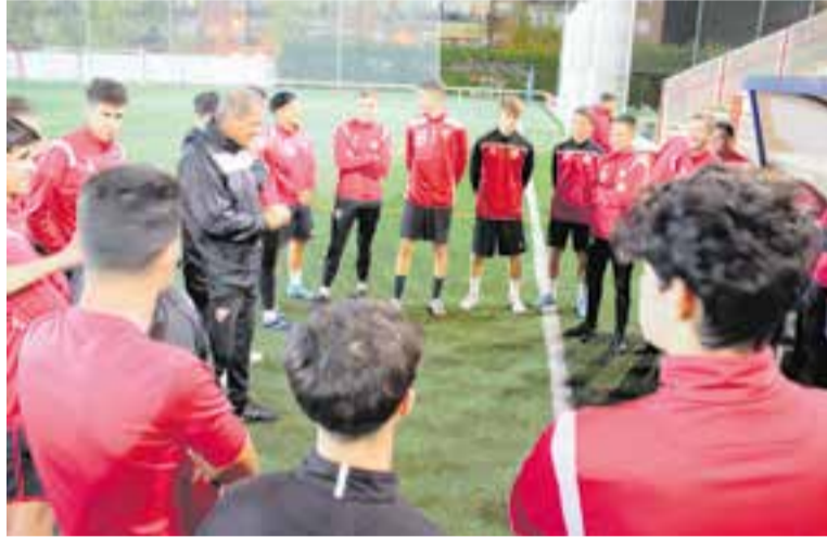
Xerrada de l'entrenador durant la sessió de dimecres de la UE Castellar.

Després de 92 anys, Qatar superarà Uruguai en ser el país més petit a organitzar un Mundial, que serà el