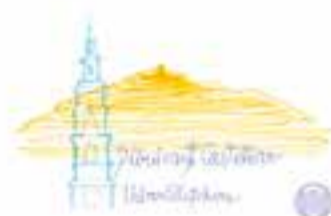
Centre Excursionista de Castellar

+ INFO I INSCRIPCIONS: marxanordicavallès@gmail.com, tel. 660871152 (WhatsApp)