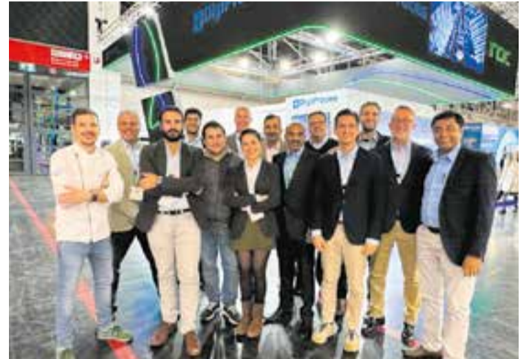
Part de l'equip de DigiProces davant del seu estand a la fira Electronica.