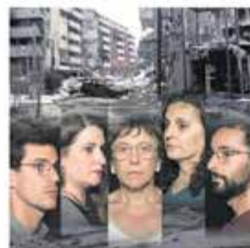
Esbart Teatral de Castellar