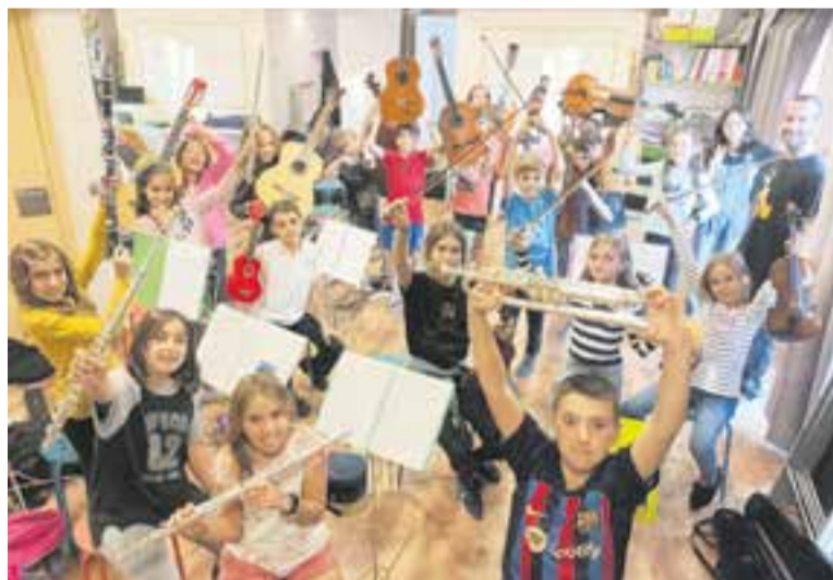
Alumnes de l'Orquestra Infantil d'Arctàdia, en un assaig.

Un any més, l'Orquestra Infantil Arctàdia, per commemorar santa Cecília, patrona de la música, protagonitza l'Hora del Conte Infantil a la Biblioteca Municipal. Dissabte 19, a les 11.30 h, han preparat la història musicada La Mariona descobreix la iaia Sisca . A través d'uns personatges i d'un llibre gegant podem seguir aquesta història, que ens parlarà de les herbes remeieres i d'un dels oficis que hi estava relacionat, el de les trementinaires. A partir de la iaia Sisca coneixerem un món molt apassionant. Una vintena de nens i nenes entre 8 i 11 anys interpretaran les cançons amb el violí, violoncel, trompeta, flauta travessera, guitarra, ukelele, piano o clarinet. + || M. A.