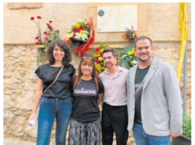
De dalt a baix, ofrena institucional dels grups municipals Som de Castellar, ERC i Junts; ofrena del Centre Excursionista (CEC), entitat escollida aquest any per participar en l'acte; acte independentista al carrer de les Roques d'ERC, CUP, PDeCAT i Junts.

En paral·lel a l'acte institucional, tant l'ANC com la CAL van fer la seva ofrena floral al carrer de les Roques en solitari, mostrant així la seva disconformitat amb els partits polítics independentistes. ✦