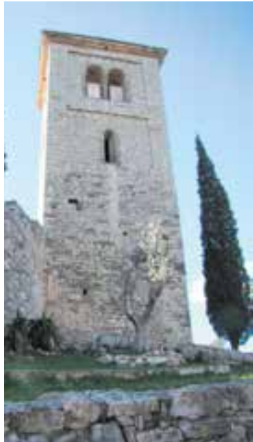
El 18, 20a Trobada. || ARXIU

A les 9.05 h es farà el repic de la campana Santa Pau, ubicada al Puig. També a les 9.05 h s'iniciarà