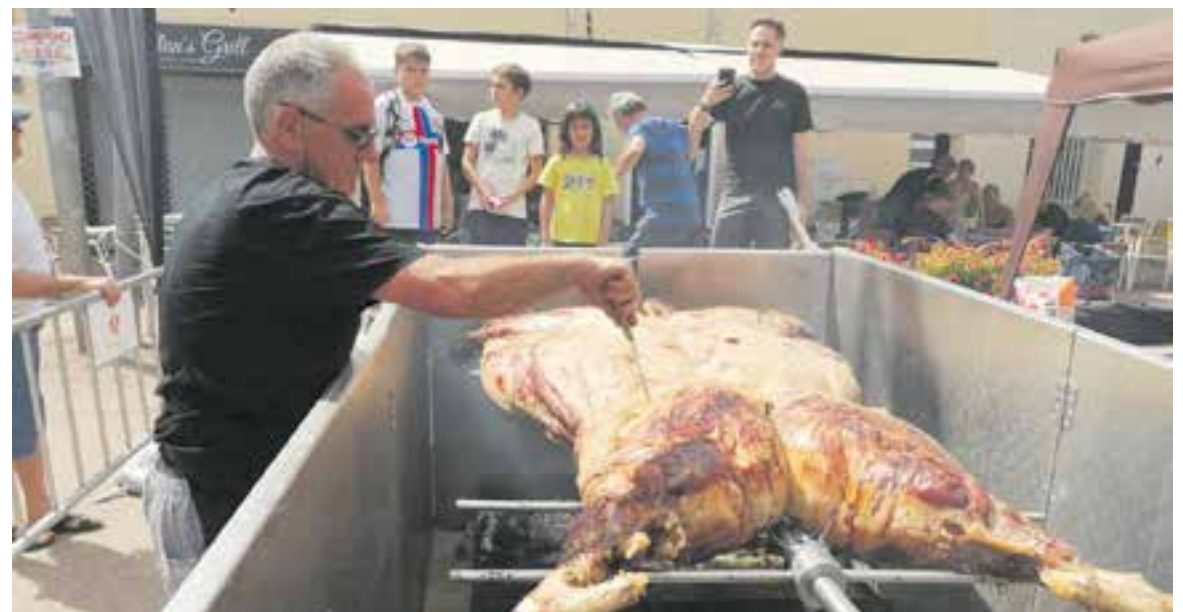
La vedella Bencriada de Banyoles es va anar rostint des de les 8 del matí a la plaça del Mercat amb molta expectació.

El repartiment es va fer amb la col·laboració de tots els paradistes del Mercat Municipal, que van treballar de valent: “Per nosaltres va ser una festa treballar junts. Felicitats a tots els companys i companyes del mercat” , conclou Gálvez. +