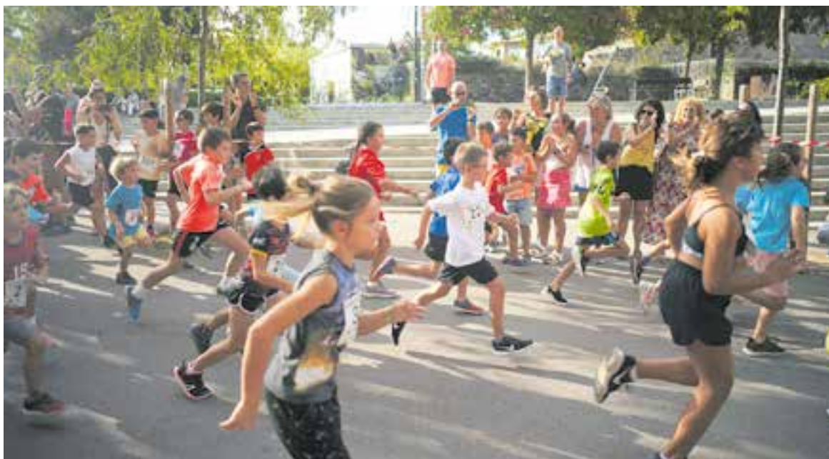
A dalt, sortida de la cursa inclusiva. A sota, la cursa dels petits.