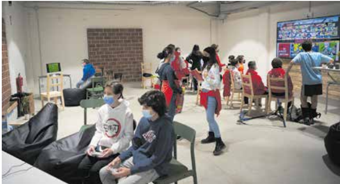
La Fàbrica és un dels quatre equipaments municipals que ha obert aquest mes les inscripcions a l'oferta d'activitats.

D'una banda, El Mirador aposta per una oferta formativa basada en càpsules de curta durada amb l'objectiu de promoure l'alfabetització i la capacitat digital. En total, s'han programat 16 propostes que es distribueixen en les disciplines d'Ordinador i Informàtica, Introducció a Internet i Introducció als Mòbils. També s'ofe-