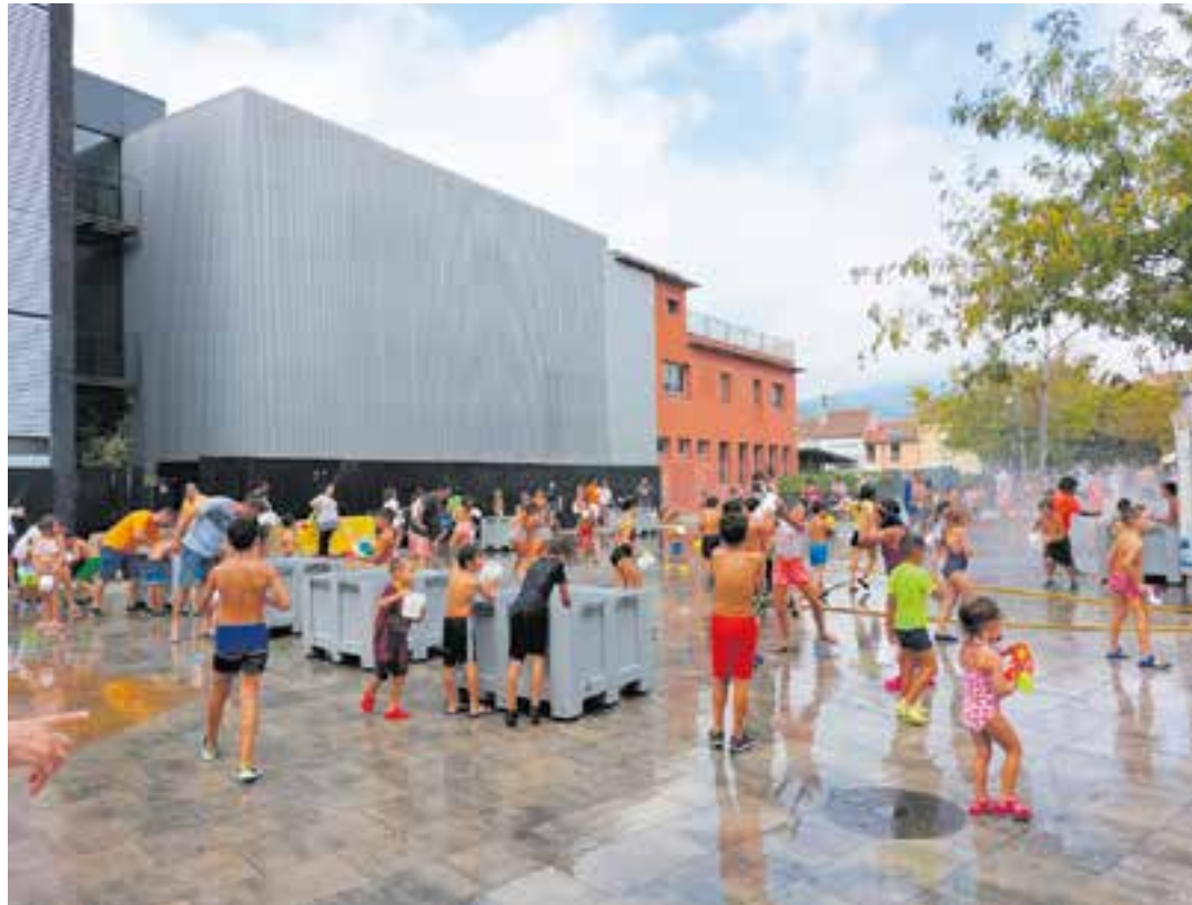
Durant la Festa Major les temperatures van ser elevades i convidaven a participar en la Baralla d'Aigua. || AJUNTAMENT

Aquesta sensació de calor sufocant ha estat especialment feixuga a última hora del dia, per la qual cosa, ha estat difícil descansar. Concretament, aquest estiu s'han encadenat 31 jornades amb nits tropicals. “Una nit tropical és quan la mínima no baixa dels 20 °C. L'estiu del 2003 es van registrar 42 nits tropicals. Habitualment, es registren unes deu nits tropicals a l'any. Tant el 2003 com el 2022 s'han registrat dades molt per sobre de la mitjana de nits tropicals”, detalla Moré. Una altra dada que crida l'atenció és que el 17 de juny es va registrar a Cal Bo-