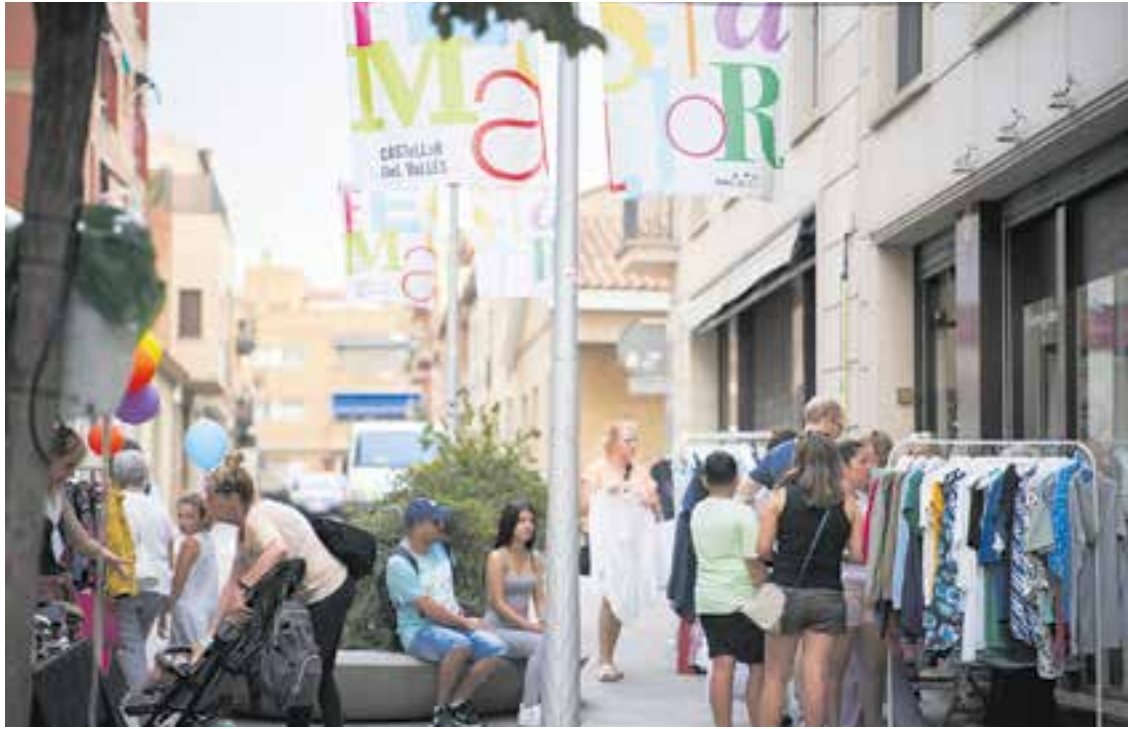
L'Street Market, organitzat el dia 11 amb 36 parades, va rebre molta afluència, sobretot al matí. || Q. PASCUAL