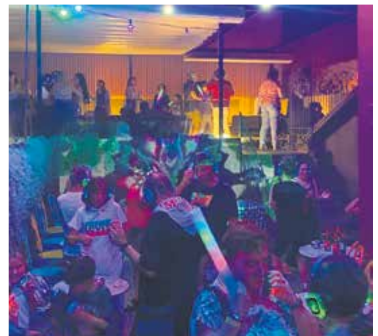
Fins a 100 persones van ballar a la 'silent disco' de l'Andreví.