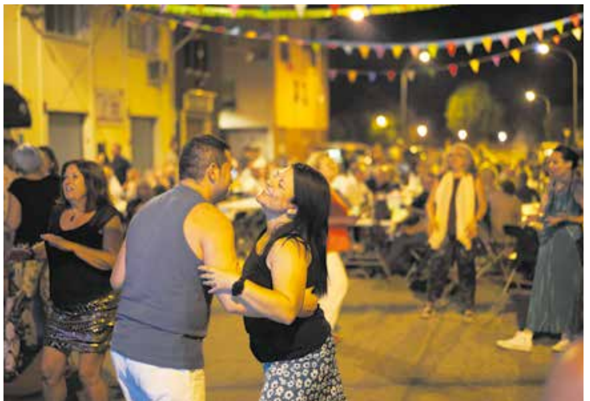
Tres moments de la revetlla: karaoke al carrer Retir, ball i sopar a Can Carner i encesa de la Flama del Canigó. || Q.P.