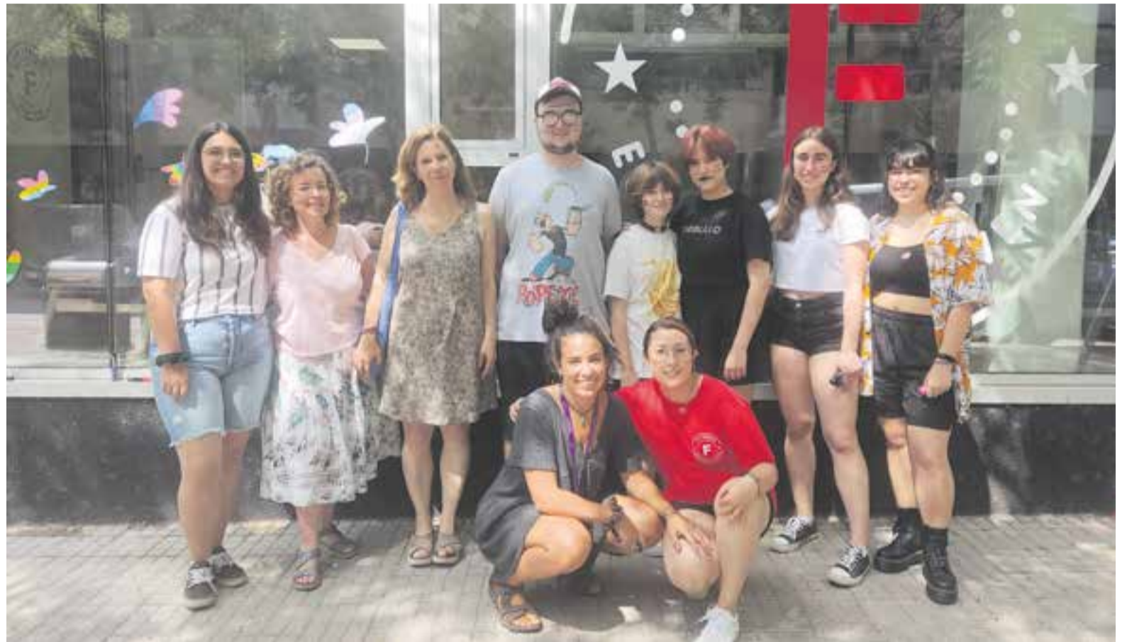
Els alumnes del batxillerat artístic amb les professores i membres de La Fàbrica, davant la vidriera que van pintar amb motiu del dia LGTBIQ+