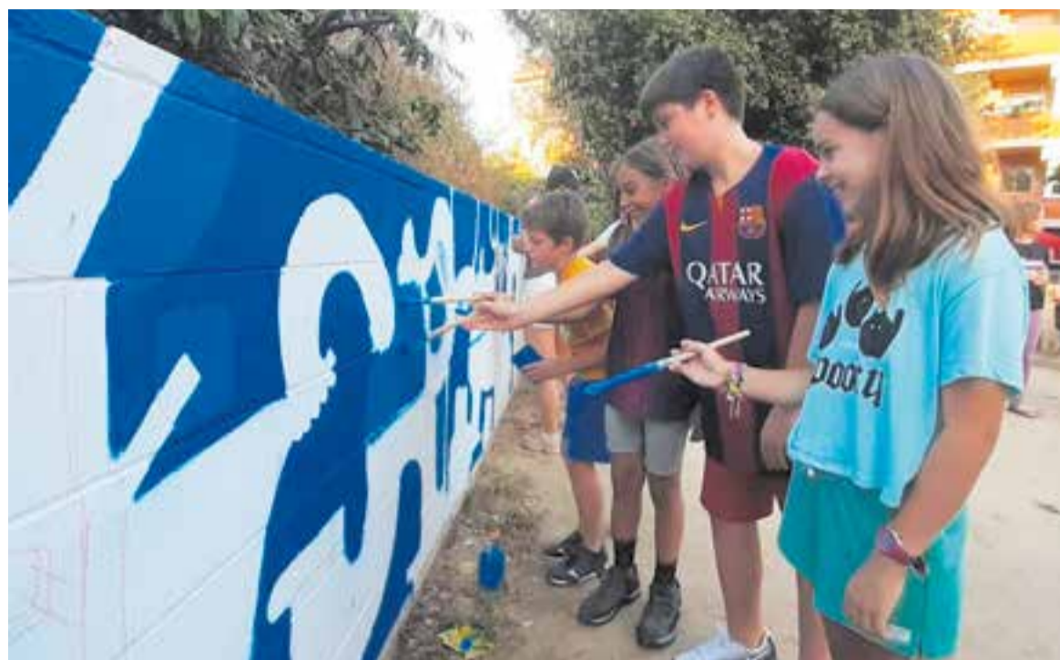
Joves pintant el mural, amb l'ajuda de l'espai Nadryv, a la plaça Francesc Macià.

Precisament al voltant d'aquest tema va anar l'activitat que es va fer posteriorment de geocerca, titulat CastellArt , el joc urbà per caçar obres d'art i descobrir com podem tenir un espai públic millor a Castellar. L'activitat va consistir a trobar obres d'art per Castellar que s'han creat en col·laboració amb el col·lectiu d'artistes Nadryv. “El grup d'adolescents