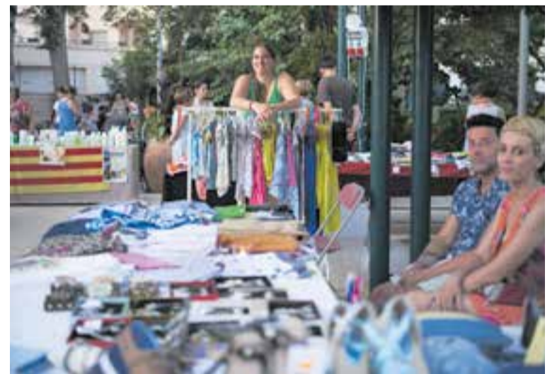
La Nit Embruixada, una de les darreres accions d'estiu de Comerç Castellar. || Q. PASCUAL

Els establiments participants a l'activitat d'aquest divendres 1 de juliol són Rodana Sabaters, Sílvia Moda, Herois, Esports Castellar, Luque & Luque, Pessigolles, Outlet, Missammy, Pentina't, Bel·la Moda, Espai Lector Nobel, Midudu, Loteria l'Estaca, Gatsby, Pizzeria Pizzapunt i Super Òptics. + || REDACCIÓ