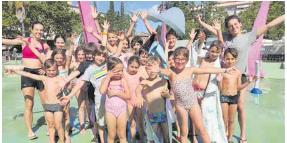
Participants del casal Canglomerat Escola d'Escalada als jocs d'aigua.

D'entre totes les sol·licituds, un 40% correspon a la utilització dels jocs d'aigua de la plaça de Catalunya. De fet, cada dia coincideixen en aquest espai diferents entitats del municipi, com va passar dimarts, segon dia d'aquests casals estiuencs. La Taca, els Casamada Scouts i Canglomerat Escola d'Escalada, van compartir espai. "Els nens i nenes han començat amb molta il·lusió. Les restriccions que patim per culpa de la pandèmia comencen a oblidar-se i això es nota. Venen amb moltes ganes