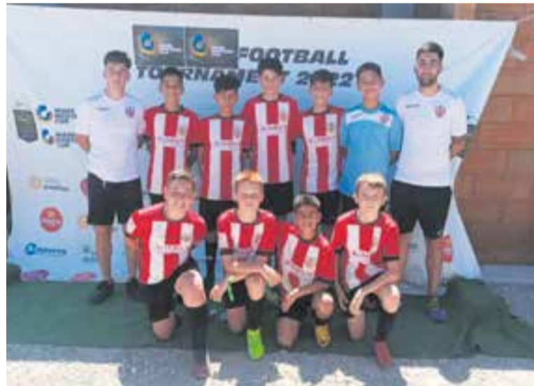
L'aleví A de la UE Castellar va acabar en 4t lloc en la Mare Nostrum Cup.