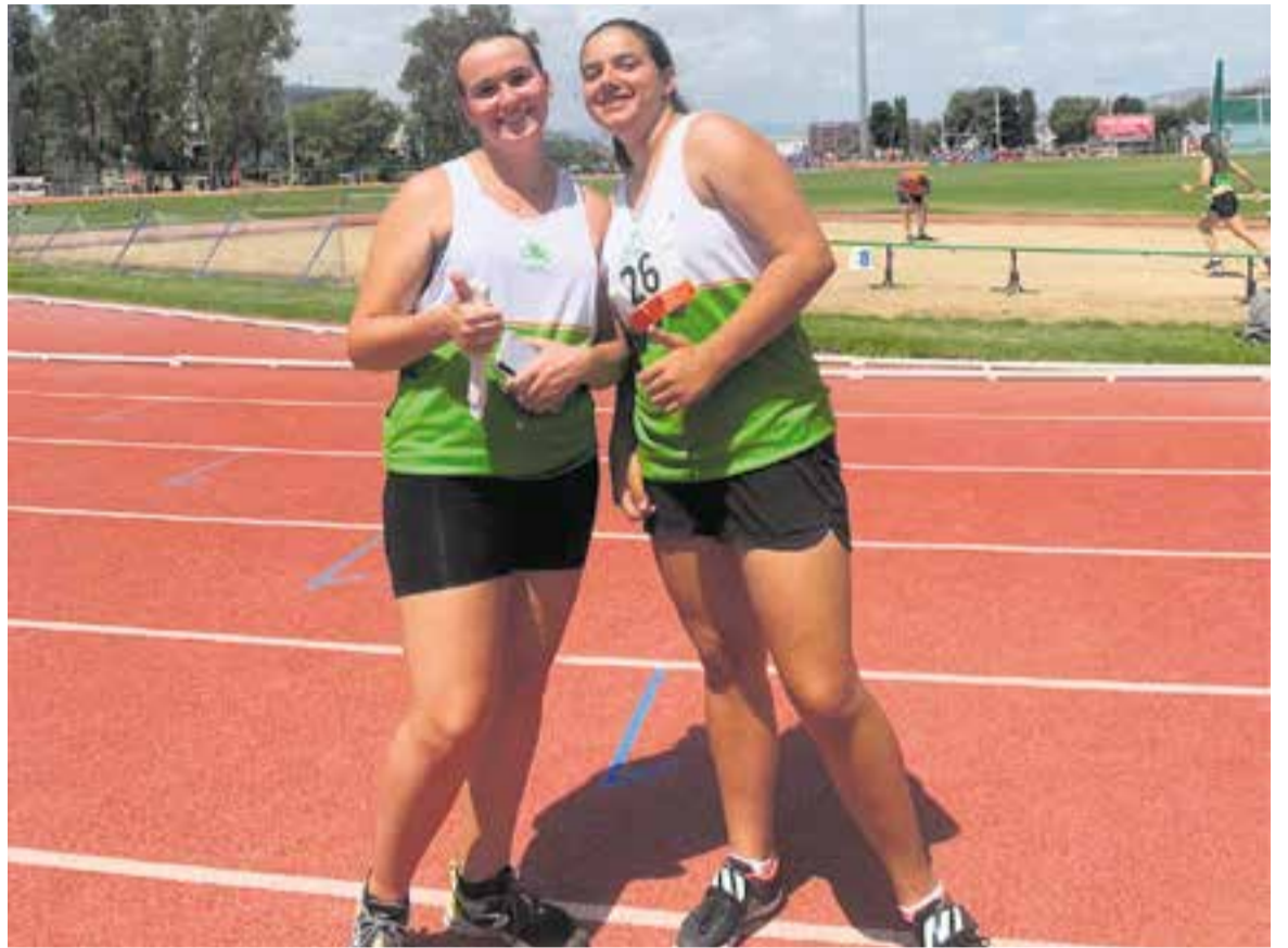
El CA Castellar va classificar a quatre atletes per a la final de Catalunya sub-16.