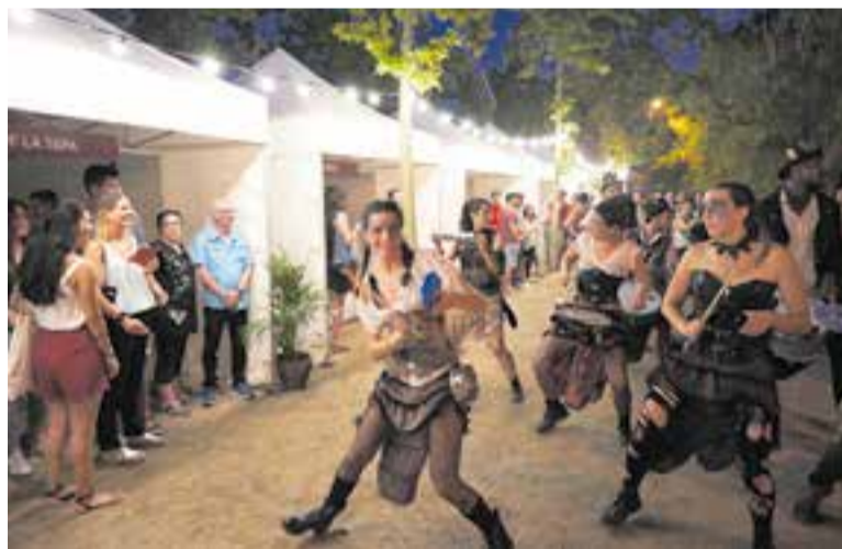
Una imatge de l'edició del 2019 del Tast d'Estiu.

En aquesta edició els tastadors han dipositat 529 butlletes de votació a les urnes dels 21 establiments participants, de les quals 476 van ser vàlides. Finalment, el Premi Popular resultant de la mitjana de tots els vots emesos pels clients que han tastat les tapes a través de les butlletes dipositades a les urnes ha recaigut en el restaurant Garbí per la seva mandonguilla de tàrtar de salmó. +