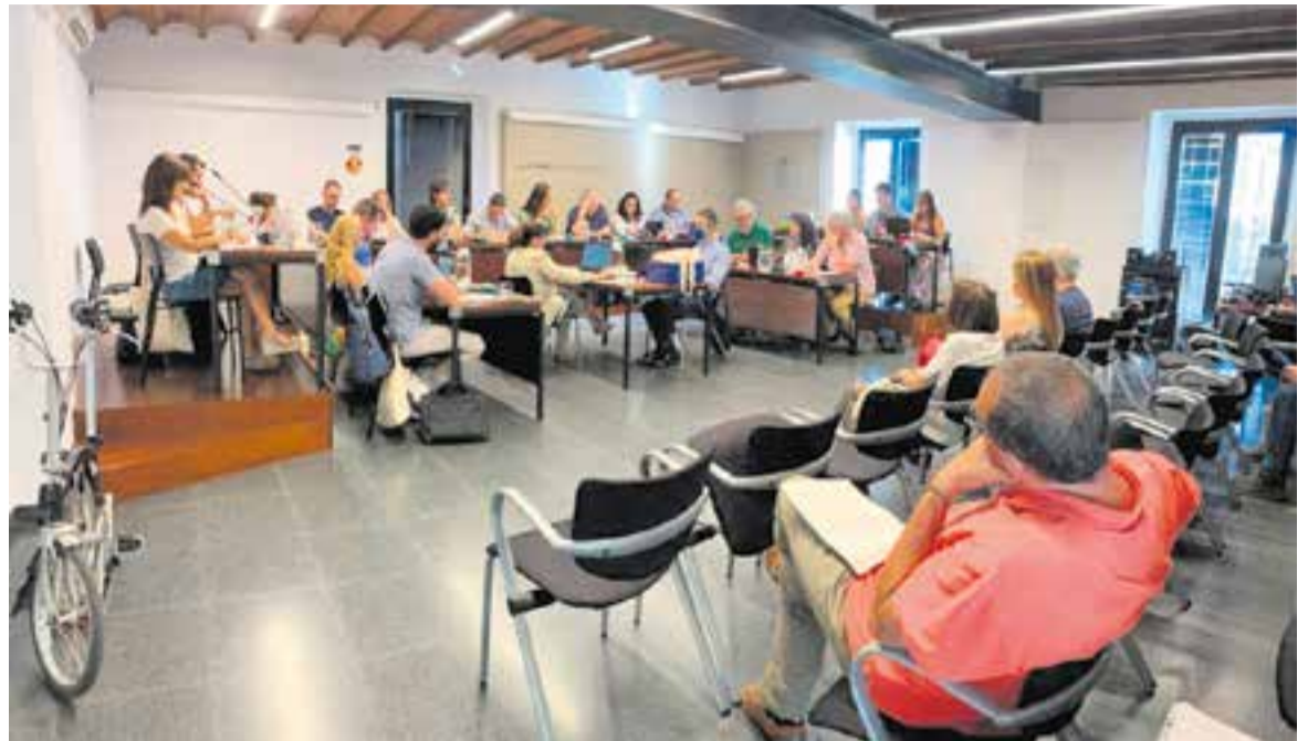
El saló de plens va recuperar al juny les cadires per permetre l'assistència de públic.