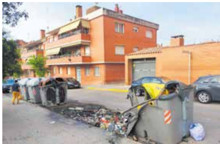
Contenidors cremats al carrer Països Valencians el dia anterior a Sant Joan