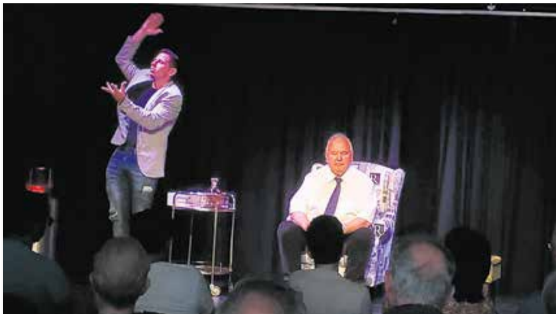
La representació 'Líder' de la companyia Tres Homes Grossos, va tenir lloc dissabte a L'Alcavot, amb molt bona acollida.

El 14 de juliol, a les 20.30 hores, s'ha previst una nova sessió de cafè-teatre de S'horabaixa , a les 20.30 hores, titulat "Poesia musicada", amb Martin Cáceres. +