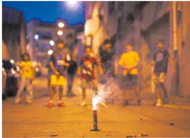
Uns infants juguen amb petards la revetlla de Sant Joan.

D'altra banda, des de l'inici del dispositiu de la revetlla de Sant Joan fins a l'endemà al matí, els Bombers voluntaris de Castellar van atendre un total d'11 serveis, només tres d'ells a Castellar com l'esmentat de la tanca de l'equipament esportiu de SIGE. La resta de sortides, segons informen els bombers de Castellar, van ser als municipis de Sabadell, Terrassa i Sant Llorenç Savall. En concret, els Bombers Voluntaris van comptar amb dues dotacions i el suport del SERNA i l'ADF durant les hores de feina més intensa. Cal recordar que mentre sigui vigent el Pla Alfa del Departament d'Interior que mesura el risc d'incendis forestals es manté la petició de no fer servir pirotècnia més a prop de 500 metres de zona forestal al nucli urbà i està prohibida a Sant Feliu i les urbanitzacions. + || REDACCIÓ