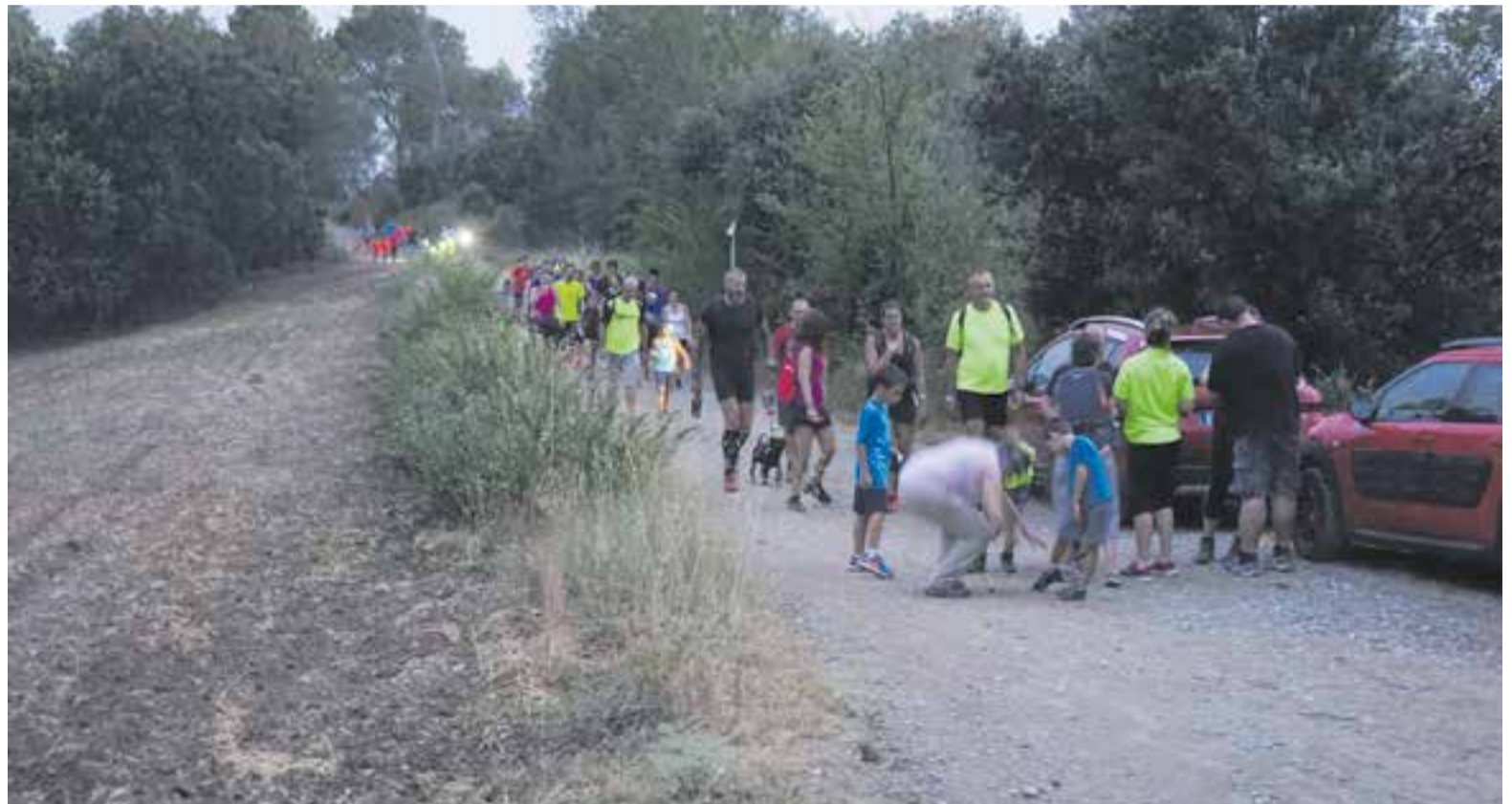
La tercera edició de la prova ja no tindrà cap mena de restricció i es podrà gaudir de ple amb totes les garanties.

Dues persones amb mobilitat reduïda podran fer la caminada amb cadires especials anomenades Joëlette, portades