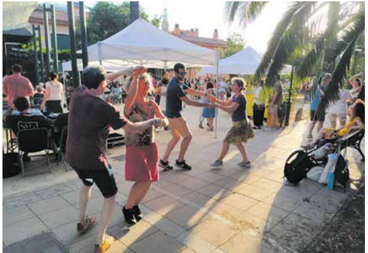
El Dia de la Música va retre homenatge als 25 anys de la Castellar Swing Band, que va fer ballar lindy hop als assistents. || G. P.

HISTÒRIA DE L'ORQUESTRA DE CASTELLAR La Castellar Swing Band va néixer impulsada per un grup de músics de Castellar que l'any 1997 considerava que, malgrat la tradició històrica d'orquestrats i grups, en aquell moment faltaven més propostes al municipi. Es van ajuntar com l'Orquestra de Castellar, més orientada al ball de saló. Amb el temps, però, van anar evolucionant i canviant el registre per fer música més moderna, com el lindy-hop. “La celebració del Dia de la Música ha estat molt positiva. Esperem que es pugui institucionalitzar, com altres festes, i que se celebri cada any” , desitjava el director Casañas. ✦