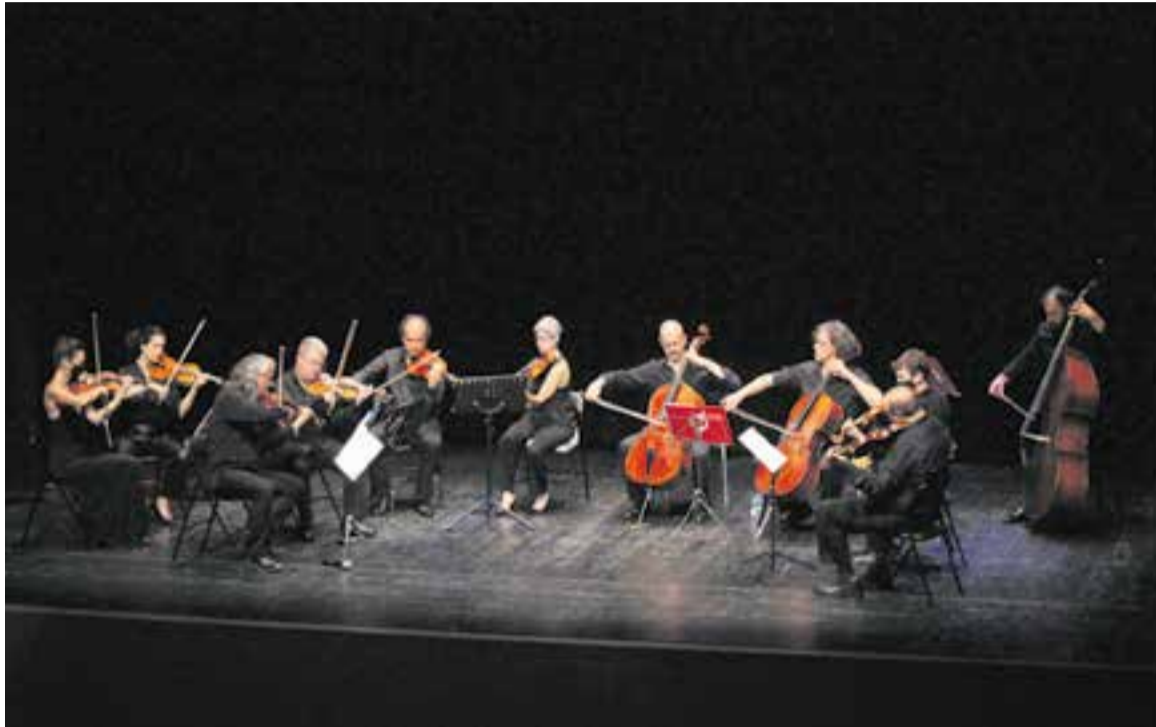
Un dels moments del concert de l'Orquestra de Cambra de Terrassa OCT48 a l'Auditori, dimarts passat. || R.G.

Així, la travessa va començar pel Caucas, per Geòrgia, amb les Miniatures vibrants de Z. Tsintsadze. Tot seguit, música d'A. Guinovart, arranjada per Narcís Bonet, pels colors catalans, amb tonades tan conegudes i delicioses com les Muntanyes del Canigó . Encara amb un peu al mar, als colors mediterranis, l'orquestra va fer parada a Grècia amb les danses de N. Skalkotta, abans d'enfilars el camí cap als colors nòrdics amb Wood Works