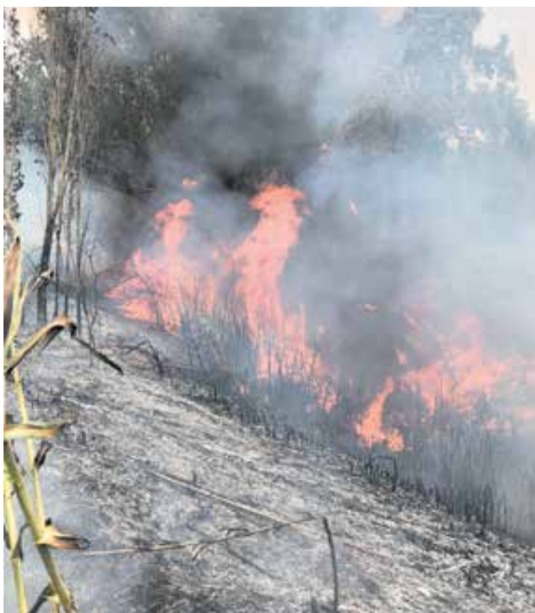
Imatges del foc que es va produir dilluns passat a Sentmenat.

També cal destacar que des de l'any passat l'Ajuntament disposa d'un sistema de videovigilància forestal amb cinc càmeres instal·lades en llocs estratègics.