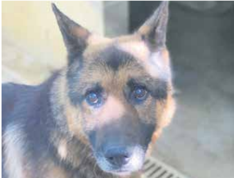
El Rocket acaba d'arribar a Caldes Animal per trobar una nova llar.