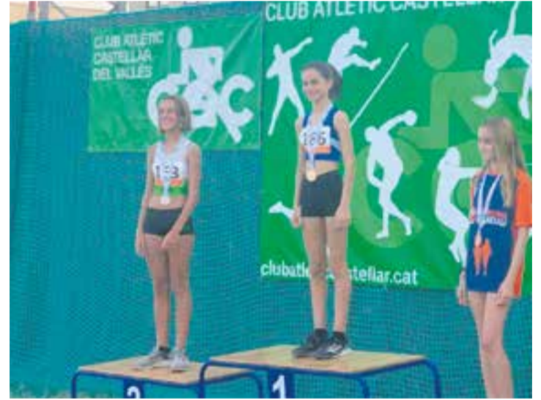
La jornada del Campionat de Catalunya va tornar a omplir les pistes d'atletisme.