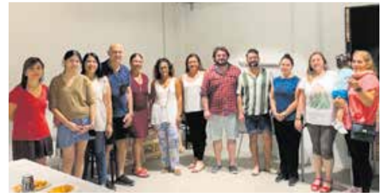
La trobada del Servei de Primera Acollida va tenir lloc a La Fàbrica.