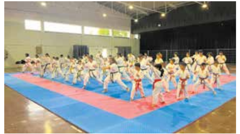
Alumnes del Club Kyokushin Castellar a les instal·lacions de l'Espai Tolrà.