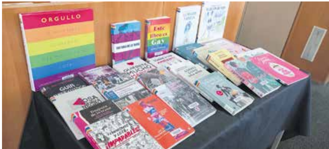
Mostra de llibres LGBTIQ+ exposats a la Biblioteca Municipal Antoni Tort.