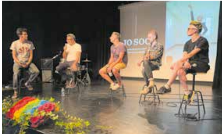
La presentació del projecte 'Jo soc' ha arrencat els actes pel Dia de l'Orgull.

Les activitats programades continuaran els dies 27 i 29 de juny.