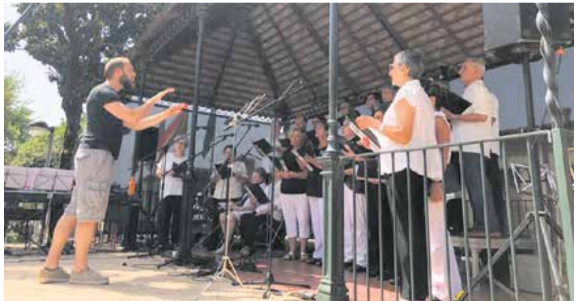
El cant coral també va ser protagonista de la celebració del Dia de la Música amb actuacions com la de la coral Xiribec.