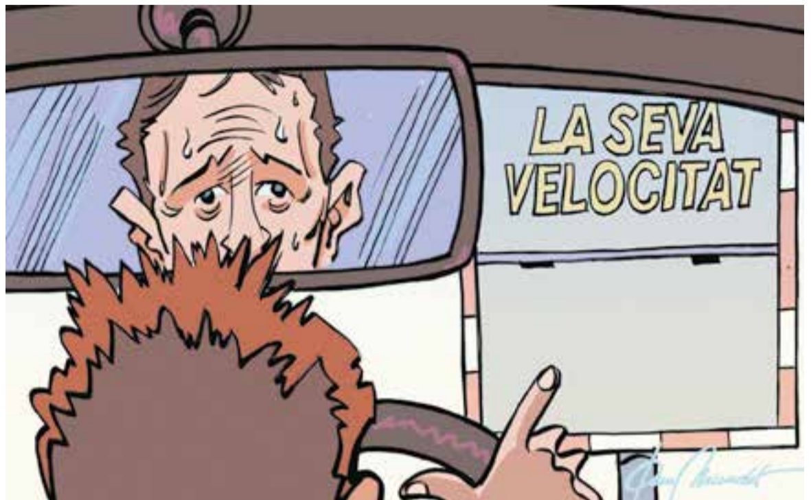
© Nia 10. | JOAN MUNDET

"Estic escrivint aquestes notes davant d'un tallat tot fent temps"