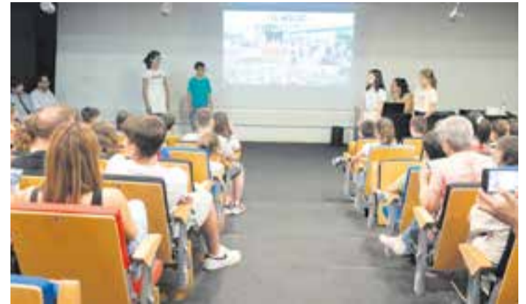
Explicació del projecte dels alumnes de 5è de primària. || AJ. CASTELLAR