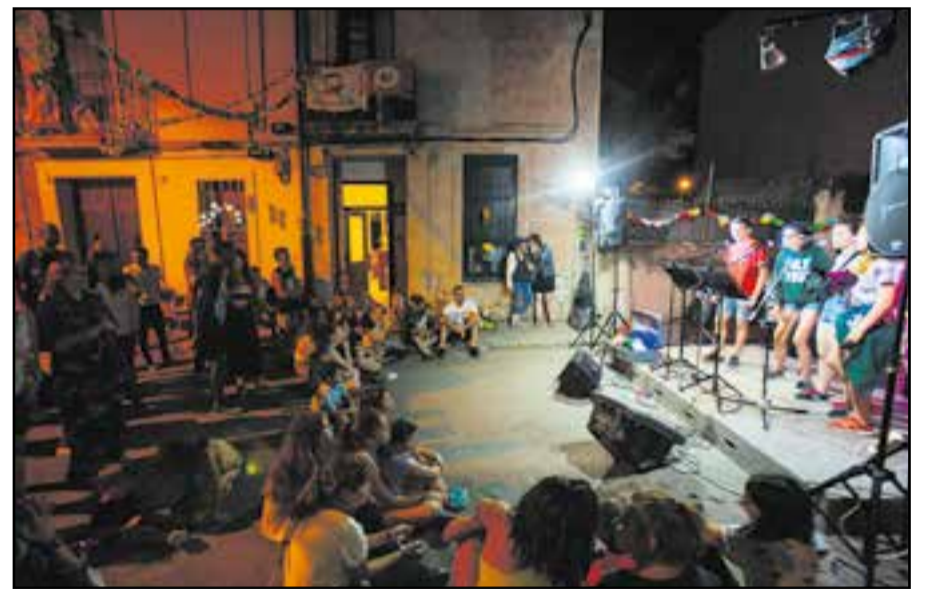
A l'esquerra, festa de l'escuma a Can Carner en marc de la Festa de Sant Joan, any 2016. A la dreta, moment de karaoke a la Revetlla de Sant Joan de l'AV el Pujalet, l'any 2019.