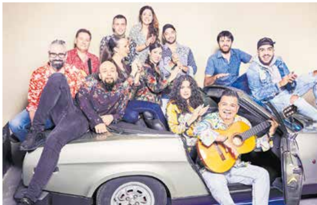
Sabor de Gràcia.