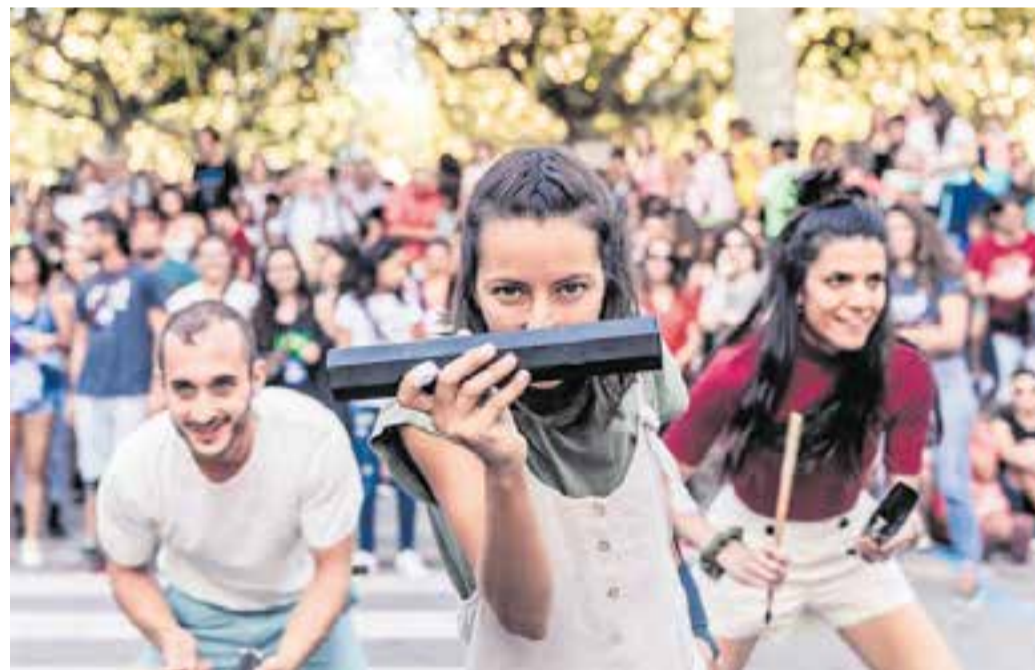
Sound de Secà.