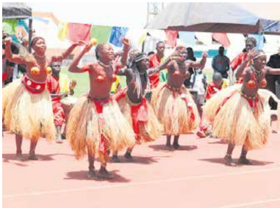
Os Netos de Bandim.

Sis músics integren aquesta banda que va néixer l'any 2020 a mig camí entre el Maresme, el Vallès i Mallorca. Un sextet que recupera la sonoritat característica dels anys 90 fusionada amb la música folk de les tradicions, la terra i el ball. L'any passat la banda va publicar el seu primer disc, Festisme , que inclou deu cançons que van de la cúmbia al vals i de la ranxera al reggae. Una combinació d'estils plens de melodies ballables i lletres quotidianes i fresques per convidar-nos a ballar. Un projecte ple d'energia i vitalitat.