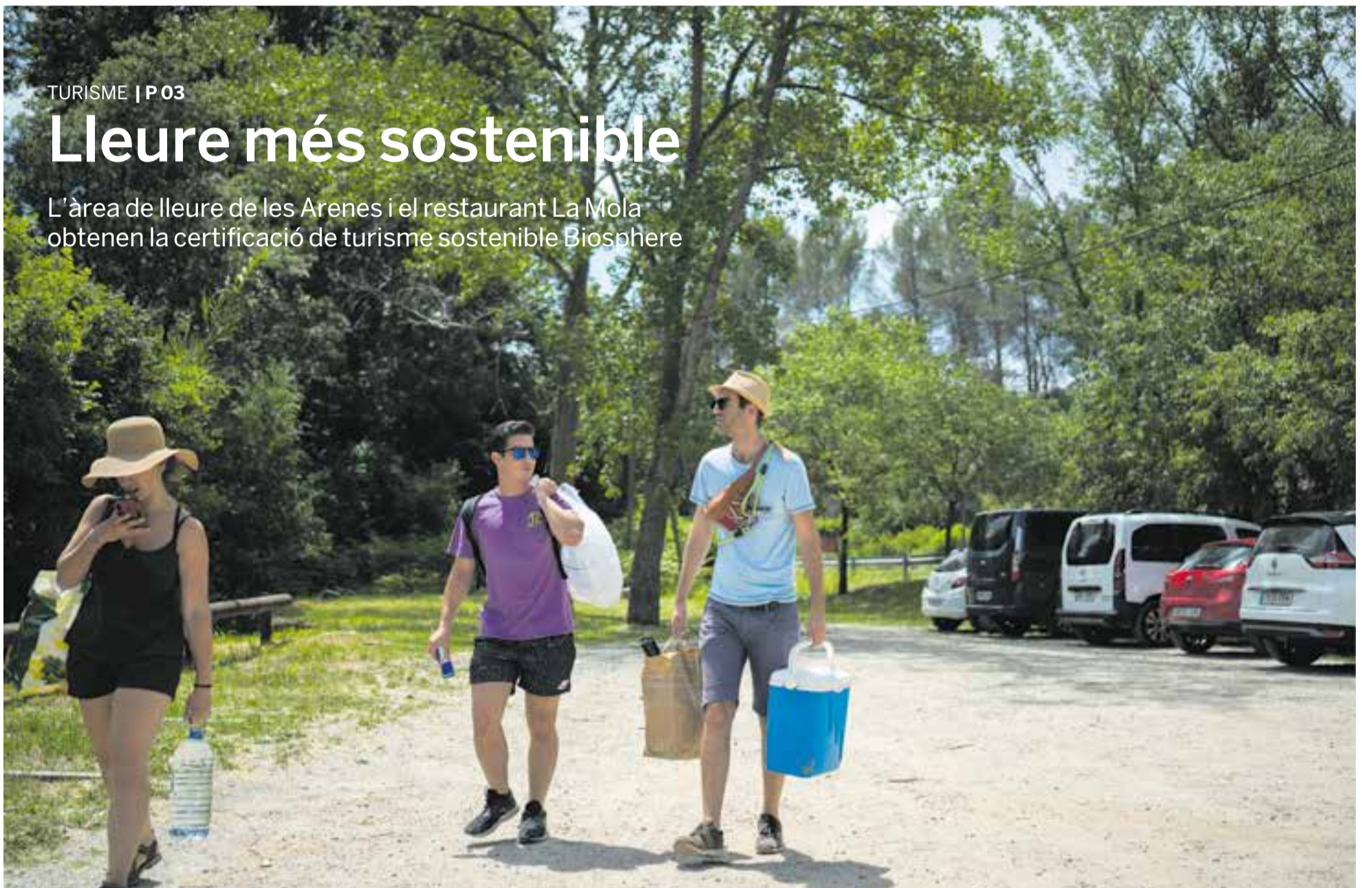
Tres persones s'acosten a l'àrea d'esbarjo de les Arenes diumenge passat, un espai a prop del riu ubicat a l'entrada del Parc de Sant Llorenç del Munt i l'Obac que és respectuós amb el medi ambient.

L'àrea de lleure de les Arenes i el restaurant La Mola obtenen la certificació de turisme sostenible Biosphere