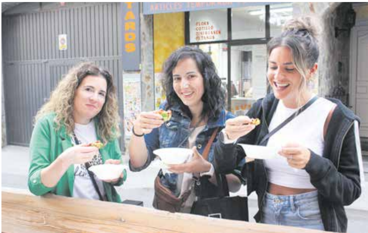
Tres noies a punt de tastar la tapa del Mito Sushi Restaurant dimecres a la tarda a l'exterior del local.

cionat amb la idea “que et sigui còmode, no costi gaire i puguis anar fent sobre la marxa perquè si ho compliques després no arribes”. ↗