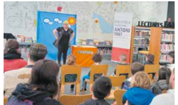
La companyia Teatrem, la darrera vegada que va visitar la biblioteca. || CEDIDA

Teatrem és una companyia d'espectacles per a públic familiar, de petit i gran format, i també per a adults. Va visitar la Biblioteca Municipal Antoni Tort el Sant Jordi 2022. + || MARINA ANTÚNEZ