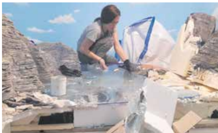
Desmuntatge d'un dels diorames de la mostra 'Pessebres i canvi climàtic'.