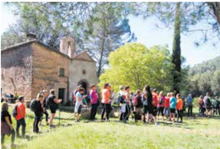
L'ermita de les Arenes acull el 25è aniversari de la 1a missa dels traspassats.