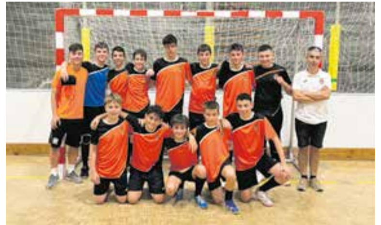
L'Infantil A va ser campió de Lliga i puja a Primera Divisió.