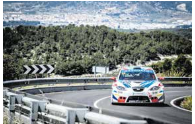
L'Alta Perfumeria Team va acabar en quart lloc a Ibi (Alacant).