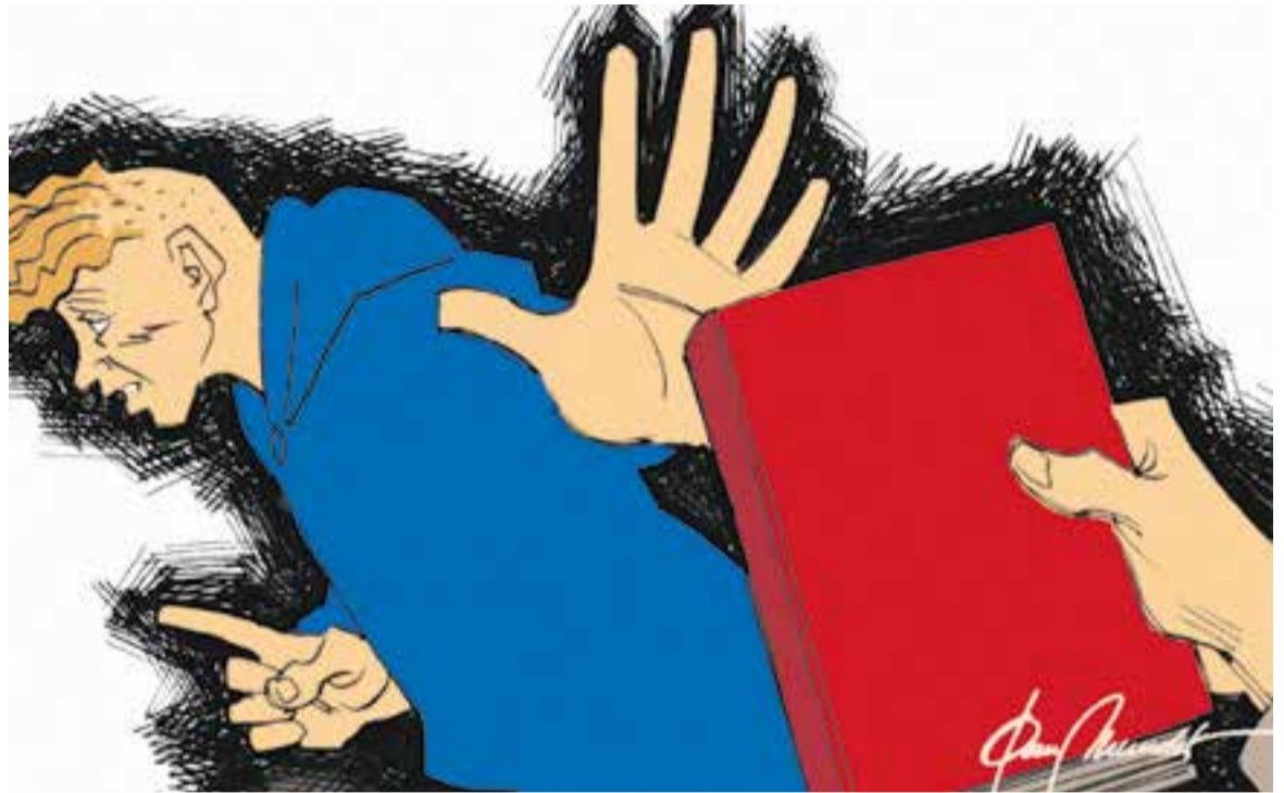
© Sense títol 2022. || JOAN MUNDET

"Troblem molts nens, adolescents i joves desmotivats en l'aprenentatge, abduïts per les pantalles"