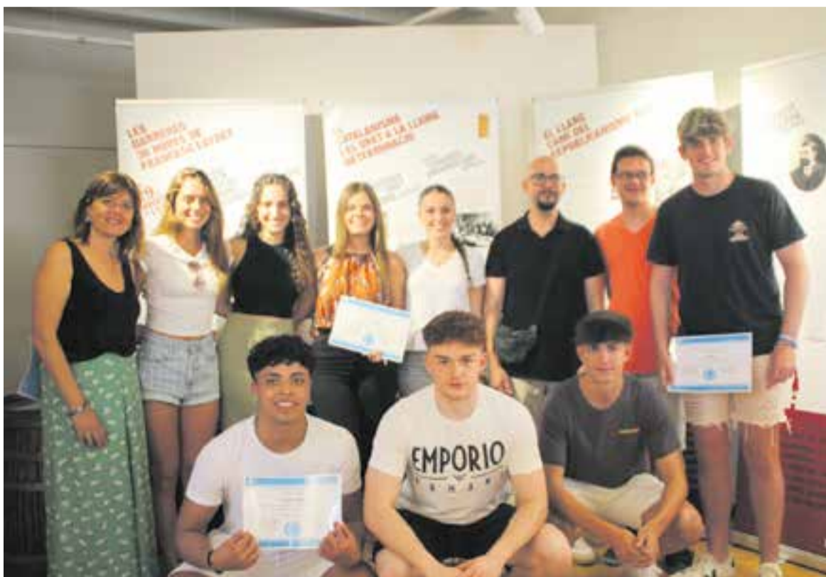
Foto conjunta dels tutors i alumnes de 2n de batxillerat guardonats al 1r Premi de Recerca de Batxillerat.

Companys, Casanova i Layret van ser el dream team dels advocats laboralistes dels rabassaires del Vallès. Lideren la lluita del contracte de la rabassa morta en contra dels terratinents. Guanyen perquè el poble es mobilitza. +