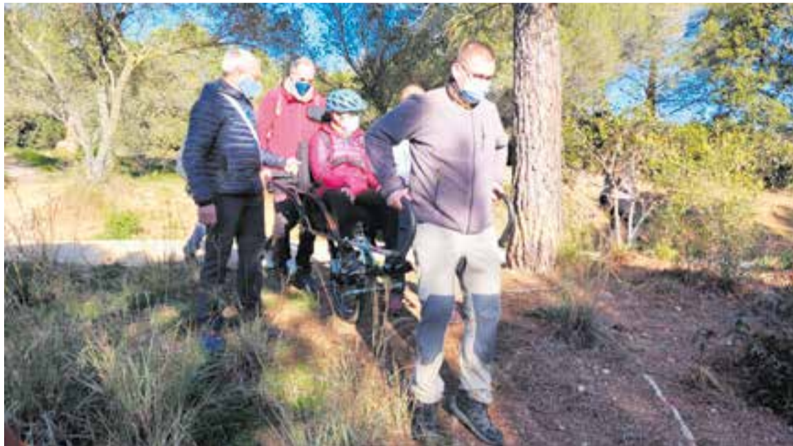
El taller per aprendre a utilitzar la cadira tot-terreny Joëlette que es va realitzar l'any passat. || AJUNTAMENT DE CASTELLAR

D'una banda, el projecte Creació del camí del riu Ripoll s'ha inclòs aquest mes de maig a l'apartat de bones pràctiques en l'àmbit del medi ambient. Aquesta és una iniciativa amb la qual es pretén recuperar un espai natural per a la ciutadania fent un camí accessible per fomentar que el riu sigui un espai de gaudi i un eix vertebrador de la vida, la cultura i l'oci de la població. En aquest sentit, s'ha millorat l'accessibilitat dels marges del riu recuperant antics traçats, creant nous