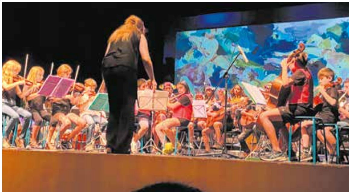
Moment d'un dels concerts oferts per Artcàdia i Acció Musical Castellar a l'Auditori Municipal.

A la tarda, amb un Matídocell , els alumnes avançats van fer una formació orquestral especial per al concert. Es van poder sentir temes com l'"Oh Fortuna" del Carmina Burana d'Orff, l'Obertura de Romeo i Julieta de Txaikovski, temes més moderns com Cruella de Vil , All Star , Going Home , La gent que estimo d'Oques Grasses o la Gran eufòria de Joan Dausà. També el Suo Gan , una cançó de bressol gallesa, la peça de Lavignac de piano a vuit mans i una samba amb el Grup de Percussió que va fer vibrar el públic assistent. El punt final va ser amb "Sentiu la gent cantar", del musical Els Miserables . ➔