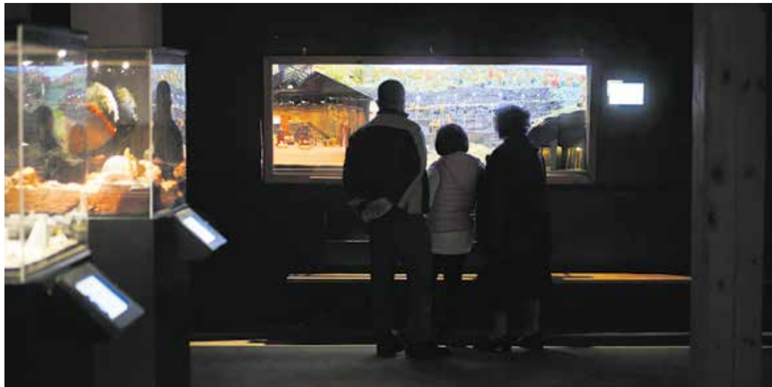
Els primers visitants a la 71a Exposició de Pessebres al local pessebrista, al carrer Doctor Pujol, diumenge passat. || Q. PASCUAL

L'objectiu dels pessebres d'aquest 2021 és, com sempre i sobretot, el gaudi d'uns pessebres de qualitat fets a poc a poc i fets durant setmanes, fins i tot mesos, però també aquesta vegada hi ha una voluntat de "contribuir a conscienciar sobre els efectes devastadors que té l'acció de l'ésser humà sobre la terra" . Per això, també en alguns dels pessebres s'apunten algunes accions