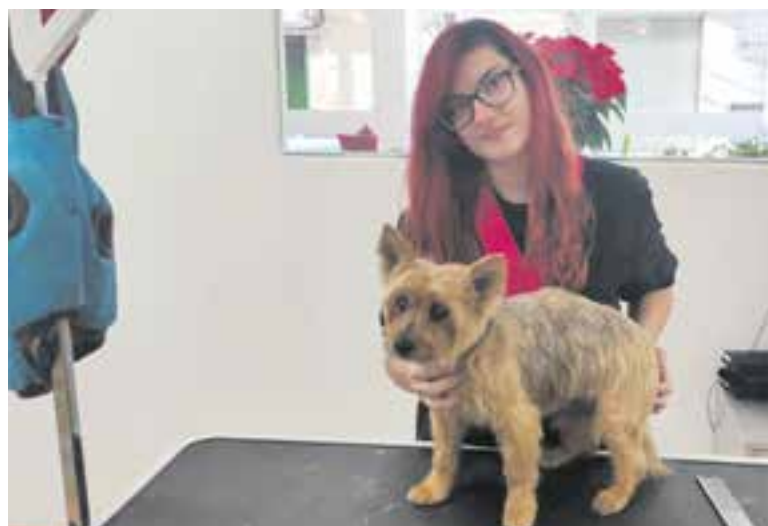
Yada s'inaugurarà el 14 de desembre, i es troba al c. Lleida, 23.

A més de perruqueria, l'espai (carrer Lleida, 23) també oferirà un servei de guarderia i botiga