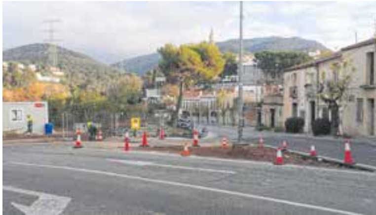
Obres al carrer del Pont, a la cruïlla de la carretera de Terrassa.

Generalitat també està duent a terme les obres de millora de la intersecció que connecta la carretera de Terrassa amb la de Sant Llorenç Savall. Amb aquesta remodelació es crearà un illot central i illetes deflectores per canalitzar els girs. Aquestes obres s'integren en el projecte de millora del traçat de la carretera C-1415a, que transcorre entre Sentmenat, Castell del Vallès i Terrassa. L'objectiu d'aquesta actuació és donar més seguretat viària a una carretera on sovintegen els accidents, unes actuacions que ja van començar a principis d'any incloent nou asfaltat i millores en la senyalització.