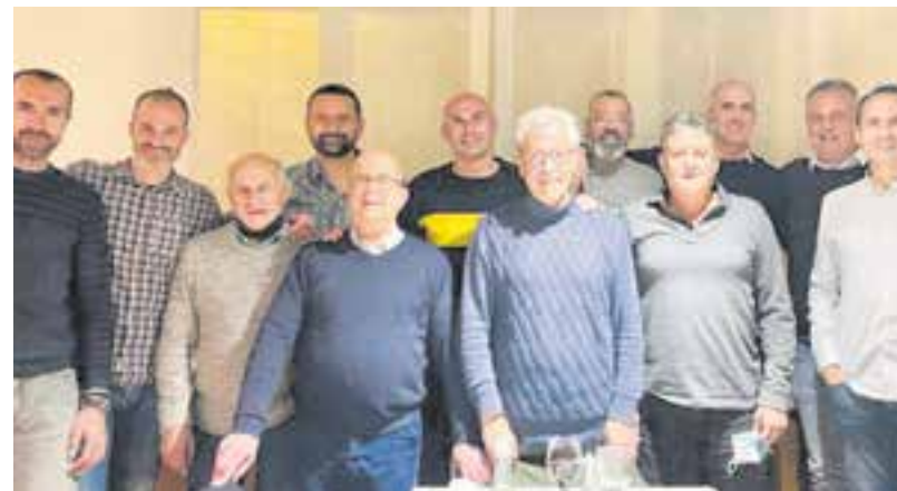
Els integrants del club durant els anys 90 es van reunir en un sopar. || CEDIDA

Pel que fa a l'àmbit esportiu, l'equip de Quim P. Alarcón ja prepara una nova jornada de Lliga, després de l'aturada pel pont. Després de dues jornades consecutives a casa i encara amb la victòria contra la Pia (70-69) present, l'equip visita la pista de Ciutat Meridiana, on disputa els partits el CB Sant Josep, un dels clàssics del bàsquet badaloní, apartat del seu mític pavelló per una presumpta operació immobiliària de l'arquebisbat, propietari dels terrenys on s'ubica la pista badalonina, on han jugat sempre. + || A. SAN ANDRÉS