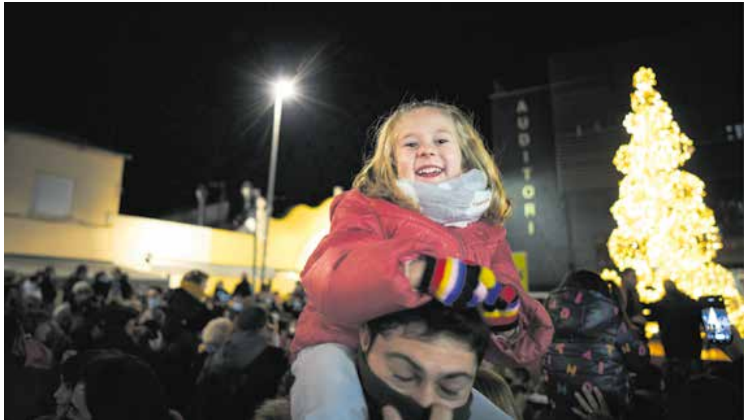
La gent que es va apropar a la plaça d'El Mercat divendres a la tarda va cantar el compte enrere per encendre els llums de Nadal dels carrers de Castellar.