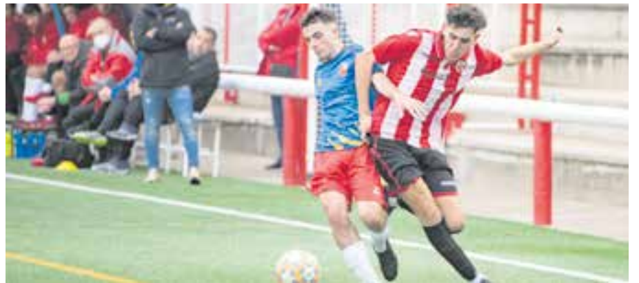
Nova cita al Joan Cortiella, aquest dissabte a les 16.30 h. || A. SAN ANDRÉS

La bona ratxa encadenada en les últimes tres jornades i la millora en el joc de l'equip, a més de la recuperació de les sensacions de jugadors com Marc Estrada de cara al gol, fan d'aquest un partit molt interessant, contra un dels rivals més clàssics de la categoria. D'altra banda, la Pirinaica visitarà Sallent i el Joanenc rebrà el Calaf. † || A. SAN ANDRÉS