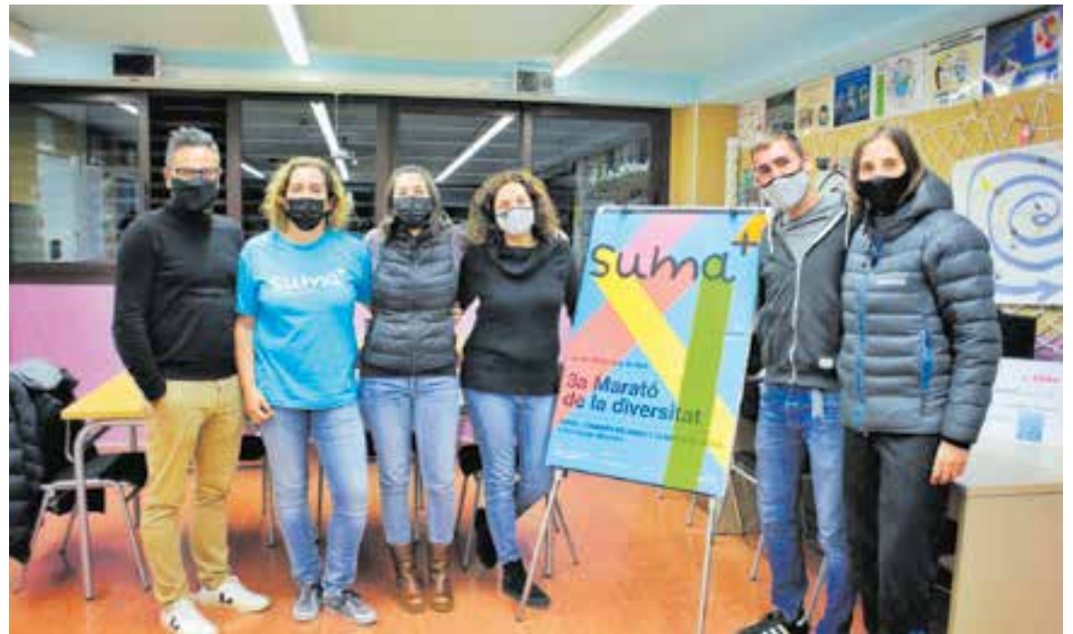
Diversos membres de l'equip organitzador de la Marató de Suma+ durant la presentació del cartell, dimecres passat

Una altra de les novetats que incorporarà la tercera edició serà Univers Suma+, una proposta que combinarà