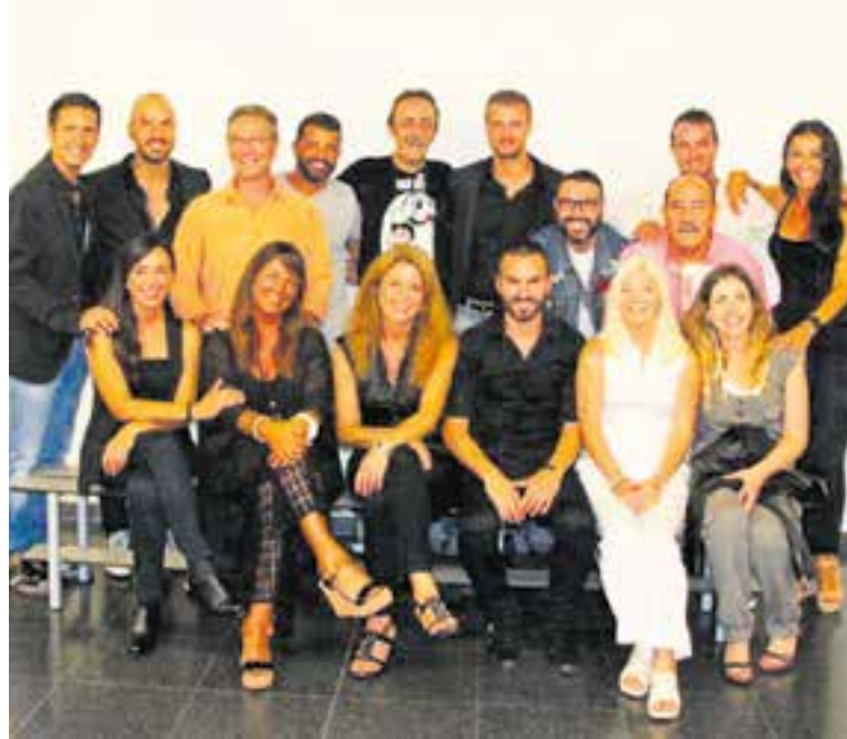
Equip de Plató 13, on es gestiona la plataforma Com el Vallès no hi ha res. || PLATÓ 13

A banda dels espectacles propis de Plató 13, a la plataforma Com el Vallès No Hi Ha Res també es poden trobar les ofertes de diversos