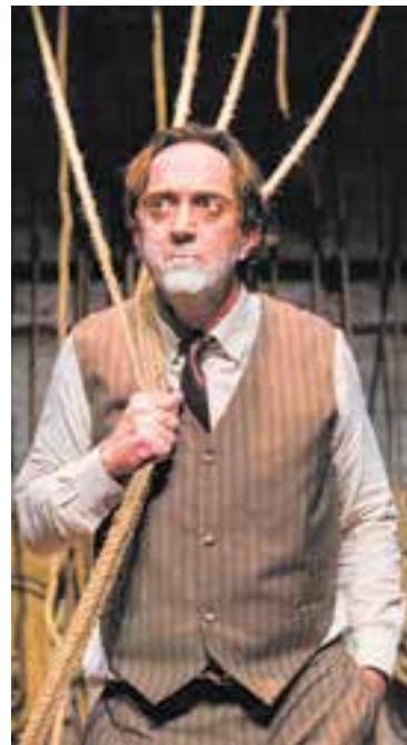
'Les croquetes olvidades', de Les Bianchis i 'Història d'un senglar' són dues de les proposades a l'Auditori Municipal.