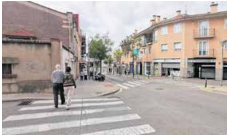
Les obres inclouen la millora de xamfrans com el de la imatge, al centre

El primer paquet d'actuacions començarà la setmana que ve a diferents carrers de l'Eixample, on s'ampliaran voreres, es millorarà l'accessibilitat i es renovarà l'aglomerat asfàltic de les calçades. Les obres d'aquests primers dies es localitzaran als carrers del Mestre Ros (entre Passeig i Roger de Llúria), del 14 d'Abril, de Girona, del Doctor Vergés i del Pont