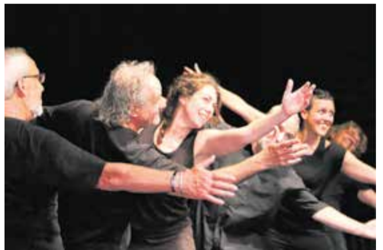
Moment de l'obra 'El retaule del flautista', de T.I.C. Escènic.