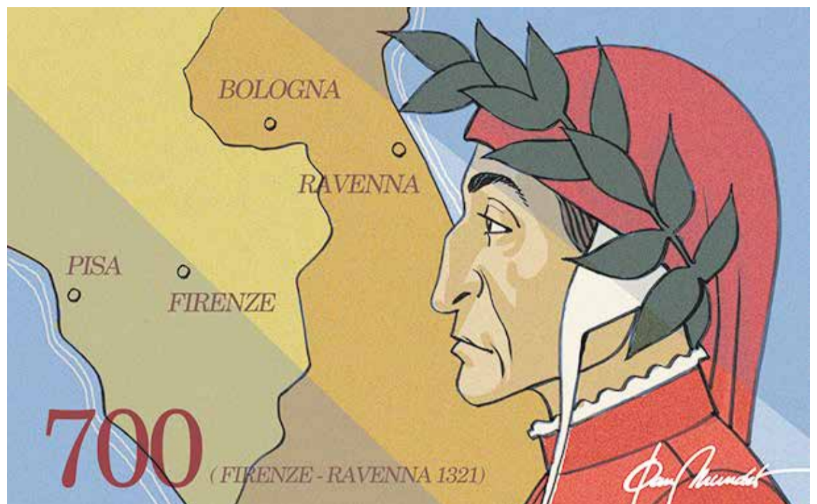
© Dante 700. | JOAN MUNDET

"Amb la Divina comèdia, Dante es convertia en el poeta més gran de tota l'edat mitjana"