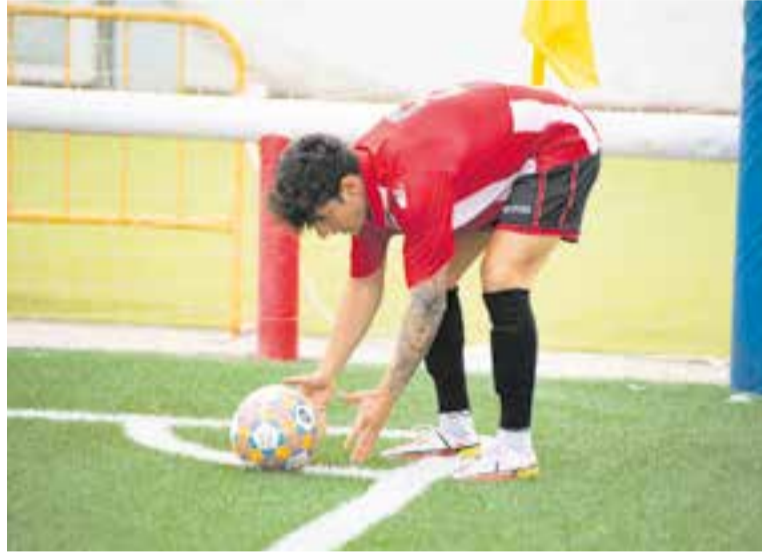
La pilota tornarà a rodar aquest dissabte (18.00 h) al Joan Cortiella. || A. SAN ANDRÉS

Després d'una bona pretemporada, que va finalitzar dissabte passat amb una victòria per 3-4 contra el Sabadell Nord, els blanc-i-vermells donaran el tret de sortida a la 2021-2022 enfrontant-se al sempre incòmode Sallent, un dels clàssics de la categoria. L'equip vol seguir amb la bona dinàmica vista durant el mes de setembre i sumar tres valuosos punts i arrencar amb embranzida en la tornada a la Lliga regular, que es preveu que serà força complicada en el sempre difícil grup IV de Segona Catalana. ✦ || A. SAN ANDRÉS