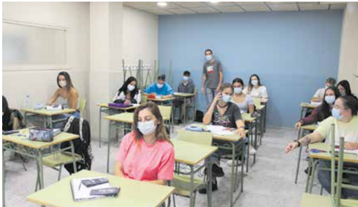
Una de les aules de l'Escola Municipal d'Adults dimarts al matí, plena d'alumnes.

L'oferta formativa inclou el cicle de formació instrumental, per arribar a una competència bàsica en lectoescriptura i càlculs elementals; ensenyaments inicials d'anglès, català i informàtica; el curs per a novinguts de castellà; literatura; necessitats educatives especials; el graduat d'educació secundària per a adults; el curs de preparació per a les proves d'accés a cicles formatius de grau mitjà i de grau superior i el curs de