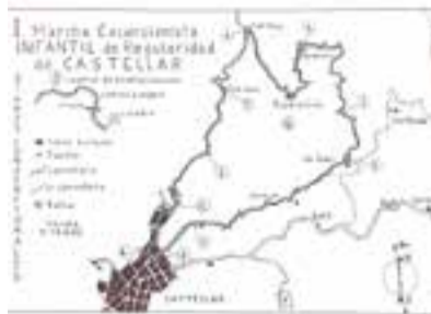
I Marxa Infantil de Regularitat, any 1961. || CEC