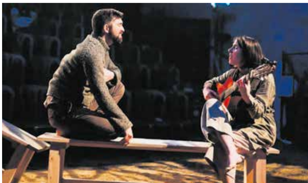
Moment de 'Canto jo i la muntanya balla', de La Perla 29, un muntatge que es podrà veure divendres.

'Canto jo i la muntanya balla' és una adaptació del llibre d'Irene Solà