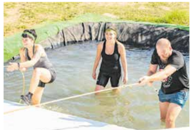
La Noob Race va garantir un matí de rialles i esport.