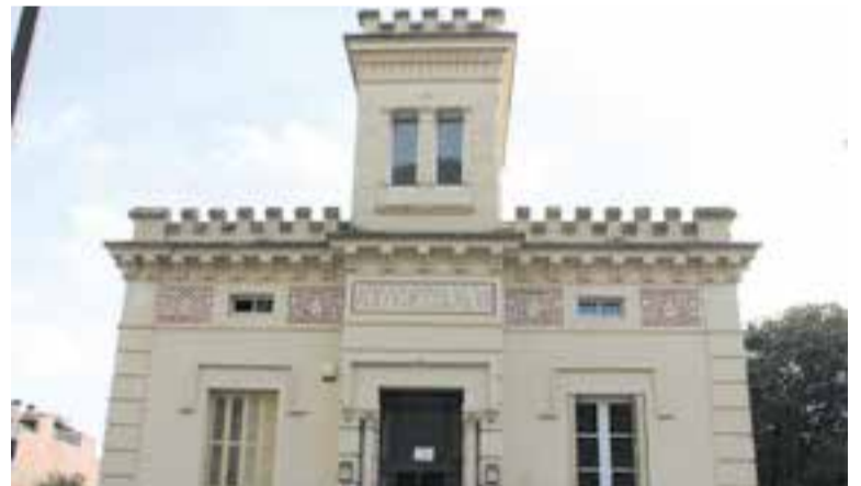
Façana de l'Escola de Música Torre Balada. || AJUNTAMENT

El nou curs també ha suposat la reactivació de l'orquestra sènior, que va quedar aturada l'any passat per la pandèmia. “Extracta d'una orquestra pensada per a gent més o menys gran que no ha fet mai solfeig i que té ganes de tocar un instrument, en aquest cas de corda” , assegura Sancho. ➔ || J. RIUS