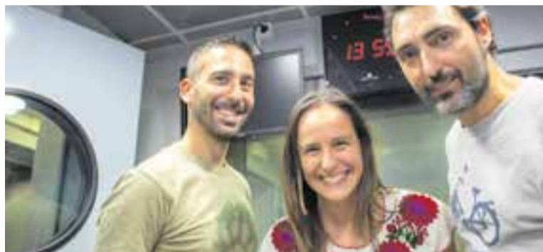
La graella incorpora programes nous: 'Amb sense embuts', 'El bar de abajo' i 'La redacció'.