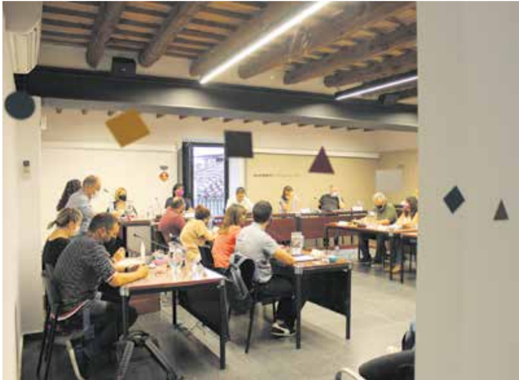
Porta d'entrada al saló de plens de Ca l'Alberola, que va acollir novament un ple 14 mesos després.