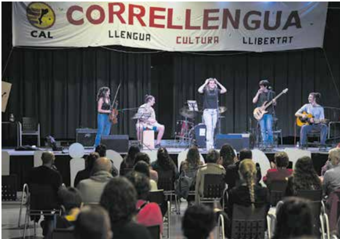
El Correllengua va comptar amb l'actuació del grup Lòxias, que enguany repeteix.