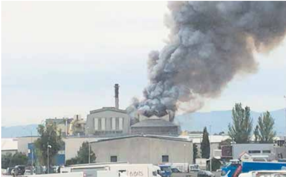
Les flames van generar molt de fum en un primer moment a l'incendi que va patir Vidrala divendres.

Divendres passat al migdia, Vidrala va patir un incendi al sostre que es va poder controlar de seguida però que va generar una gran fumera