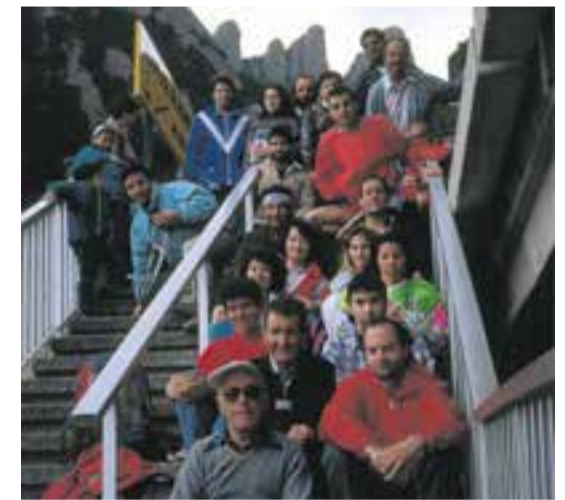
A dalt, integrants de la travessa del 2021 durant el trajecte. A baix, participants de la primera travessa, el 1991 (Arxiu Jaume Torrens). || CEDIDES

es va arribar al monestir al voltant de la una del migdia. Amb un total de 33 km de recorregut, els 25 excursionistes participants van retornar en els vehicles particulars aparcats dissabte a la tarda a Montserrat. En la segona edició van ser 15 els excursionistes (7 d'abril del 1991) i 25 en la tercera (12 d'abril del 1992). Va ser la quarta que va començar a despuntar en nombre, amb un total de 43, aquesta seria l'última en què es tornaria amb vehicles particulars. Des de llavors, la travessa només ha crescut fins a arribar al centenar de l'edició del 2021. +