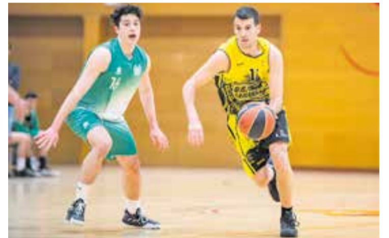
El CB Castellar no va tenir el seu millor dia a Montgat.