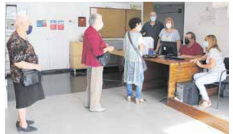
La junta del Casal Catalunya fent inscripcions per a les activitats.

De fet, hi ha tantes ganes que la junta s'ha vist desbordada per les inscripcions. "Cada dia tenim cua a les 16.30 h. Hem fet més de 200 inscripcions i a algunes activitats com ball en línia i punt de mitja i ganxet tenim llista d'espera. El problema és que hem hagut de reduir els grups per seguir les mesures de sanitat i els grups s'omplen de seguida. Grups que abans eren de 24, els hem hagut de reduir a 12" , detalla la presidenta. A banda de recuperar els tallers i l'activitat social del Casal, la idea també és reprendre els viatges. Per a la segona setmana d'octubre ja hi ha prevista una estada a Cambrils i hi ha una trentena de persones apuntades. D'altra banda, el Casal de la Gent Gran de la plaça Major encara romandrà tancat uns mesos perquè s'hi han de fer unes remodelacions. Una vegada acabades les obres, aquest espai central també oferirà activitats socials per a la gent gran de la vila. + || CRISTINA DOMENE