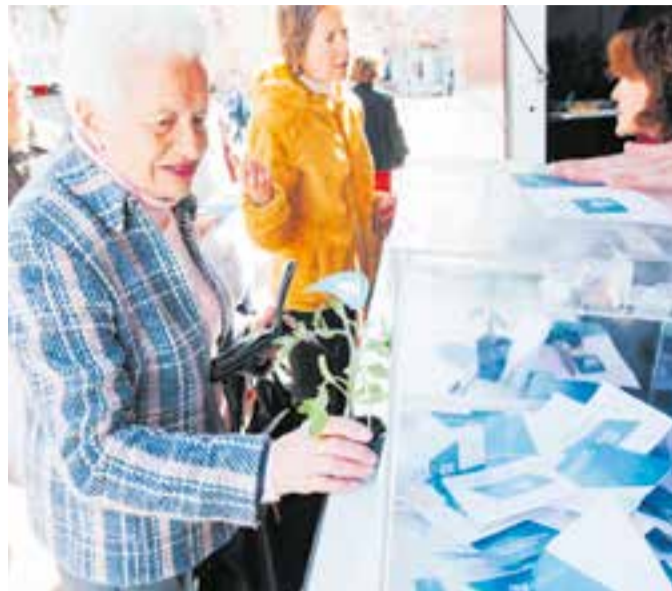
Imatge d'arxiu d'una votació anterior de pressupostos participatius.

Hi ha hagut una altra quinzena de propostes presentades a aquesta edició que no han pogut entrar en aquesta llista perquè no eren de competència municipal o bé perquè no s'ajustaven als requisits de les bases reguladores.