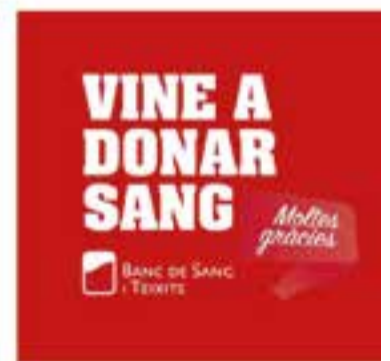
Banc de Sang i Teixits

+ INFO: www.castellarvalles.cat , www.comercastellar.cat