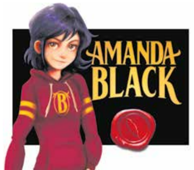
Per a infants, la col·lecció d'Amanda Black és molt recomanada.

En el terreny de la literatura infantil i juvenil apunten la col·lecció d' Amanda Black , de Juan Gómez-Jurado, i Els nens de la senyora Zlatin , de Maria Lluïsa Amorós. +