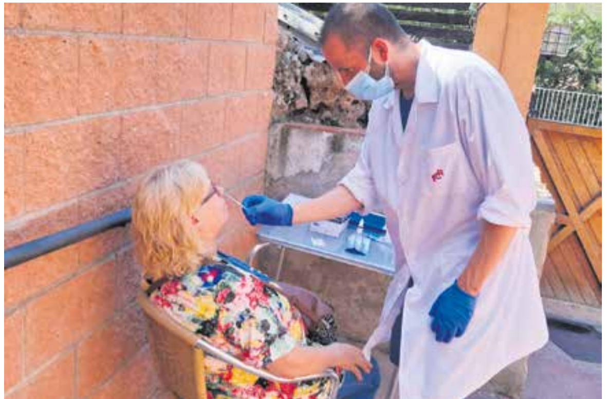
Test d'antígens a un familiar abans d'accedir a les instal·lacions de la residència de Can Font de Castellar.

Aquest escenari coincideix amb uns indicadors de la pandèmia que comencen a donar un respir després d'arrencar al mes de juliol amb una incidència altíssima de contagis que s'ha mantingut gairebé fins mitjans de la setmana passada. Tant el risc