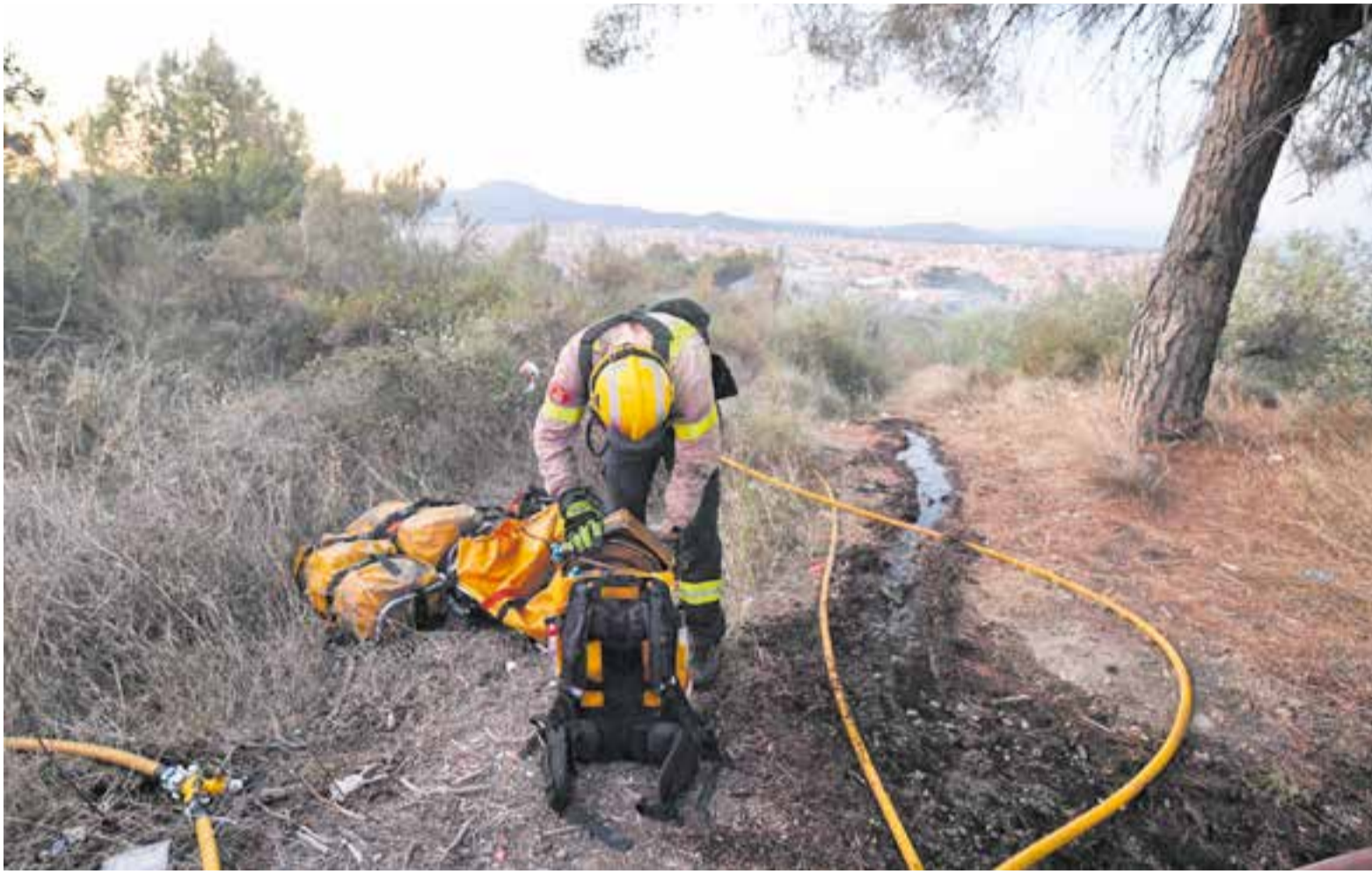
Un bomber voluntari del parc de Castellar fent tasques d'extinció del foc forestal de Terrassa, que va tenir lloc el 10 de juliol passat.