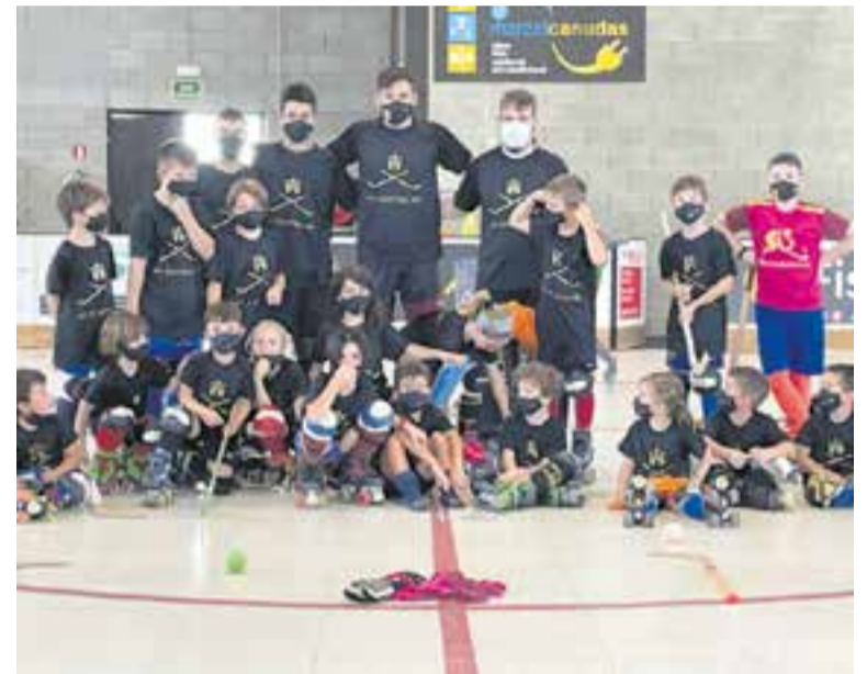
A dalt, participants en el campus del CB Castellar. A baix, els de l'HC Castellar.