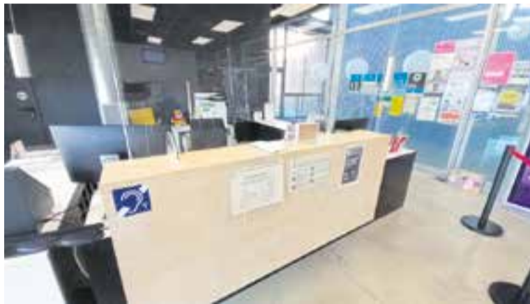
El bucle magnètic que s'ha instal·lat al mostrador del SAC.

El consistori ha triat com a projecte l'adquisició d'aquests aparells que fan que les persones usuàries d'audiòfons o implants de so puguin rebre un senyal d'àudio més net i nítid, sense soroll de fons, perfectament intel·ligible i amb un volum adaptat a les seves necessitats. Així, la recompensa obtinguda, d'un total de 1.200 euros, ha permès la compra de dos bucles magnètics: un que s'ha instal·lat al mostrador del Servei d'Atenció Ciutadana d'El Mirador i un altre que s'ha col·locat al mostrador de la Regidoria d'Atenció Social, a l'Espai Tolrà. A més, la Regi-