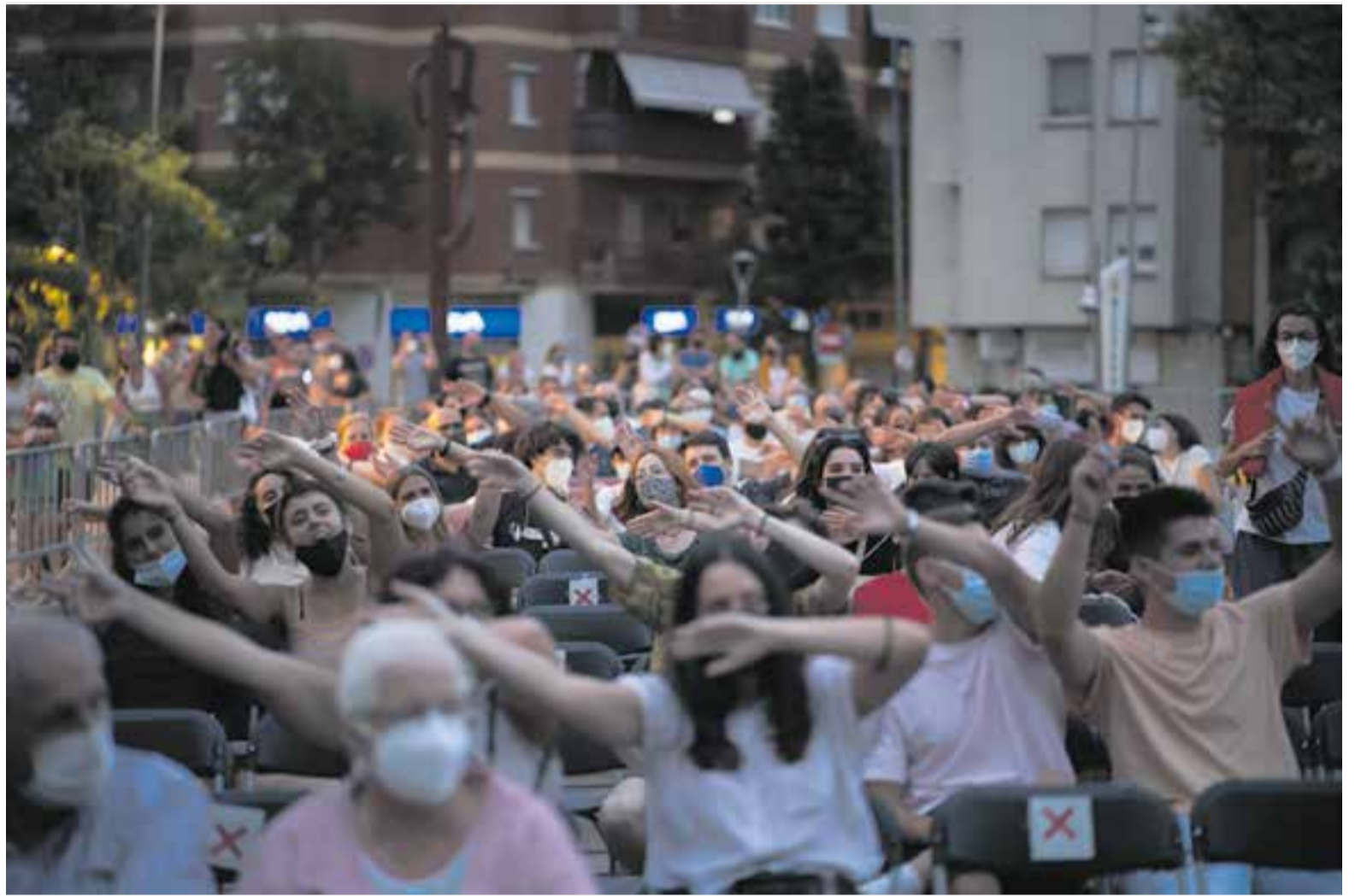
La majoria d'actes de la Festa Major tindran un format similar a les Nits d'Estiu: públic assegut i limitació d'aforament. A la imatge, el concert de diumenge de Ginestà.

Sobre la decisió de no publicitar ara ni la imatge de la festa ni els principals continguts, la regidora de Cultura comenta que han volgut ser "cautelosos i prudents i per això hem decidit esperar fins a finals d'agost, a veure com evolucionen les dades d'aquesta cinquena onada, per poder explicar detalladament com serà la Festa Major" .