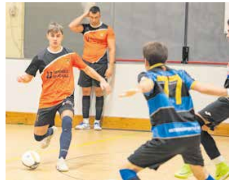
Àngel Olivares va tornar després d'una sanció de dos partits. || A. SAN ANDRÉS

A favor dels castellarencs jugarà que l'equip rival ja està descendit matemàticament i sobre el paper; els de Jiménez han de ser molt superiors. ➔ || A. SAN ANDRÉS