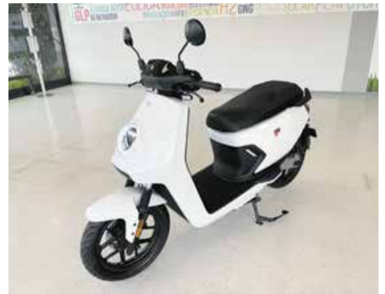
La Niu elèctrica és un vehicle ideal per circular per poblacions urbanes. || A.S.A.

Respecte als acabats, aquests superen el de motos del mateix segment i es veuen prou robustos pel ritme del dia a dia. El preu parteix dels 3.599 €, un dels punts forts de la marca, ja que a aquest se li ha de restar les ajudes disponibles per la compra de vehicles elèctrics. ✦ || A.SAN ANDRÉS