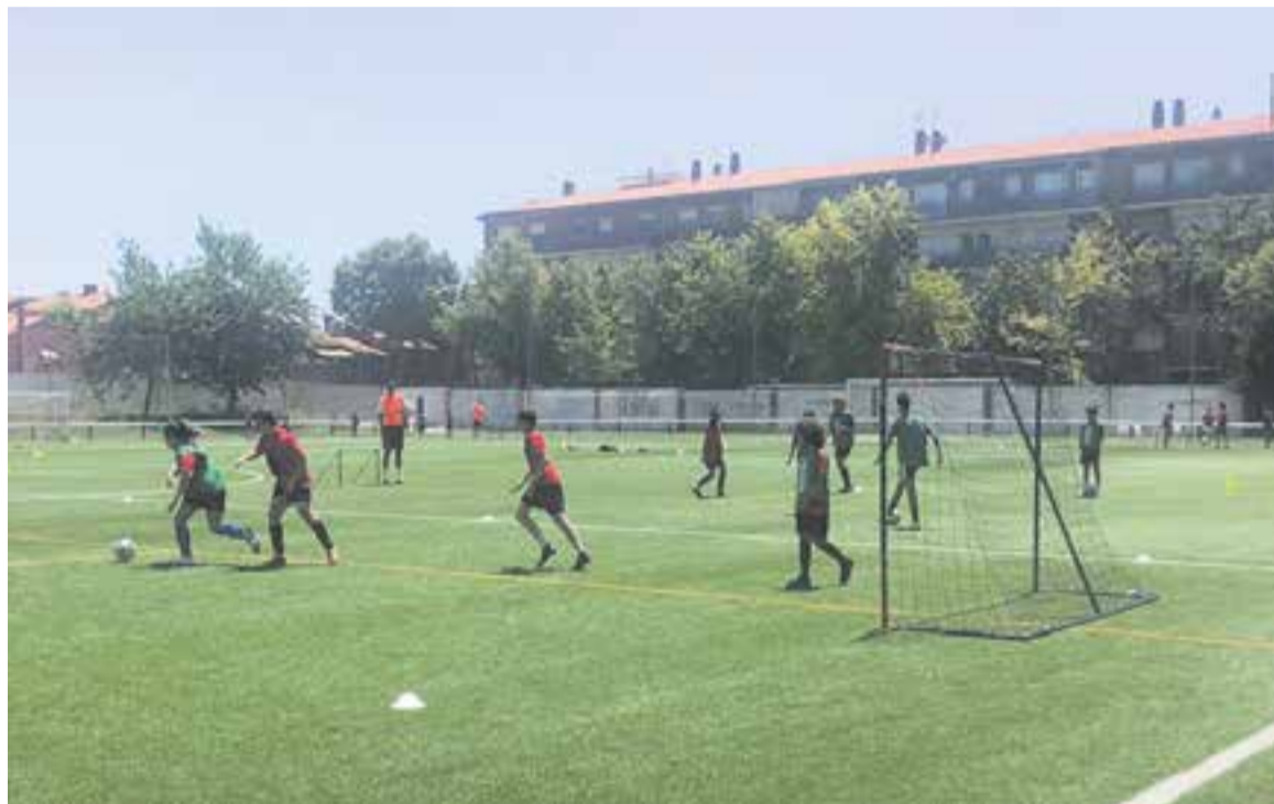
Imatge del campus de Xavi Hernández del 2020, sobre la gespa del Joan Cortiella.

Les estades futbolístiques són potser les més antigues en aquest aspecte. Sent l'esport rei al país, el futbol no pot deixar d'oferir aquesta opció, tot i que la pandèmia ho ha complicat. Des de la UE Castellar es compta, des de la temporada passada, amb l'organització del Campus de l'exblaugrana Xavi Hernández, Castellar és una de les 10 seus en territori català. Amb un horari de 9 a 14 h, el campus dura les quatre setmanes de juliol, i s'hi es podrà perfeccionar la tècnica futbolística al Joan Cortiella. La metodologia es basa en "eines futbolístiques adaptades al nivell dels jugadors, treballant les diferents situacions del joc per arribar a entendre el futbol i desenvolupant els diferents elements tàctics i tèc-