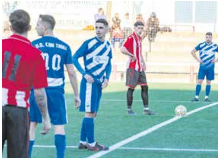
El futbol tornarà al Joan Cortiella amb els vuitens de la Copa. || UE CASTELLAR.

El club blanc-i-vermell és un dels favorits per a la victòria final i arriba com a únic equip que no ha perdut cap punt en la competició. El partit es disputarà aquest dissabte a les 18:00 h al Cortiella, amb entrada gratuïta. ➔