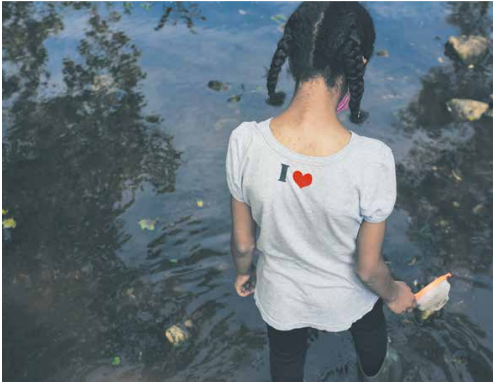
Una jove participant en el taller per descobrir els macroinvertebrats, la flora i els rastres de fauna del tram del riu proper a Can Juliana, a la Festa del Riu al maig passat.