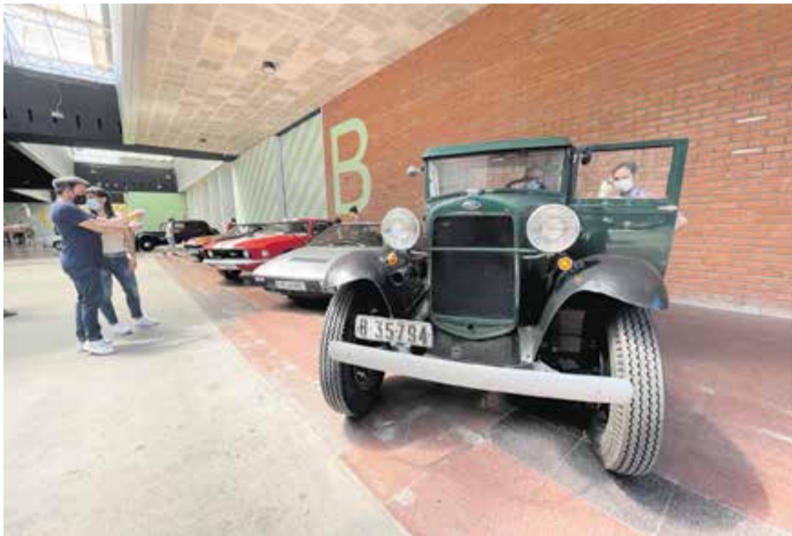
L'Espai Tolrà va acollir una vegada més cotxes d'època amb un objectiu solidari.

Diumenge la FECEC va organitzar una concentració de cotxes d'època