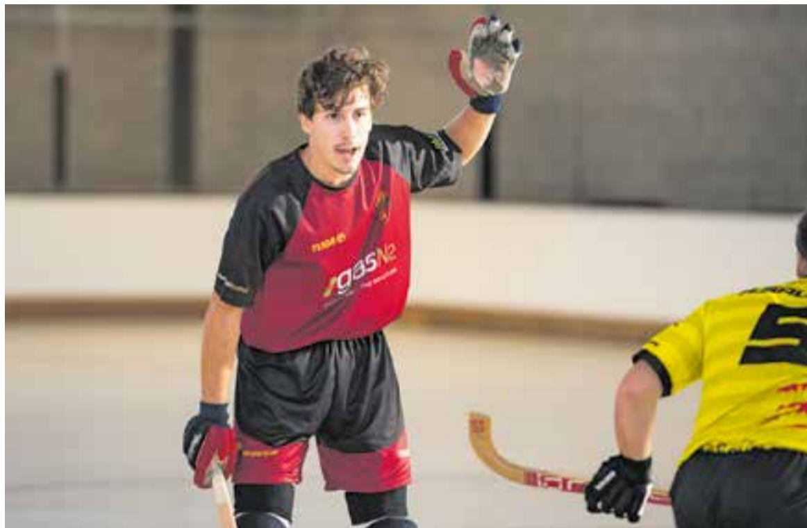
Tot i la contundent victòria contra el CH Cadí, l'empat entre el Masquefa i l'Alpicat va deixar en res les aspiracions grana.