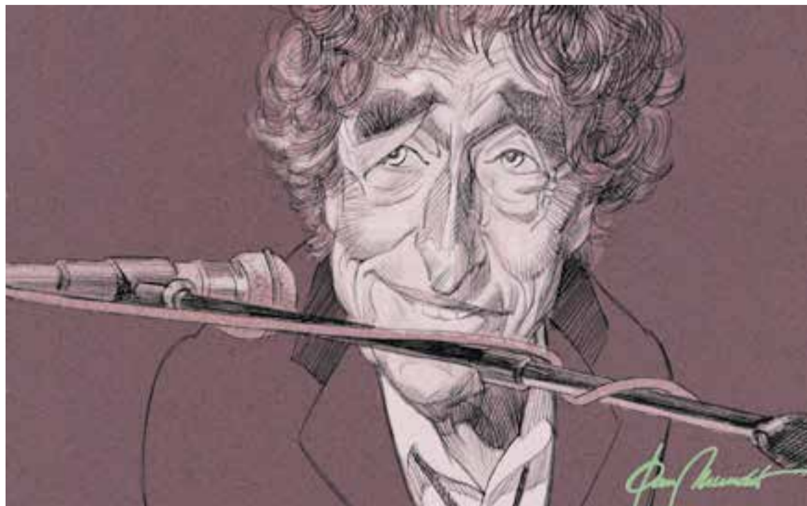
© Talking Bob singing Dylan.

bocada i amfetamínica creativitat. Malgrat la seva importància, Dylan no és un cantautor protesta. I si ho va ser, se'n va cansar prou ràpidament. No estava content amb el fet que se li hagués fet la veu d'una generació rebel i renovadora, ho explica en les seves memòries “Cròniques” (2004) dient: “Em posava malalt la manera en què subvertien les meves lletres i extrapolaven el seu significat a conflictes interessats, així com el fet que m'haguessin proclamat el gran Buda de la revolta, el gran sacerdot de