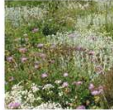
INS Les Garberes i Assoc. L'Era