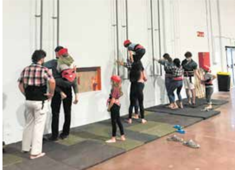
Assaig de la canalla dels Capgirats. || CAPGIRATS

Els Capgirats afronten aquest retorn a l'activitat amb cautela però amb l'esperança de poder anar normalitzant la situació i d'aconseguir recuperar les ganes de fer l'aleta de tots els antics membres de la colla i dels que s'hi sumin a partir d'ara. ➔