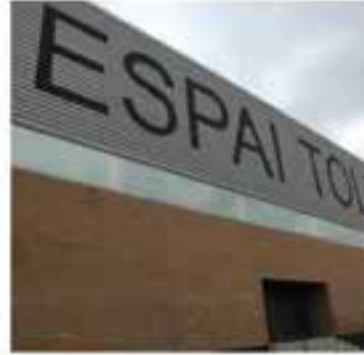
Amics del Ball de Saló

+ INFO: tel. 677372282, a/e sonaswingcastellar@gmail.com