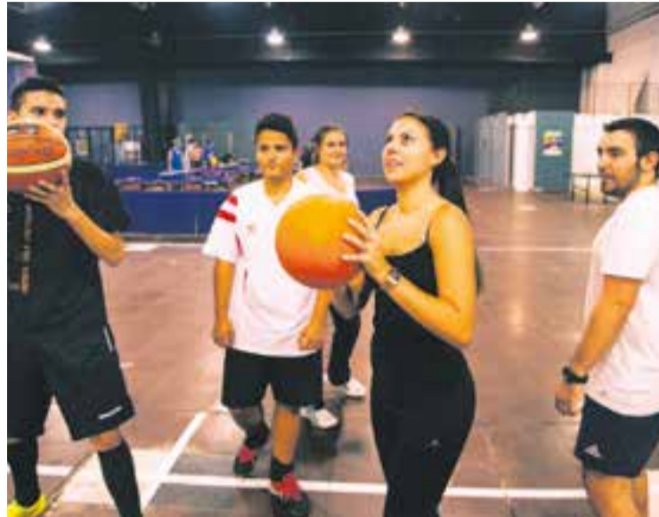
Activitat esportiva de la setmana jove, en una imatge d'arxiu.