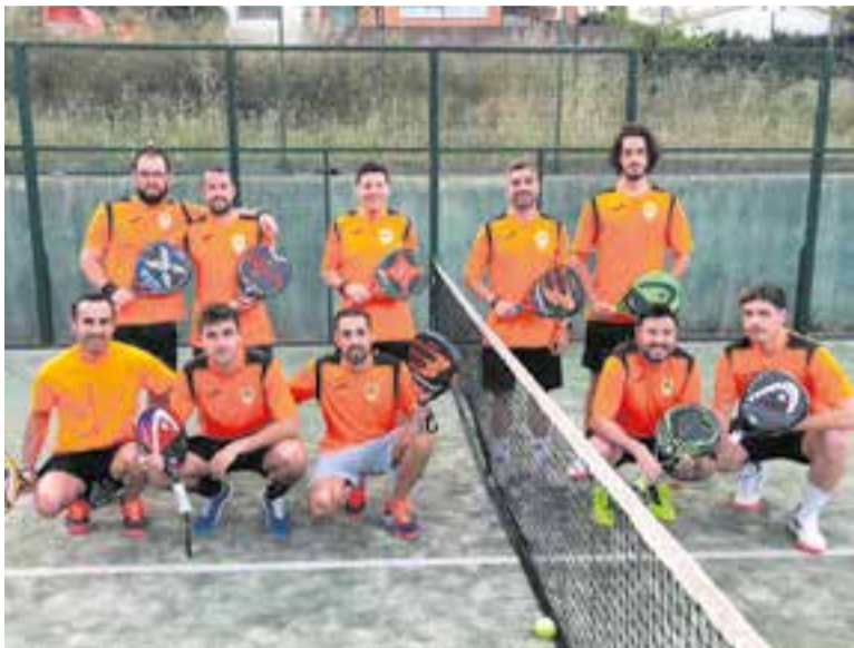
Els integrants de la secció de pàdel a les pistes de Racó Esports.