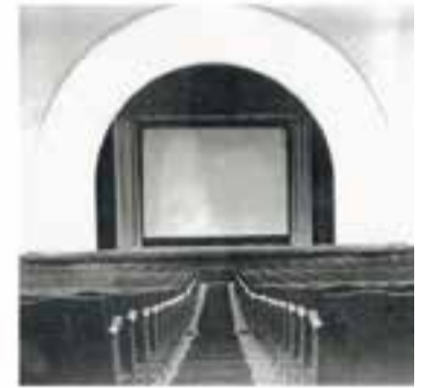
CCCV i Centre d'Estudis de Castellar

+ INFO: www.associaciolera.org , tels. 938787035 i 672337305