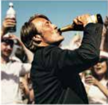
Club Cinema Castellar Vallès