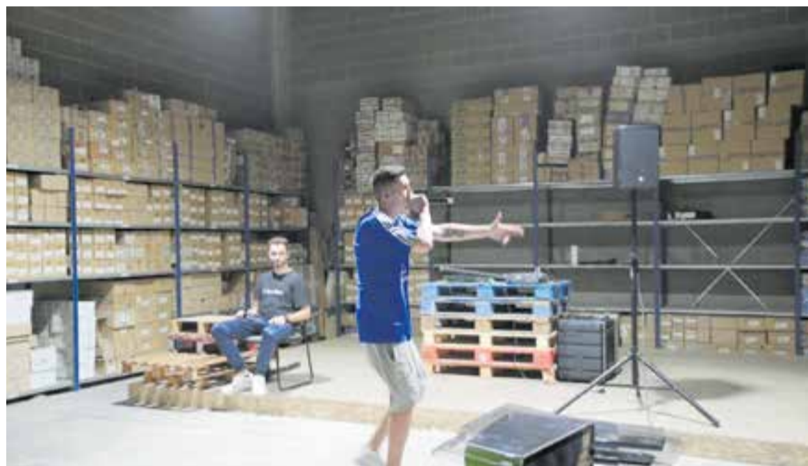
Assaig del grup sabadellenc 31FAM a la planta baixa de PICAP.

Amb tots els artistes han tingut tracte personal. Per exemple, amb Compay Segundo, Omara Portuon-