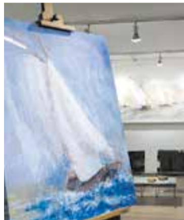
Obra d'Aguilar.

rani i nàutic clàssic. És un escenari que ell ha viscut des de petit. “Vaig viure a Mataró i estíuejava a Platja d'Aro i sempre hi he estat molt vinculat. De fet, navego i m'agrada molt, on sento més pau és quan soc al mar i pintant” . La tècnica utilitzada són les aiguades amb oli i acrílic sobre llenç. “Últimament estic pintant força fars amb el mar amb temporal, on s'aprecien onades de grans dimensions estave-