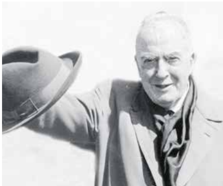
La Biblioteca Municipal Antoni Tort també commemora l'Any Carner.