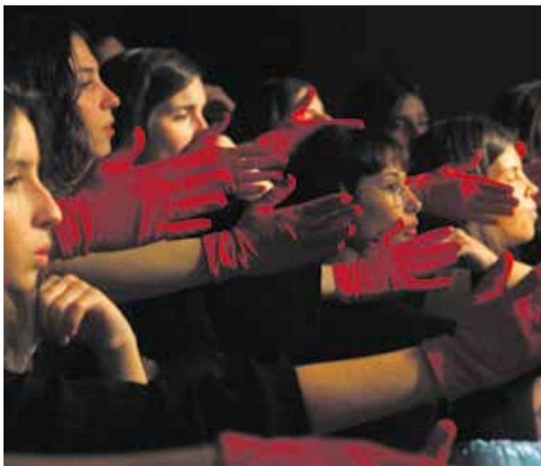
Moment de l'espectacle 'Escolta les estrelles' de SOM-night i El Cor de la Nit.

una trobada del petit príncep, que resta perplex pel que fa al comportament absurd de les persones grans. Cadascuna d'aquestes trobades pot ser llegida com una al·legoria. L'autor recomana conservar dins nostre el nen o nena que tots hem estat, mantenir l'afany pel coneixement, la imaginació i la senzillesa de cor pròpies de la infantesa. L'obra ha esdevingut un èxit editorial i un dels llibres més traduïts al món. També se n'han fet musicals. ✦