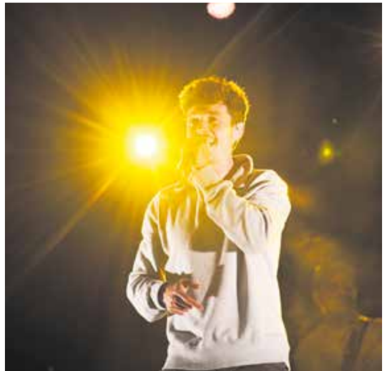
L'eurovisiu Miki Núñez va fer gaudir els espectadors amb el seu repertori pop.