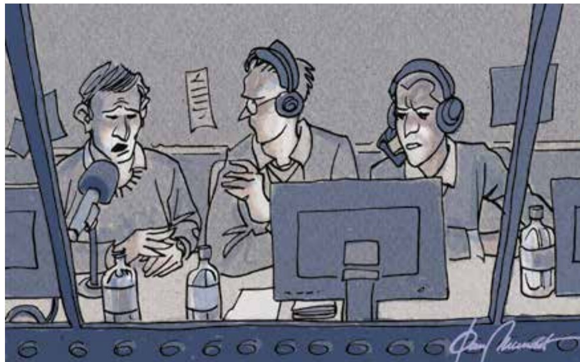
© Poch és Poc. || JOAN MUNDET

"Quan hem intentat fer-nos escoltar a grans crits sempre ho hem tingut malament"