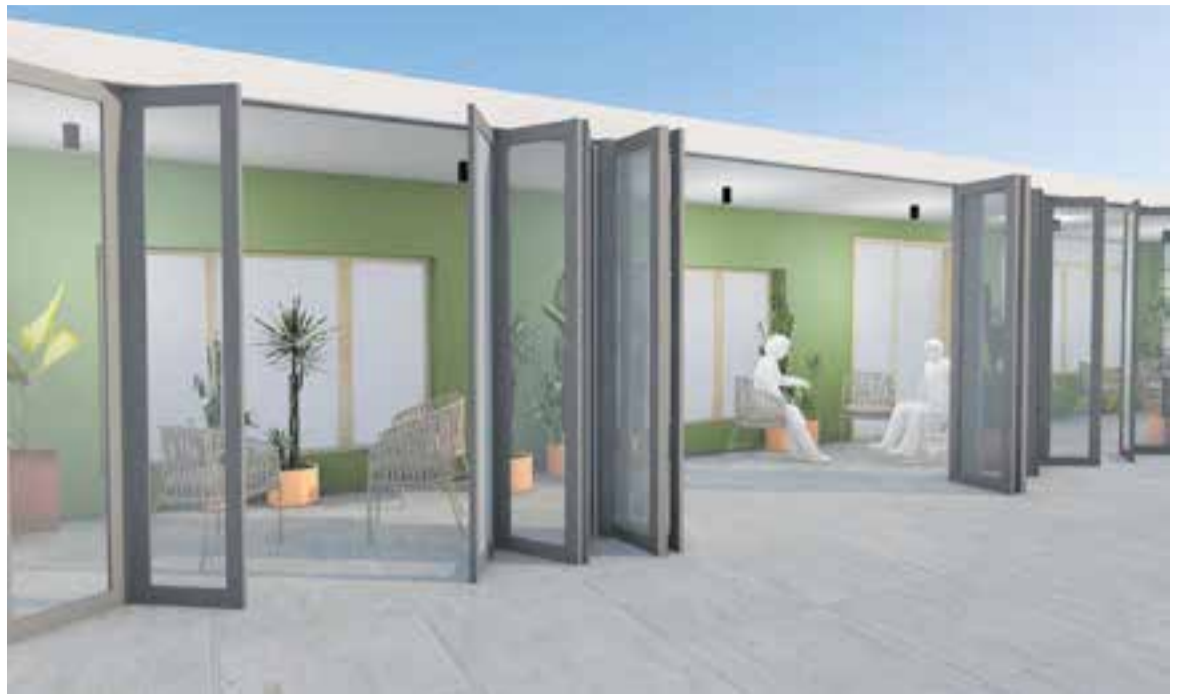
Recreació del porxo amb tancament practicable que es vol posar a l'exterior del casal perquè s'integri a l'exterior. || AJUNTAMENT

La Regidoria de Cicles de Vida està treballant per integrar el municipi a la Xarxa Mundial de Ciutats Amigables amb la Gent Gran (Age-Friendly