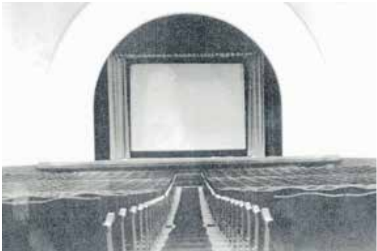
Imatge d'arxiu del Cinema Califòrnia de Castellar del Vallès.

El CCCV i el CECV-AH col·laboren per a una revista dedicada al setè art