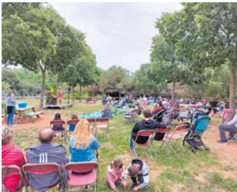
Assistents a l'activitat Viu el Parc, de diumenge passat.