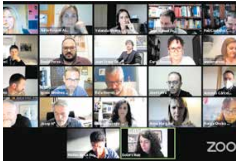
El ple de maig també ha estat virtual, la tònica des del setembre passat.