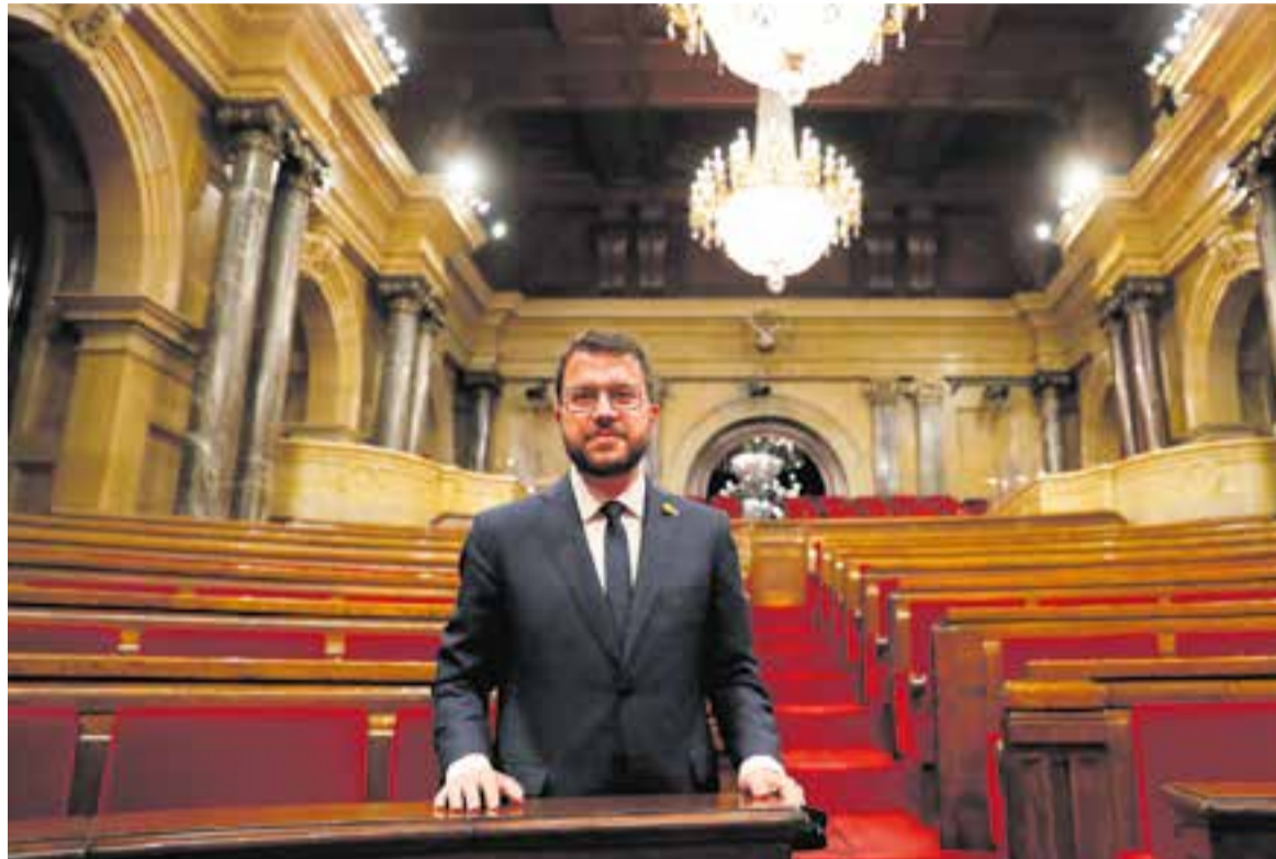
Pere Aragonès al Parlament poc després de ser investit nou president de la Generalitat, el 13è.

“És un acord totalment necessari i que l'independentisme i el país necessitaven més que mai. No és un acord perfecte des del punt de vista que defensem des de Junts per Catalunya. És fruit d'un diàleg i en les negociacions tothom ha de concedir una part del seu pla ideal. Garanteix un govern de Catalunya independentista que posa rumb cap a la independència i, per tant, les nostres línies vermelles en el terreny nacional es veuen respectades en aquest acord. Alhora teixeix tota una sèrie d'elements que són fonamentals perquè Catalunya pugui fer front a la crisi