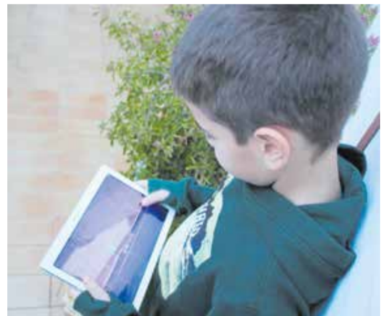
La pandèmia ha augmentat la quota de pantalla dels infants. || ARXIU

en el diàleg familiar", detalla. "Amb la confluència de tots els adults i els infants a casa, és molt important que es mantinguin aquestes fronteres. No podem dedicar tot el temps d'oci a la pantalla", afegeix. "Hi ha una certa fascinació tecnològica que fa que incorporem més aparells a menor edat. Hem d'adoptar una postura més crítica, aplicar filtres, i buscar un valor afegit en la tecnologia. Ens hem acostumat a fer servir la tecnologia en situacions en què és redundant i supèrflua", assevera. Ara bé, l'estiu pot ser un bon aliat per a les famílies en la desescalada digital. El bon temps, les vacances i les activitats a l'aire lliure, conviden els infants i adolescents a apartar la mirada de la pantalla, i establir nous vincles més enllà de les xarxes socials. || ROCIO GÓMEZ