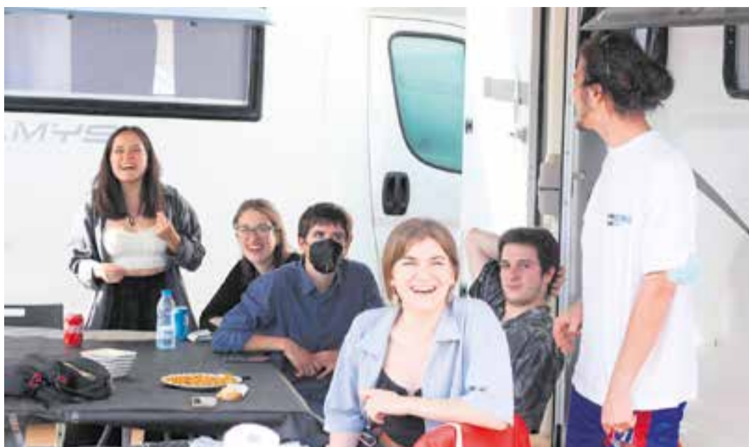
El grup Lòxias es prepara al 'backstage' abans del concert de divendres passat, on van ser teloners d'Els Pets.