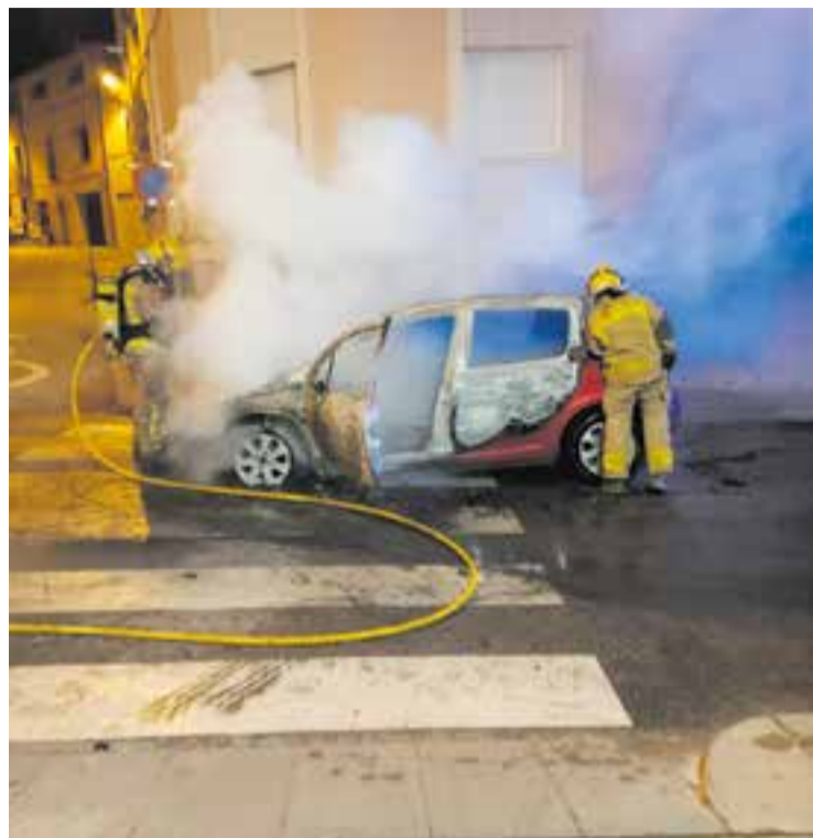
Els bombers apaguen el foc del cotxe que va cremar al Passeig Tolrà.