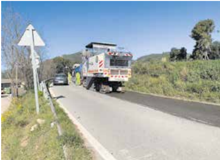
Primer treballs d'asfaltat a les obres de la C-1415a, al terme de Sentmenat.

L'objectiu d'aquesta reforma és afavorir la seguretat i la comoditat de la conducció a partir de la realització de millores en el ferm, la senyalització, l'abalisament, el drenatge, les barreres