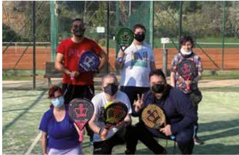
El pàdel, al Club Tennis Castellar, és una de les activitats de Suport Castellar.

La situació de la salut mental provocada per la Covid-19 i pels mesos que arrosseguem de pandèmia ens està fent veure que la salut mental s'ha de cuidar tant sí com no: "Tenim l'oportunitat que moltes més persones s'adonin de la importància de cuidar la salut mental, que és per allò que la nostra entitat treballa des de fa més de 20 anys, per la visibilització de tota aquesta problemà-