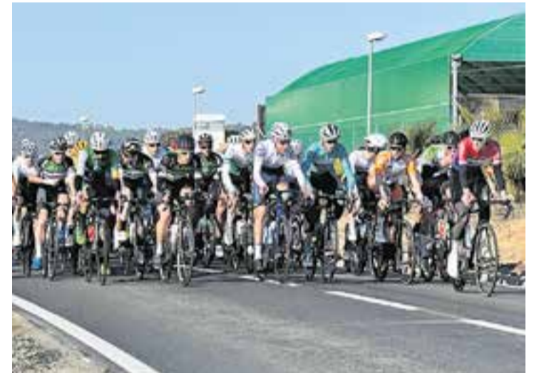
La 91a edició del Campionat de Sabadell, al seu pas per la C-1413A.

Pel que fa a la Volta a Catalunya, la 6a etapa passarà per Castellar el disabte 27. Les persones que vulguin fer de voluntàries es poden adreçar a la Regidoria d'Esports trucant a l'Ajuntament (93 714 40 40). +