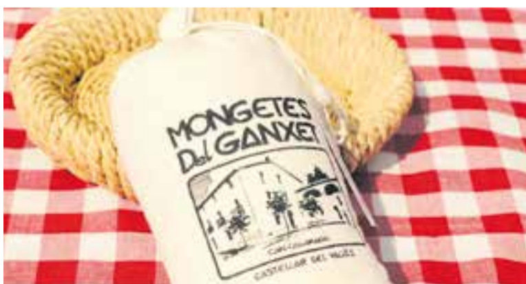
Imatge d'un sac de mongetes del ganxet de Can Casamada.