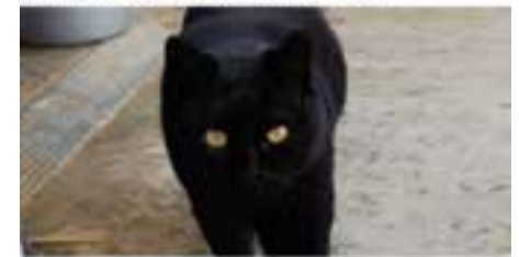
NEREO / Raça: europea · Mascle · Pèl curt En adopció des de juliol de 2020