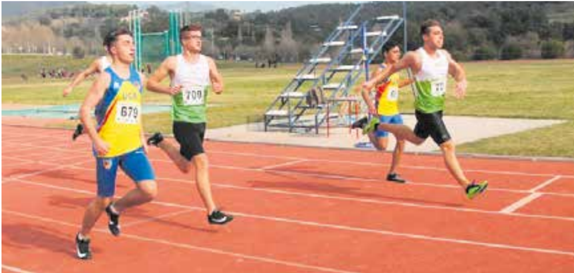
Atletes del CA Castellar en el control de fa unes setmanes a les pistes d'atletisme de la vila.

El CA Castellar segueix progressant al control del Serrahima