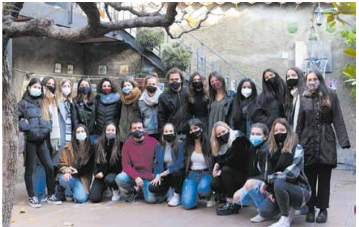
Foto de família de totes les fruites que han estat al capdavant de Macedònia, a més de dos dels músics. || MACEDÒNIA

Cada generació ha triat les cançons que li venia de gust cantar. “En algunes, coincideixen amb els ‘hits’ que van marcar l'època d'aquella generació, però en d'altres, no” . En tot cas, el públic podrà sentir totes les cançons que més han sonat de la banda.