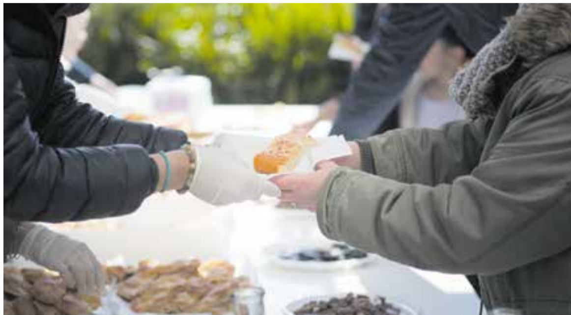
Tot i celebrar-se la Fira de Productes Artesanals, enguany no es podran fer els tradicionals tasts de coca i de crema.

Quant a la Fira de Productes Artesanals, es prendran totes les mesures per preservar la seguretat dels