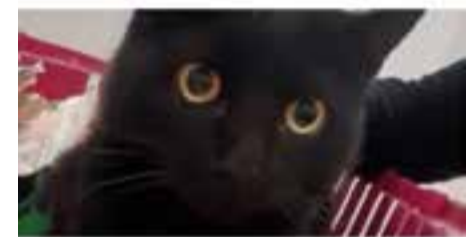
AHAB / Raça: europea · Mascle · Pèl curt En adopció des de febrer de 2021

No compris, adopta. 29 gossos i 51 gats t'esperen.