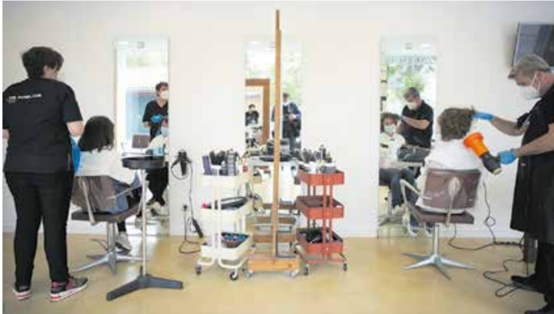
El centre castellanenc De Pablos està considerat microperruqueria perquè hi treballen menys de 5 persones.