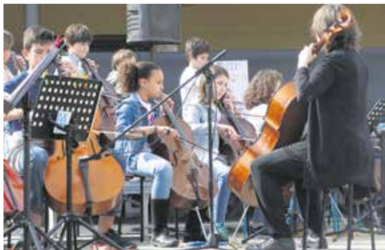
Els Petits Concerts de Sant Josep tindran lloc entre el 19 i el 21 de març.

Lletres que el jovent va transformar en èxits i que va aprendre's de memòria per fer-se-les seves. Les últimes fruites, la Noa, la Carlota, la Mar, la Gina i l'Anna, diran adeu al costat de totes les altres fruites que les han precedit i que, com elles, han triomfat a dalt de l'escenari en cada indret on han actuat. +