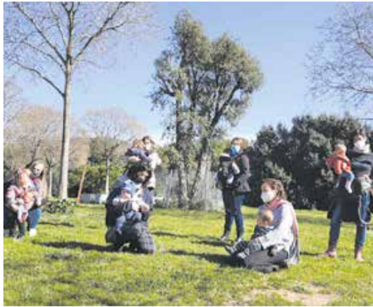
Criem Castellar demana un espai municipal per trobar-se. || @CRIEMCASTELLAR

Criem Castellar, que es va constituir el juliol del 2018, vol posar en valor aquest treball de cures, la importància de fer tribu, però també visibilitzar quina és l'altra cara de la maternitat, la que no s'explica. Per