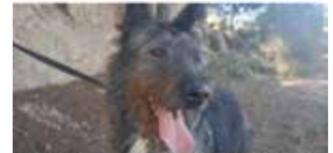
LARRY / Raça: creuada · Mascle · Pèl curt En adopció des de desembre de 2014 (adopció solidària – sense cost)