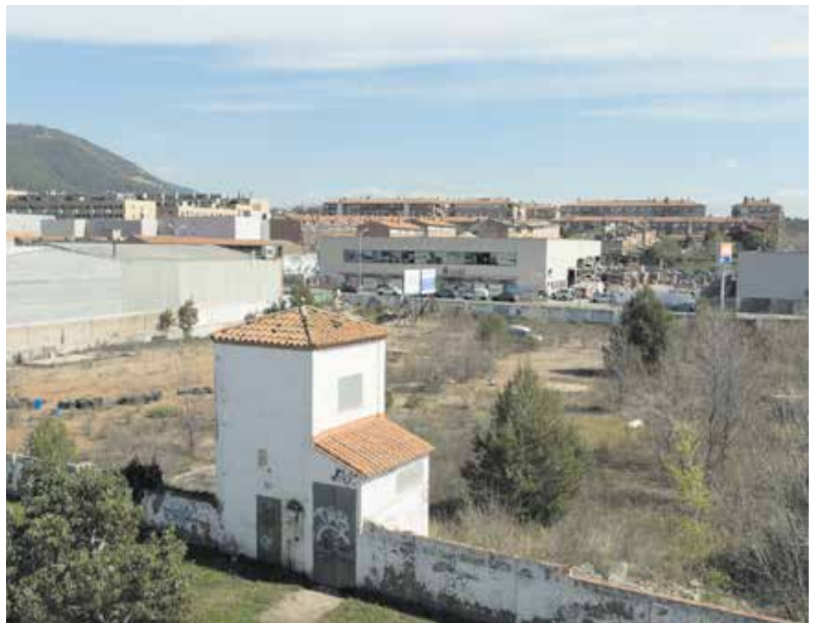
Una vista aèria de dimarts passat del solar de la Playtex, on encara es pot veure un edifici dempeus de l'antiga nau. || M. MACIÀ

xin de Castellar, que una persona que s'hagi separat tingui dificultats per accedir a un habitatge, o que una persona gran que s'hagi quedat sola no pugui accedir a un pis d'acord amb les seves necessitats" , afirma González. En aquest sentit, les noves llars projectades a l'antiga Playtex tindrien entre una i tres habitacions, i així donarien resposta a les diferents tipologies d'unitats familiars.