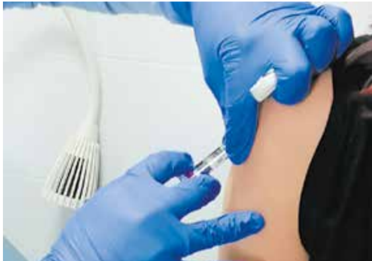
Vacunació al CAP de Castellar, en una imatge de la setmana passada.

Tot i això, la velocitat de reproducció de la malaltia (Rt) és d'1,68 i, per tant, en ser superior a 1, un contagi pot encomanar el virus a més d'una persona. A un any de la proclamació de l'estat d'alarma per la pandèmia, Castellar ja acumula 1.435 contagis i en aquests moments