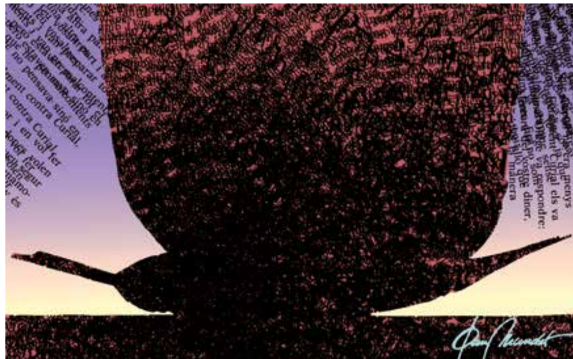
© L'abús d'adjectius ofega l'escriptura. || JOAN MUNDET

No cal que cada paraula dugui un adjectiu perquè al final el text quedaria molt pesat