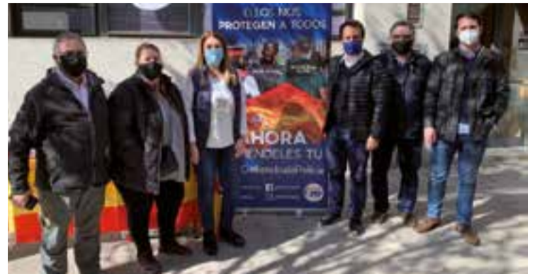
Carpa del PP de Castellar, al carrer Sala i Boadella, dissabte passat.