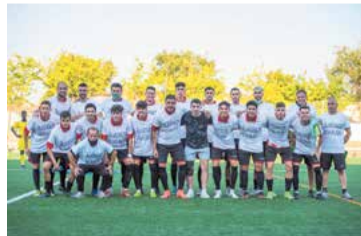
Dissabte, l'equip va donar el seu suport a Ruano, amb els encreuats trencats. || A.S.A.