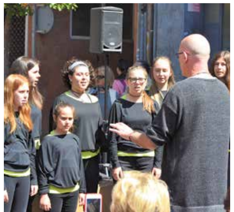
El Cor Sant Esteve, en una de les seves actuacions passades.