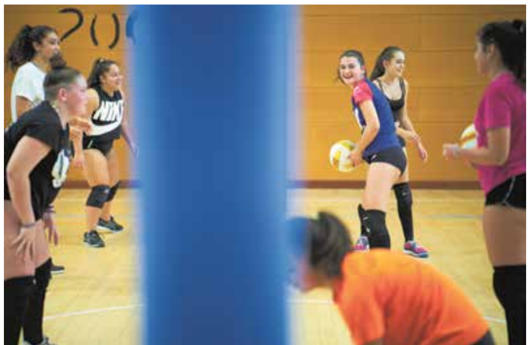
Diverses joves durant un entrenament de voleibol al pavelló Puigverd, aquesta setmana.

L'hoquei patins també patirà les mesures restrictives al Dani Pedrosa i ja s'han habilitat diferents portes d'entrada i sortida per no fer coincidir els diferents equips.