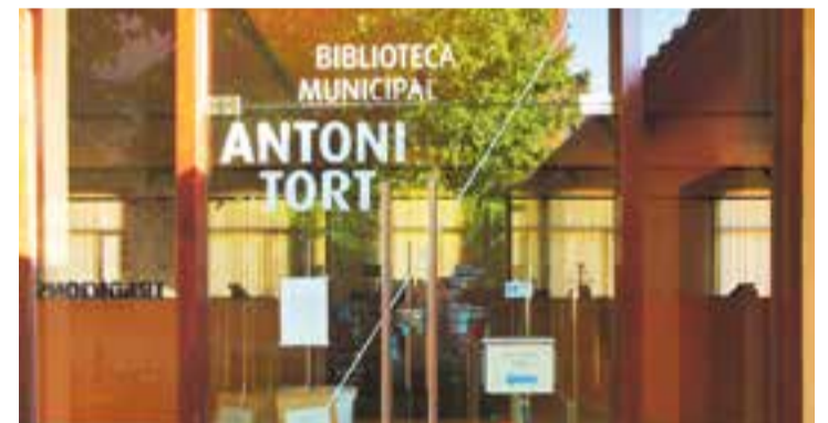
Entrada a la Biblioteca Municipal Antoni Tort.