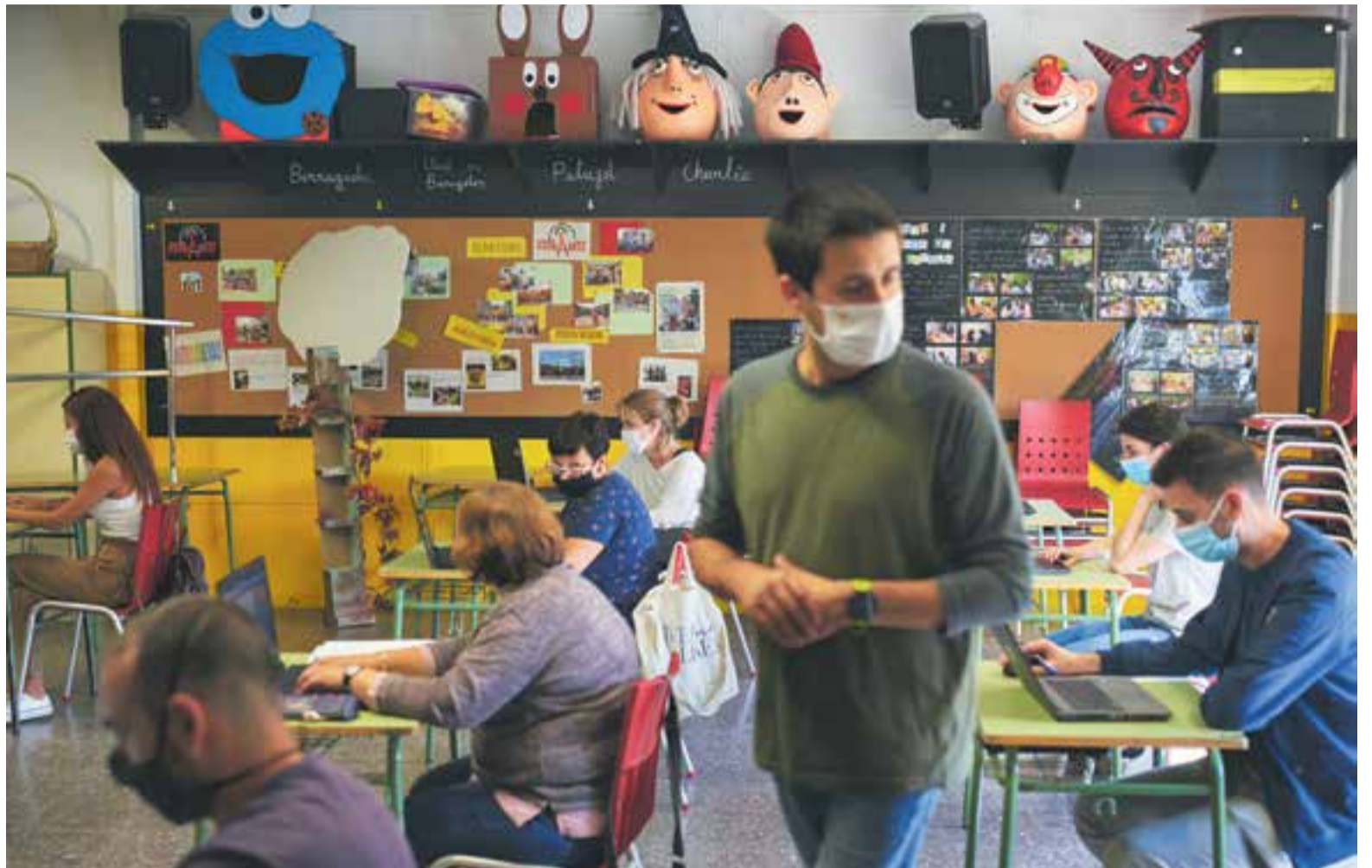
Mestres treballant a una de les aules de l'Escola Sant Esteve en una imatge de dimarts passat.

El Joan Blanquer només té dos accessos i això dificulta les entrades, per aquest motiu han fet tornos, a les 9 i 9.10, i les recollides seran igual, a les 12.30 o a les 12.40, i el mateix a la tarda. De P3 fins a 2n entren a les 9 i de 3r a 6è, a les 9.10. Està tota l'escola amb cercles perquè cada grup ha de fer la filera fora del recinte. “L'equip ens esperem en aquestes portes, i hem habilitat una altra que era de l'AMPA i estarem allà amb el gel, el termòmetre i unes catifes amb dissolució. A cada hora en punt obrirem les finestres per ventilar, hem assignat un lavabo per a cada grup