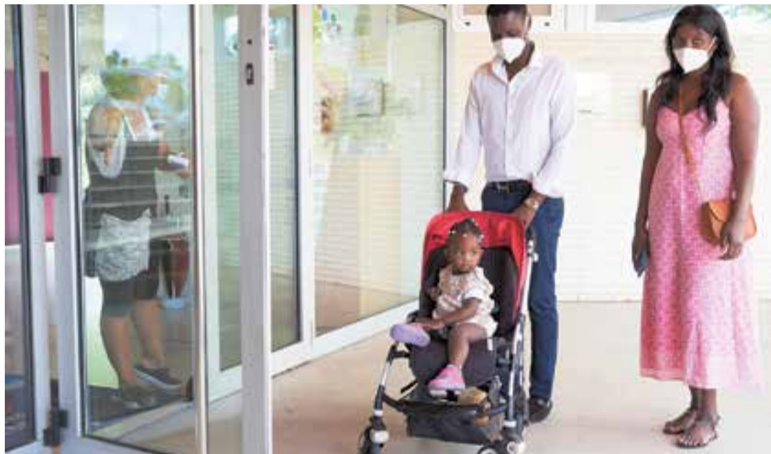
Accés d'una petita a la llar d'infants municipal Colobrers.

L'Ajuntament ha activat diverses mesures als centres públics entre les quals destaquen l'adequació i/o amplia-