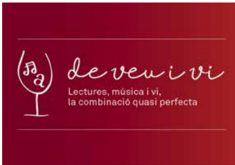
Imatge promocional de l'acte. || A.J. CASTELLAR

'De veu i vi' és la proposta literària que combina lletres, música i vi