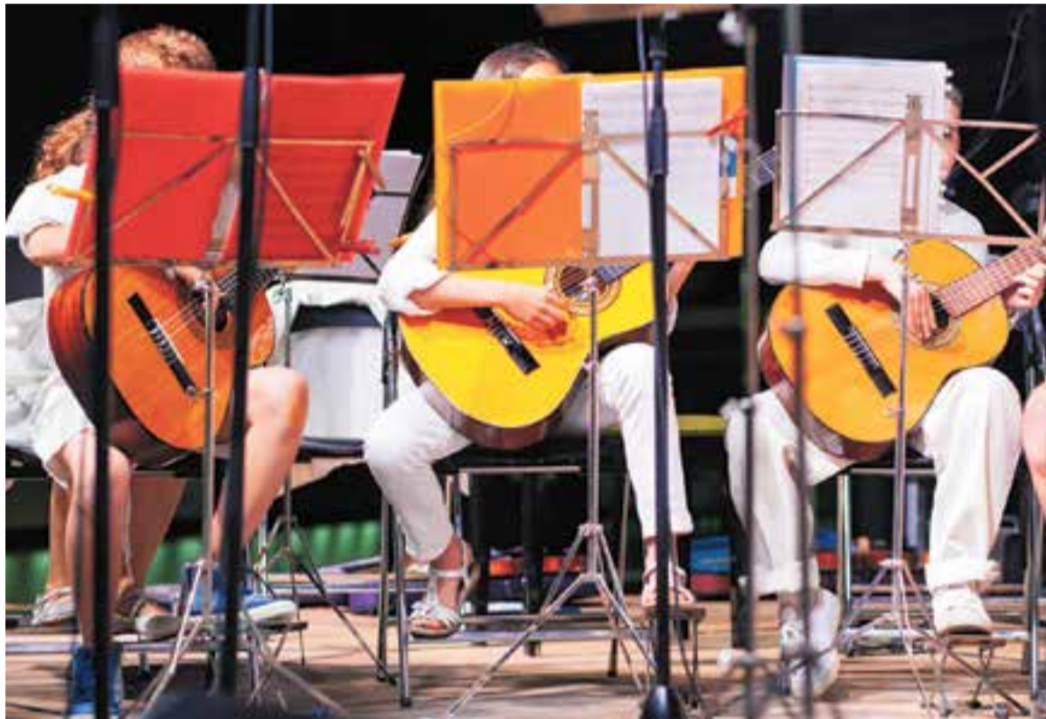
Moment d'un concert que l'Escola de Música Torre Balada va oferir a El Mirador en motiu dels 25 anys.

Espaiart podrà oferir totes les activitats que fins ara li han donat vida,