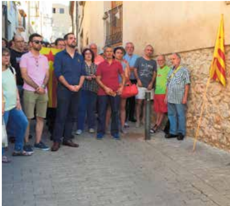
Concentració a Cal Targa el 2018, que no es repetirà enguany per la Covid-19.

D'altra banda, la secció local d'ERC, Junts per Castellar i la CUP, han or-