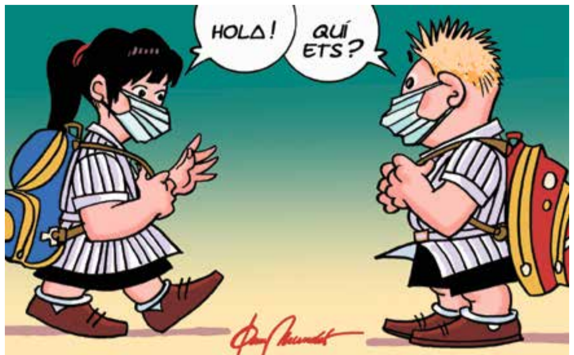
© Vells amics 3 · || JOAN MUNDET

"No hi ha alternativa a l'escola, no n'hi ha. Ara és l'hora de l'escola."