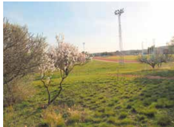
Imatge de les pistes de Castellar des del circuit de cros.