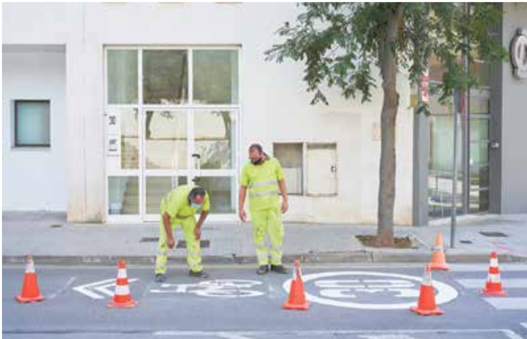
Els operaris, al carrer Jaume I, enlestint la pintura viària amb els nous límits de velocitat.

També cal destacar que la normativa aprovada estableix que els vehicles hauran de reduir la velocitat al pas normal de les persones a les àrees de vianants i a les vies urbanes amb plataforma única de calçada i vorera, i en altres