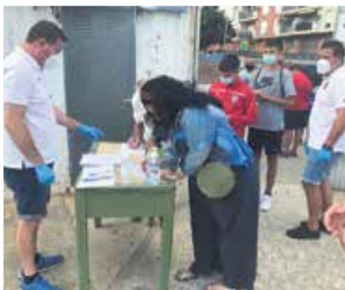
Control a la porta del Cortiella, diumenge. || A.S.A.