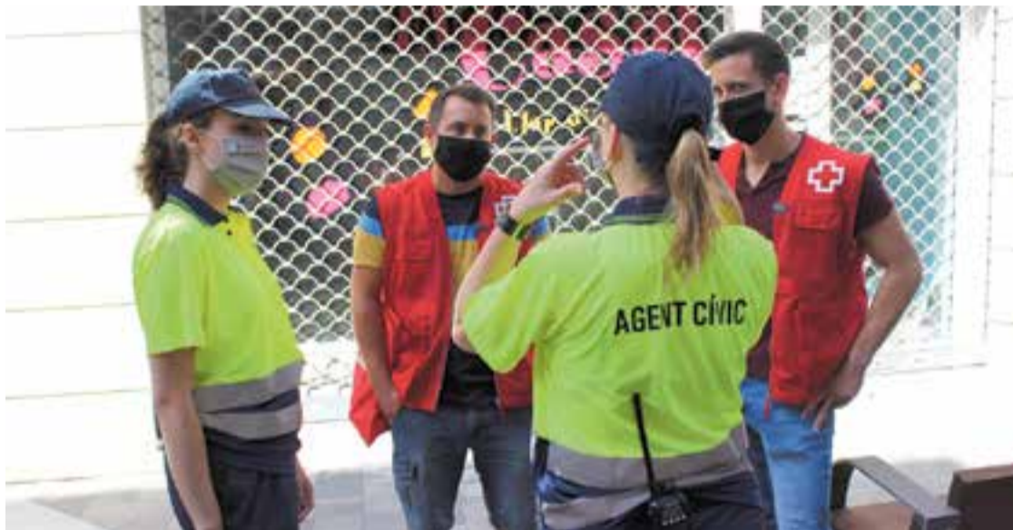
Agents cíviques i voluntaris de la Creu Roja pels carrers de Castellar en una imatge d'aquest agost.

Totes les persones que van realitzar aquestes tasques provenen de la borsa de voluntariat que es va posar en marxa durant l'estat d'alarma. Van començar la iniciativa onze persones, tot i que més endavant s'hi van incorporar més voluntaris i voluntàries.