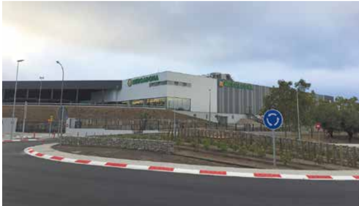
Aquest és l'aspecte de la nova rotonda entre la B-124 i la Ronda Tolosa, amb el nou supermercat Mercadona.

Amb la finalització de les obres, el trànsit es restableix i també tornen a funcionar les parades de la carretera de Sabadell que havien quedat inhabilitades en els dos sentits de la marxa. En tots dos casos, els autobusos disposen de carrils específics per poder aturar-se a les parades sense destorbar el trànsit de la carretera. En un comunicat de l'Ajuntament el tinent d'alcalde de Territori i Sostenibilitat, Pepe González, explica que "aquesta nova rotonda permetrà enllaçar molt millor la carretera amb una via de circumval·lació del nucli urbà com la ronda" . "Aquest fet -afegeix- facilitarà tant la mobilitat interna de vehicles com la mobilitat dels vehicles procedents de Sant Llorenç Savall, Sant Feliu, les urbanitzacions o de Terrassa i que vagin en direcció Sentmenat