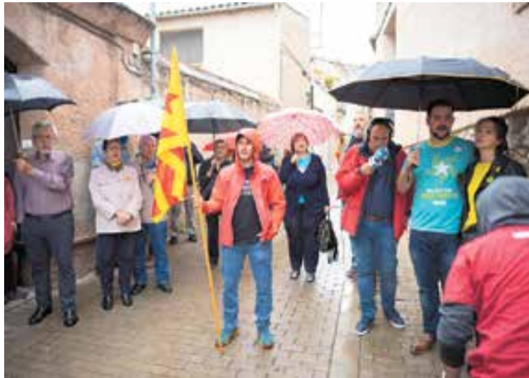
Ofrena floral al carrer de les Roques durant la Diada del 2019.

D'altra banda, l'ANC de Castellar instal·larà un punt d'informació al carrer Sala Boadella demà, de 10 h a 13 h, en què es podrà comprar la samarreta commemorativa. La setmana que ve, de dilluns a dijous, l'ANC es