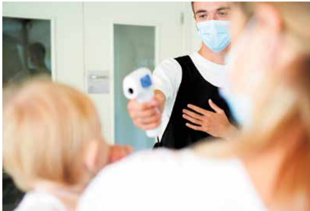
Presa de temperatura a un petit abans d'entrar a la llar d'infants Els Colobrers, dimecres passat.

Des que es va declarar la pandèmia el mes de març, Castellar acumula