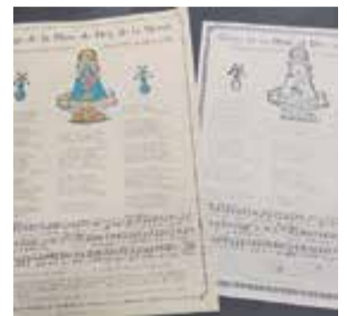
Goigs de la Mare de Déu de la Mercè. || M.A.

També s'hi ha fet la celebració de la Festa de la cançó de Muntanya de la Federació d'Entitats Excursionistes de Catalunya, s'hi han celebrat matrimonis, batejos i noces d'argent i d'or. S'hi han fet visites anuals de quatre o cinc escoles i diverses paròquies amb el mossèn i feligresos. Se n'han editat dos llibres i moltes altres coses, i a l'interior s'hi manté una exposició permanent sobre la història de l'ermita. + || M. A.