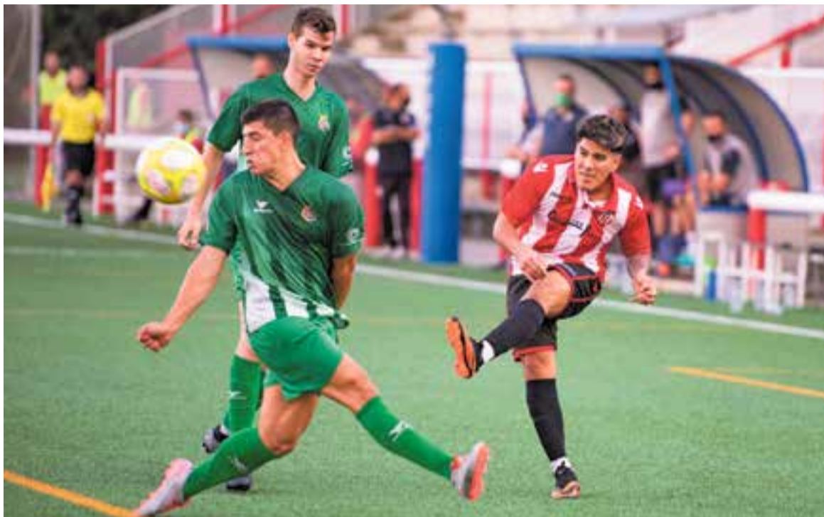
L'equip castellarenc va donar la cara durant els 90 minuts, després de sis mesos sense competir. || A. SAN ANDRÉS

"Les sensacions en aquest primer partit han estat bones. Hem de seguir treballant, però els jugadors estan fent-hobé i es veuen molt concentrats", va explicar el tècnic local, que va valorar positivament l'actitud dels seus. Amb derrota, però amb bona boca pel joc vist, el Castellar va tancar el primer dels nou partits de pretemporada planificats. Mascaretes, distància, gel i futbol per a una nova normalitat esportiva en una temporada que promet tornar a ser diferent. ↗