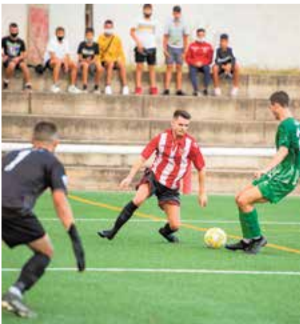
Imatge del primer partit de pretemporada contra el Cerdanyola. || A.S.A.