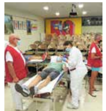
Donació de sang al local del CEC. || J.R

Al donant que havia reservat hora se li facilitava gel esterilitzant en arribar a l'espai, bolígrafs d'un sol ús per omplir el qüestionari previ, i guardar una distància mínima d'un metre i mig amb la resta de donants. També es demanava a l'entrar agafar una mascareta sanitària nova abans d'entrar al local del CEC. + || REDACCIÓ