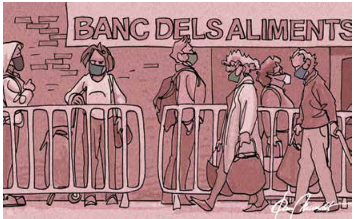
© Sense títol 333. || JOAN MUNDET

En segon lloc, la comunicació interpersonal ha canviat des de l'inici de la pandèmia, ja que hem passat més de tres mesos sense contacte físic