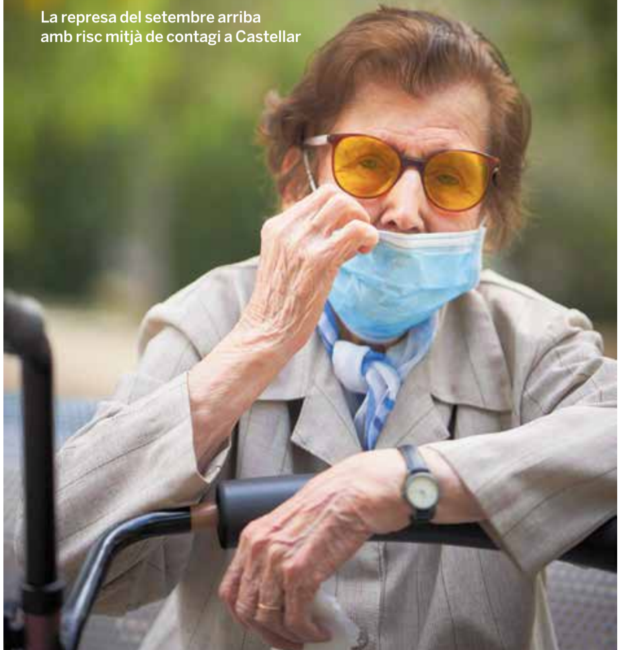
Una dona gran —un dels col·lectius de risc— s'ajusta la mascareta en una imatge de dimecres a la plaça Catalunya.

La represa del setembre arriba amb risc mitjà de contagi a Castellar