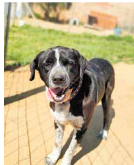
En Harpo i en Morfeo són dos dels gossos més veterans de la protectora