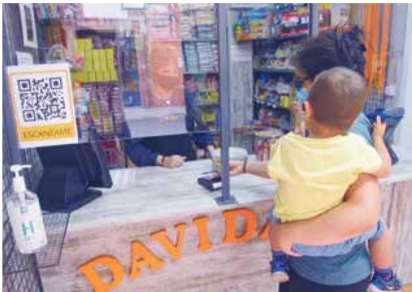
Els propietaris de Davidana han hagut d'adaptar la botiga a les noves normes de seguretat. || C. D.