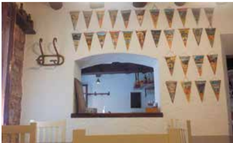
La Taverna del Gall té exposats banderins de tot Catalunya. || TAVERNA DEL GALL

La gent que ja els ha pogut veure ha comentat “que els recorden de quan eren joves” . A través dels banderins es pot viatjar a poblets de tot Catalunya. L'exposició es pot veure en horari d'obertura de l'establiment, d'11 a 24 hores. ➔ || M.A.