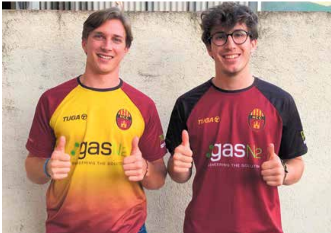
Els germans Garcia ja llueixen la samarreta de l'Hoquei Club Castellà.

L'HC Castellà inicia el projecte més potent dels últims anys amb dos jugadors que han de marcar diferències