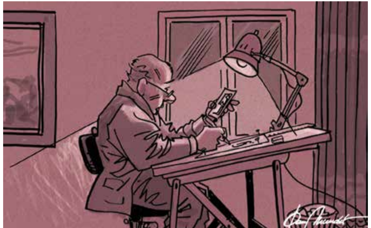
© "Teletreball d'antes". || JOAN MUNDET

"Aquest suposat nou món no ens deixa veure que, en realitat, tot és més antic del que sembla"