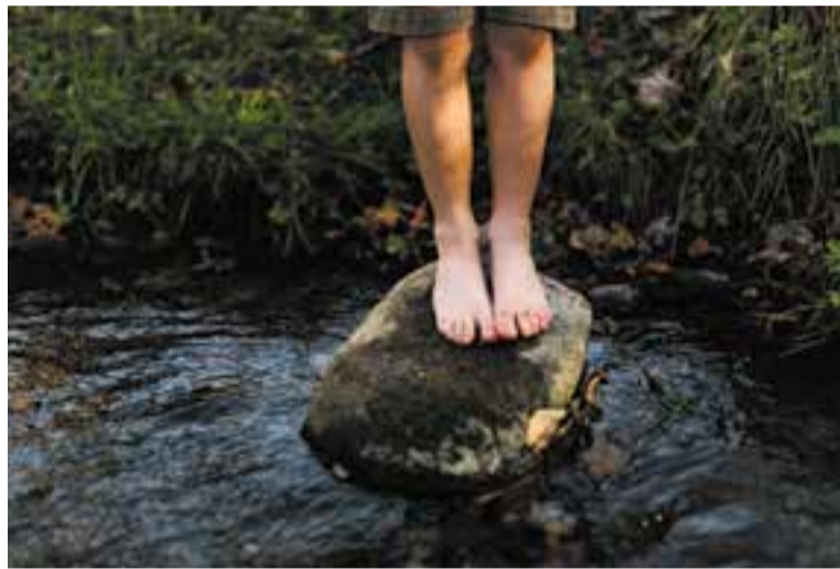
Imatge promocional de l'especial 'Estiu enriquit' publicat el 5 de juny.