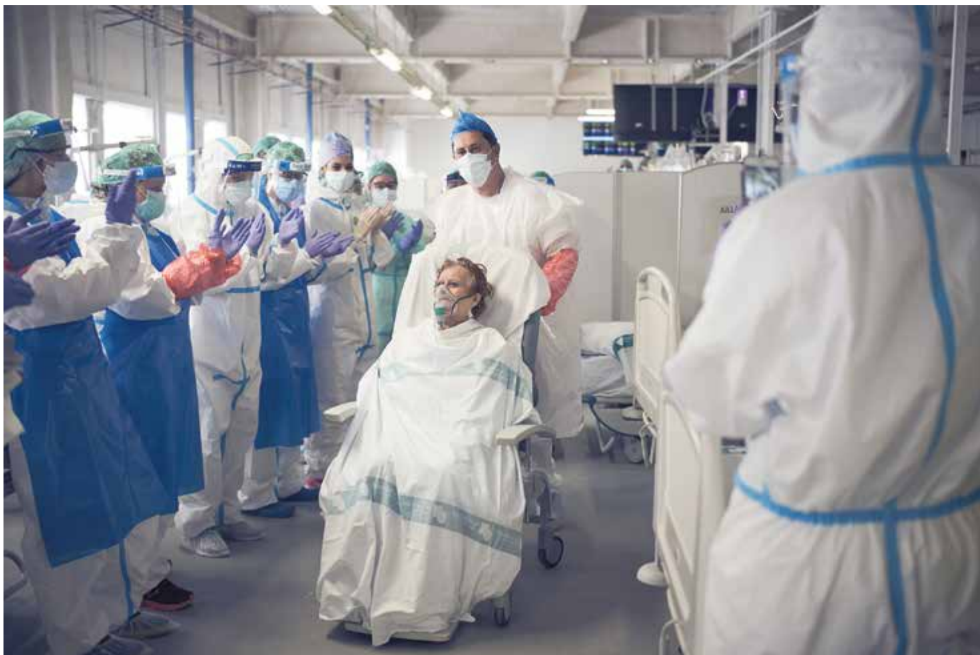
Una pacient rep l'ovació dels sanitaris de l'Hospital Parc Taulí en el moment d'abandonar l'espai de la UCI per passar a planta i continuar amb la seva recuperació de la Covid-19. || Q. PASCUAL