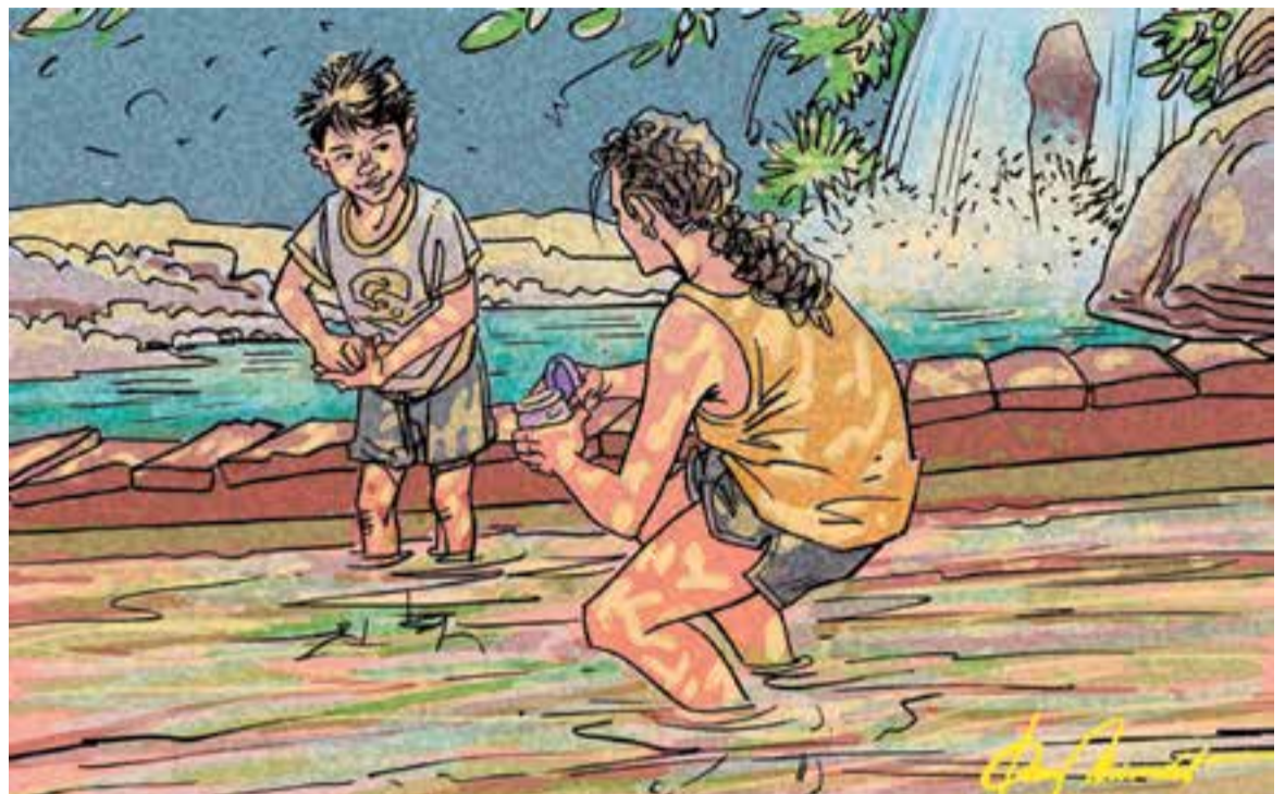
© Sense títol. || JOAN MUNDET

-Mama, podem anar a donar una volta mentre acabes de fer aquesta paret? - em demanava el Nil quan es cansaven de no fer res. Li contestava que sí, però que tornessin en deu minuts i que vigilessin de no caure a l'ai-