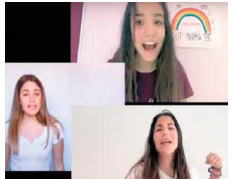
Tres de les components de Macedònia al vídeo de 'Volem Guanyar'.