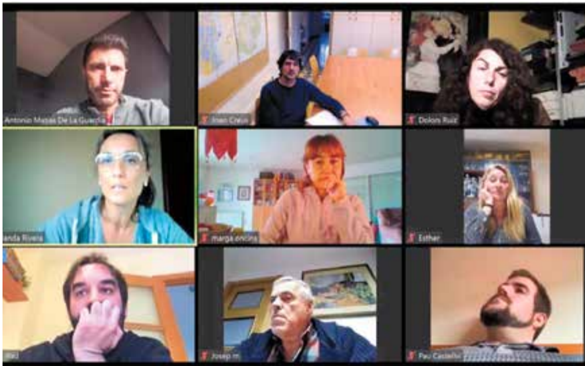
Els i les portaveus dels grups municipals amb representació al consistori en la trobada telemàtica de dimecres.

Aquest dimarts a les 19 hores tindrà lloc el ple d'abril que, com el de març, es farà telemàticament i es podrà seguir en directe per Ràdio Castellar i el canal de youtube de L'ACTUAL.cat. + || C.D.