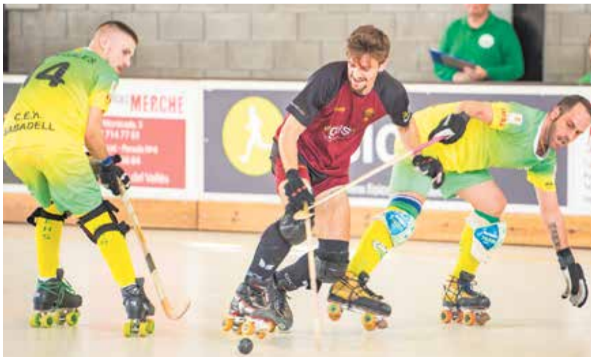
Aquesta temporada l'hoquei patins ja no tornarà al Dani Pedrosa, almenys en partit de lliga.

Així doncs, la Segona Catalana tancarà la classificació amb els resultats de la primera volta, i pujarà de categoria el líder del grup, sense play-off d'ascens ni descensos. En aquest cas, després de les 14 jornades de la primera volta, el sènior grana quedarà en terra de ningú, en vuitena posició i a nou punts del líder, l'HC Montbui, equip que aconseguirà l'ascens a Primera Catalana. El Castellar tornarà