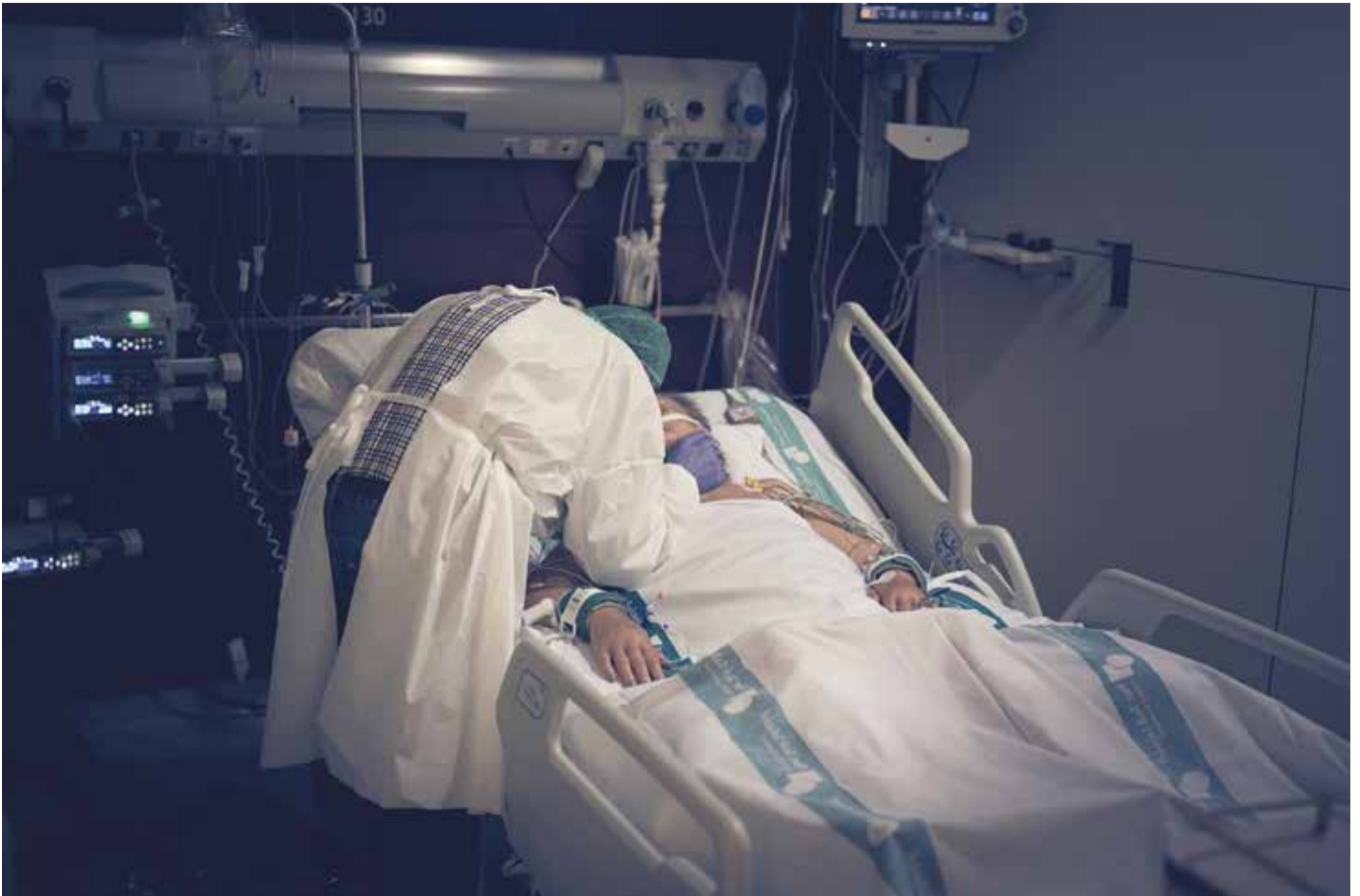
En la imatge, un home s'acomiada de la seva dona a la UCI habilitada al Taulí. L'Hospital de Sabadell està facilitant les visites dels familiars en els darrers moments de vida dels pacients.

material. “És un problema que no està resolt del tot, encara ens manquen alguns articles. De mascaretes, que són els més rellevants, en tenim, però per exemple ens fan falta bates d'un sol ús, que encara no se subministren. La situació ha millorat sensiblement, i en línies generals, els nivells de protecció són els adequats per als professionals”, apunta Martí.