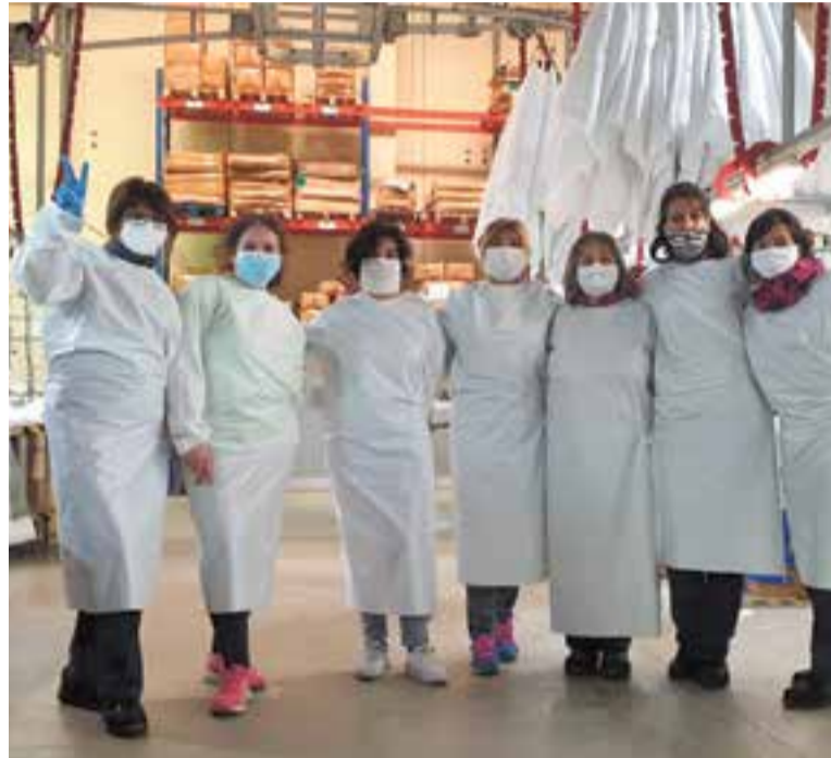
Treballadores de Velamen mostrant algunes de les bates que han confeccionat.

A Velamen, on fins ara es feien coixins, fundes de protecció o edredons nòrdics, s'han confeccionat bates i davantals quirúrgics reutilitzables. Segons assenyalen des de l'empresa, tots aquests canvis han