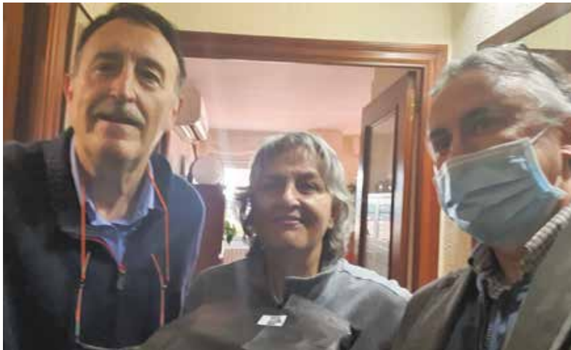
Liurament a un domicili de llibres del responsable de La Centraleta, a la dreta, aquesta diada de Sant Jordi diferent.