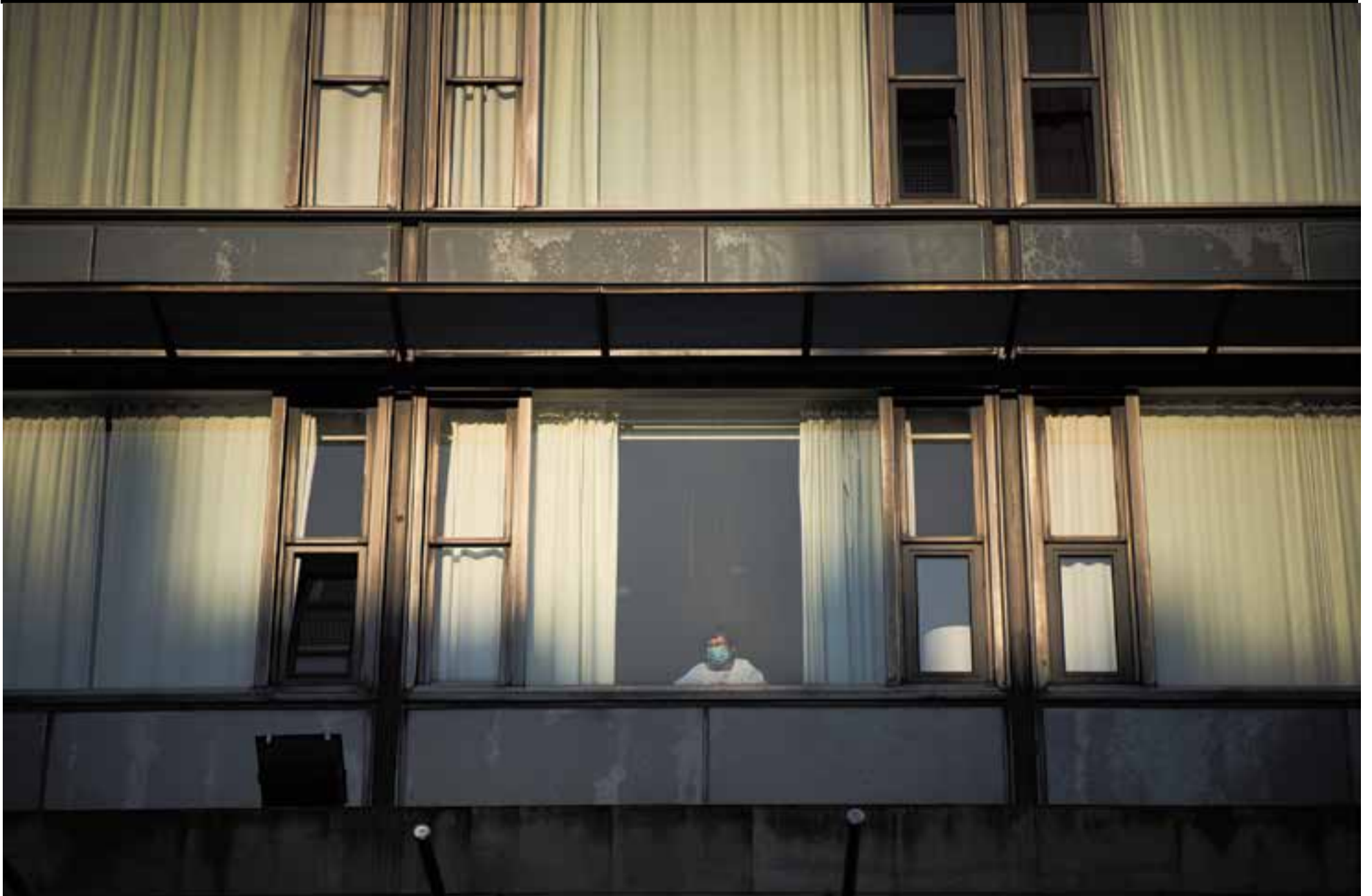
Una persona en procés de recuperació de Covid-19 mira per la finestra des d'una habitació de l'Hotel Verdi de Sabadell. La pandèmia ha posat a prova la capacitat d'absorció de tot el sistema sanitari.