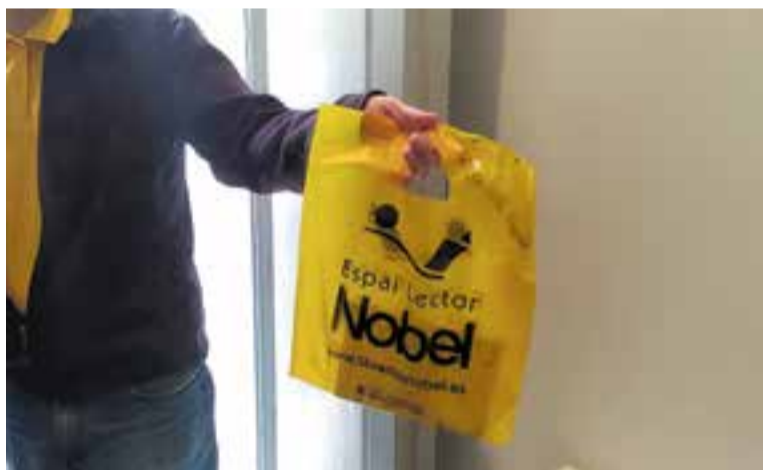
Liurament de la llibreria i Nobel a un domicili.