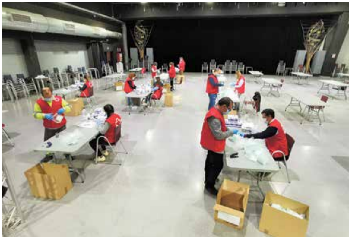
Personal de l'Ajuntament i de la Creu Roja preparen a la Sala Blava de l'Espai Tolrà els enviaments.

D'altra banda, dimarts van arribar a Castellar 4.600 mascare-