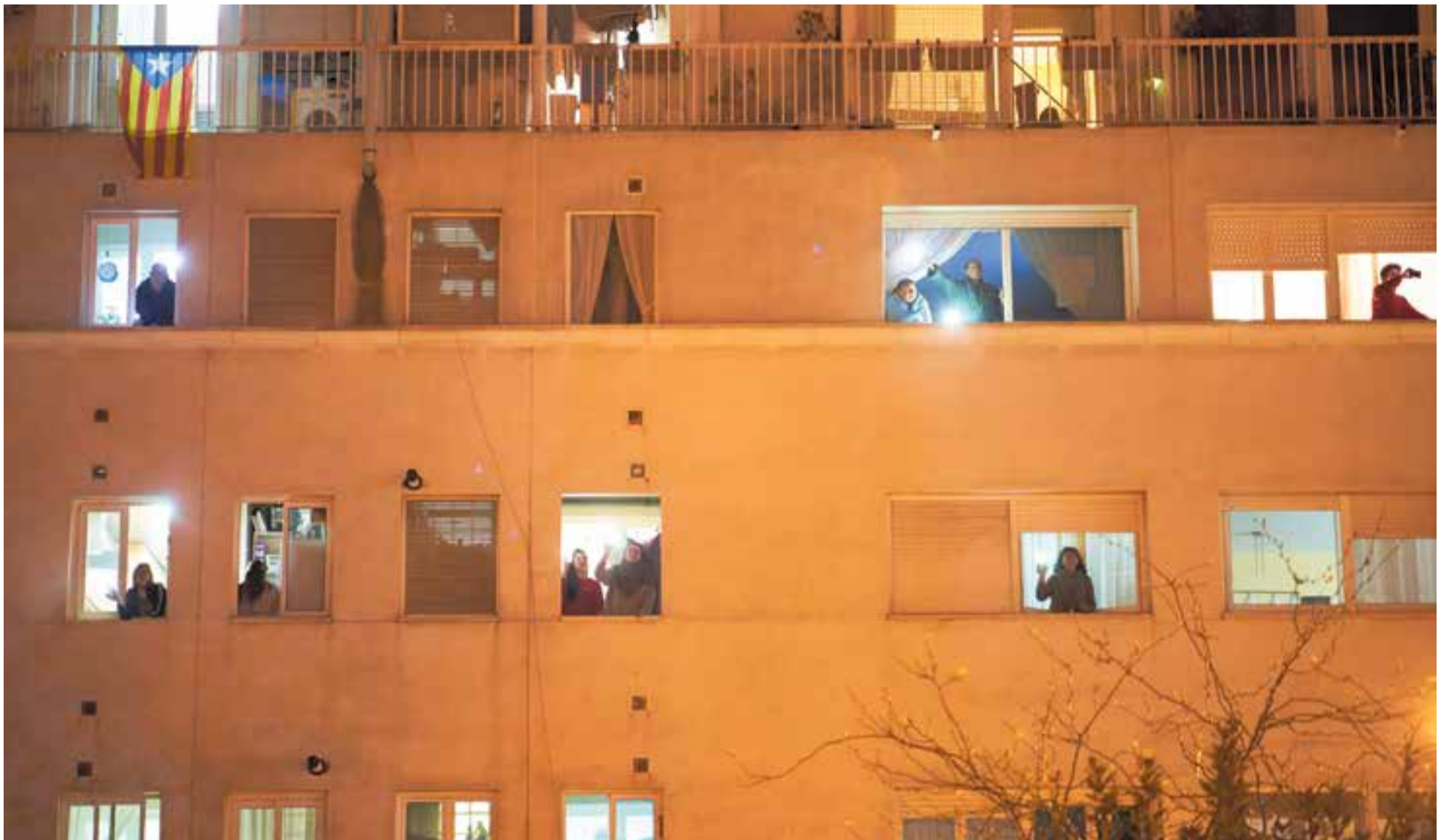
Des del primer dia de l'estat d'alarma, el 14 de març, les veïnes i veïns de Castellar han sortit a les 20 hores per donar suport a tots els sanitaris amb aplaudiments.