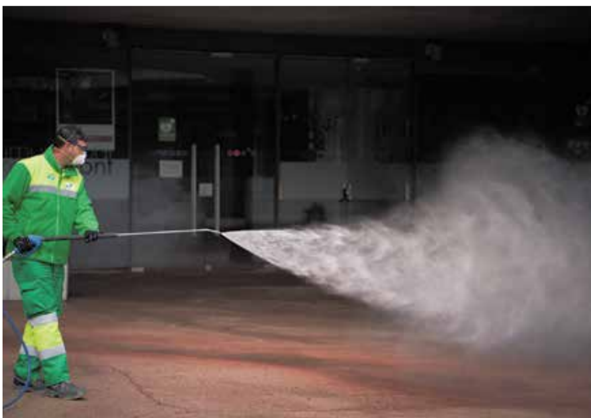
Els Serveis de Neteja de l'Ajuntament desinfecten equipaments com el marcat.

El cementiri i el tanatori municipals també s'han vist obligats a tancar les seves portes al públic. Així, l'oficina del tanatori atén el servei només per a defuncions. Si hi necessiteu contactar podeu trucar de dilluns a divendres, de 9 a 15 h, al tel. 937471203. Recordeu que també podeu contactar amb la Funerària Torra les 24 h al telèfon 937277400. D'altra banda, l'Ajuntament ha tancat les fonts d'aigua públiques del municipi com a nova mesura per lluitar contra el coronavirus. Cal tenir en compte que en aquestes instal·lacions hi pot haver contacte amb les mans o la boca i, per tant, poden ser elements de contagi. +