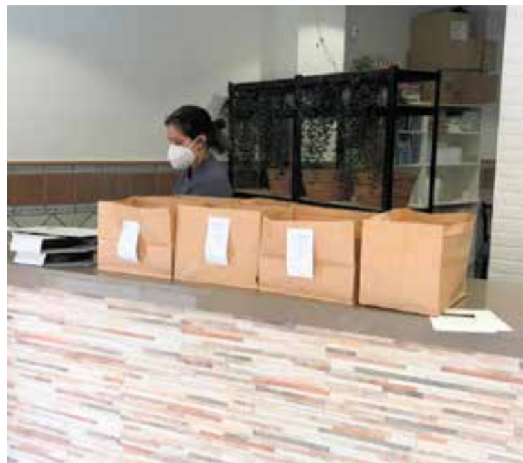
L'empresa Cuinats amb les comandes per emportar a punt.

El Mercat Municipal continua obert i moltes de les seves parades també fan el servei de la comanda a domicili. ➔