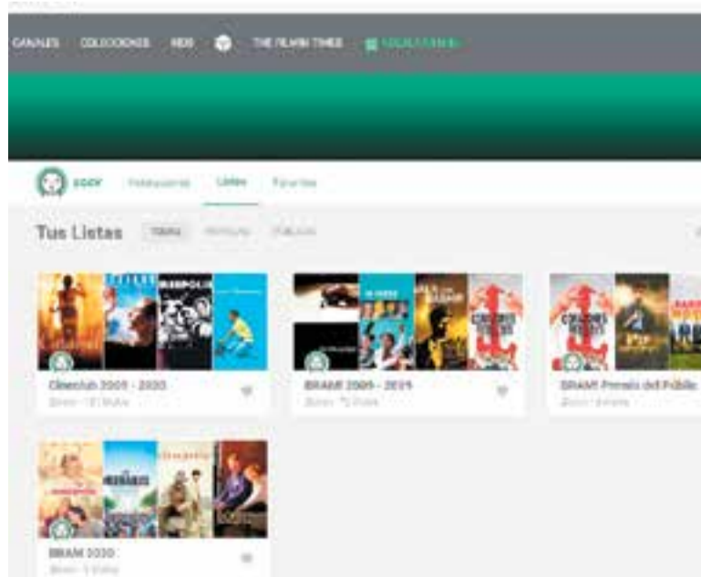
La plataforma Filmin ofereix molts dels films programats pel BRAM!.

Els responsables del cineclub han elaborat unes llistes amb pel·lícules diverses