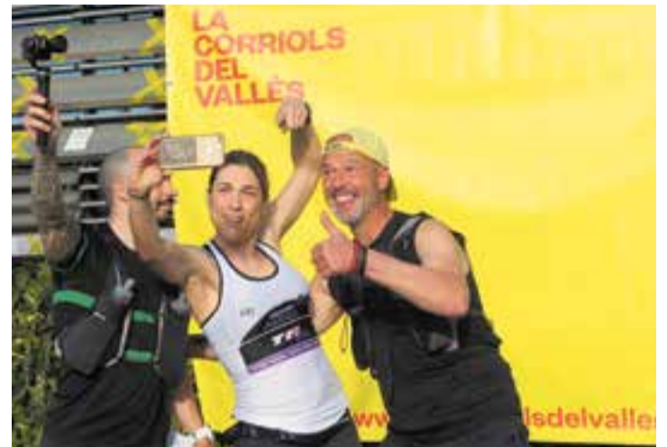
Participants de l'edició 2019 de la Corriols del Vallès.