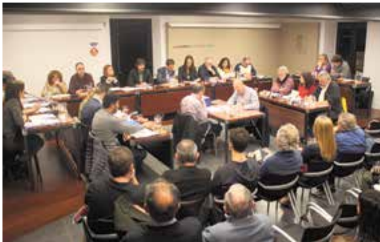
La sessió plenària de dimarts va tenir la presència de treballadors municipals.