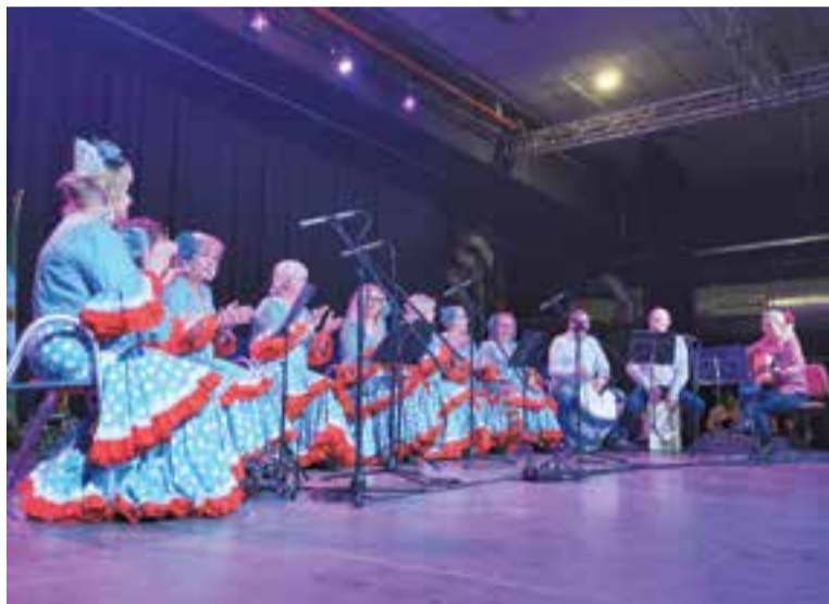
Actuació dels Aires Rocieros Castellarencs durant la diada andalusia.