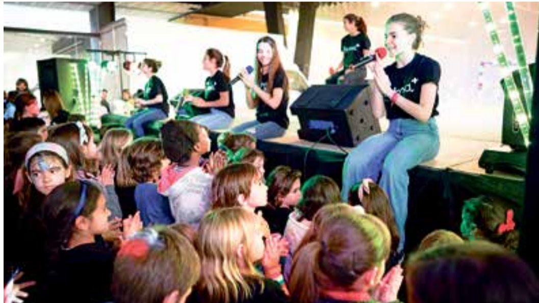
Macedònia tornarà a col·laborar amb SUMA+ Castellar i participarà a la Marató per la Diversitat