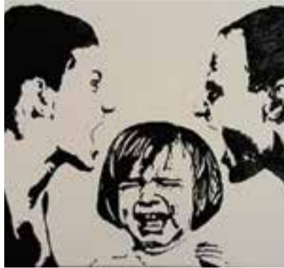
Un dels quadres de Rafel Aguilar.