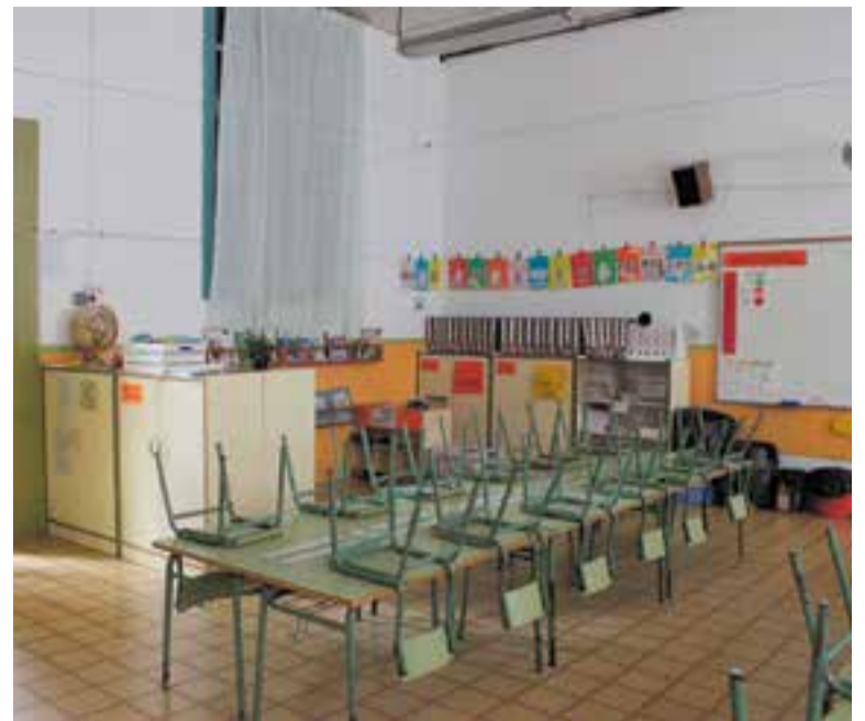
Imatge d'una aula buida de l'escola Emili Carles Tolrà.

Finalment, fa una crida al conjunt de la població i dels mitjans de comunicació a respectar la presumpció d'innocència i el dret a la intimitat dels infants afectats i les famílies denunciants. +