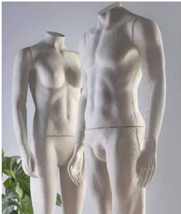
El femiquí Valira i el maniquí Gento elaborats per Pasqual Arnella.

Els models de pasta de paper ja s'han presentat amb gran acceptació per part dels assistents a la fira ISPO de Munic