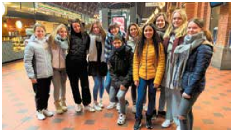
Alumnes d'El Casal amb altres alumnes d'Holanda, Turquia i Dinamarca.