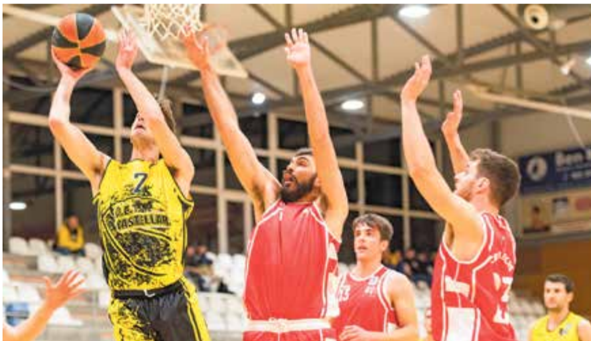
El CB Castellar va aguantar el ritme durant els primers 20 minuts, però un inspirat Quirós va desfer tota possibilitat. || A. SAN ANDRÉS

El CB Castellar segueix en la 12a posició amb un balanç de 6-12 i amb tres victòries per sobre del descens directe que ocupa el Reus Ploms (3-15), pròxim rival dels groc-i-negres aquest diumenge al Puigverd (19:00 h). + || A.S.A.