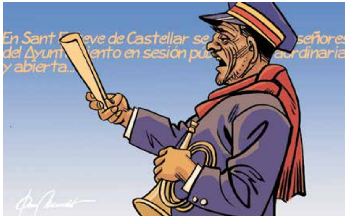
© El nunci. || JOAN MUNDET

diente al finido mes de diciembre [de 1919] del que aparecen ascender los ingresos á 7763'38 pesetas y los pagos á 4844'24 pesetas resultando por lo mismo una existencia de 2919'14 pesetas”. En la mateixa reunió s'acorda: “hacer público por medio de pregón y edicto, que vistas las diferencias y variedad de placas existentes para la numeración de carruajes, lo cual siempre resulta en perjuicio de sus dueños, quedan anulados todos los números que no se ajusten al último modelo aprobado; en su virtud se previene á los dueños de los carruajes de todas clases, la obligación de adquirir de nuevos, los cuales se facilitarán en el Negociado respectivo durante las horas de oficina”.