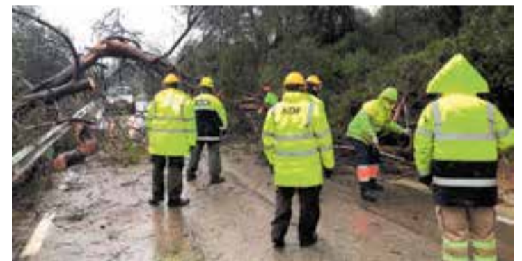
Els ADF van haver de treballar retirant arbres caiguts.