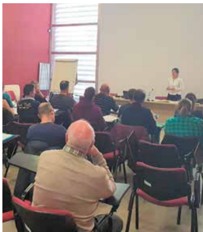
Ponència de la fiscal en Seguretat Vial Isabel López Riera.

L'objectiu del curs és el compliment dels requisits estipulats a la Llei d'enjudiciament criminal i adquirir els coneixements necessaris per a una praxi correcta durant els controls específics. + || REDACCIÓ