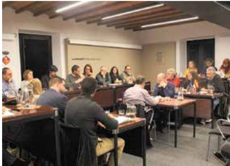
Una imatge del ple de dimarts passat.