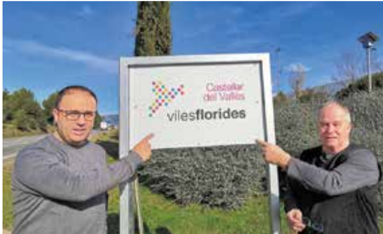
Un cartell informa a l'entrada que s'està accedint a una vila florida.

Viles Florides és un moviment que vol mostrar i posar en valor la riquesa natural i paisatgística del país mitjançant el reconeixement públic de tots aquells projectes d'enjardinament, ornamentació floral, mobiliari urbà i espais lúdics que, tant en l'àmbit públic com privat, esdevinguin un exemple a seguir. Amb aquesta adhesió, Castellar serà objecte d'una avaluació anual de l'estat general de l'enjardinament i els espais verds i de les actuacions, activitats i programes que