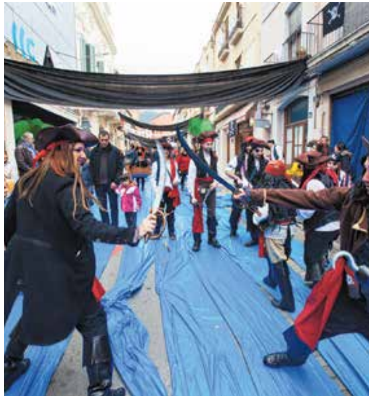
El carrer Major va dedicar-se als pirates per Carnaval, l'any 2016.

Enguany, al carrer Major hi haurà banderes de Castellar, com