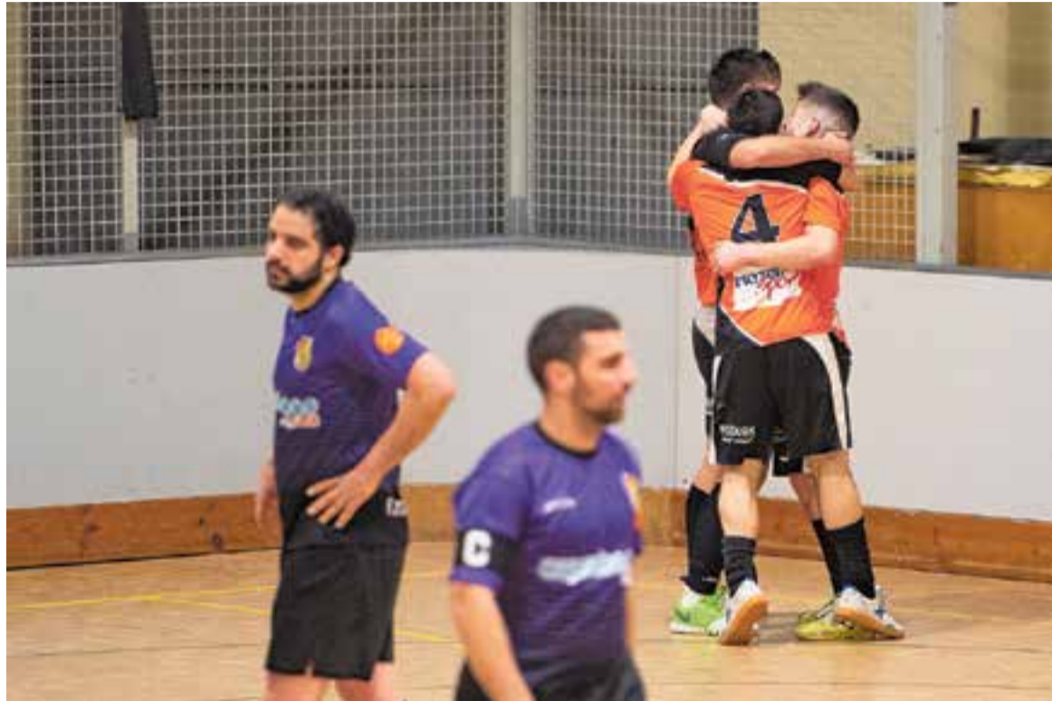
Els jugadors de l'FS Castellar celebren el primer gol del partit contra l'FS Castellbisbal.

La segona va començar amb més ritme i els malva-negres tancats en el seu camp. Set minuts necessitaven els de Civit per obrir el marcador, amb un Manel López superant el rival amb un xut des de dins de l'àrea que feia embogir la soferta grada del Blume. Eren moments de joc ràpid en què el Castellar portava la iniciativa. Una bona prova era