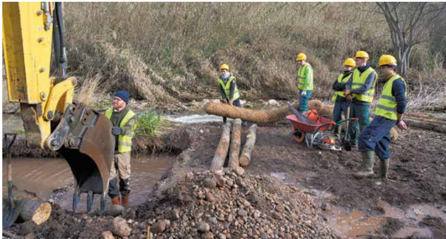
L'empresa Naturalea i alumnes de l'institut agrari de FP treballen en la construcció d'un 'krainer' dimarts passat a l'altura del pont de Turell.

Gràcies a un conveni posterior amb el consistori, una setantena d'alumnes de l'institut agrari d'FP han fet pràctiques durant aquesta setmana ajudant l'empresa Naturalea. L'institut ofereix diversos cicles de la família agrària com un cicle formatiu de grau mitjà de jardineria i floristeria en què s'imparteix un mòdul professional de bioenginyeria del paisatge i un cicle formatiu de grau superior de paisatgisme i medi rural, en què part del currículum fa referència a la restauració del paisatge. El centre ha aprofitat aquestes pràctiques per celebrar la Setmana de la Bioenginyeria. La coordinadora pedagògica del