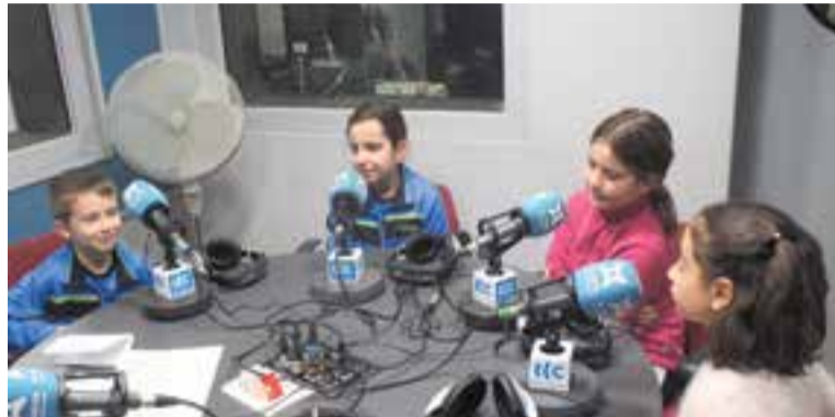
Concursants de tercer i quart de primària al primer programa.