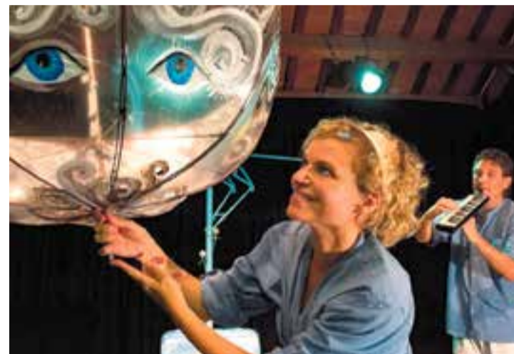
Teatre al detall presenta 'Un núvol gris, gras i gros', a l'Auditori.