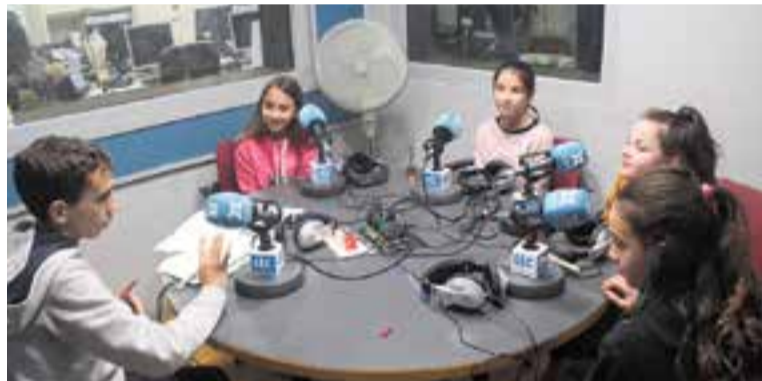
Quatre noies van protagonitzar la secció del concurs dels grans. || I. VIZUETE