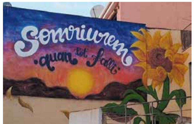
El grafiti es pot veure des de la plaça Vella. || #NATHUREFREE (INSTAGRAM)

L'obra ha estat plasmada per un artista de Castellar "veí nostre", que ha estat pintant la paret durant dos dies, des del pati mateix, amb l'ajuda d'una bastida per accedir a les parts més altes de la paret. El Dani explica que "la frase de Txarango és positiva i optimista, i el dibuix del gira-sol és perquè es tracta d'un flor molt lluitadora, que mai es rendeix i sempre busca el sol" , afegeix Coma. + || M. ANTÚNEZ