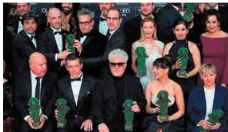
Foto de família dels premiats als Goya, amb Font a la dreta.

Salcedo", amb qui Almodóvar tenia una compenetració absoluta i que va morir l'any 2017.