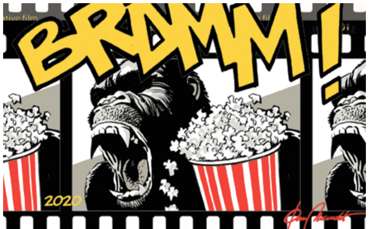
© BRAM! pictures 2020. || JOAN MUNDET

universal del creixement humà i la dificultat per prendre decisions en circumstàncies extremes. Entre les nombroses nominacions, dues als Goya i set als Gaudí, on va guanyar Laia Marull com a millor actriu. I què dir sobre La hija de un ladrón , en què el tàndem pare i filla, Eduard i Greta Fernández despleguen magia i talent a cabassos. Considerada ja per alguns crítics com una de les pel·lícules cabdals del cinema espanyol, és un retrat femení que se t'enganxa als budells. I vull des-