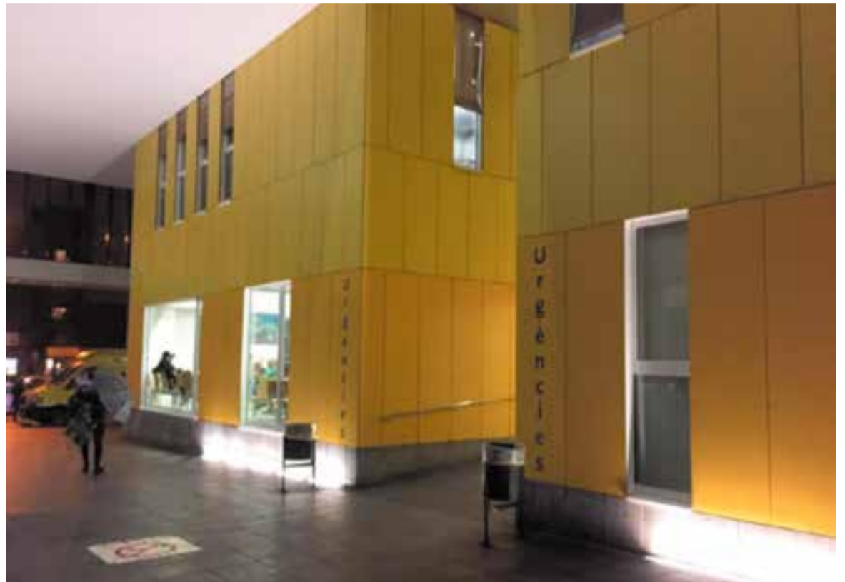
Accés a la Unitat d'Urgències de l'Hospital Taulí de Sabadell durant un vespre d'aquesta setmana

En referència al refredat, des del Canal Salut apunten que és una malaltia lleu provocada per un virus. Els símptomes que causa són diversos, i tenen semblances amb la grip. Des de congestió nasal fins a mal de coll i ulls plorosos, passant pel mal de cap. Sovint comença pel nas i per la gola, i després pot baixar als