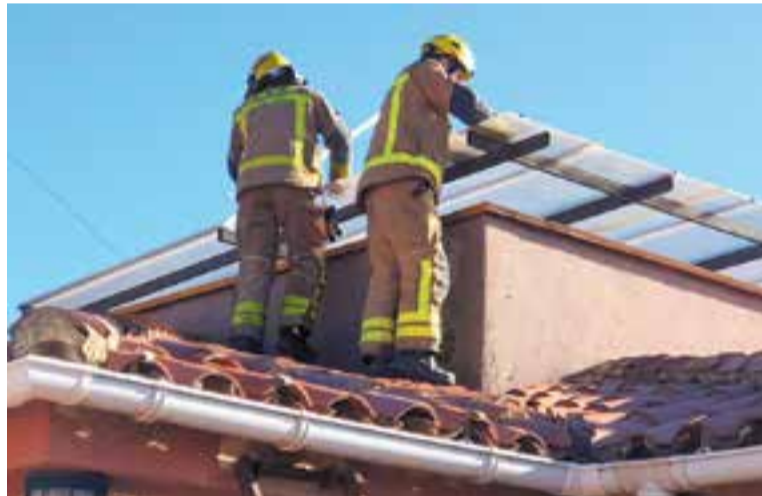
La major part d'actuacions han estat assistències tècniques.

Si analitzem la tipologia de les actuacions, el percentatge més alt, el 26.5%, va ser per assistències tècniques, en total, 105. “Dins de les assistències tècniques englobem totes les actuacions referides al mobiliari urbà com senyals tombats pel vent, elements inestables a la via pública, neteja de la calçada... La major part són serveis derivats de les inclemències meteorològiques com ventades, aiguats o nevades. Segurament no comporten un gran risc per a les persones, però sí que