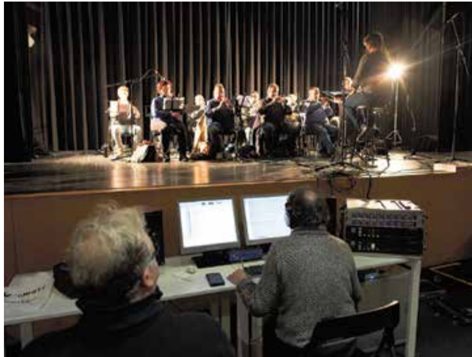
Un moment de la gravació de la Cobla Contemporània a l'Auditori, dijous, 16 de gener.

La nit de dijous de la setmana passada, la formació sabadellenca va enregistrar quatre