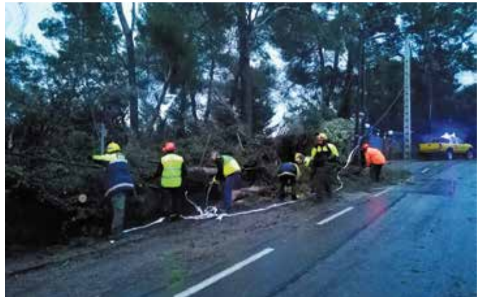
Els ADF treballant en la retirada d'un arbre caigut a causa del temporal.