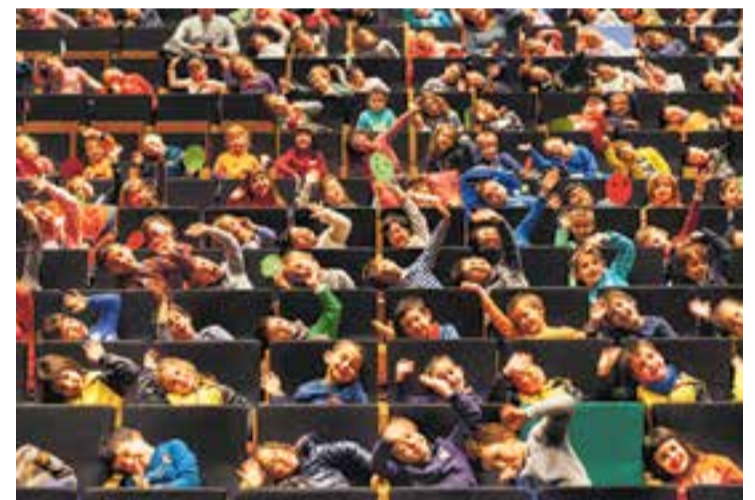
Alguns de les votacions que es van fer al BRAM! Escolar 2016.

La cultura cinematogràfica de l'alumnat té com a intermediari el model de la televisió. L'objectiu del BRAM! Escolar és oferir propostes de pel·lícules als centres educatius que s'adaptin a l'edat dels alumnes i que fugin dels circuits més comercials. A partir del visionat de les pel·lícules i del material de suport que es fa arribar a les escoles i instituts de Castellar, els alumnes poden treballar diversos aspectes relacionats amb els films. Es fan projeccions diferents per a cada cicle (educació infantil, cicle inicial, cicle mitjà, cicle superior, ESO i batxillerat). L'any passat, a la 11a edició, fins a 3.838 alumnes van gaudir del BRAM! Escolar, van veure un total de 52 pel·lícules durant les 21 sessions que es van fer.