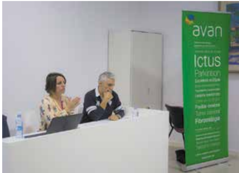
Una de les darreres xerrades d'AVAN a Castellar, fa uns mesos.

La xerrada del 26 de febrer es centrarà en Estils de comunicació i relacions interpersonals: L'assertivitat . El fil conductor de la xerrada mostrarà que l'autoestima, la