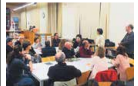
Taller d'escriptura amb Cos de Lletra. || CEDIDA

Cos de Lletra desenvolupa una intensa tasca docent: ofereix tallers d'animació a la lectura, de lectura en veu alta i d'escriptura creativa tant a infants com a adults. Aquestes activitats pretenen estimular el gust per la literatura a través de la comprensió i la creació de textos. La seva eficàcia va estretament lligada amb el seu vessant lúdic; segurament, d'aquí rau el seu èxit. + || M. ANTÚNEZ