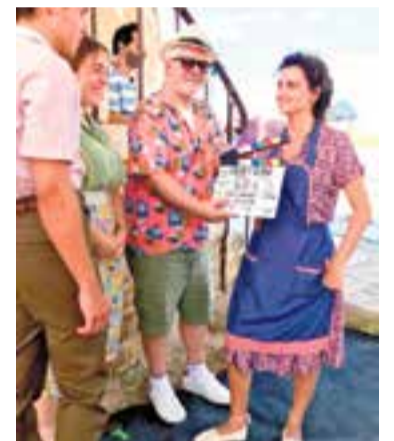
Rodatge de 'Dolor y gloria'.

Tot i que la nominació al guardó dels XII Premis Gaudí de l'Acadèmia del Cinema Català no s'ha convertit en premi per a Teresa Font, la muntadora de cinema sí que va assistir a la gala de diumenge passat il·lusionada per aquest merescut nomenament. Ara, la castellanenca opta als Premis Goya pel millor muntatge a la pel·lícula 'Dolor y gloria'. Aquest dissabte a la nit se'n sabrà el veredict. Font també ha resultat afortunada perquè la pel·lícula de Pedro Almodóvar opta als Oscars amb la nominació de millor pel·lícula estrangera. Font és una muntadora consolidada i reconeguda. Ha treballat a títols com 'Juana la Loca', 'Libertarias', 'Celos', 'El día de la bestia', 'Jamón, jamón', 'Días contados', 'El rey pasmado', 'Muertos de risa' o la sèrie de televisió 'Los jinetes del alba'.