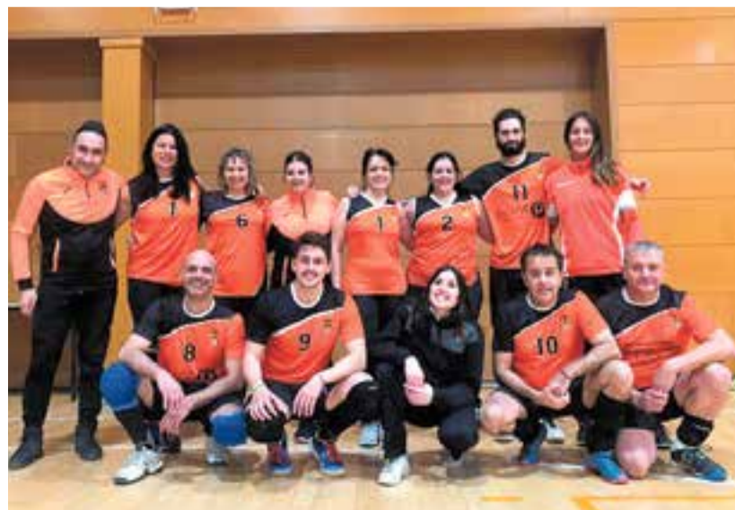
Debut amb victòria de l'equip màster contra el Granollers. || CEDIDA

En categoria femenina, l'FS Castellar A va superar el duel contra el Sant Just per 2-3 (24-26/23-25/26-24/25-21/12-15) i ja els treuen cinc punts de diferència a la taula. El B va superar l'Institut Montserrat C per 3-1 (25-20/14-25/25-23/25-10) i amb 37 punts superen per dos l'Institut Jaume Balmes. En masculí, el sènior A va superar per 3-0 (25-23/25-20/25-17) el Torre de Claramunt B i l'equip segueix líder amb 36 punts, quatre més que el CV Martorell. El B va ser l'únic equip en acabar derrotat, ja que va caure per 1-3 (19-25/25-22/23-25/20-25) contra l'equip A de la Torre de Claramunt i són cinquens a la taula amb 11 punts. L'equip màster va debutar amb victòria (3-2) en el primer partit de Lliga a Granollers. + || A.S.A.