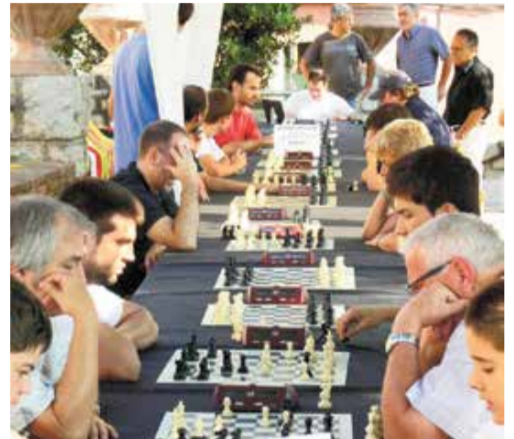
Participants en un torneig del Club d'Escacs Castellà. || CEDIDA

Aquests equips integren vuit jugadors. Abans de començar el Campionat per Equips de Catalunya, es poden fer tot tipus de conjetures, però el que sí que direm és que cada vegada hi ha més equips i aquests cada any són més forts. Ànims a tots els jugadors castellarencs. + || S. JUANPERE