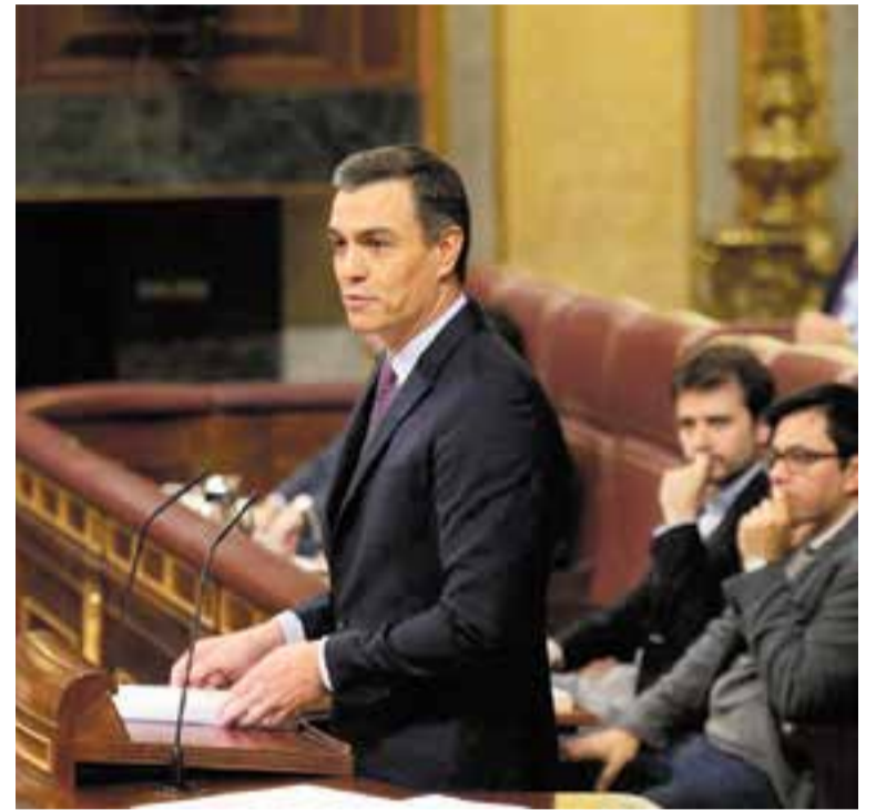
Pedro Sánchez, durant el debat de la seva investidura aquesta setmana.