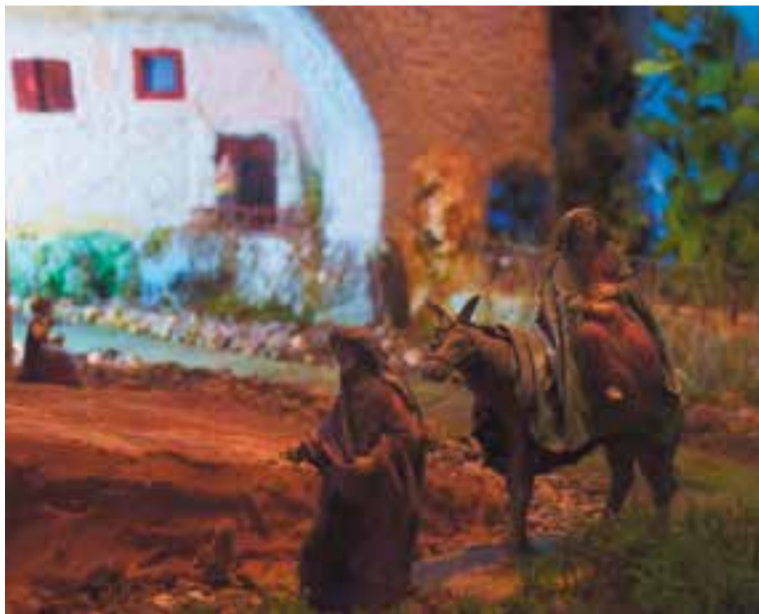
Un dels diorames que s'han pogut veure a l'exposició de Sant Feliu.

En concret, s'han obert al públic els dies 23, 25, 26, 29 i 30 de desembre i 12 de gener, de 12 a 14 h i de 18 a 20.30 h; 5 i 13 de gener, de 12 a 14 h; 6 de gener, de 18 a 20.30 h, al local de La Pepeta, al costat del Centre Feliuenc. En total, es podran veure vuit diorames diferents, amb un tema comú, les coves. Es pessebres s'han acompanyat d'uns elements a cada pessebre que qualsevol visitant podia ajudar a trobar. ✦