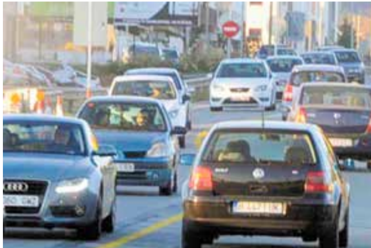
Trànsit intens a la B-124, a la zona del polígon de la Bruguera.

Aquesta mesura ha aixecat molta polseguera entre els usuaris que no podran accedir a la capital i als municipis de l'Àrea Metropolitana que s'han adherit a la ZBE. Tanmateix, l'Ajuntament de Barcelona ha anunciat que la infracció no se sancionarà fins a l'1 d'abril del 2020, tot i l'entrada en vigor de la ZBE. Les multes a turismes i a motos tindran un cost de 100 a 499 euros. Si s'ha produït un episodi de contaminació, la multa oscil·larà entre els 500 i els 999 euros.