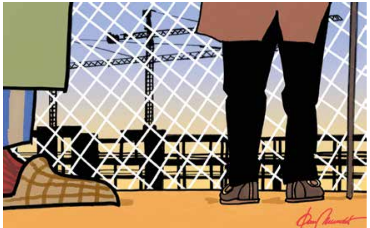
© Parc temàtic. || JOAN MUNDET

ta fins als bars i restaurants, passant pels tècnics, transports, magatzems i tots els que vosaltres mateixos podeu posar a la llista sense haver de furgar gaire. Mitja societat, vaja. Quantes obres de les que ja es van aturar coincidint justament amb la col·locació de la primera pedra i altres més avançades, es poden veure encara al cap de tots aquests anys, en el mateix estat o, més ben dit, en un notable estat de degradació. La banca, cofoia propietària aca-