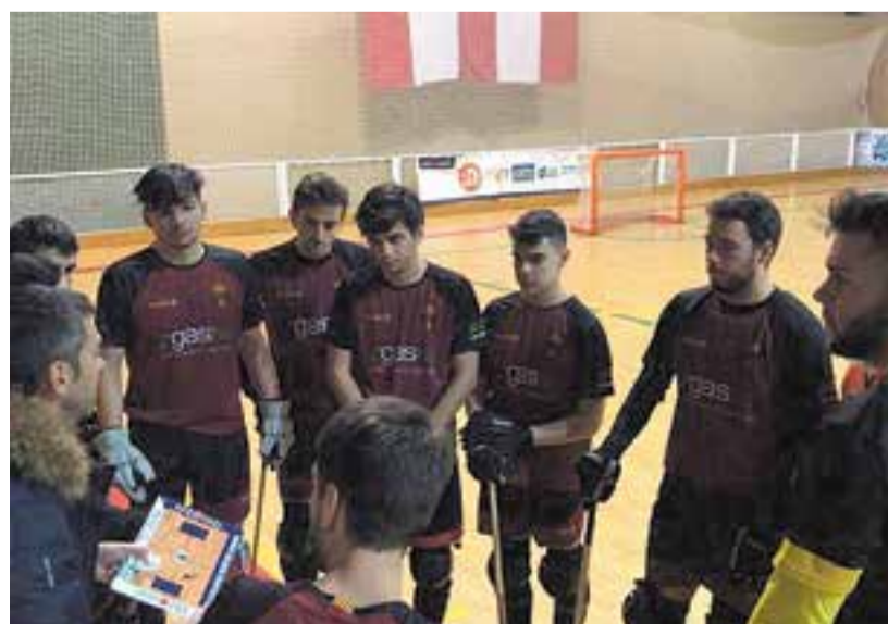
L'HC Castellar en un temps mort en el partit contra el Manresa.