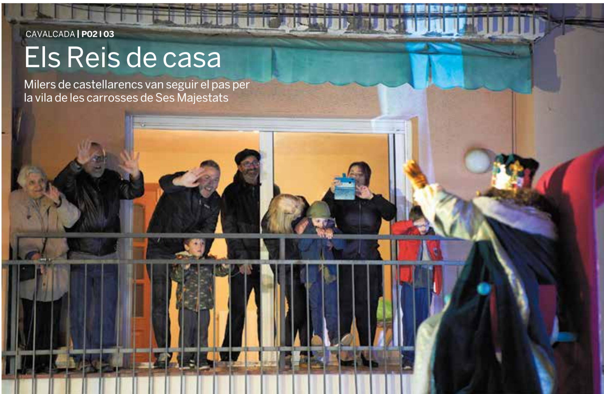
Una família castellarenca saluda el rei ros durant la cavalcada de diumenge passat en un punt del recorregut pels carrers del centre.

Milers de castellarencs van seguir el pas per la vila de les carrosses de Ses Majestats