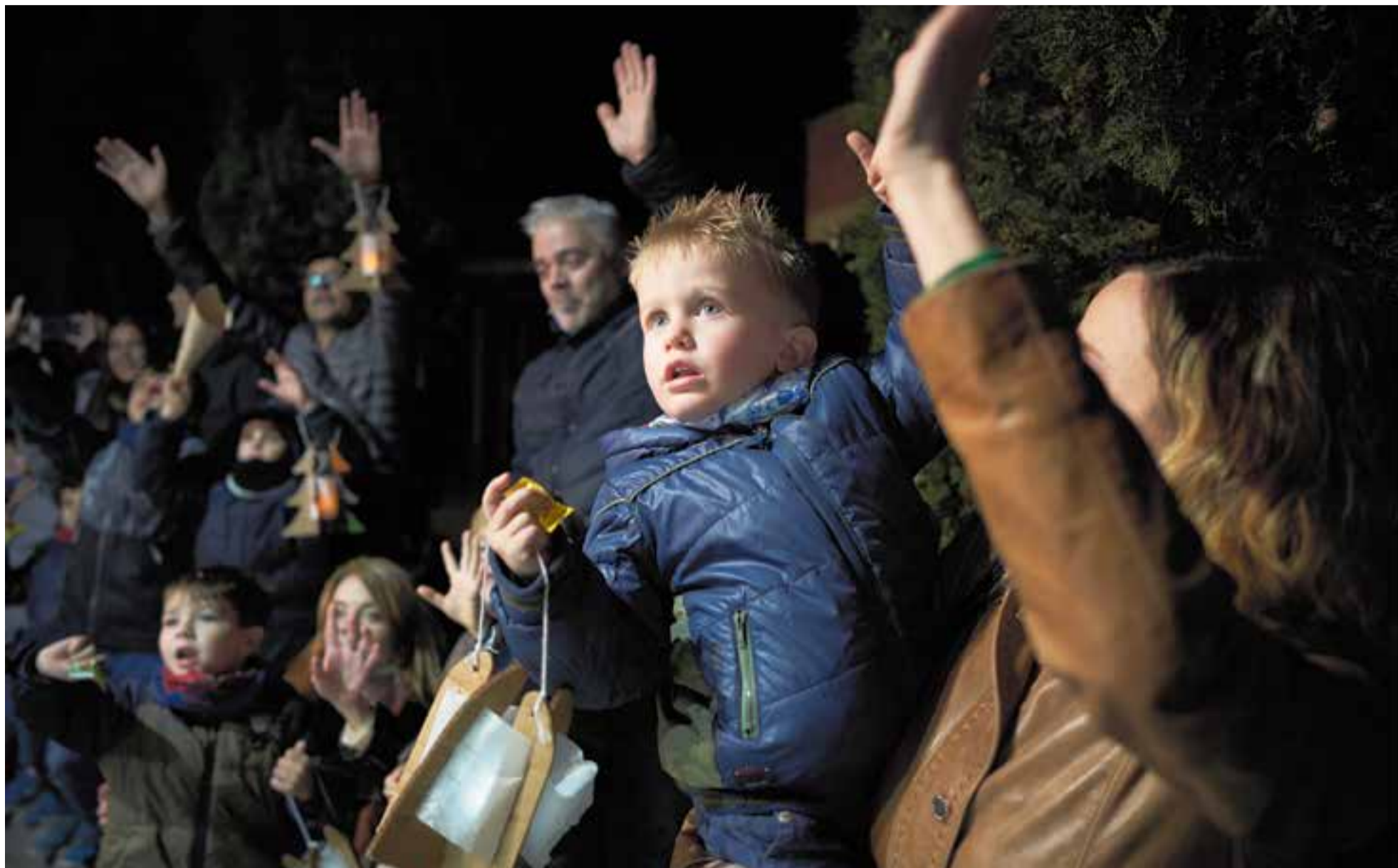
Els ulls dels infants reflecteixen la il·lusió de veure l'arribada de Ses Majestats a Castellà del Vallès en la nit més màgica de l'any.

Milers de castellarencs van seguir el pas de les carrosses de Ses Majestats d'Orient pels carrers de la vila