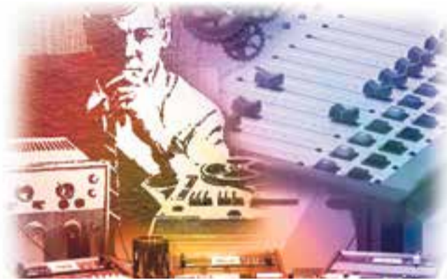
Detall de la portada del llibre 'Mezcla en el audio profesional'.

Mezcla en el audio profesional és una eina perfecta per a qualsevol aficionat, estudiant, músic, productor, tècnic o enginyer que desitgi consells, opinions, trucs i tècniques utilitzats pels principals experts en la matèria. El llibre es pot comprar a Amazon i diferents portals de venda de les principals llibreries del país i Amèrica. +