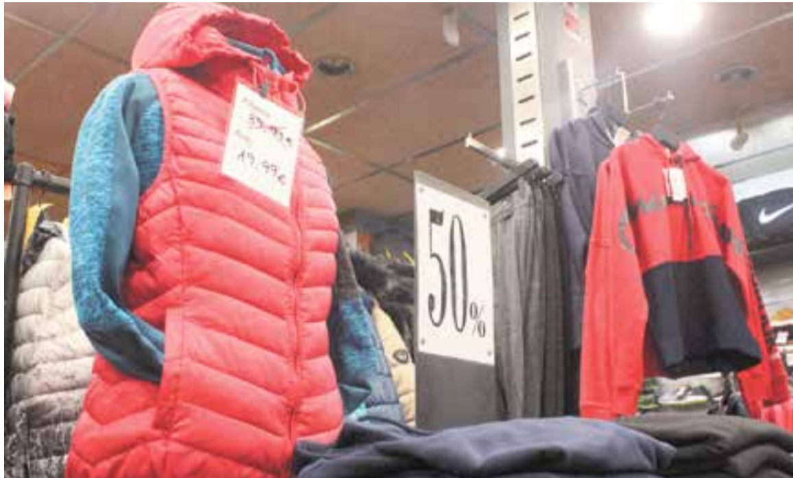
Als comerços de la vila es pot veure descompte de fins el 50%, com en el cas d'Esports Castellar.