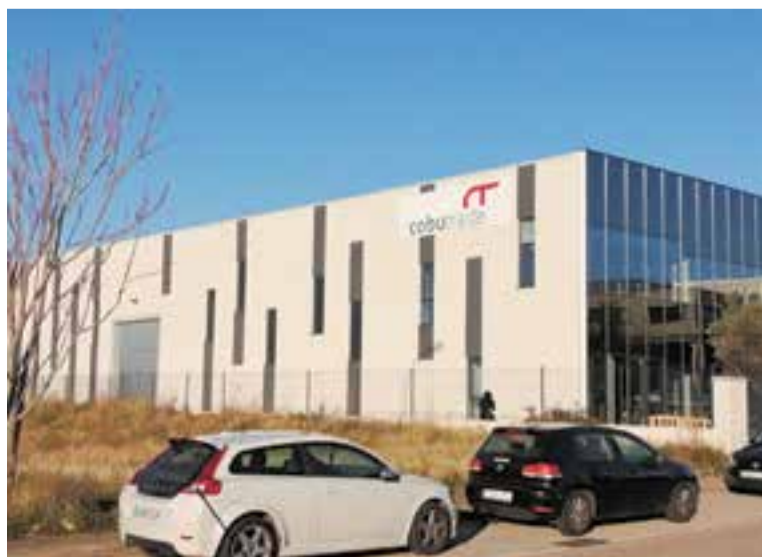
El cartell de l'empresa Cobutrade ja llueix a la nova nau del Pla de la Bruguera.

1.482 metres quadrats. El nou disseny de la nau permet la llum ambiental de treball natural de forma transversal, alhora que es complementa amb unes lluernes tèrmiques a la coberta. La façana principal d'entrada està presidida per un mur cortina de vidre de gran format on hi ha un espai d'oficines de 250 m 2 distribuït en dues plantes, que acull una zona de show room . Les instal·lacions modernitzaran l'empresa Cobutrade i podran simplificar i millorar els