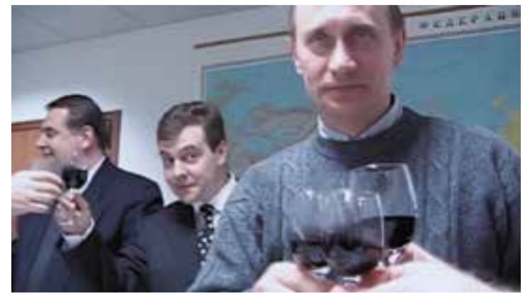
Fotograma del documental 'Els testimonis de Putin', que es projecta divendres.