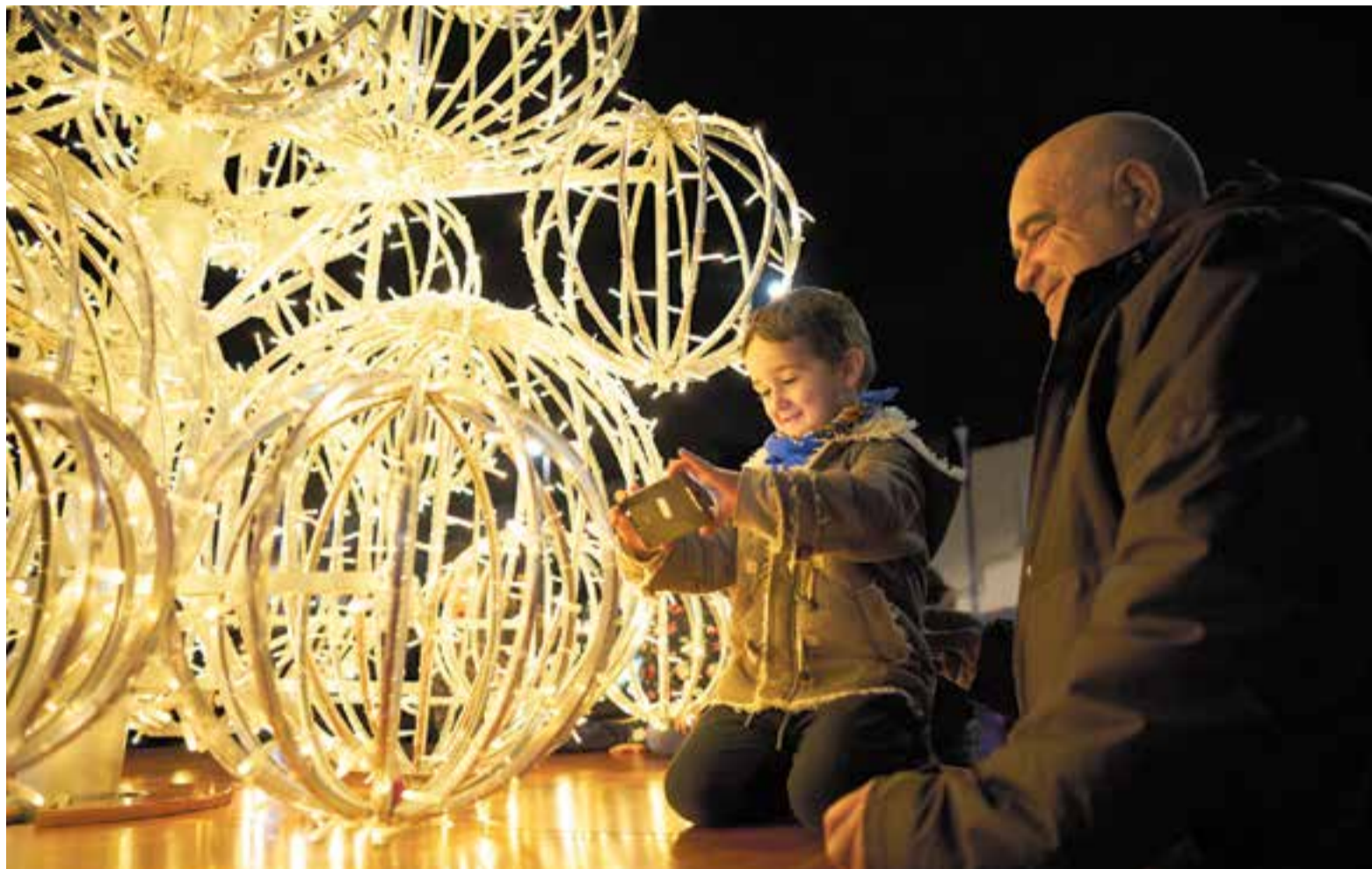
En Pau fa una fotografia a l'arbre de Nadal davant del Mercat just minuts després de l'encesa, divendres passat.

Ramírez va posar el punt més emotiu dels parlaments recordant que el més important és que tots siguem a taula: "No importa què tenim per sopar o per dinar els dies de Nadal, si és rapo si és cabrit o si tenim o no plates plenes de torrons i polvorons. A quasi totes les famílies, per des-