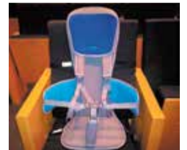
L'adaptador per a butaques.