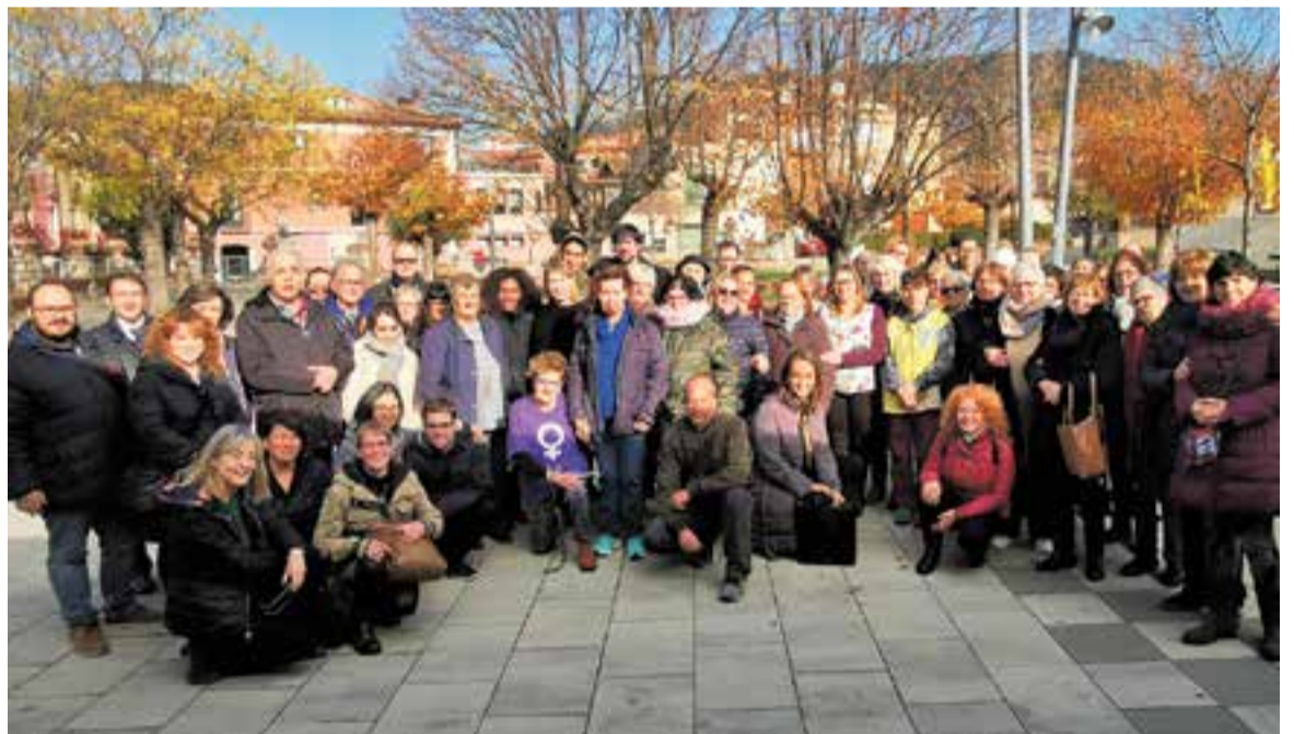
Foto de família després de la lectura del manifest a la plaça Major, dimarts passat.

en comunitat, que provoquen més dosis de solitud forçosa” . El manifest aprofundeix en les causes: “La falta d'accessibilitat dels entorns, productes o serveis; la impossibilitat o dificultat extrema d'exercir els drets fonamentals; la inactivitat obligada: l'absència de suport per a una autonomia personal efectiva; residir en mitjans amb manca de recursos; les actituds reticents i negatives sobre el valor de les persones amb diversitat funcional, etc.” . Margalef ha acabat el manifest dient que Castellar del Vallès “vetllarà perquè tots els serveis oferts des del nostre municipi puguin ser accessibles i inclusius” . +