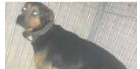
PETTER // Raça: creuada · Adult · Mascle · Pèl curt · En adopció des de maig de 2019