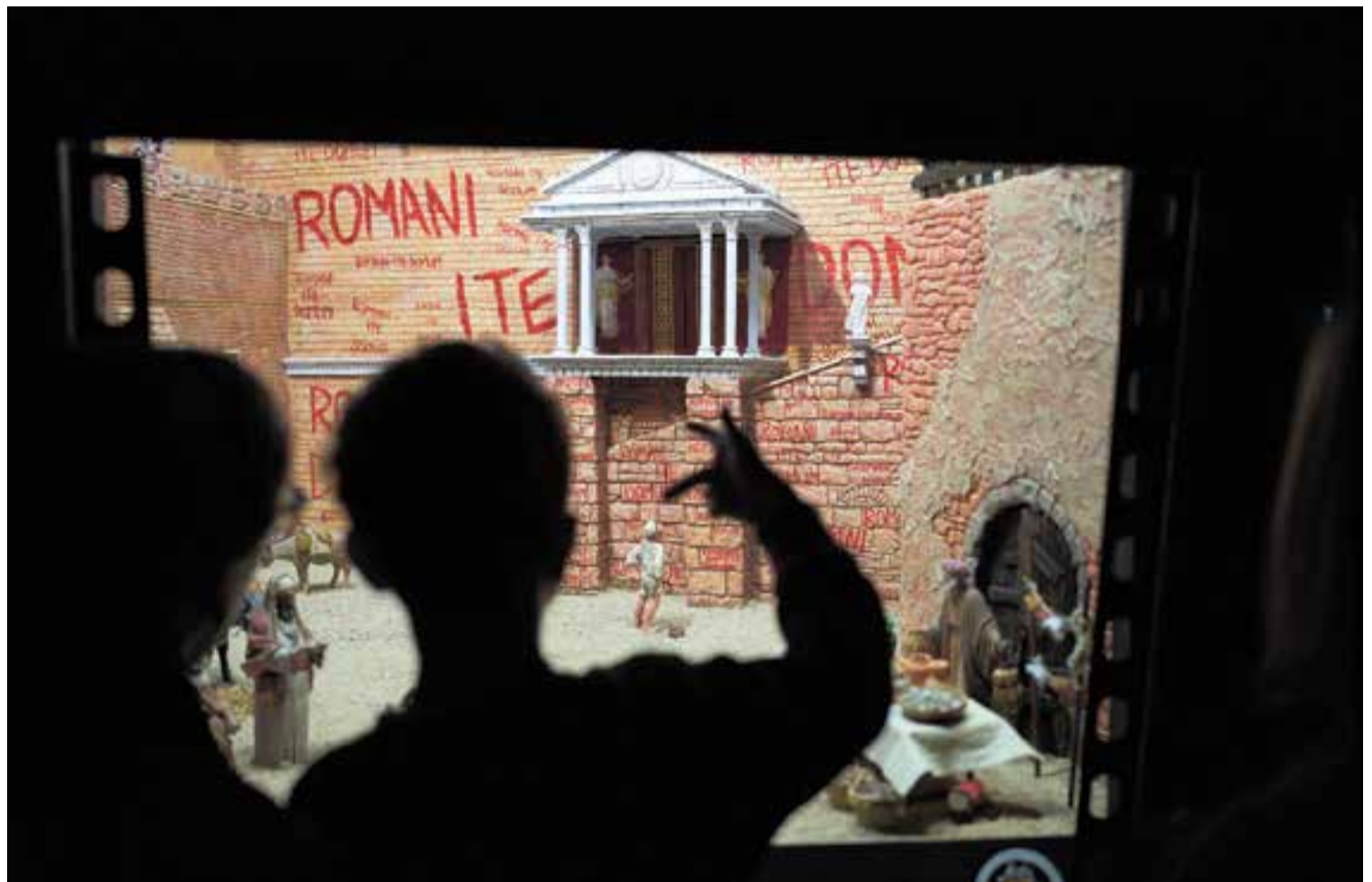
Un dels pessebres de l'exposició d'aquest any adapta el film dels Monty Python 'La vida de Brian'.

Ja fa nou anys que a les exposicions, al tema bíblic, s'hi suma un fil conductor: "Respecte a la temàtica de cinema, estem molt orgullosos amb la feina feta i de la col·laboració amb el Club de