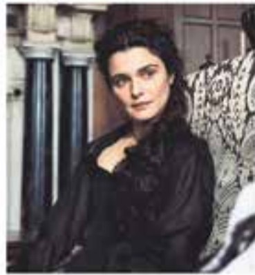
Club Cinema Castellar Vallès