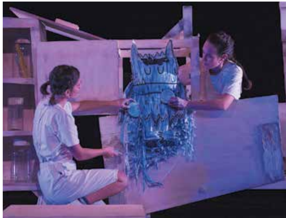
La tristesa, una de les emocions d'"El monstre de colors".