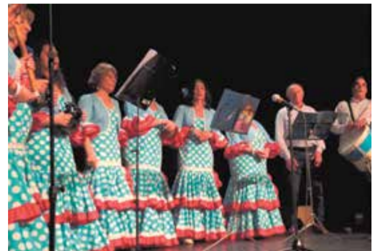
El Cor Aires Rocieros Castellarencs actuarà dissabte a l'Auditori. || CEDIDA

gratuïta, si bé es podran fer donatius. Aquest 2019, les actuacions previstes seran del Cuerpo de Bailes Casa Andalusía Castellar; el Coro Aires Rocieros Castellarencs, el Coro Rociero Ballesteros, de Sabadell; el Coro Alba Rociera, de Sentmenat; el Coro Rociero Sant Julià, i el Coro Rociero Alborada Parets. ➔ || M. A.