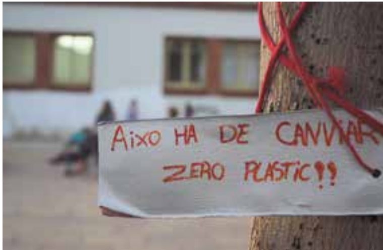
Un dels missatges de l'arbre decorat per alumnes de l'Emili Carles-Tolrà.

altres activitats com la creació d'escultures fetes a partir de materials reciclats, tallers, conferències i vídeos relacionats amb el medi ambient, però també un arbre dels desitjos.