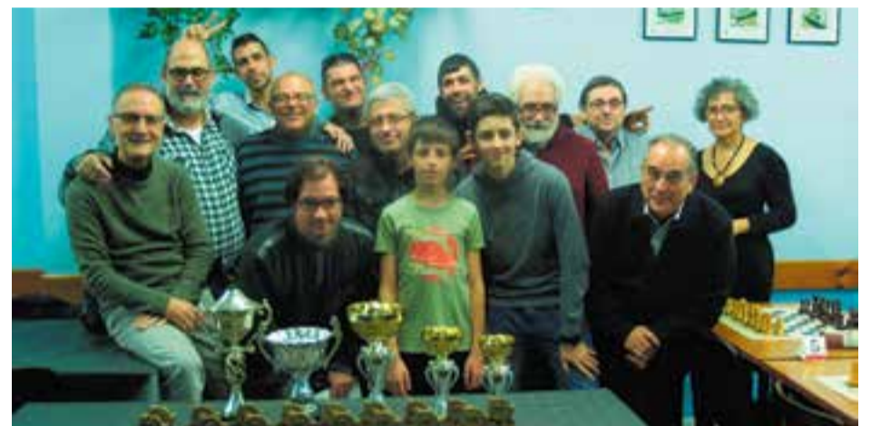
Foto de família amb els participants del Torneig Social del Club d'Escacs Castellar. || CEDIDA