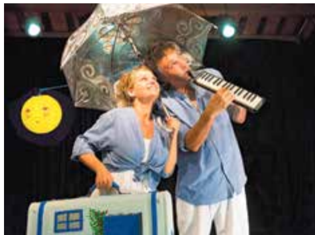
'El núvol gris, gras i gros' de Teatre al Detall.