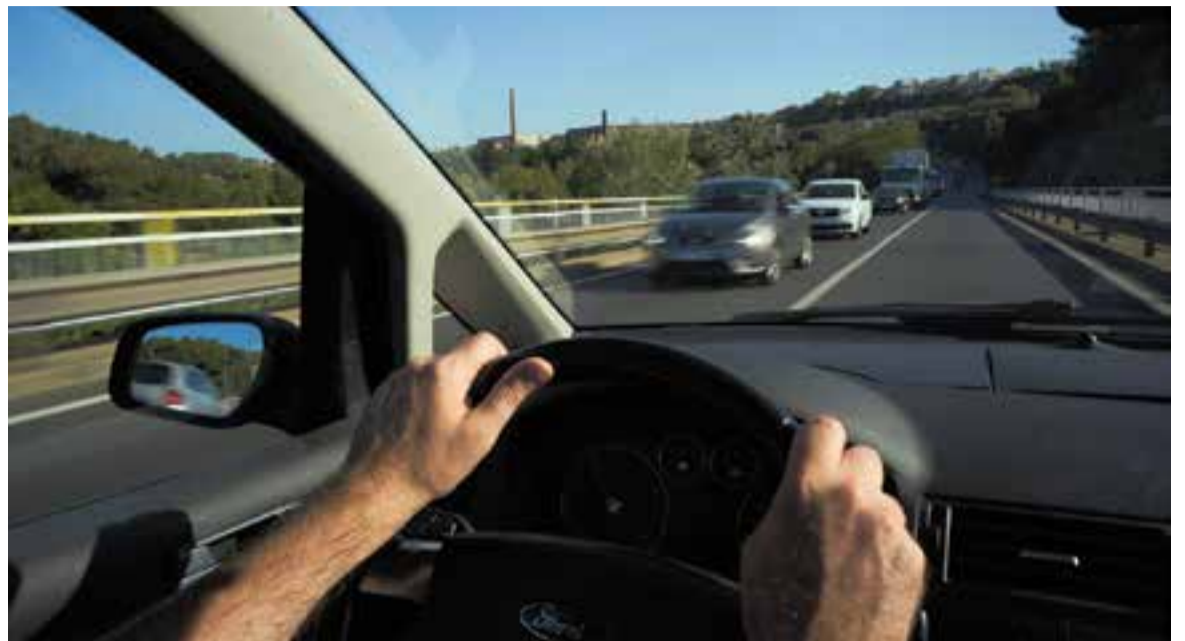
Vehicles travessant el pont de la carretera de Sabadell (B-124) en una imatge recent.

El projecte acordat perllongarà la B-40 des de Terrassa fins a connectar-se amb la Ronda de l'Oest de Sabadell i continuaria soterrada per connectar amb la carretera de Castellar (B-124). Segons ha publicat el diari El País , de fonts de la Generalitat, si l'acord és total –també per part del Ministeri de Foment– es licitarien primer les obres del tram de Sabadell a partir del 2025. El cost aproximat de la infraestructura podria superar els 400 milions d'euros. Segons preveu la Generalitat, aquesta Ronda Vallès servirà per canalitzar uns 40.000 vehicles diaris, dels quals 13.000 creuen diàriament Sabadell per trobar l'autopista, i que en bona part procedeixen de Castellar del Vallès. Des del territori s'intenta superar el concepte del Quart Cinturó i es parla més d'una via interurbana: la Ronda Vallès. "Hi ha