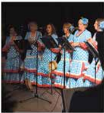
Casa de Andalusia de Castellar