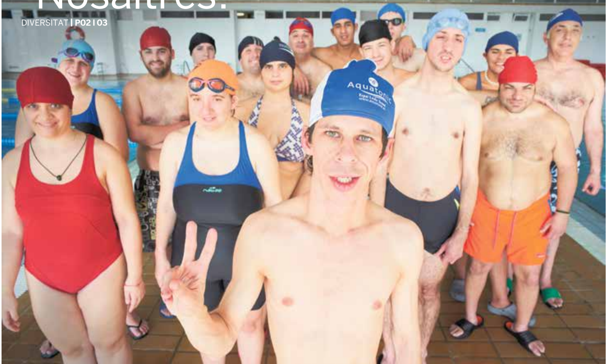
Usuaris del Servei Ocupacional d'Inserció de la cooperativa TEB Vallès a Castellar fent l'activitat de piscina a Sige. Aquest dimarts es commemorava el Dia Internacional de les Persones amb Discapacitat.