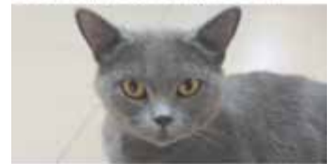
ROXY // Raça: europea · Femella · Pèl curt · En adopció des d'octubre de 2019

No compris, adopta. 29 gossos i 51 gats l'esperen.