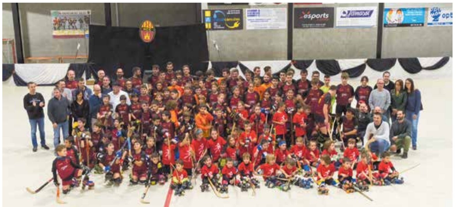
Elts integrants dels equips de l'HC Castellar de la temporada 2019-20 sobre el terratzo del pavelló Dani Pedrosa.

Passades les quatre de la tarda i amb el Dani Pedrosa ple de gom a gom, va iniciar-se una temporada més la desfilada dels integrants del