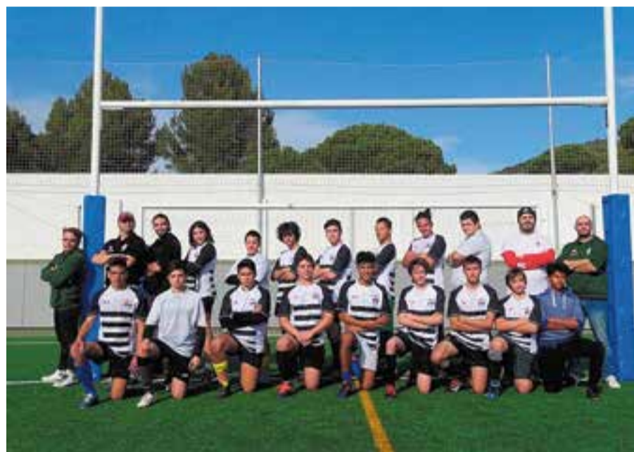
Foto de grup de tots els integrants del combinat de rugbi sub-16.