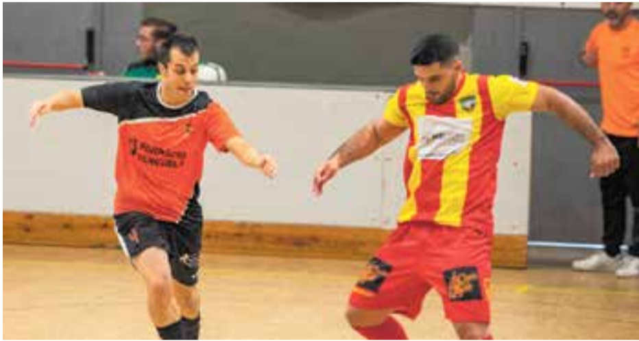
L'FS Farmàcia Yangüela Castellar va estar a punt de donar la sorpresa contra el líder. || A. SAN ANDRÉS

Gran partit tot i la derrota de l'FS Farmàcia Yangüela Castellar, que va plantar cara al líder de la categoria, el Mataró B, que va caure per la mínima 4-3 i va aconseguir trencar les estadístiques del millor equip de la categoria.