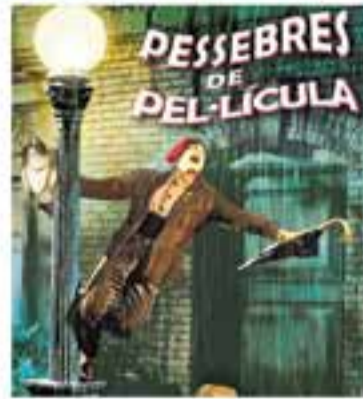
Grup Pessebrista de Castellar

+ INFO: www.castellarvalles.cat , www.clubcinemacastellar.com