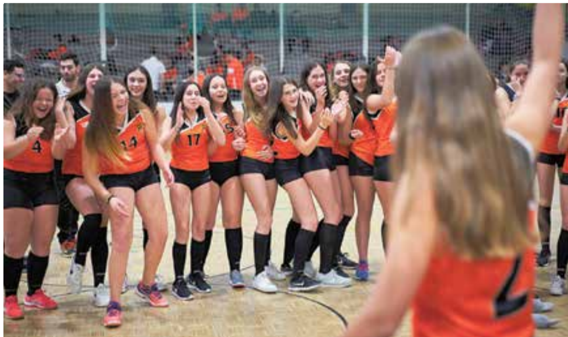
Presentació dels equips femenins de vòlei diumenge passat al pavelló Blume. El FS Castellar suma 330 esportistes.

Però no tot són flors i violes en la direcció d'un club. La gran quantitat altruista d'hores a dedicar són un