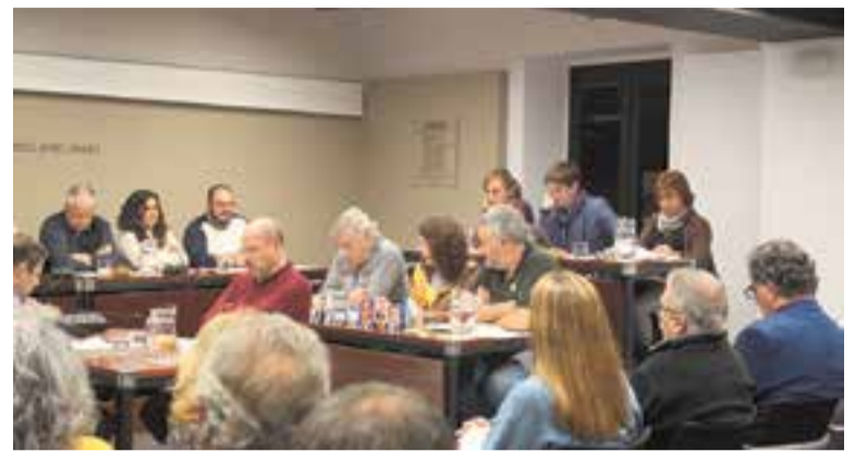
Una imatge del ple de novembre, dimarts passat.