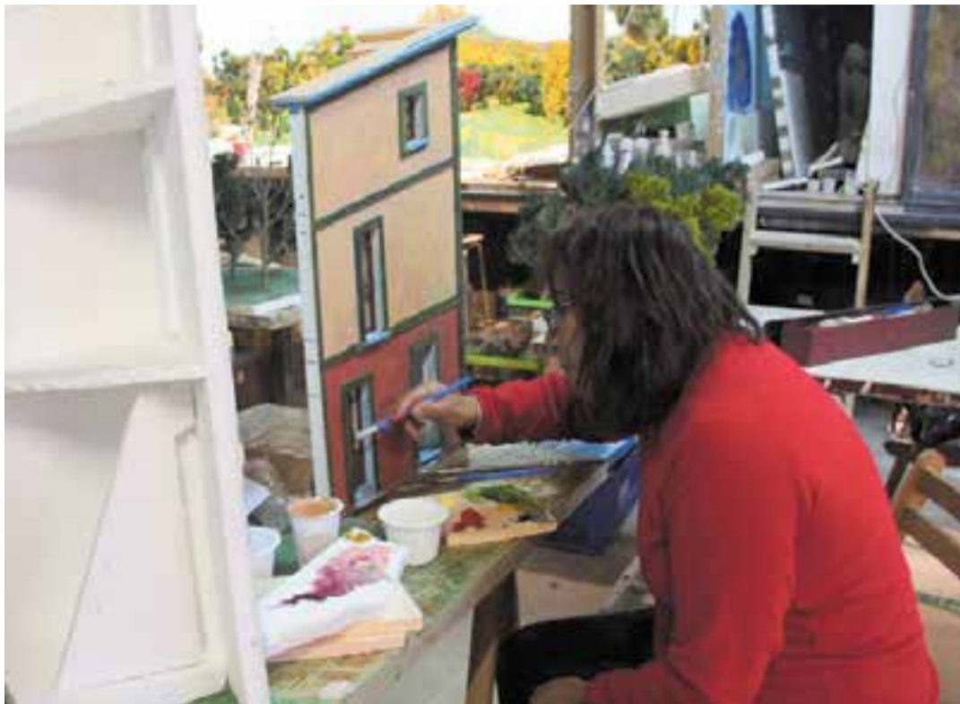
Una pessebrista, a la fase final del pessebre, pintant i retocant les arquitectures que formaran el diorama. || JOAN VIVES

En aquest sentit, enguany el Grup Pessebrista de Castellar compta amb la col·laboració d’una altra entitat castellarenca, el Club Cinema Castellar Vallès. És per aquest motiu que el CCCV s’ha encarregat d’idear i muntar l’exposició de dalt, titulada Viatge a l’interior d’una