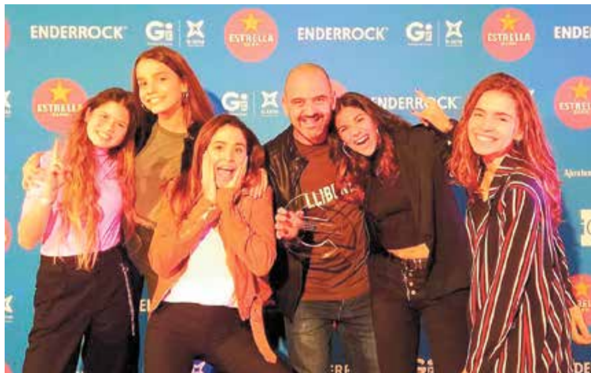
Un dels darrers reconeixements ha estat el premi Enderrock pel disc 'Escandaliciós', el segon que ha rebut Macedònia.

El grup Macedònia fa lletres per a nens i nenes de primària, quan deixen l'animació infantil i abans d'escoltar els concerts de Festa Major, el que poden entendre entre els 11 i 15 anys. "Seguim tossuts, pensant que som necessaris" , però també s'adonen que el públic passa dels grups d'animació infantil com Xiula, El Pot Petit o Reggae per Xics a grups com Txarango, Catarres, Lildami, etc., "que fan lletres precioses, no dic que no, però que parlen de temes com sortir de festa" . En aquests concerts cada cop hi ha més nens i nenes de 7 a 12 anys, "cantant lletres que són per a gent més adulta" . S'han convertit en grups de música familiar i els programadors també ho enfoquen d'aquesta manera. "A mi em costa entendre-ho perquè les lletres de les seves cançons no estan pensades per a ells, sinó per als pares a qui els agrada aquest tipus de música" .