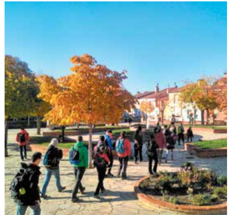
Assistents a la sortida organitzada pels 'llibertaris' diumenge passat.