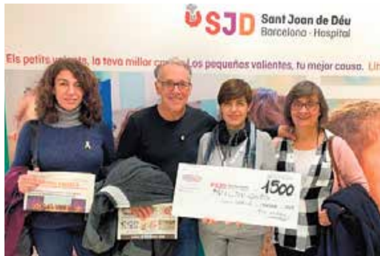
Donació de TIC Escènic a l'Hospital Sant Joan de Déu.