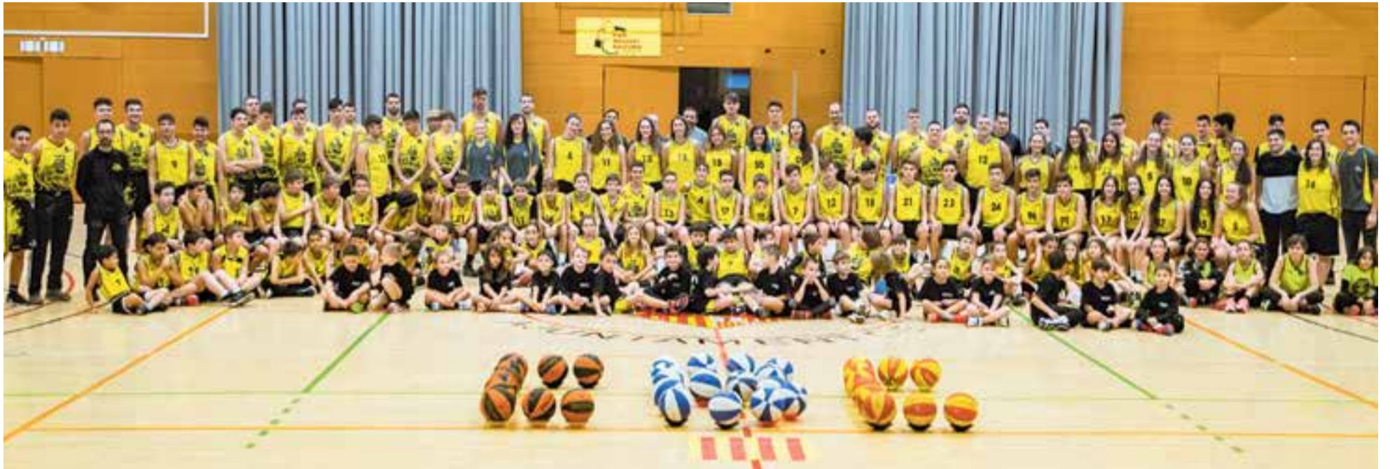
Els integrants del CB Castellar durant la presentació dels equips de la temporada 2019-20 al pavelló Puigverd.

El CB Castellar també presenta tots els equips de la temporada 2019-2020 en un acte al Puigverd