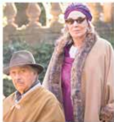
Club Cinema Castellar Vallès