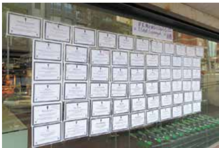
Les Carnera van penjar esqueles de les dones mortes a l'Estat el 2019.