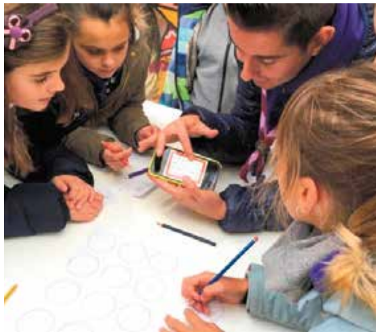
Un dels monitors del Xiribec amb un grup d'infants.

Així, amb aquesta il·luminació, es volia sensibilitzar els conductors de l'aplicació de la Convenció dels Drets dels Infants, especialment els que viuen en situacions més vulnerables. ✦