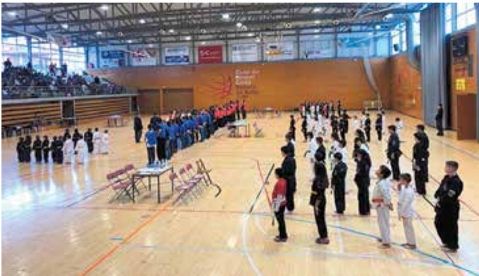
Participants in the first edition of the American Kenpo Catalunya.

El Puigverd va esdevenir en l'epicentre del kenpo a Catalunya durant unes hores amb un torneig que arriba per quedar-se a una vila on aquesta modalitat d'art marcial està cada vegada més arrelada. ✦