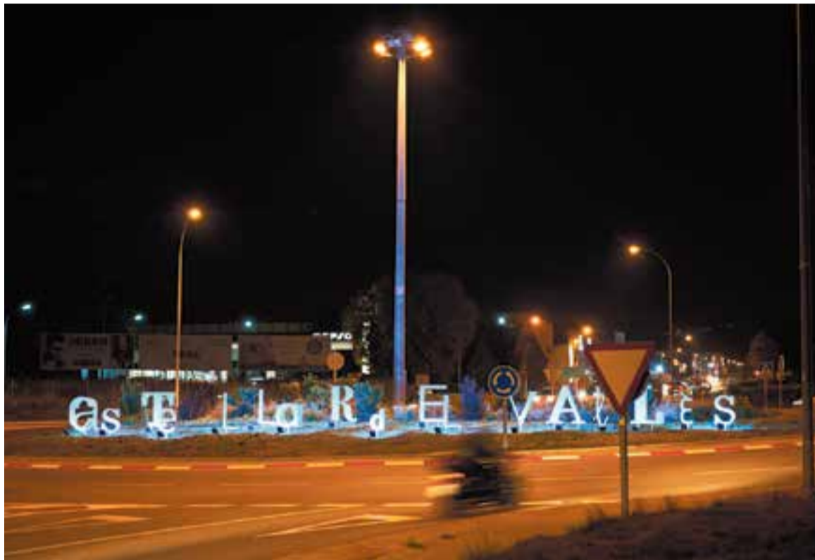
La rotonda d'entrada a Castellar del Vallès il·luminada amb motiu del Dia Universal dels Drets dels Infants.

LA CONVIVÈNCIA, CLAU EN LA INTEGRACIÓ “La participació en les activitats va ser molt positiva i enriquidora. La reflexió que hi havia darrere dels jocs va ser interessant per a ells: tots podem tenir arrels diferents, però el més important és conèixer-nos, respectar-nos i compartir. A més, ens emportem jocs que no hauríem conegut, però que