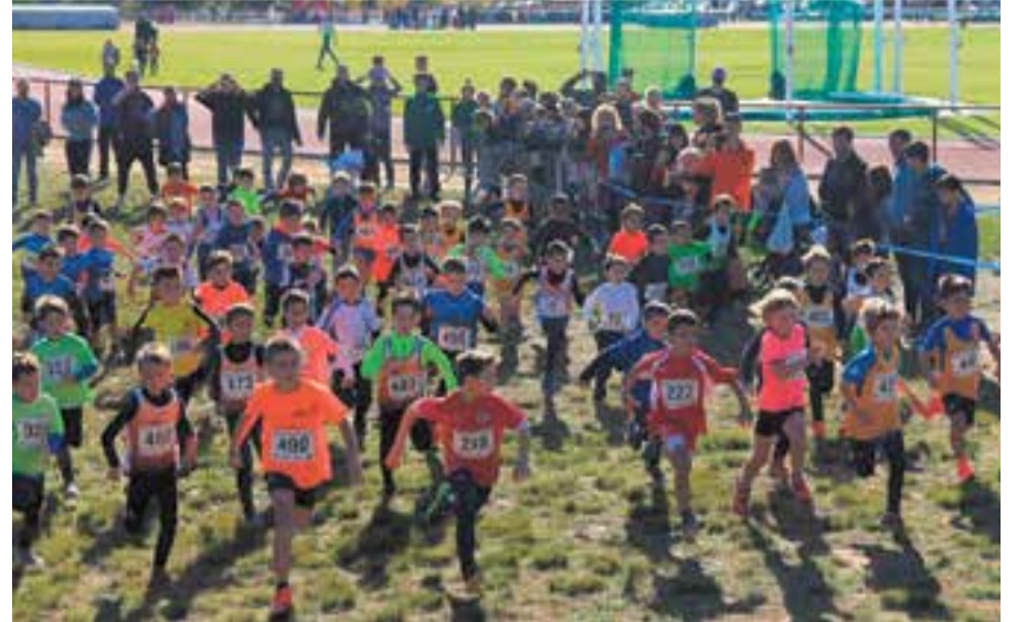
La nodrida presència de corredors va deixar bones estampes.