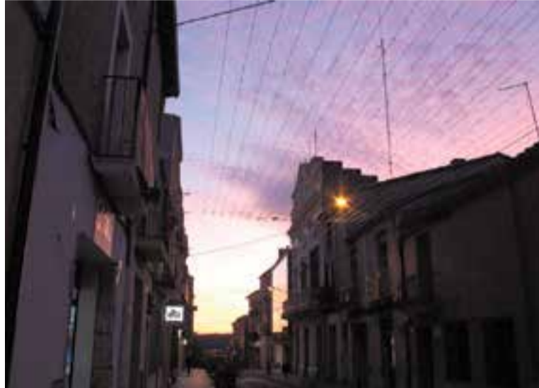
Aquest és l'aspecte dels llums de Nadal de la plaça Major.

Enguany, els carrers de Castellar llueixen diferents gràcies a la renovació dels punts de llums. L'Ajuntament ha dut a terme enguany una inversió, que tindrà continuïtat l'any que ve, per millorar significativament