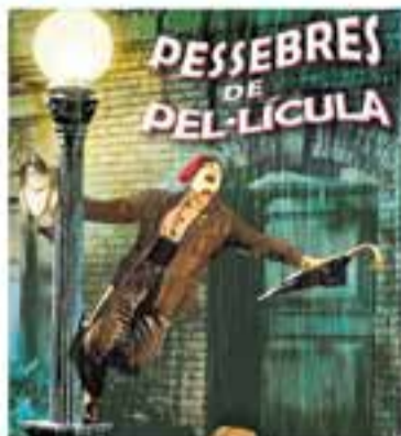
Grup Pessebrista de Castellar

+ INFO: www.castellarvalles.cat , www.clubcinemacastellar.com