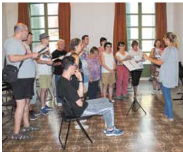
Assaig de la Coral per concert de diumenge a l'Auditori Municipal. || M. A.