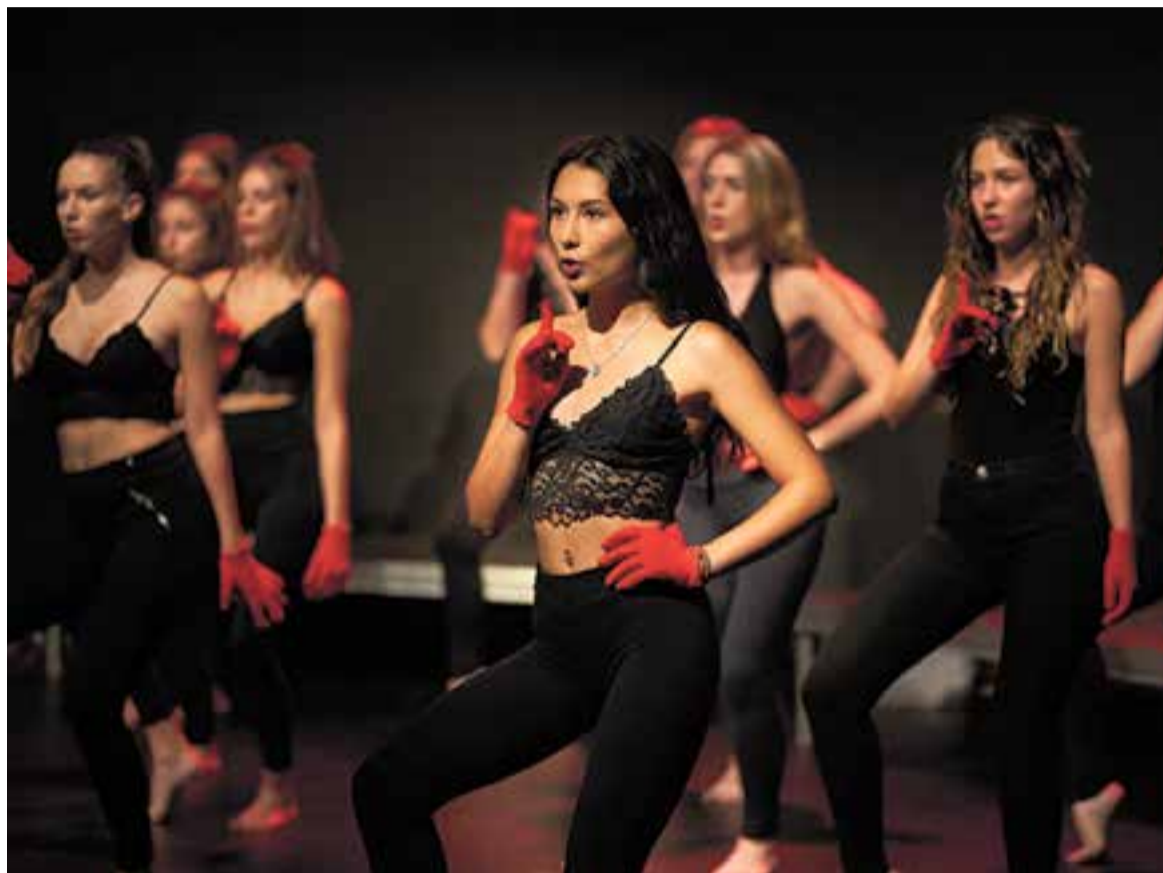
Moment d'un dels números de l'espectacle 'Salta al buit' amb SOM-night. || Q. PASCUAL

Tres anys després de la seva estrena, Salta al buit va tornar a demostrar el per què de l'èxit aconseguit cada vegada que s'ha mostrat a l'escenari. Aquest cop, retrobem una companyia més madura i amb prou talent per lluir, com ja feia, i que torna a pujar a l'escenari amb un espectacle revisat, actualitzat i amb més energia que quan va donar-se a conèixer. + || M. ANTÚNEZ