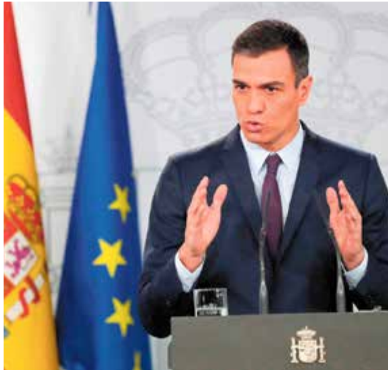
Pedro Sánchez, en la seva darrera compareixença a la Moncloa.

valorem la convocatòria d'eleccions del 10-N. Des de la CUP Castellar no tenim res més a dir que les nou detencions fetes a diferents municipis durant dilluns el matí són el primer acte de campanya electoral del PSOE. Les idees estan sent perseguides i les detencions són arbitràries. La gravetat de les acusacions que els imputen i la vulneració de drets bàsics que suposa és absolutament intolerable. No podem normalitzar la repressió, cal que totes les institucions del país es posicionin de forma clara i inequívoca en contra de l'operació repressiva d'avui. És a la societat civil a qui ens toca respondre, ja que es vol evitar