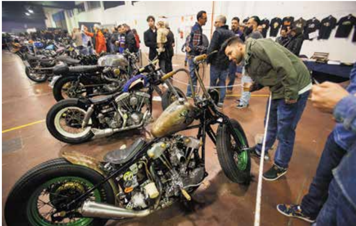
Exhibició de motos clàssiques de l'Espai Tolrà en una de les darreres edicions de l'Speedfest.

Concretament, l'Espai Tolrà aplegarà una vintena d'expositors de tallers, artistes del custom , estudis de tatuatges i botigues d'accessoris i marxandatge, tant d'equipament de motos i cotxes com de roba. "El 'custom' és un estil de vida. No és només 'tunejar' un cotxe", constata Cristino. A partir de les 11 h i fins a les 19 h, faran parada a l'Espai Tolrà el taller sabadellenc V8 Classic Trucks, Sarmi Garage Motorcycles de Barcelona, la botiga Vintage Speedshop