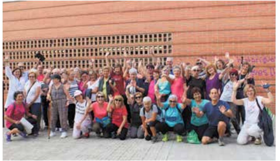
Primera 'Caminada saludable' després de les vacances d'estiu.

Del 16 al 22 de setembre s'ha celebrat a Catalunya la Setmana Europea de la Mobilitat, que promou hàbits de mobilitat més sostenibles, segurs i saludables. Castellar del Vallès s'ha sumat un any més a aquesta iniciativa, que aquest 2019 porta per lema 'Camina amb nosaltres!'. Precisament, la 'Caminada saludable: Camina i fes salut' enguany també s'ha afegit a la festa de la mobilitat sostenible. Dimecres, una cinquantena de persones van fer un recorregut d'uns 4 km pels voltants privilegiats amb què compta la nostra població. La retrobada després de l'estiu va ser molt emocionant. Petons i abraçades entre els participants després d'algunes setmanes sense l'activitat setmanal. "No només millorem la salut física amb aquestes caminades, també la mental. Potser la part social és més important, fins i tot. Aquesta setmana, a més, ho fem en el marc de la Setmana Europea de la Mobilitat. Som un