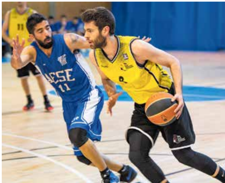
El CB Castellar tindrà al davant una temporada complicada. || A. SAN ANDRÉS