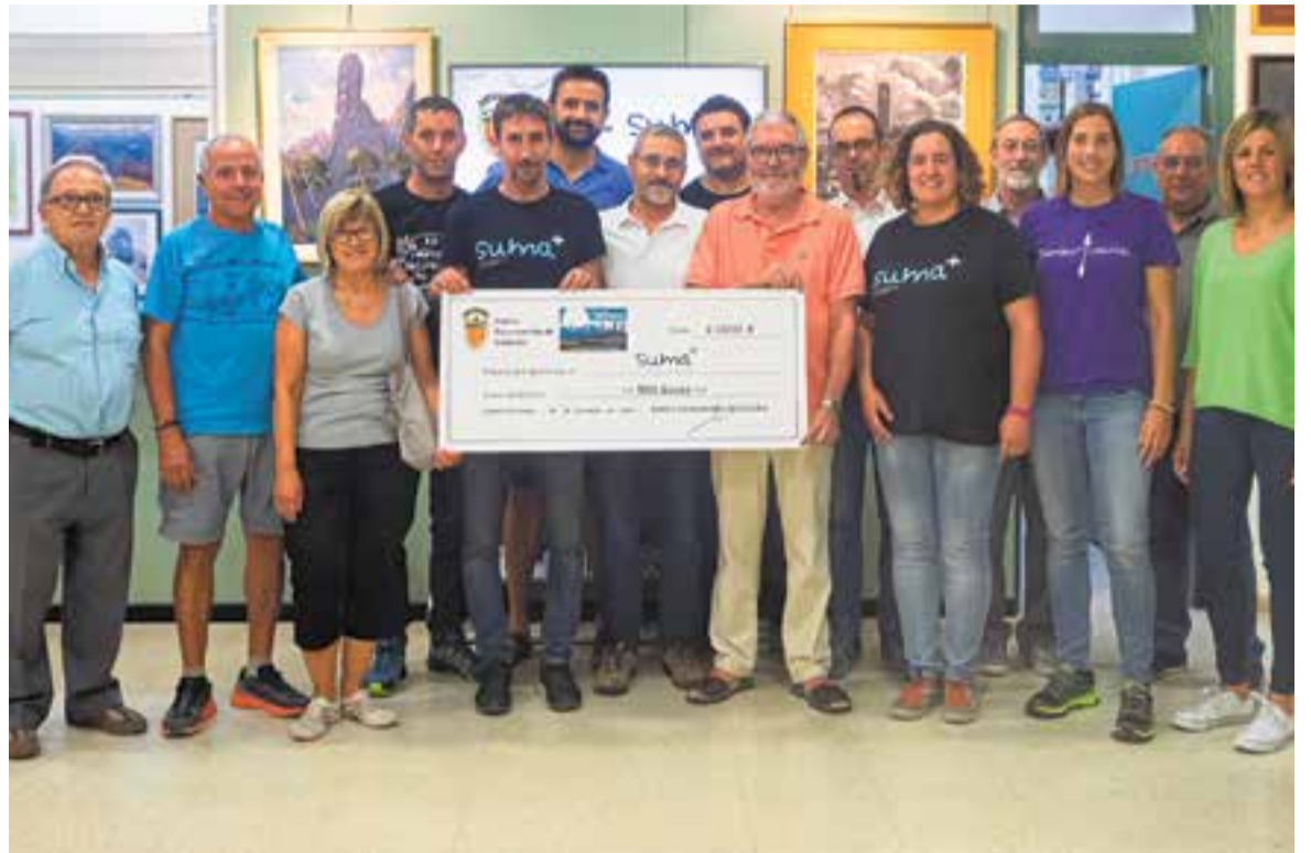
El Centre Excursionista de Castellar va lliurar dimecres a Suma+ un xec solidari per import de 1.000 euros. || M. ANTÚNEZ

La Marató va néixer amb la intenció d'unir tot un poble en una mateixa causa, recollir fons per millorar l'atenció de l'alumnat amb diversitat de necessitats, en els nostres centres educatius. Les activitats i actes que organitzen des de l'associació són totalment inclusius, pensats per gaudir en companyia dels veïns. Els comerços, empreses i administracions col·laboren de manera conjunta per donar suport a aquesta causa. + || MARINA ANTÚNEZ