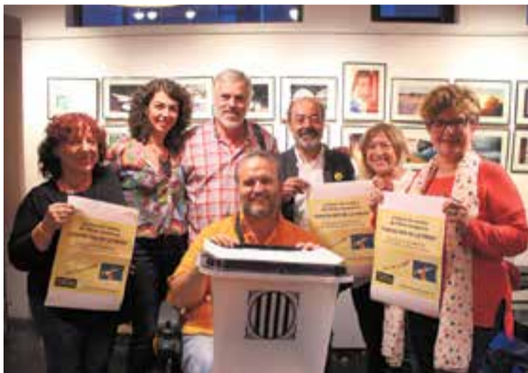
Una representació de Castellar per les llibertats, dimecres passat, al Calissó