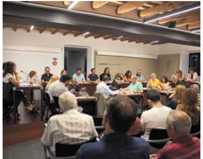
Imatge del ple de dimarts passat amb públic assistent i membres del consistori.

En canvi, no van prosperar les dues mocions relacionades amb el procés que, en aquesta ocasió van trobar el vot contrari de l'equip de govern. ERC va demanar que s'estudiï fer un homenatge a l'1-O –que aviat farà dos anys– batejant amb aquest nom un espai públic de la vila per commemorar un dia que “ha passat a la història de Cata-