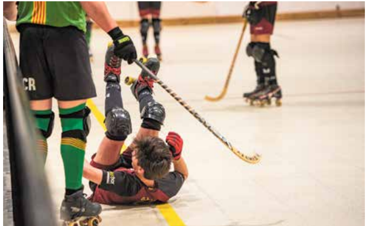
L'HC Castellar va tornar a caure en la segona jornada de lliga. Aquesta vegada contra el Cadí.

Sobre la pista, però, l'equip grana va lluitar en igualtat de condicions durant la primera part i va rematar un marcador advers i empatar a dos. Amb la igualada, el Castellar descuidava la defensa i encaixava un d'aquells gols absurds que era definitiu per a les aspiracions dels castellarencs. De poder passar a capgirar el marcador, el 3-2 va definir la línia a seguir pels locals, que en la recta final aconseguien el quart gol. Jorge Rey, amb un hat-trick , i Jan Roca eren els