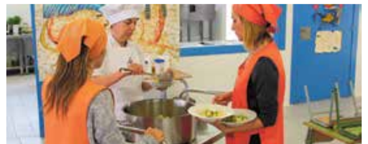
Imatge d'arxiu del menjador de l'escola Joan Blanquer.

El curs 2019-2020 ha començat amb l'atorgament de 208 beques de menjador atorgades a famílies amb infants escolaritzats. El Consell Comarcal del Vallès Occidental és qui s'encarrega de gestionar el pressupost que el Departament d'Ensenyament de la Generalitat dedica a aquest àmbit, mentre que l'Ajuntament de Castellar del Vallès hi farà, per vuitè any consecutiu, una aportació extraordinària de 50.000 euros. Aquest import es destina a complementar els imports d'algunes de les beques ja atorgades. En total, el Consell Comarcal ha rebut un total de 228 sol·licituds de població castellanca. D'aquestes, 62 no s'han pogut atendre perquè no complien els requisits, mentre que 16 es troben en procés de resolució. Les restants, 150, són les ajudes que ja s'han atorgat. + || REDACCIÓ