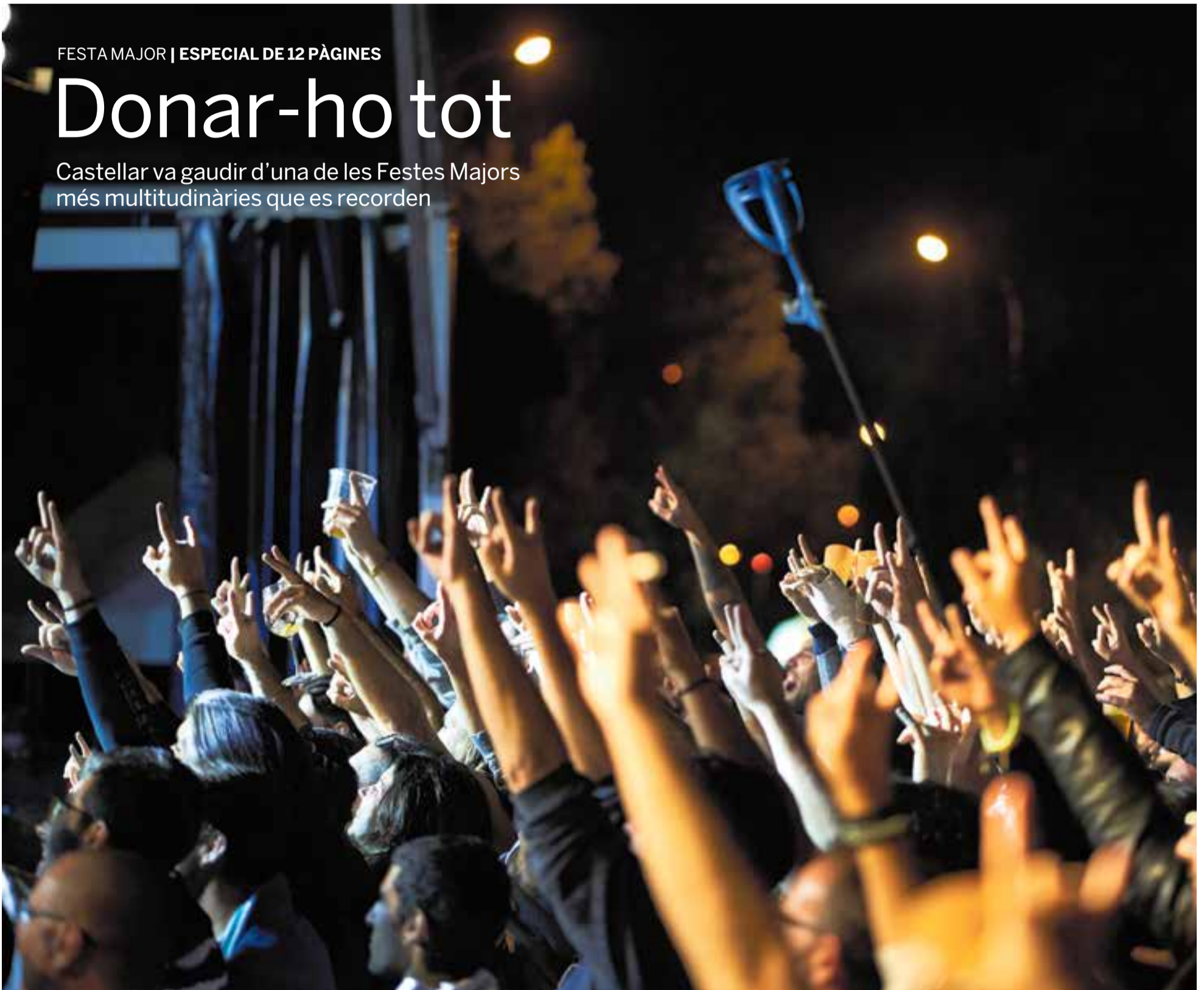
Els concerts i les activitats de nit van sumar milers d'assistents. A la imatge, el públic de Vilabarrakes segueix el concert del grup sevillà O'Funk'illo, dissabte a la nit.

Castellar va gaudir d'una de les Festes Majors més multitudinàries que es recorden