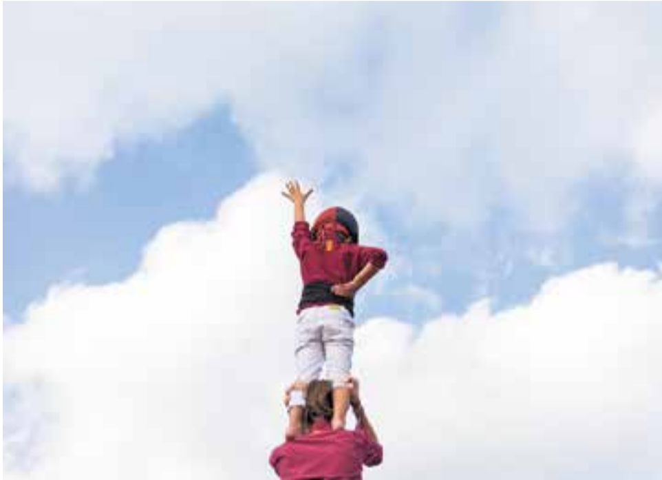
L'enganeta dels Capgirats fa l'aleta després d'haver carregat un castell de Festa Major.

Dissabte quatre colles castelleres van fer un bon paper