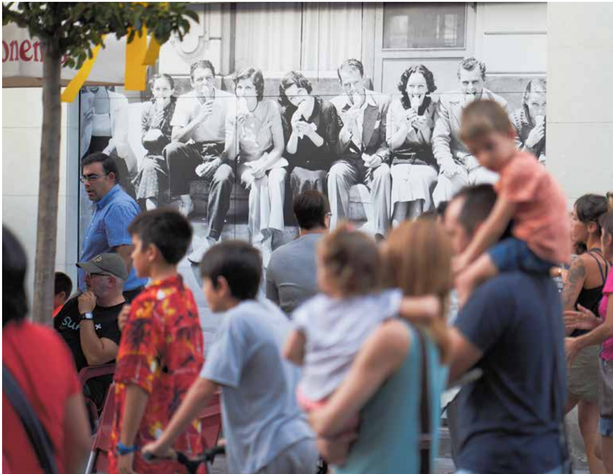
Durant quatre dies els carrers i places de Castellar s'han omplert de veïns i veïnes amb ganes de participar de la seva Festa. A la imatge, el concorregut carrer Sala Boadella dissabte passat.

La vila viu, durant cinc dies, una Festa Major amb assistències multitudinàries