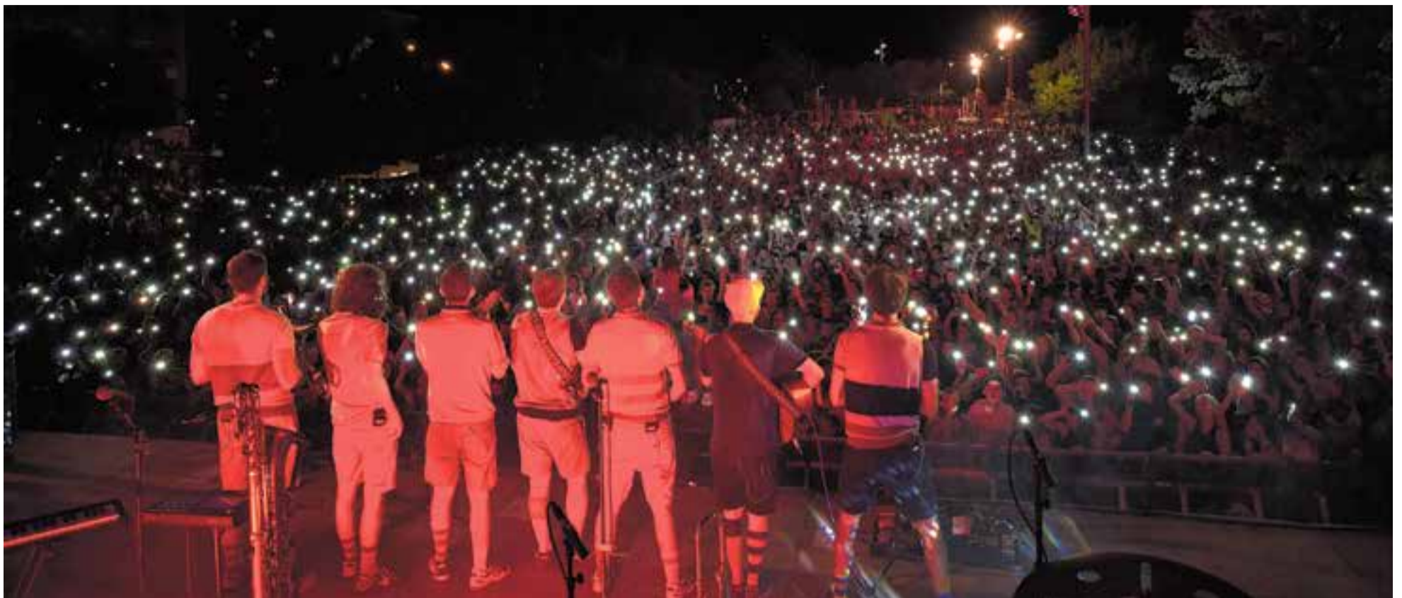
Els músics d'Oques Grasses es van alinear davant del públic que, entusiasmats, va acompanyar una de les cançons amb la il·luminació dels mòbils. || Q. PASCUAL