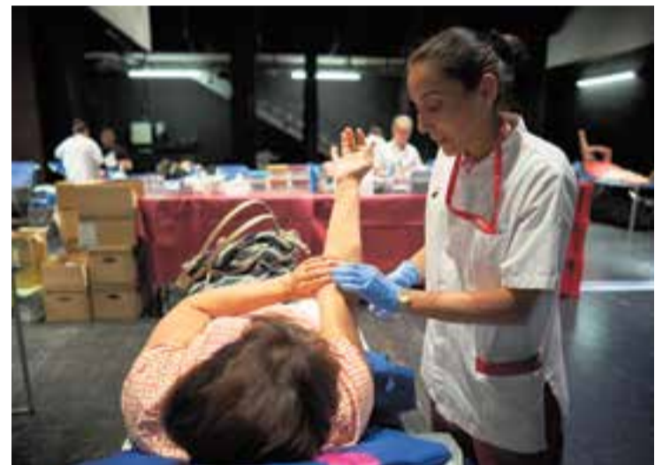
Una de les més de 230 donants de sang, divendres passat. || Q. PASCUAL

La Marató de Donació de Sang, una iniciativa que va muntar divendres passat la delegació local del Banc de Sang per a celebrar el 50è aniversari de les primeres donacions a Castellar del Vallès, es va cloure amb 232 donacions més 5 de plasma. Dels 237 donants, 49 van ser nous. “Estem molt contents de l'èxit de la convocatòria”, explica Ramon Moix, delegat local del Banc de Sang, que afegeix que en una jornada normal es recullen com a màxim 75 donacions. El nombre de persones que van acudir a l'Auditori Miquel Pont en aquesta jornada solidària va ser superior al nombre total de donacions, ja que 29 persones no van poder-ne donar per diferents motius. En conjunt, doncs, per l'Auditori van passar 266 persones en una marató que va durar 11 hores. Els donants, després d'omplir un qüestionari i mesurar la pressió arterial i el nivell de ferro, pujaven a l'escenari de l'Auditori. Dalt de l'escenari, hi havia 15 llitres per fer les donacions. Transcorreguts uns 10 minuts i feta la donació d'uns 475 mil·lilitres de sang, cada donant estava convidat a passar pel vestíbul de l'Auditori, on podia prendre un refrigeri per refer-se. Els voluntaris insistien que calia beure líquid encara que no es tingués set. Moix ha remarcat que la intenció del Banc de Sang és organitzar una iniciativa semblant l'any que ve, si pot ser per Festa Major, encara que s'han de precisar les dates definitives. + || J. RIUS