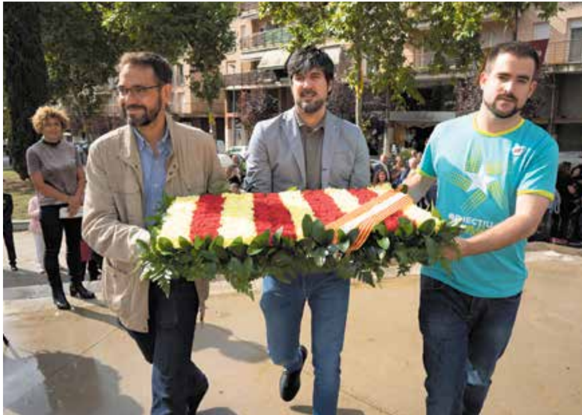
L'alcalde de Castellar, el primer tinent d'alcalde i el portaveu de Junts x Castellar a l'ofrena institucional.