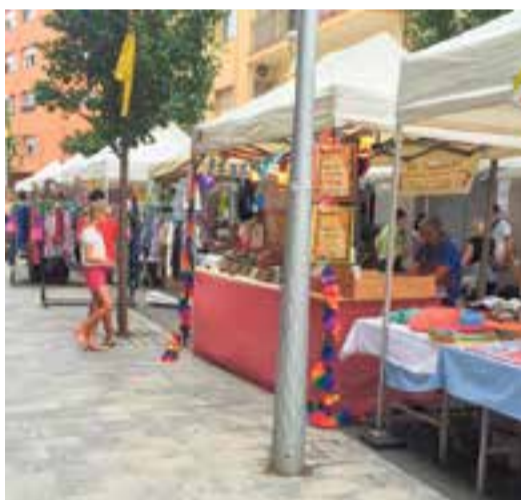
El degoteig de visitants a la fira va ser constant || R.G.