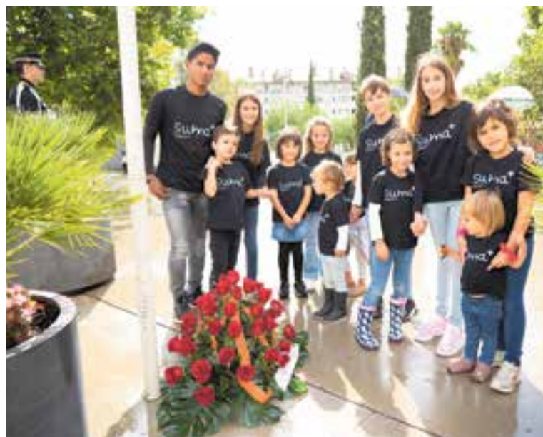
L'entitat Suma+ va ser l'encarregada de fer l'ofrena de la societat civil a l'acte institucional. || Q.P.