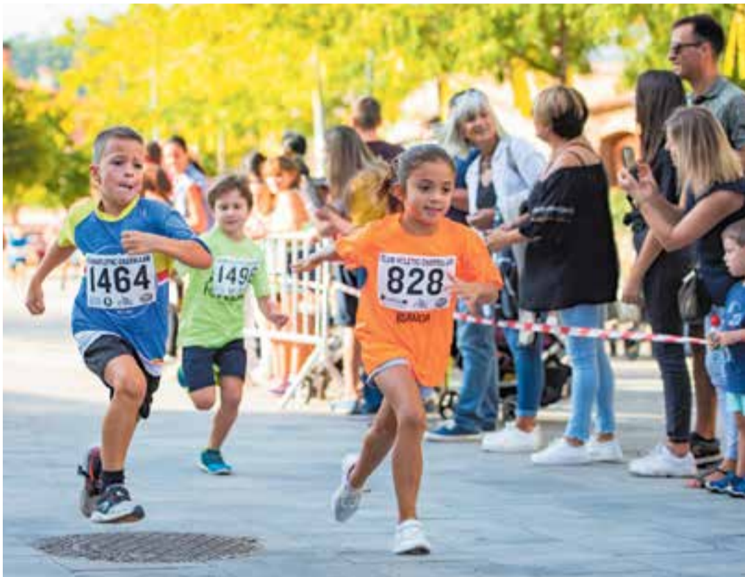
La Cursa Popular és una de les activitats esportives principals de la Festa Major de Castellar.