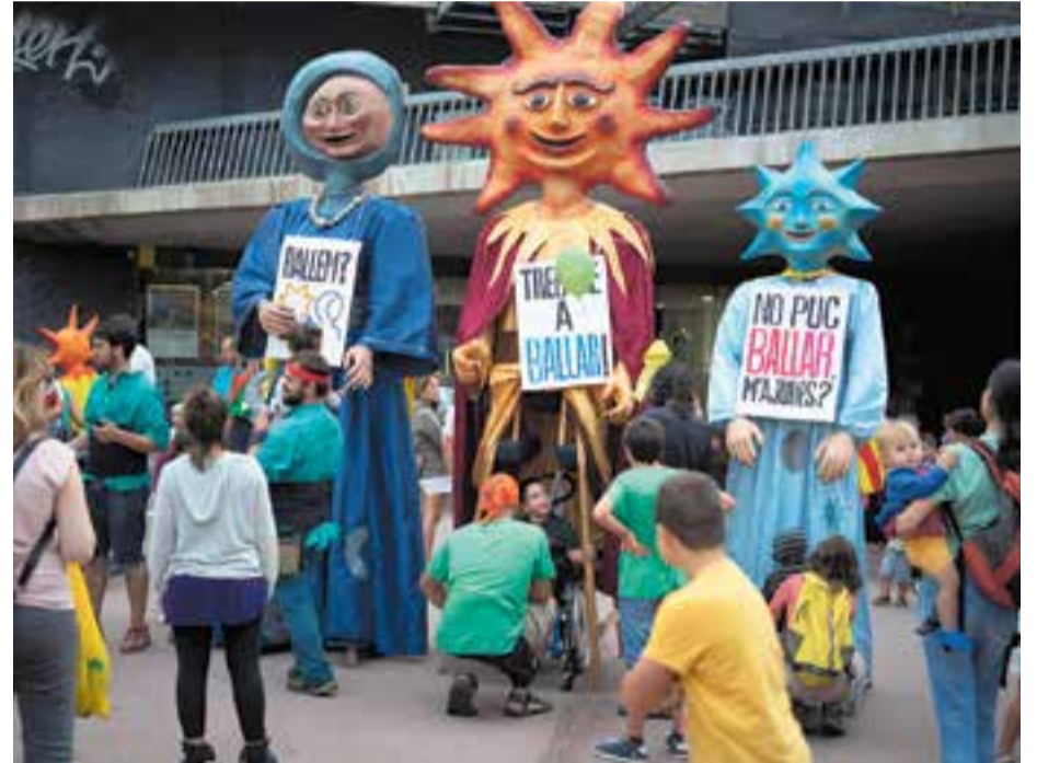
El Sol, la Lluna i l'Estel van captar l'atenció dels més menuts la tarda de diumenge de Festa Major. || R.G.

Crida a la ciutadania per preservar la tradició gegantera