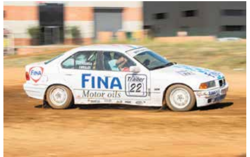
El sempre espectacular 'Mou-te' de l'Escuderia T3 al circuit del Pla de la Bruguera.

amb 350 participants, va ser l'acte més nombros