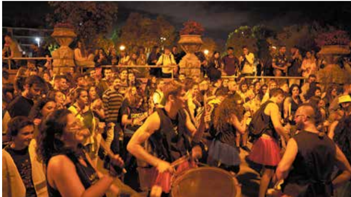
Una riuada de gent segueix el ritme de la batucada del Correlokals, al carrer Major.

El fet que coincideixin, un any més, les festes majors de Sabadell i de Castellar va afectar mínimament l'afluència de gent al Correlokals, que és una cita local imperdible i que, a més, sempre aconseguix atraure gent de fora. Segons fonts de l'organització, el nombre de persones que va participar al Correlokals va ser superior a l'any passat, quan hi