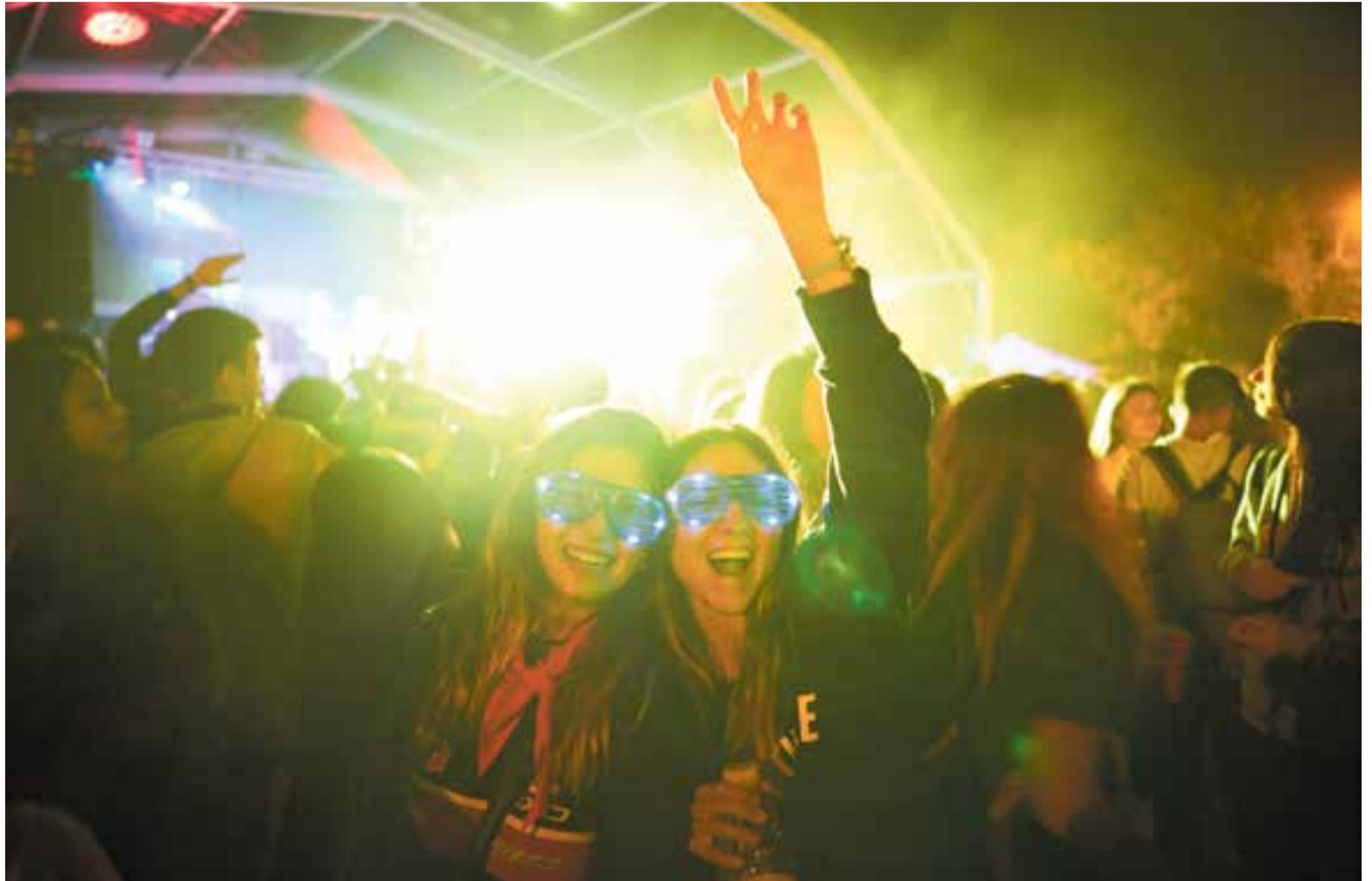
Dues castellanques amb ganes de festa durant una de les actuacions que s'han dut a terme a Vilabarrakes, el punt de trobada més desfermat de la Festa Major.

i assessorament, promogut per la Coordinadora Feminista de Castellar del Vallès i l'Ajuntament, amb la col·laboració de l'entitat Vilabarrakes, era prevenir situacions de violència masclista i acompanyar possibles víctimes d'agressions sexistes.