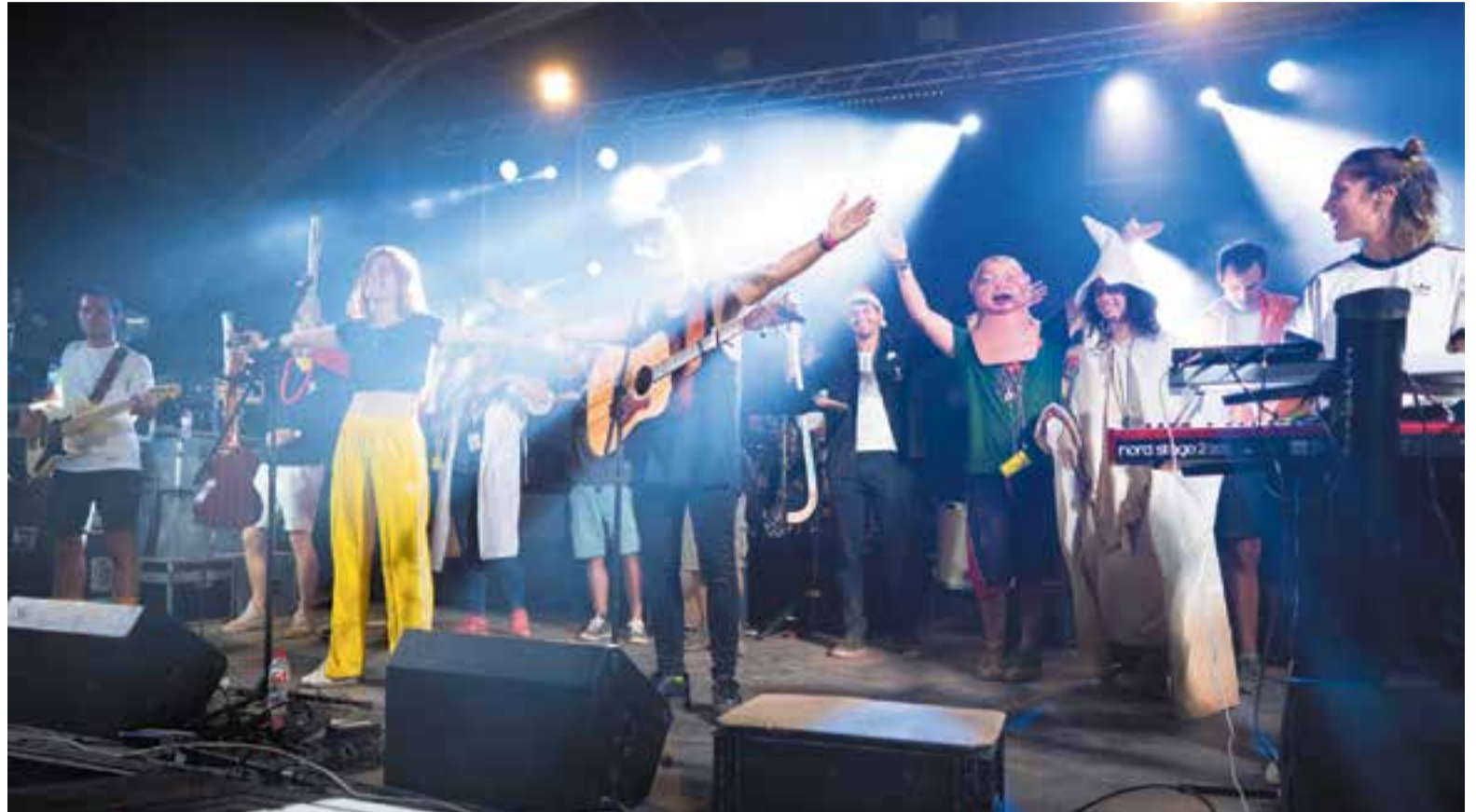
El grup egarenc Sense Sal i representants dels diferents col·lectius de Vilabarrakes saluden des de l'escenari els assistents a la festa de diumenge.

El darrer èxit del grup, però, no eclipsa tota la feina que Sense Sal ha fet des de fa molts anys per la música catalana. Després de redefinir-se múltiples vegades, s'han trobat còmodes creant textures cada vegada més electròniques. Ho demostra el seu darrer disc Noméstenim la veu (Música Global,