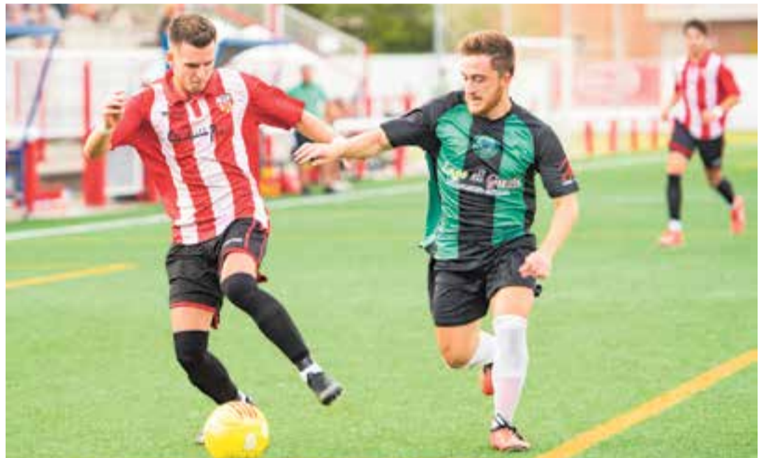
L'extrem Àlex va desbordar la banda dreta a més d'aconseguir el segon gol del partit a la segona part. || A. SAN ANDRÉS

El xut exterior de Saavedra, la major llibertat dels davanters Estrada i Toni Murillo, els galons aportats per Rodri i Granados en defensa i sobretot la sensació d'equip compacte fan del Castellar un conjunt amb una personalitat marcada i que es farà respectar en una categoria en què serà un dels màxims favorits. Tot això, sempre que l'equip mantingui els peus a terra. ➔