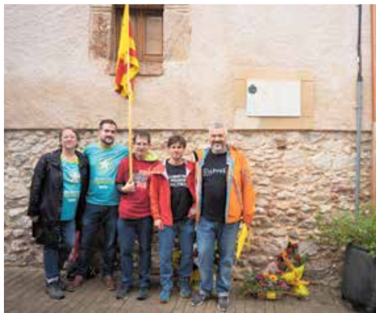
Membres de Junts per Cast, la CAL i ERC a l'acte independentista de Cal Targa. || Q.P.