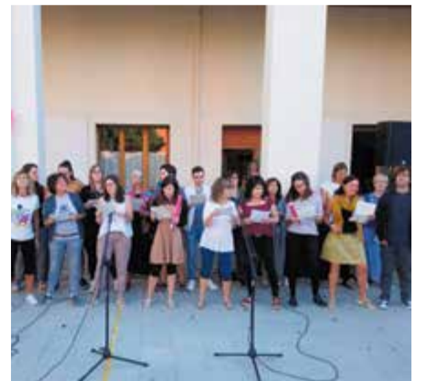
Benvinguda del professorat de FEDAC Castellar als alumnes.

El curs 2019-2020 ja està en marxa. Un total de 4.122 alumnes van començar les classes aquest dijous. La novetat principal d'aquest any és que els cicles formatius de la família agrària que fins ara depenien de l'Institut Castellar s'han segregat i passen a formar part d'un nou institut, l'Institut d'FP de Castellar. L'altra novetat destacable és la conversió de l'Escola Sant Esteve en institut escola. Dels més de 4.000 alumnes que iniciaran el curs a la vila, 3.644 són d'educació infantil i primària i secundària que començaran a partir del 12 de setembre: 630 corresponen a educació infantil; 1.655, a educació primària, i 1.359 cursaran educació secundària obligatòria. La setmana que ve també començarà el curs l'alumnat matriculat als estudis postobligatoris: 327 alumnes ho faran a batxillerat; 136, als cicles formatius de grau mitjà i superior; i una quinzena, al programa de formació i inserció d'auxiliar d'hoteleria: cuina i serveis de restauració. Els professors de FEDAC Castellar van rebre els alumnes al pati de l'escola el primer dia de classe amb una versió adaptada de tema Qualsevol nit pot sortir el sol de Jaume Sisa. + || REDACCIÓ