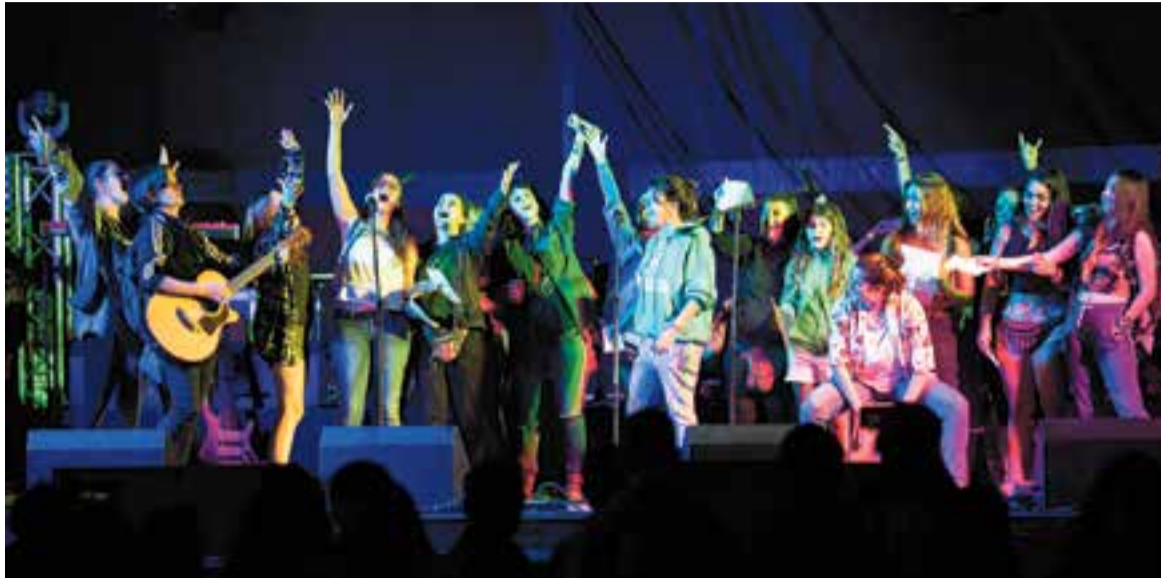
Una vintena de membres de Les Carnera va interpretar el seu manifest a ritme de garrotins.