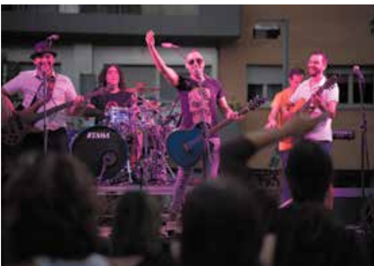
La banda local Mucca Failate va tornar a actuar a la Festa Major.

Tot plegat va coincidir amb una efemèride ben curiosa de l'ETC. Des de la colla gegantera van recordar que dilluns passat va fer 40 anys de la revolucionària cercavila dels gegants i capgrossos de Castellar que va portar alguns veïns de la vila al calabós per considerar aquesta activitat irreverent i ofensiva amb els poders polítics, militars i eclesiàstics. Eren temps difícils per fer humor i recórrer a la ironia, sobretot a l'espai públic. ✦