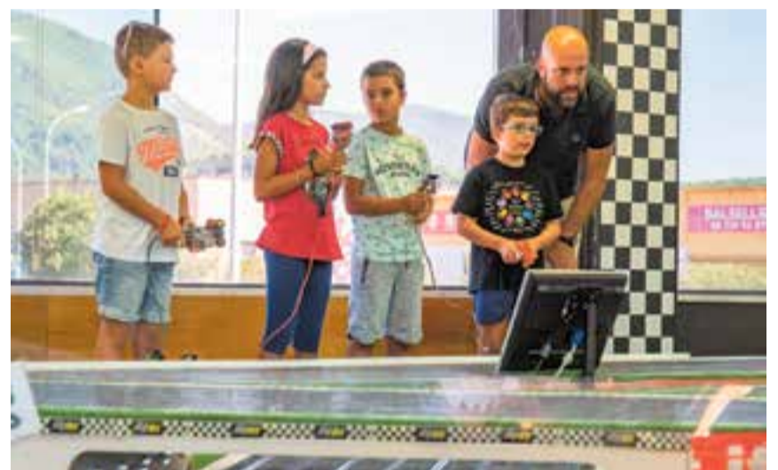
El club d'slot Budellets es va omplir de grans i petits dissabte al matí. || A.S.A.