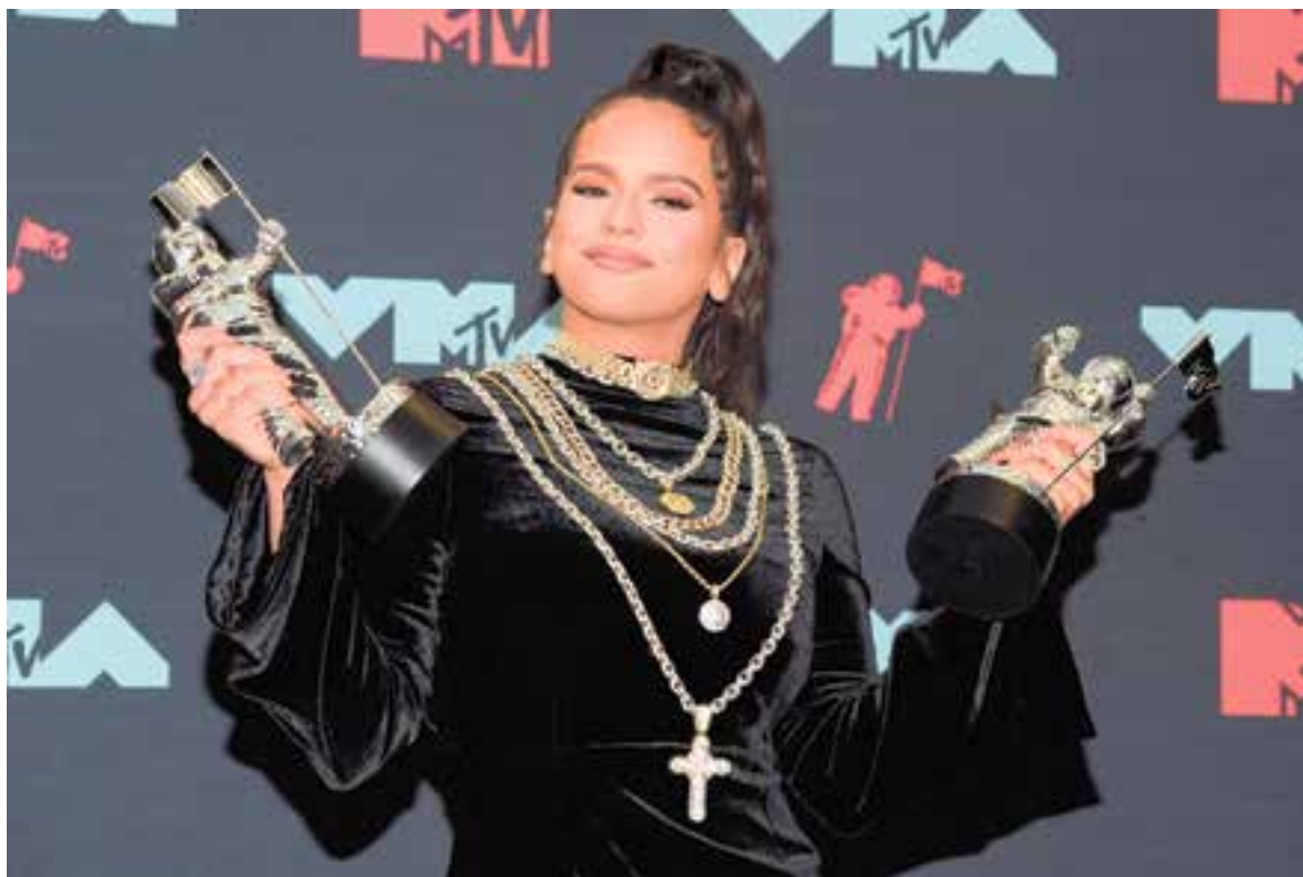
Rosalía mostra els trofeus que va rebre el 26 d'agost passat als Premis MTV Video 2019.

Al setmanari L'Actual , hem volgut saber què en pensen alguns experts musicals de Castellar. Els hem preguntat si creuen que Rosalía és l'artista més famosa del panorama musical actual i a què atribueixen el seu èxit, si a la qualitat de la seva música, a l'estil musical que proposa o bé a la posada en escena, i si creuen que el seu públic és exigent. Això és el que ens han dit. ➔