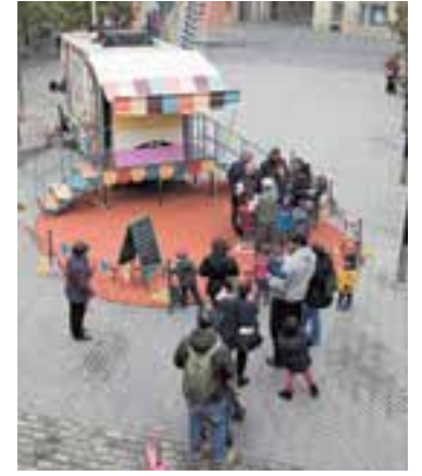
Teatre familiar Dissabte 7 i diumenge 8 Matí i tarda

L'Esbart Teatral de Castellar ha comunicat que, finalment, els gegants de Castellar faran una plantada de gegants el diumenge de Festa Major, a les 18 hores, a la plaça del Mercat. Així ho van decidir els assistents a la reunió que va tenir lloc dilluns al vespre a l'Ateneu de l'Esbart, amb la intenció de buscar una solució perquè els gegants puguin ser presents a la Festa Major 2019. Les persones que el dia de la reunió es van comprometre a fer sortir el Sol, la Lluna i l'Estel també proposen un taller per fer ballar els Gegants amb la gent que sigui a la plaça del Mercat aquell dia. La idea de la trobada del dilluns, més enllà d'aquesta plantada puntual, és poder formar una colla que es consolidi i que no sigui només per Festa Major. Actualment, la colla castellera de l'ETC s'ha quedat òrfena de portejadors capaços de sustentar les estructures dels gegants per poder fer ballades. El relleu és obert a tota la població castellanca i s'intentarà refer un grup estable tan aviat com sigui possible.