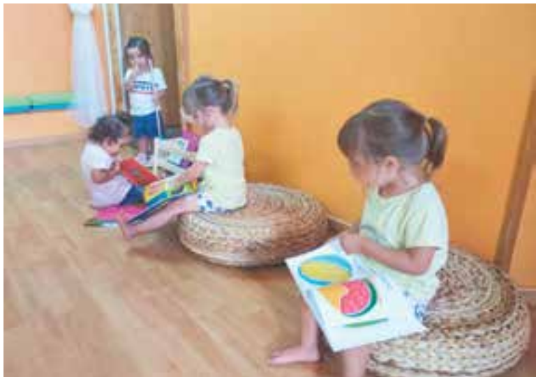
A la llar d'infants Casamada potencien l'autonomia de cada nen i nena

El centre aposta per un canvi de metodologia de cara al nou curs