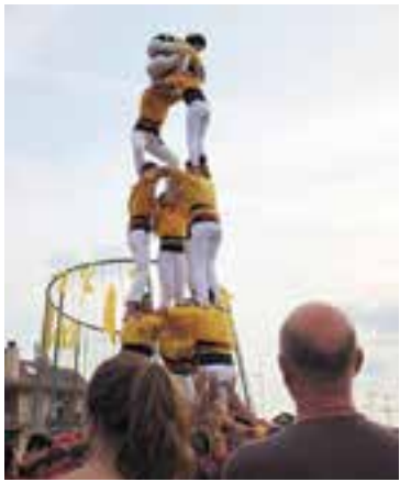
Actuació castellera Dissabte 7 18 h - Plaça d'El Mirador

Els castellers, el concert d'Oques Grasses, un recital poeticomusical, el teatre de l'ETC i els espectacles familiars