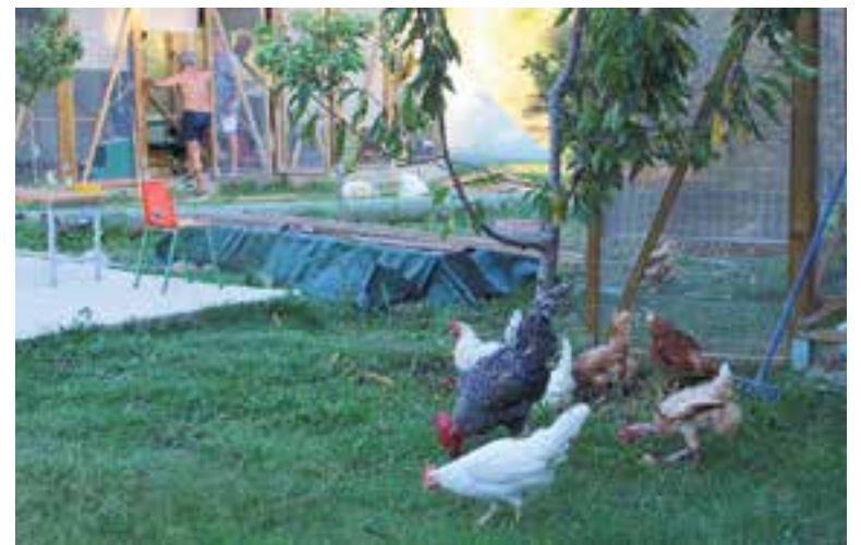
Entrada als 20 galliners de gallines felices que hi ha a Els Horts de Puigvert.