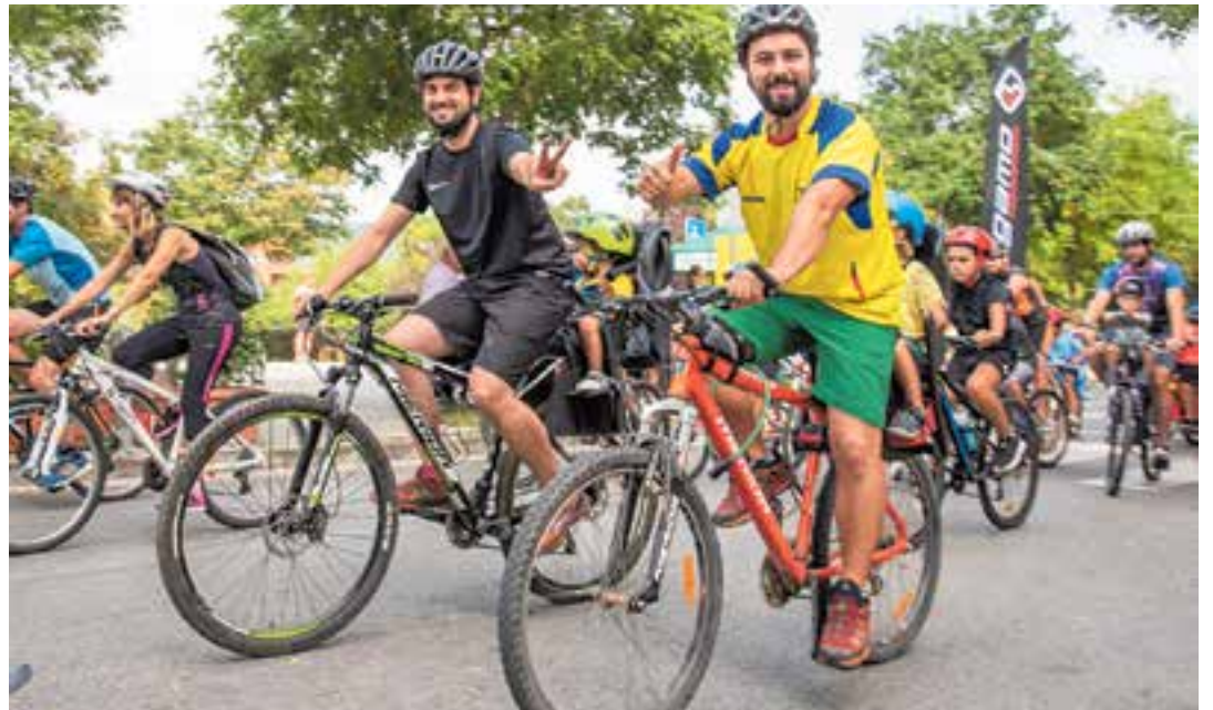
Participants de la bicicletada de la Festa Major de 2018, moments després de la sortida.

En un poble com Castellar, on el motor és fonamental en l'esport, l'Escuderia T3 va rescatar fa uns anys el 'Mou-te', en què tothom que s'apropi al circuit del Pla de la Bruguera (dissabte,