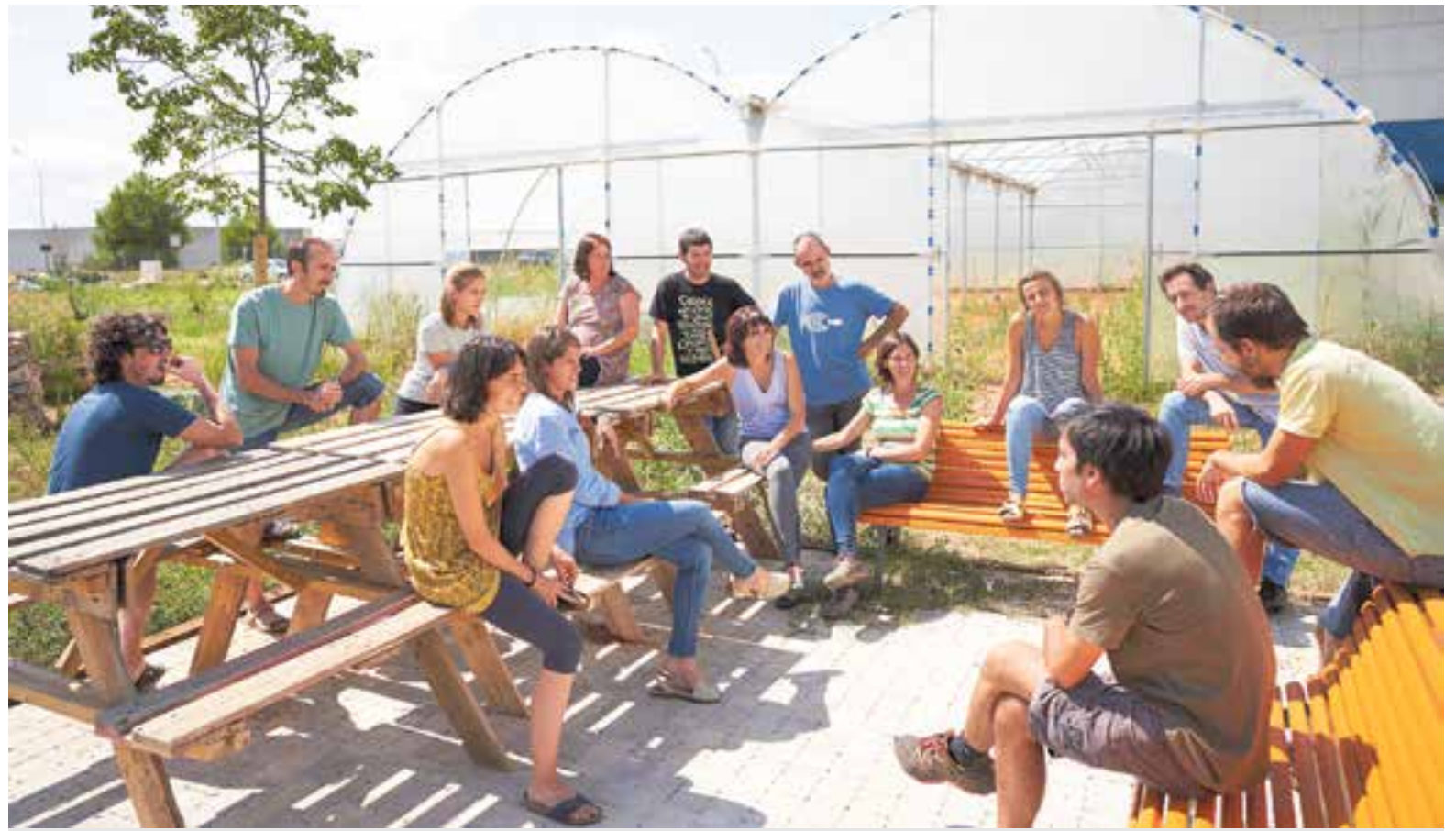
Els professors i professores del nou institut agrari reunits al voltant de l'hivernacle, una de les instal·lacions que utilitzen els alumnes dels cicles formatius.

La cooperativa viver Tres Turons col·labora amb a empresa en la formació professional i un dia a la setmana els alumnes van al viver. L'institut d'FP també compta amb un solar, de propietat municipal, "on es fan diferents cultius, tenim un hivernacle i una zona enjardinada" , assegura Tàsias.