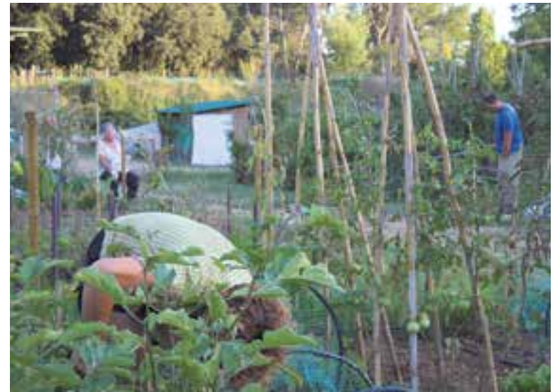
Alguns hortolans treballant als Horts de Puigvert, aquesta setmana.

"De galliners, ja n'hi havia als Ecohorts, però els que hi ha ara són de nova construcció" , afegeix el Roger. Es van acabar al maig i es van ocupar l'1 de juny. Hi viuen galls i gallines ponedores. Són "gallines felices" i es treuen a passejar com a mínim dos o tres cops la setmana. Algunes, s'alimenten amb pinso ecològic. ➔