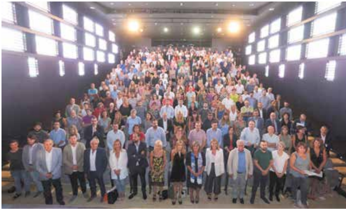
Més de 300 persones es van reunir per establir com actuar davant la carta rebuda per part d'Endesa.

L'elèctrica reclama als municipis el 50% del deute de les factures i endarreriments de famílies vulnerables, 96.387€ a Castellar