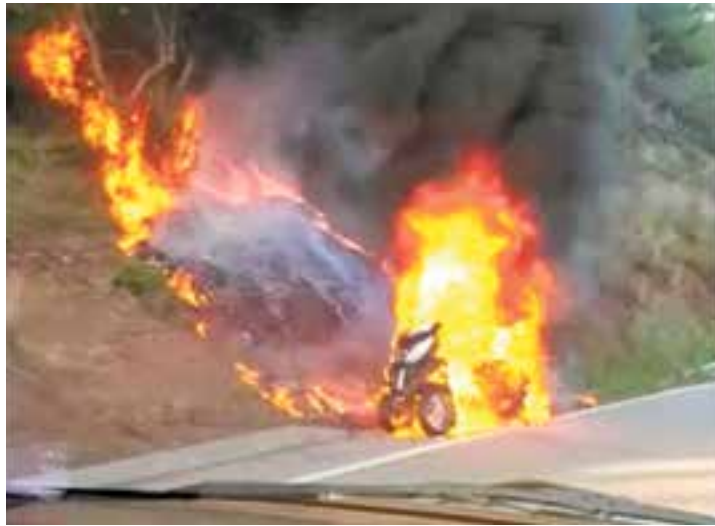
Moment de l'incendi del quad a la carretera.

Segons detalla el regidor Leiva, en aquest cas concret no s'ha incorregut en un delictes penal que comporta judici. Si l'accident hagués implicat una altra persona i el responsable hagués fugit, llavors sí caldria aplicar una sanció penal amb possible retirada de carnet de conduir. || REDACCIÓ +