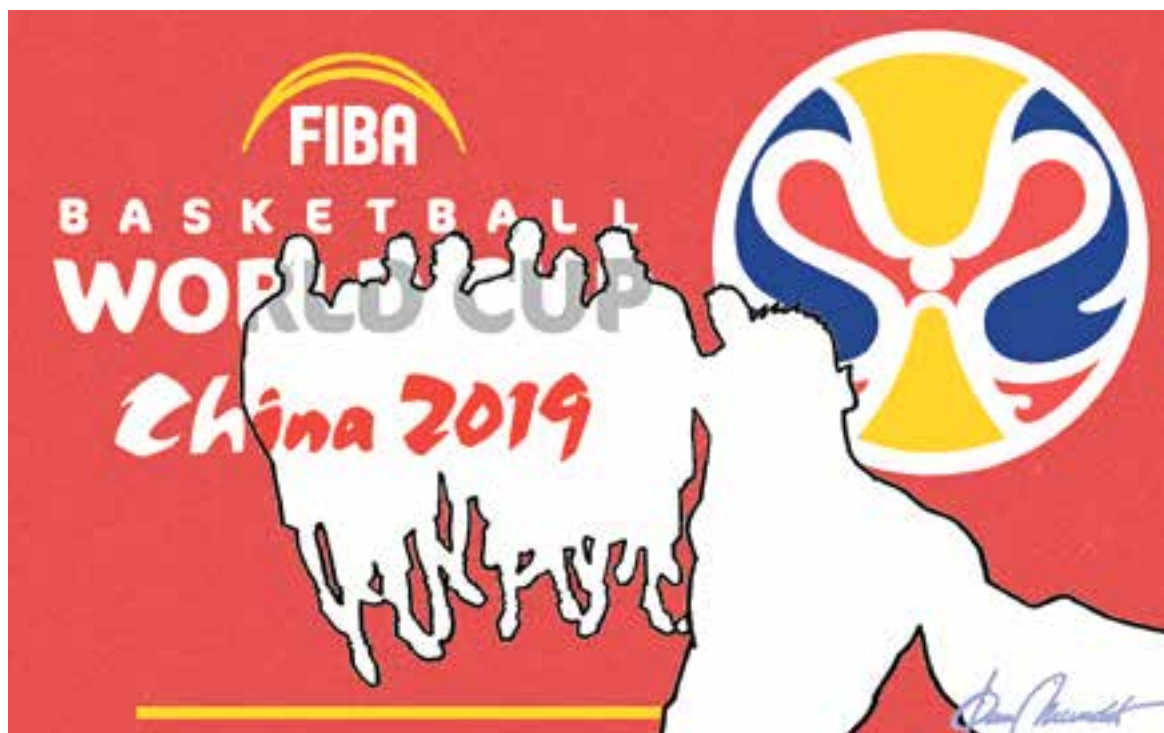
© Sense figures. || JOAN MUNDET

altres disciplines, amenaçades per models a la llarga insostenibles. En un moment en què clubs europeus com el Barça aposten pel retorn de talents que havien emigrat als Estats Units, el compromís a la Xina evidencia la necessitat que el bàsquet torni a trobar icones reconeixibles per al gran públic. Perquè l'èxit aquest setembre no hauria de ser penjar-se una medalla d'or, sinó posar les bases per a que el Mundial del 2023 no sigui com anar al concert d'un dels teus grups preferits sense tenir les lletres dels nous singles apreses.