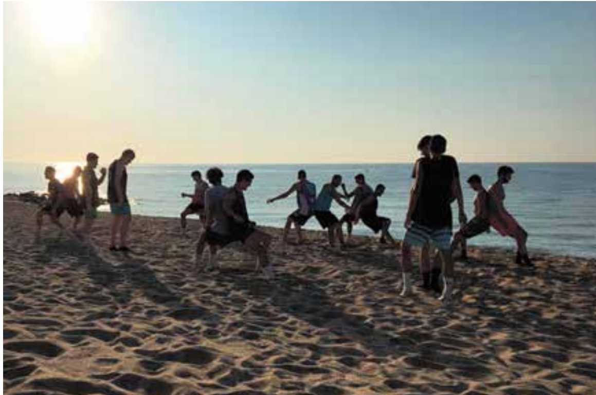
El CB Castellar va començar la pretemporada amb una estada a Caldes d'Estrac.

Gran coneixedor del planter, explica que “des d'aquesta temporada, al club volem apostar per gent del planter. Donar-li l'oportunitat a gent de casa per arribar al primer equip” .