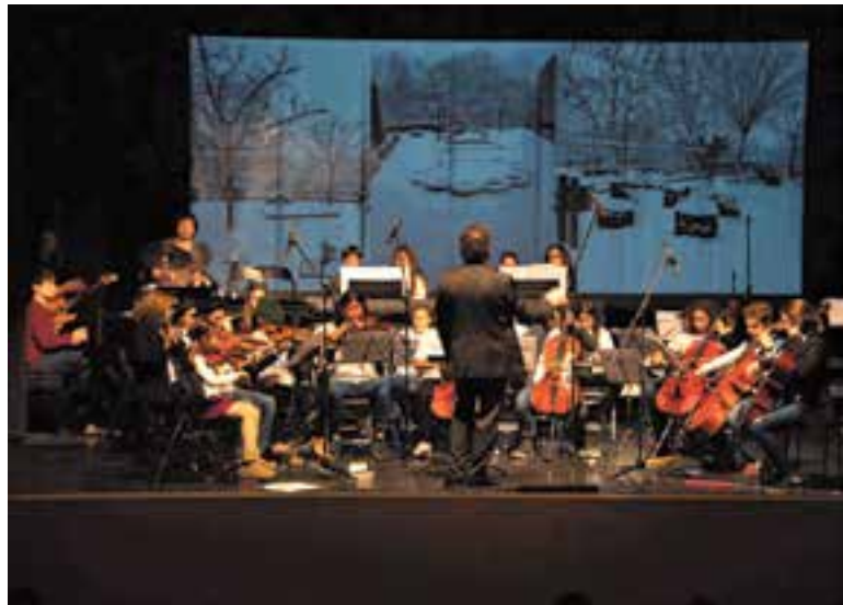
Un dels concerts que va oferir l'orquestra juvenil i infantil durant el curs 2018-19. || C.

També seguiran els combos moderns, amb alumnes des de 6è fins als combos d'adults. "Ara mateix en tenim 5 o 6". També col·laborem amb l'aportació de músics fent xarxa amb la Castellar Swing Band.+