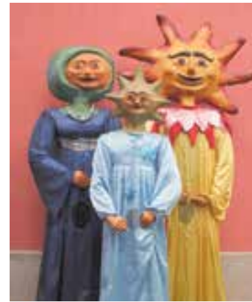
Plantada de gegants Diumenge 8 18 h - Plaça del Mercat