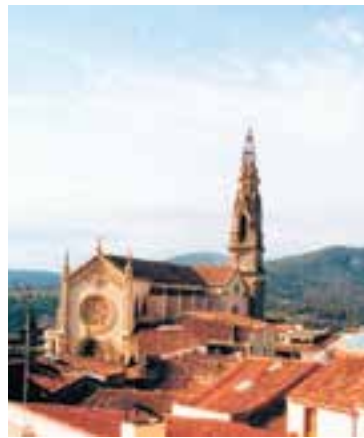
Exposició i concert Divendres 6 19 h - CEAHC

Els Castellers de Castellar - Capgirats participen en la Festa Major a través de diverses activitats castelleres. El 6 de setembre ofereixen una cercavila de benvinguda a la Festa Major que sortirà de la plaça de Catalunya a les 19.30 h. Més tard, a la 01.30, participen amb una parada al XIV Correlokals. L'endemà, dia 7 de setembre, a les 17 hores tenen prevista una cercavila des de l'INS Castellar i a les 18 hores, una actuació conjunta a la plaça d'El Mirador amb els Esperxats de l'Estany, els Castellers de Santpedor, els Castellers de Cornellà i els Castellers de Castellar. S'ha previst un picapica per a les colles després de l'actuació. El dia 8 de setembre, la colla castellera participarà en l'espai de Vilabarrakes a les 23 hores. D'altra banda, ja han començat els assajos els dies 2 (assaig 'pinta't la cara'), 4 (assaig 'cappira la roba interior') i 5 de setembre (assaig 'porta un antic'), a l'Espai Tolrà. També van actuar a la Festa Major de Sentmenat diumenge passat, 1 de setembre.