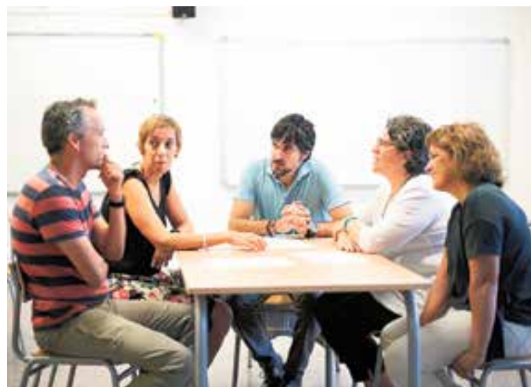
L'equip de l'Institut escola Sant Esteve amb responsables d'Educació.

Els infants d'aquests dos centres van començar el curs amb jornades d'adaptació amb grups i horaris reduïts, mentre que a partir del 10 de setembre, les dues escoles bressol municipals ja funcionaran amb plena normalitat.