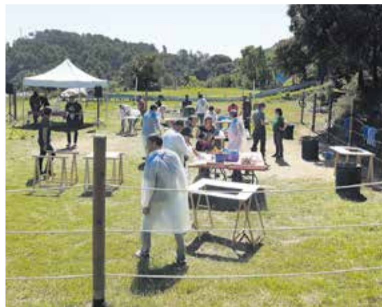
Una de les activitats 'team-building' que organitza Can Juliana.