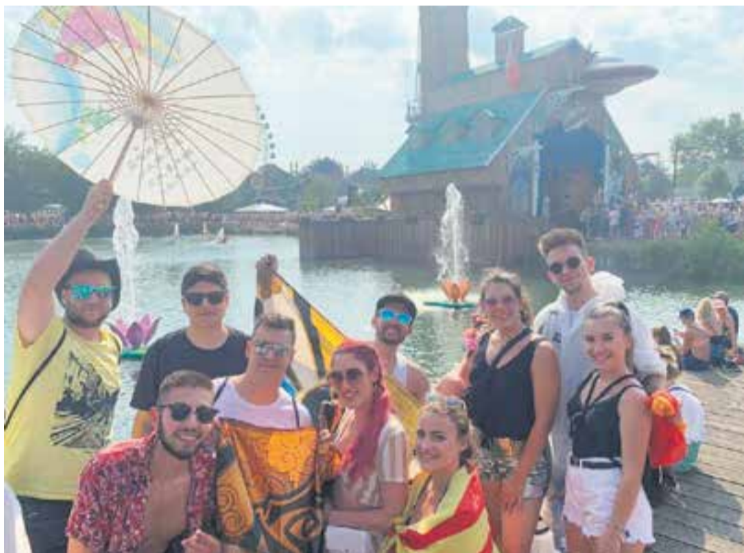
Els deu castellarencs que van assistir a Tomorrowland, en una foto feta a l'interior del recinte.

Per als castellarencs, accedir al festival va ser un repte des del primer moment: