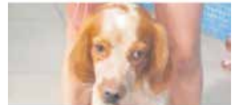
ZACK // Creuat amb bretó · Jove · Mascle · Pèl curt · En adopció des d'agost de 2019