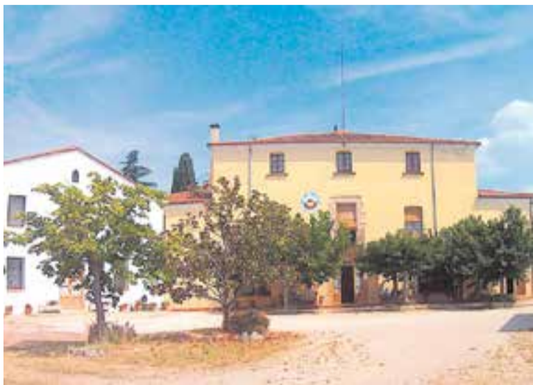
La masia i la masoveria de Can Carner que vol rehabilitar la cooperativa.

Els permisos per començar les obres poden trigar uns sis mesos i la rehabilitació pot durar un any i mig més, "amb la qual cosa les famílies podrien entrar a viure-hi l'octubre de 2021". +