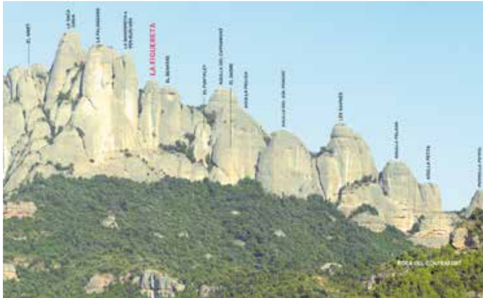
L'Agulla Figuereta de Montserrat, la cinquena per l'esquerra.

Les cordades faran bivac a l'agulla assignada, ja que l'acte començarà dimarts, dia 10, al migdia i no es tancarà fins l'endemà a primera