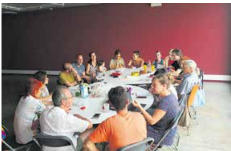
Alguns dels membres que formen part de la cooperativa d'habitatge Can Carner.