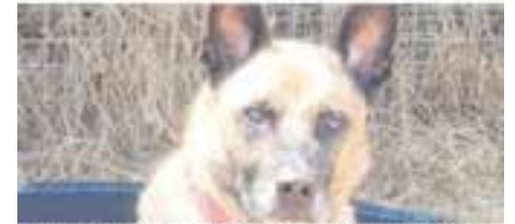
GORDO // Creuat · Adult · Mascle · Pèl curt · En adopció des d'agost de 2019