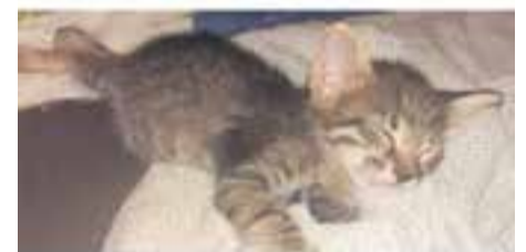
MIC // Europea · Cadell · Mascle · Pèl curt · En adopció des d'agost de 2019

Contactar amb Àgata Castellar: aggatacastellar@gmail.com