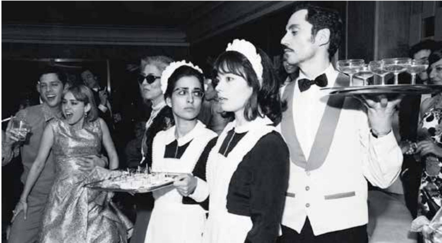
'Arde Madrid' de la directora castellarenca Anna R. Costa, ha estat una de les cintes més prestades el primer semestre del 2019 a la biblioteca.