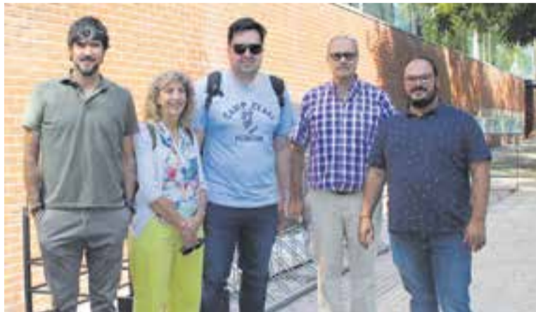
Foto de família amb els encarregats del Planet Youth a la comuna de Colina, Xile. || C.D.

A la reunió també van ser presents el responsable de Salut de l'Ajuntament,