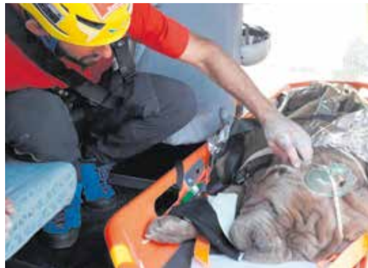
El gos en el moment de ser avacuat en helicòpter.

de Caps i Comandaments de Policia Local de Catalunya (ACCPOLC) per la seva permanència i dedicació com a cap de Policia durant 30 anys. El mes d'abril passat, i a títol pòstum, també va ser distingit en el marc del congrés anual de l'Associació de Caps i Comandaments de Policia Local de Catalunya (ACCPOLC) per “la implicació i coordinació amb el cos de Mossos d'Esquadra en la recerca de millores per tal d'obtenir una millor eficàcia i oferir, tanmateix, un servei de qualitat a la ciutadania” . || REDACCIÓ ✦