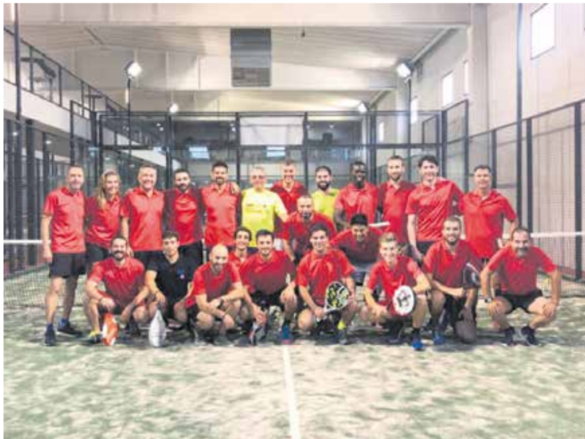
L'equip humà de l'empresa castellarenca Sistel Group fa 4 anys que organitza un torneig de pàdel per cohesionar l'equip.

L'espai d'oci Can Juliana ofereix diferents activitats adreçades a la construcció d'equips. Majoritàriament s'hi