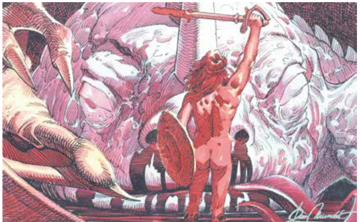
© Matador de dracs. || JOAN MUNDET

El seu aspecte actual, però, sembla que té poc a veure amb el que tenia en els seus orígens. Una de les tradicions lligades a Santa Maria del Puig de la Creu és que el Divendres Sant al matí molt castellarencs pujaven, i encara puguen, al Puig de la Creu, on pel camí és tradicional collir farigola.