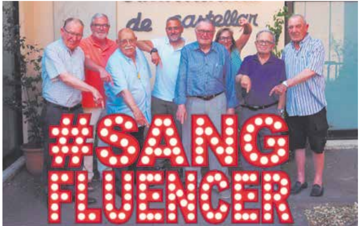
Els responsables de la delegació del Banc de Sang de Castellar i la junta del CEC, promocionant la Marató.

MIG SEGLE DES DE LA PRIMERA DONACIÓ A la Marató de la Festa Major del pròxim 6 de setembre es compliran 50 anys des de la celebració de la primera campanya de donació de sang a Castellar. L'històric setmanari La Forja anunciava la campanya que es va fer el 21 de setembre de 1969 a l'hospital de la ciutat, de 9 a 12 del matí. Sobre el fet de donar sang, el setmanari ho explicava així: “Donar sang no és res,