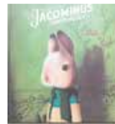
'EL LLIBRE D'HORES DE JACOMINUS GAINSBOROUGH' Rébecca Dautremer EDITORIAL Baula