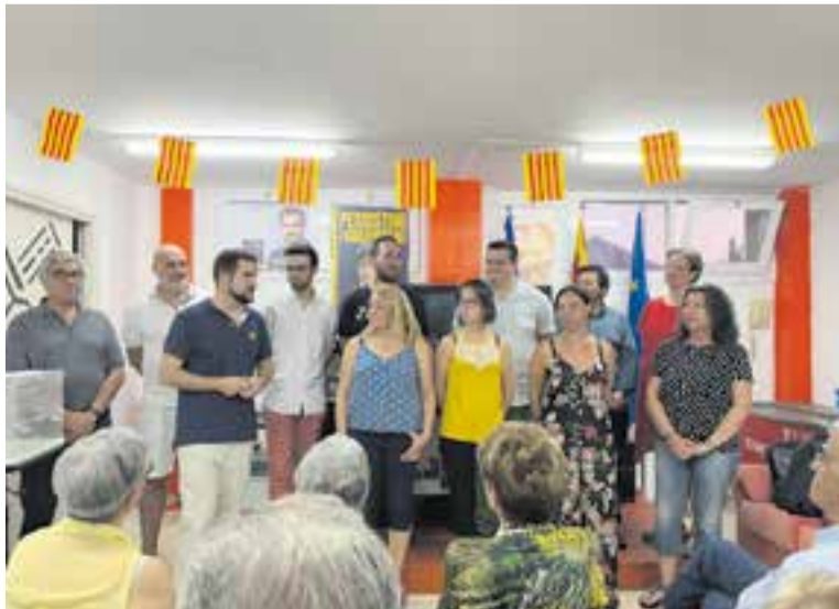
Els membres de la nova junta directiva de Junts x Castellar.

Ramon va destacar també que “aquesta nova junta la integrem un equip profundament divers, en termes professionals, generacionals i ideològics” i que “això