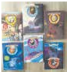
TOTA LA COL·LECCIÓ JAN PLATA Josep Lluís Badal EDITORIAL La Galera