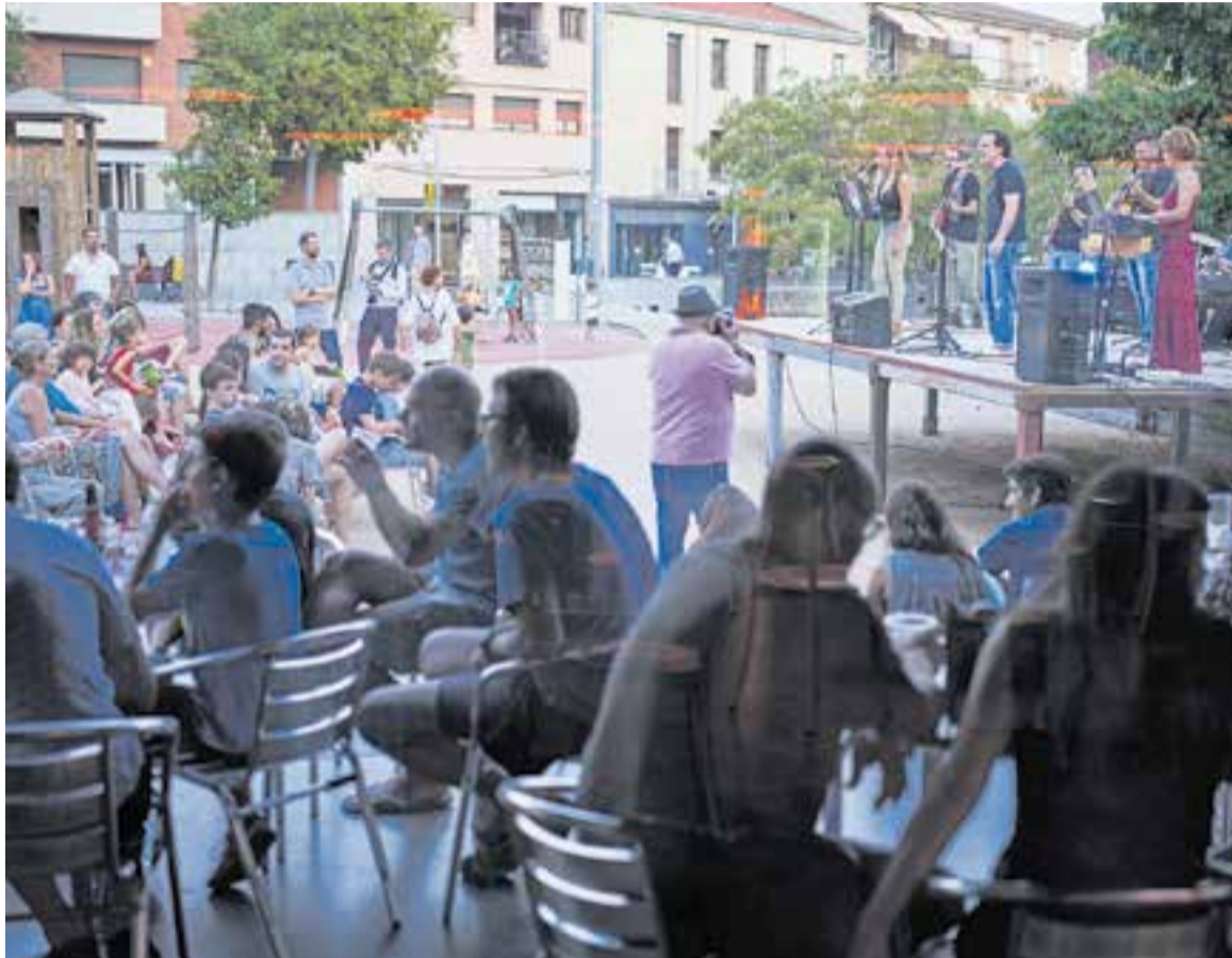
El primer festival Casterockfest ha comptat amb la participació del Calissó d'en Roca.

La banda, que va néixer l'any 2017 a l'Artcàdia -ara, Acció Musical Castellar-, va aprofitar l'oportunitat del directe per dirigir-se al