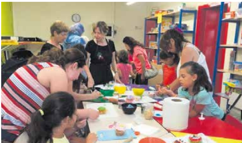
Taller de cupcakes a la ludoteca divendres passat.