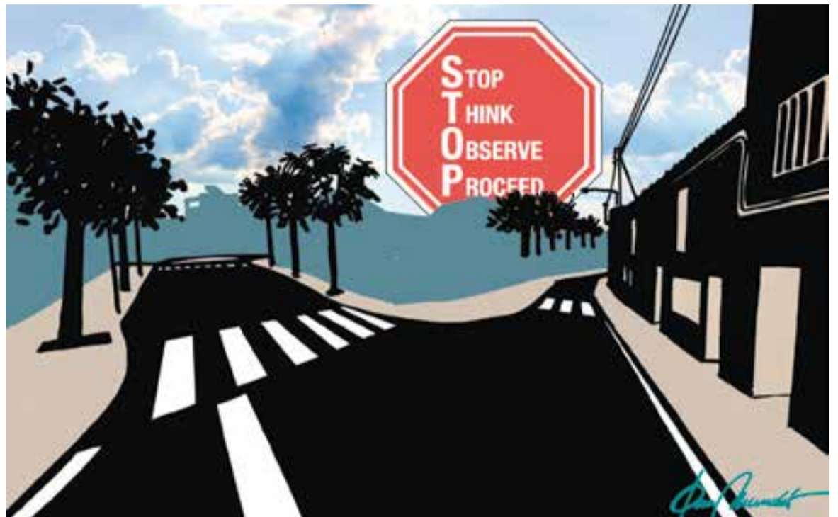
© Sense títol. || JOAN MUNDET

i perdre tots els segons, hores, dies i anys que desitgem que ens quedin per gaudir d'aquest vehicle de carn i ossos que ens porta amunt i avall seguint fidelment les nostres indicacions. La població de Castellar té repartides senyalitzacions de stop per les cruïlles on s'haurà considerat aconsellable fer-ho per propiciar la seguretat vial dels conductors i la dels vianants, o sigui, de tots nosaltres.