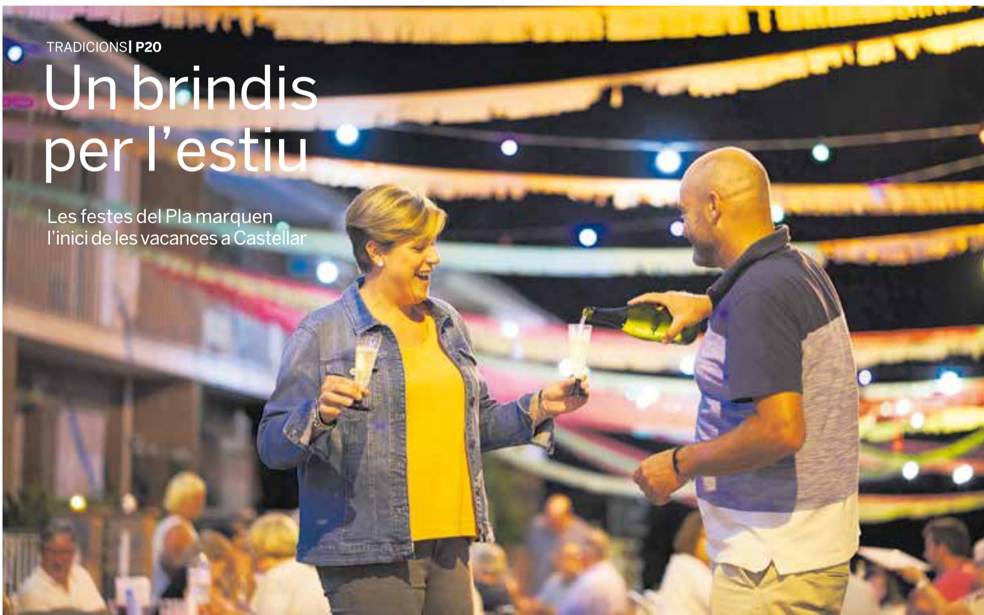
Una parella es serveix cava durant la celebració del tradicional sopar de les festes del carrer Sant Jaume que va tenir lloc el cap de setmana passat.

Les festes del Pla marquen l'inici de les vacances a Castellàr