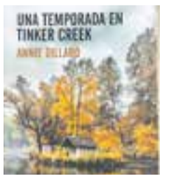
'UNA TEMPORADA EN TINKER CREEK' Annie Dillard EDITORIAL Errata Naturae