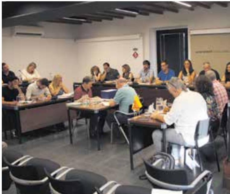
Un moment del ple de dimarts passat. || C.D.

La part resolutiva del ple també va incloure renovar l'adhesió de l'Ajun-