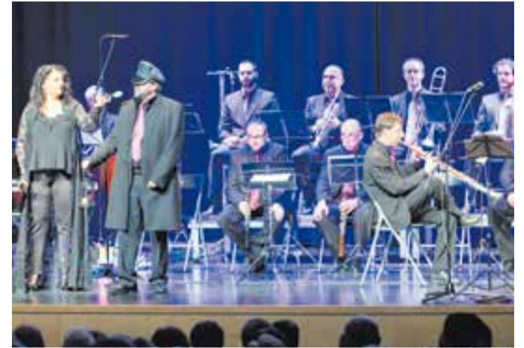
Una imatge d'arxiu del concert homenatge a Viladesau.