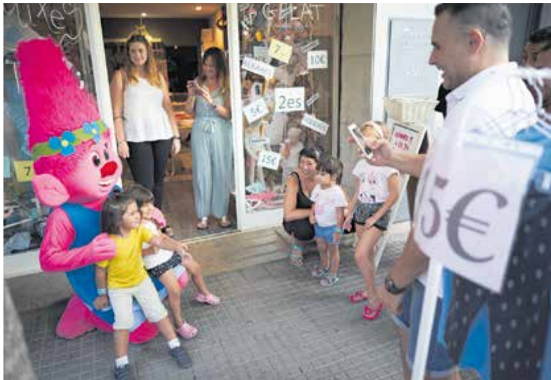
Els clients de la botiga Pessigolles fent fotos amb un personatge de la pel·lícula 'Trolls'.

Després d'uns quatre anys des que va obrir la botiga Sílvia Moda i Complements, la propietària admet que hi ha gent que encara no la coneixia; i la iniciativa ha servit per a descobrir-la a força gent. “La idea és molt bona, encara que hem començat amb una mica de por, perquè no sabíem la resposta que tindria. Al final, l'ambient ha