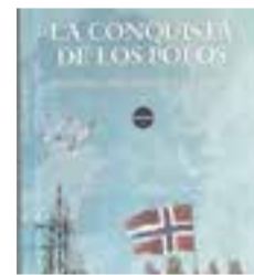
'LA CONQUISTA DE LOS POLOS' Jesús Marchamalo EDITORIAL Nórdica