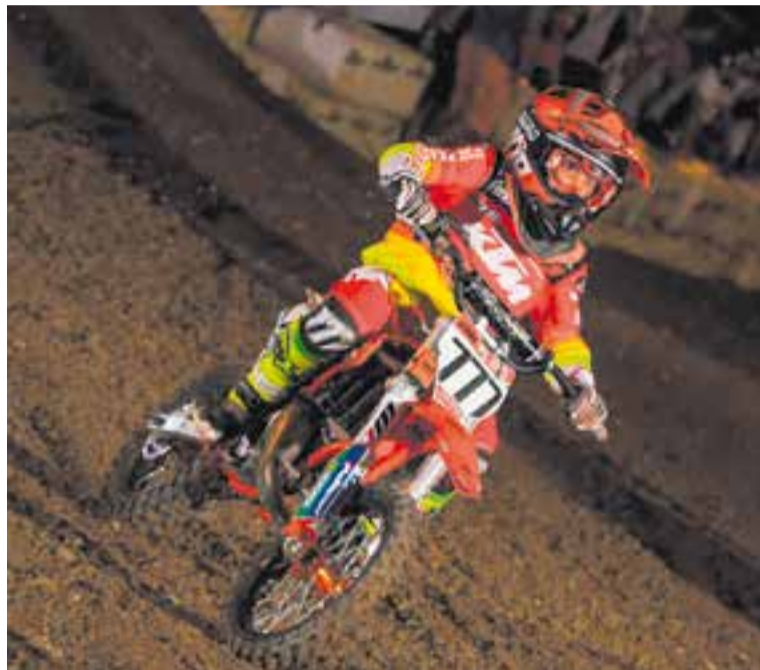
El castellanenc en la segona prova del campionat d'Espanya de supercròs.

El '77' era atès pel fisioterapeuta de la Federació Espanyola,