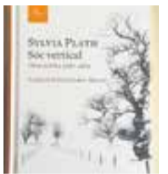
'SÓC VERTICAL' Sylvia Plath EDITORIAL PROA