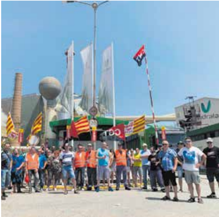
Els membres del comitè de vaga davant l'entrada de l'empresa.

El comitè d'empresa explica que el grup Vidrala s'ha conver-