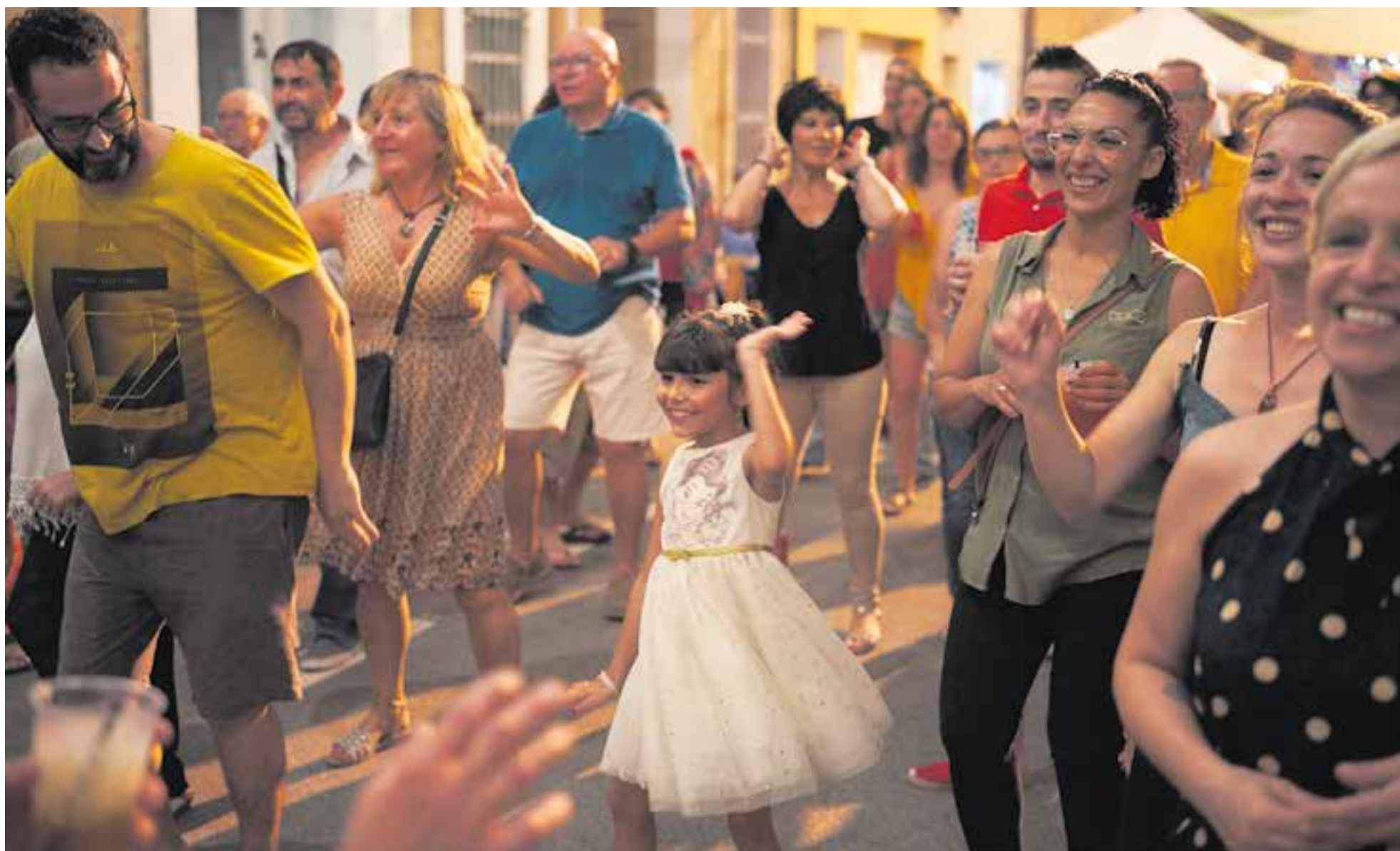
El ball de dissabte a la nit, com ja és tradició, va reunir grans i petits al carrer Sant Jaume amb el grup Remember Music Show, que ofereix un repertori de música dels 80 i 90.