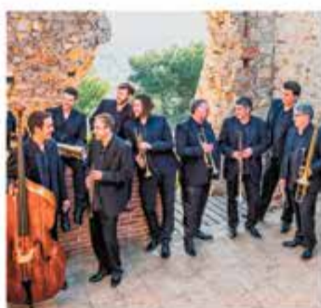
Dijous 4 de juliol 21.30 h – Pl. del Mercat Sardanes amb la Cobla La Principal de la Bisbal