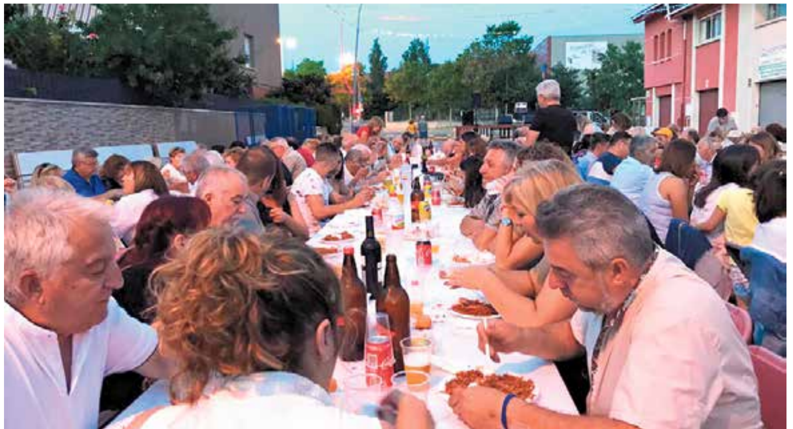
La revetlla de Can Carner va aplegar unes 400 persones, en una de les trobades amb més tradició de Sant Joan.

La festa es va animar gràcies al karaoke, dinamitzat pel grup 'Tocame-la', habituals mestres de cerimònia a les gresques castellarenques.