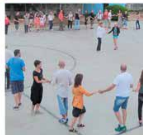
Dimarts 2 de juliol 20.30 h – Pl. de Cal Calissó Open curs de bachata i roda cubana