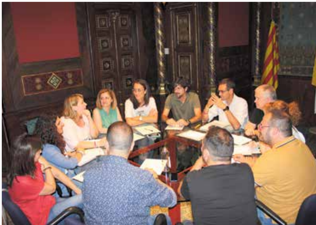
Una de les primeres reunions del nou equip de govern va tractar el tema del decàleg.

Promoure una “fiscalitat verda” és el quart punt del decàleg i implicar desplegar “ordenances fiscals amb criteris nous que premiïn els comportaments ambientalment responsables” i es facilitaran ajudes per fomentar l'edificació sostenible i els habitatges passius (biocli-