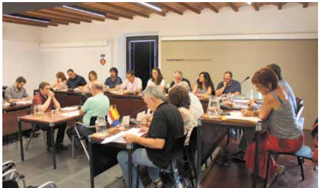
El ple de dimarts passat va comptar amb l'estrena de fins a 11 regidores i regidors nous.

A banda del model organitzatiu, el primer ple del mandat també incorpora les retribucions dels components de l'equip de govern i de l'oposició així com les aportacions als grups municipals. L'alcalde tindrà un sou brut anual de 54.499 €; els regidors al capdavant d'àrea, 45.000 €;