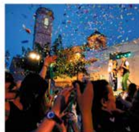
Del 4 al 7 de juliol Diferents horaris i espais Festa Major de Sant Feliu del Racó