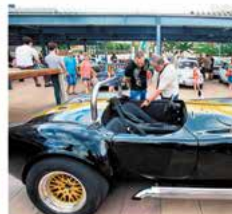
Diumenge 7 de juliol De 10 a 14 h – Pl. d'El Mirador Festa de Sant Cristòfol