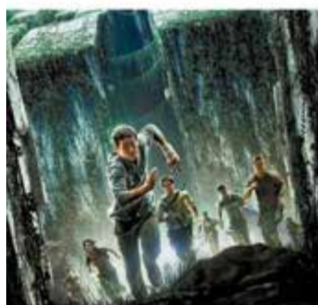
Dimecres 3 de juliol 19.30 h – Auditori Municipal Cinema: El corredor del laberinto