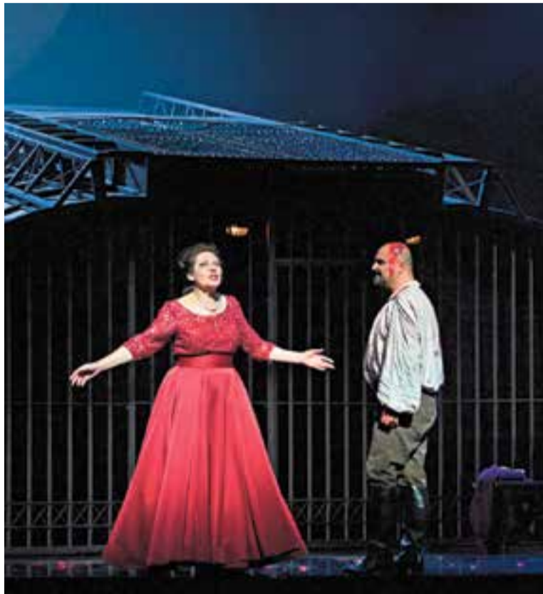
Moment de l'òpera 'Tosca' de Giacomo Puccini, del Gran Teatre del Liceu.

L'acció de l'òpera ens situa a la Roma de 1800, poc després del final de la República Romana (1798-1799) que, durant un temps breu, va eliminar els privilegis eclesials i va recloure el papa Pius VI en un monestir de la Toscana, després de la dissolució dels Estats Pontificis a benefici del Directori i com a estat satèl·lit de la França