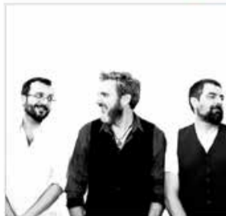
Diumenge 30 de juny 12.30 h – Pl. de Cal Calissó Vermut musical amb PiK