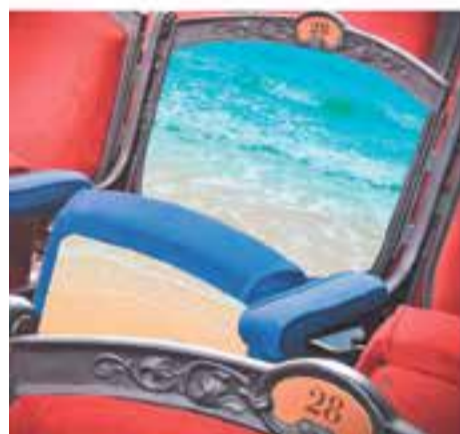
Divendres 28 de juny 22 h – Jardins del Palau Tolrà Liceu a la Fresca: Tosca, de Puccini