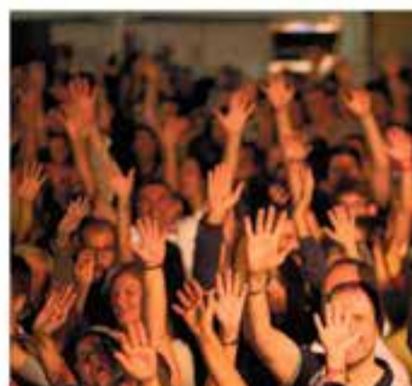
Divendres 5 de juliol 20.30 h – Pl. de Cal Calissó Casterockfest: concerts d'Els Visitants i Firewood