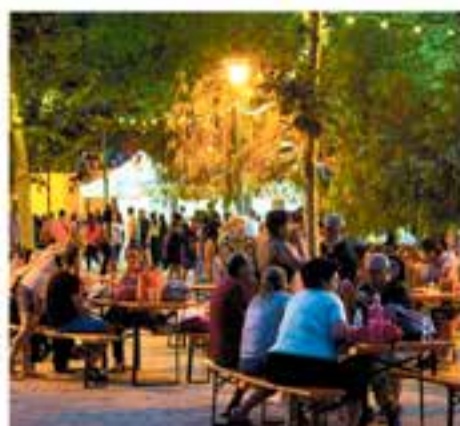
Divendres 5 i dissabte 6 de juliol De 20 a 00 h – Pl. de Catalunya Tast d'estiu