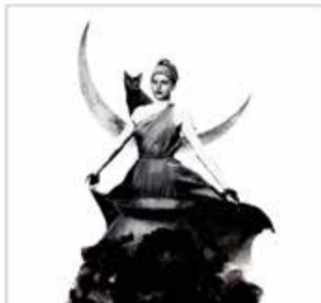
Dissabte 29 de juny De 19 a 00 h – Jardins del Palau Tolrà 3a Nit embruixada