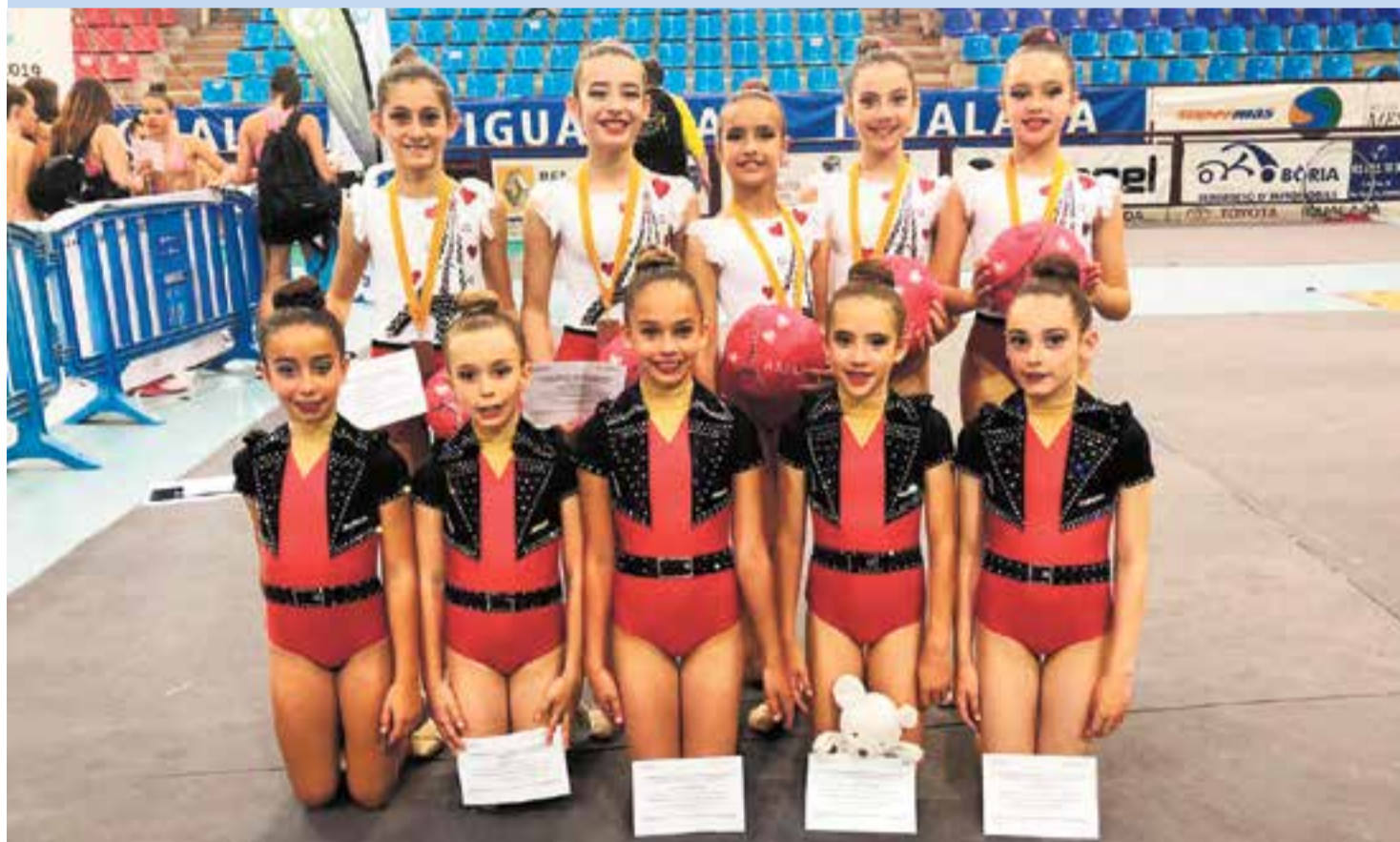
Els dos equips del Club Rítmica Clau de Sol de les categories més petites en la competició dels Campionats Nacionals celebrats a Igualada.

Quatre equips del Club Rítmica Clau de Sol disputen les finals del Nacional