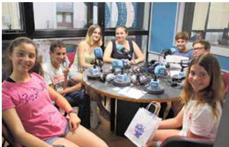
L'equip del QKK amb els concursants de la final dels grans.

Cada dimecres els usuaris i les usuàries del Servei Ocupacional d'Inserció (SOI) de TEB Castellar s'han assegut davant dels micròfons de l'estudi 1 de Ràdio Castellar. Els 23 participants s'han dividit en quatre grups amb l'objectiu de poder passar tots pel directe. Mentre uns gravaven, els altres preparaven el tema a tractar, bé parlant entre ells, escrivint, llegint o practicant alguna tècnica de vocalització o relaxació. Durant aquesta temporada també han tractat notícies d'actualitat com la vaga del taxistes, temes que els agraden com els còmics, arran de la mort de Stan Lee, i temes que toquen de prop com el dret a vot o les relacions sexuals. Les darreres setmanes han fet una activitat especial: van sortir al carrer a entrevistar, micròfon en mà, els veïns i veïnes de Castellar, una activitat que els ha agradat especialment. ✦