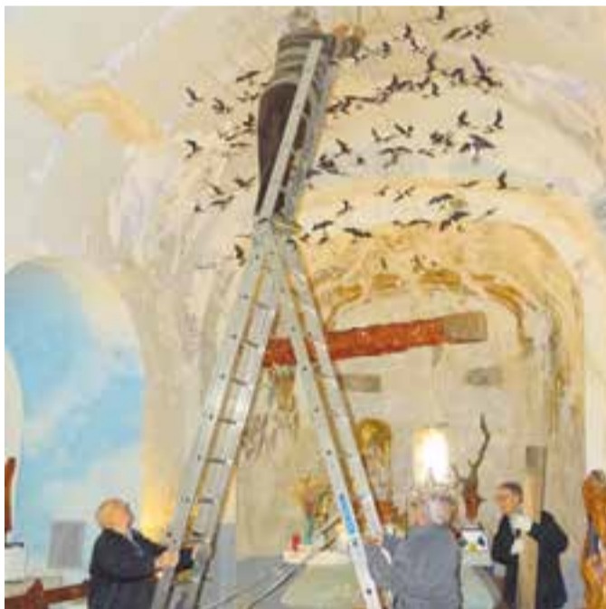
Al capdamunt de l'escala, Josep Llinares col·loca les orenetes.

Doctor Puig. A les 14.30 h, al pati de l Centre Feliuenc tindrà lloc un dinar popular i, a les 19 h, actuació de bastoners, gegants i castellers. A les 22.30 h arriba el final de festa amb els Diables de l'ETC. Diumenge 7, al matí, també hi haurà una parada de col·lecta de l'agrupació local contra el càncer (AECC). +