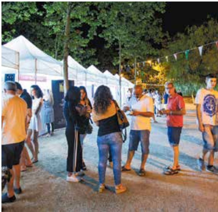
Imatge de la Nit Embruixada del 2018, que va coincidir amb el Tast d'Estiu.

Comerç Castellar, juntament amb l'Ajuntament, organitzen la Nit de les Bruixes per donar el tret de sortida de les rebaixes