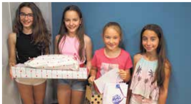
Finalistes del QKK! de 5è i 4t curs. || R.G.