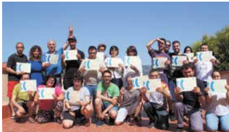
Foto de família dels participants en el programa Ona TEB Ràdio.