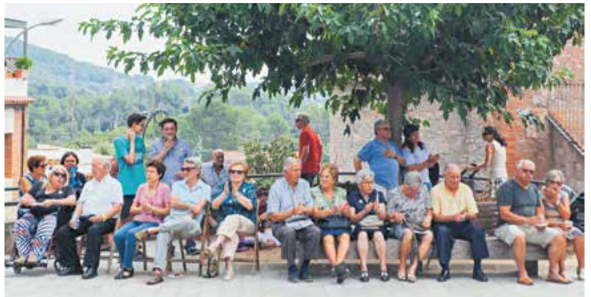
Festa Major de Sant Feliu del Racó, l'any 2017.

A les 12.30 hores es preveu la Festa de l'Escuma, a la plaça del Doctor Puig. A les escoles, a partir de les 18 hores, hi haurà activitats per a joves