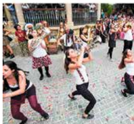
Divendres 5 de juliol 19.30 h – Pl. del Mercat a pl. de Catalunya Espectacle itinerant amb la Balkan Paradise Orchestra