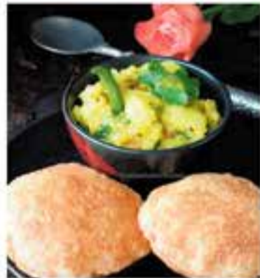
Amics del Nepal