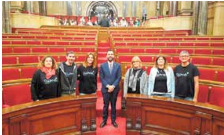
Membres de la junta de Suma+, amb el president del Parlament, divendres.