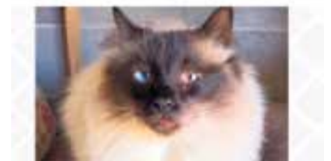
ROSEN // Europea · Adult · Mascle En adopció des d'abril de 2018