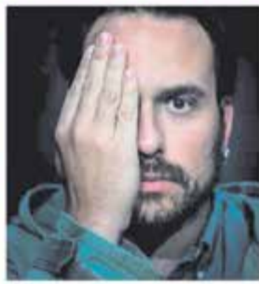
Esbart Teatral de Castellar

+ INFO: www.castellarvalles.cat , www.clubcinemacastellar.com