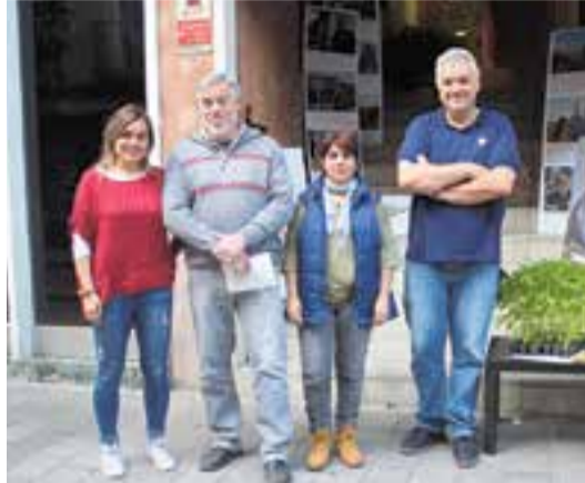
Els números 4, 3, 10 i 1 de la llista d'ERC. || C. D.