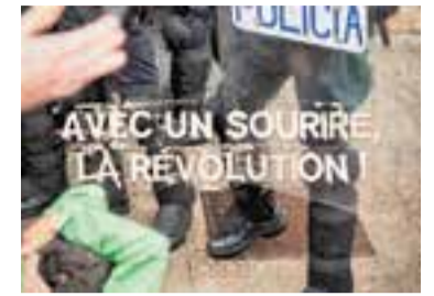
'Avec un sourire, la révolution'.