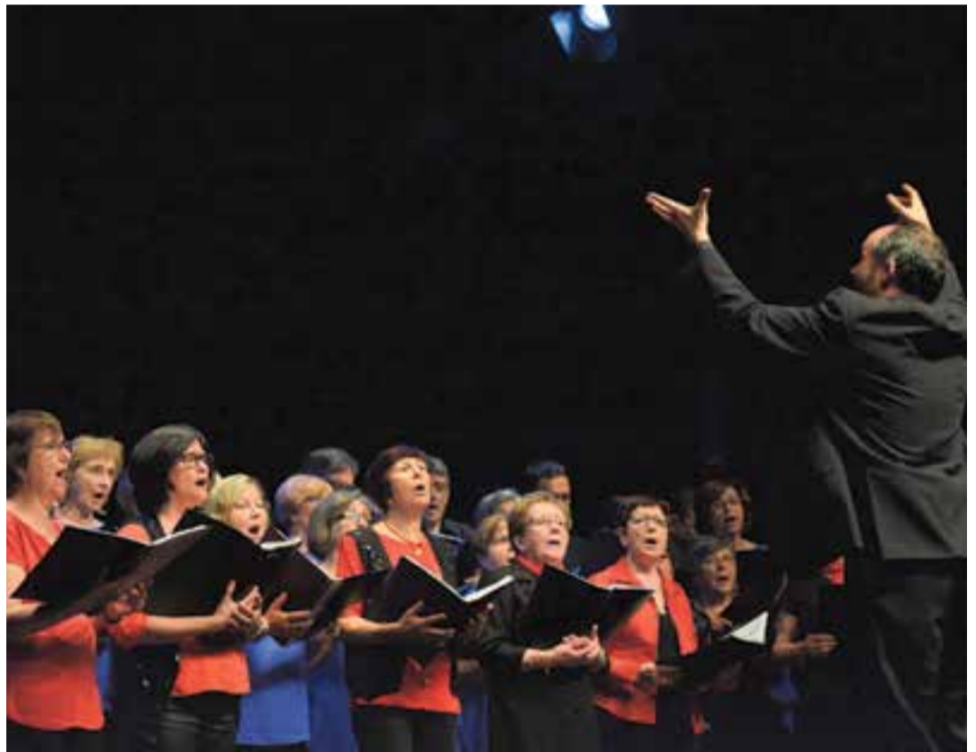
Edició del Musicoral, l'any 2016, a l'Auditori Municipal Miquel Pont.

Cada mes de maig, des de 1992, la Coral Xiribec de Castellar del Vallès convida corals d'arreu a una trobada que pretén ser una festa del món coral al nostre municipi. Les corals convidades arriben de la geografia catalana, de l'estat i també d'Europa, estimulant la convivència dels cantaires d'arreu amb els locals. La festa culmina amb el concert del dissabte a la tarda i el posterior rеспop, obert a tots els assistents. ➔