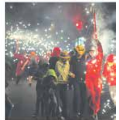
Crida a les entitats

+ INFO: tel. 686 83 42 78, a/e llbacardit@gmail.com