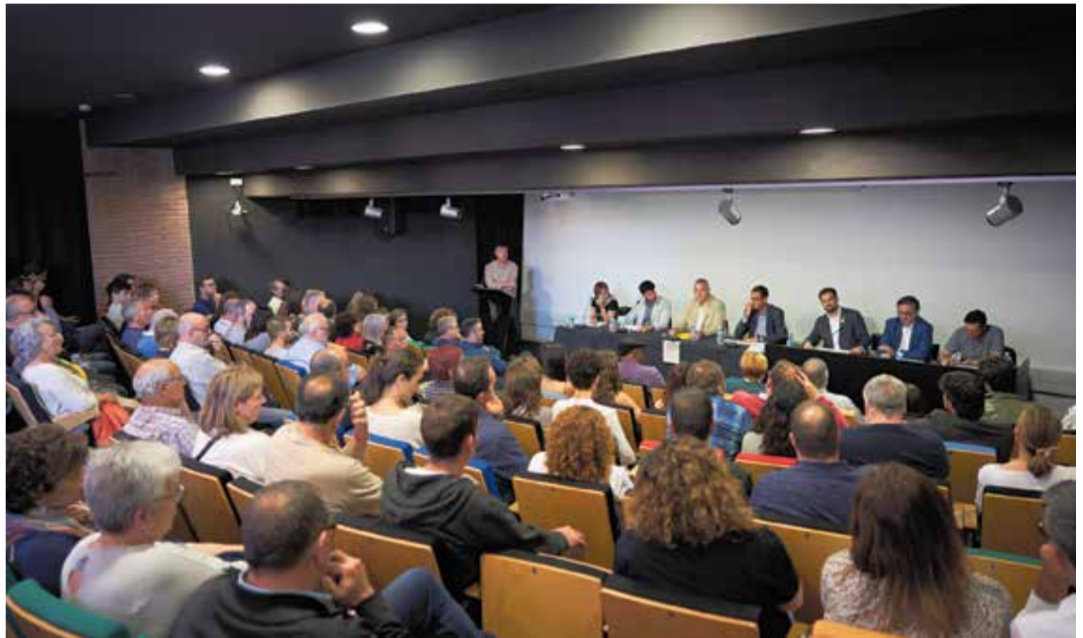
La Sala d'Actes es va omplir per escoltar el debat electoral amb la presència d'una candidata, cinc candidats i un número dos.

El bon ambient que va planar per la Sala d'Actes durant tot el debat es va veure trencat gairebé a la cloenda. Durant les intervencions finals un dels espectadors va interrompre la intervenció final del candidat de Som de Castellar -PSC i es va situar