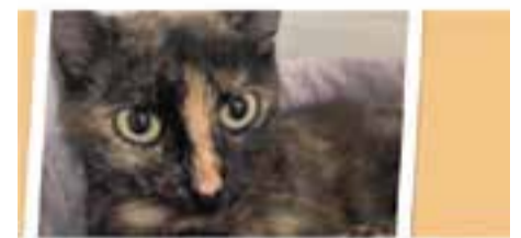
CATANIA // Europea · Adult · Femella Pèl curt · En adopció des de maig de 2018