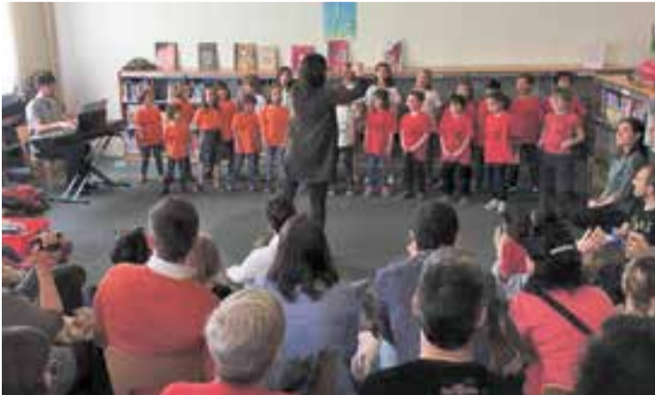
Cantada del Cor Sant Esteve i corals convidades en una passada. edició. || M. A.