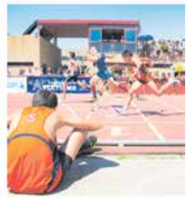
Club Atlètic Castellar

+ INFO: www.castellarvalles.cat , a/e esbartteatralcastellar@gmail.com