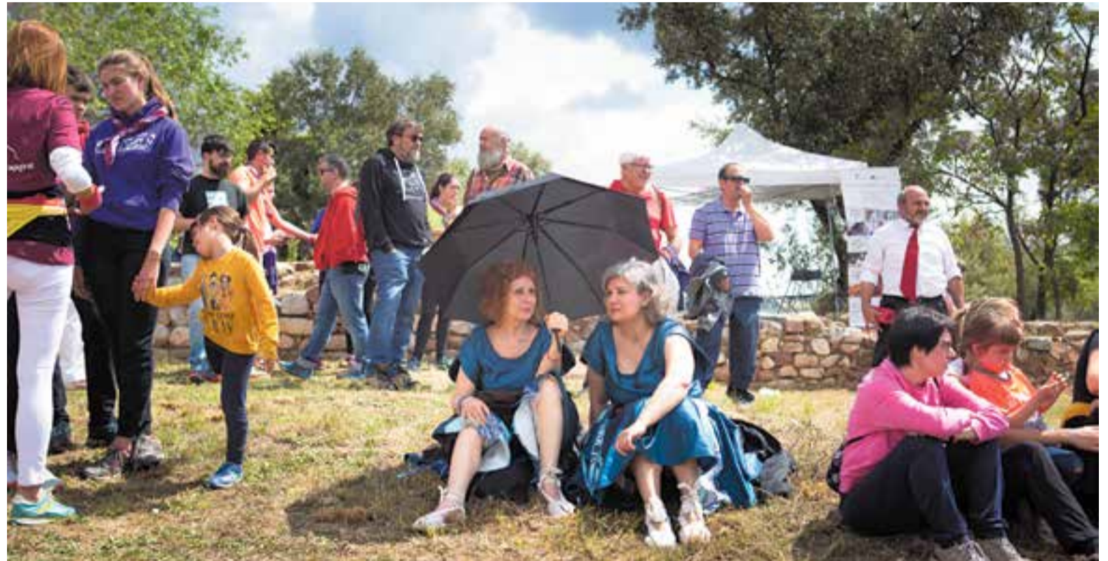
Tot i que el matí de diumenge passat va arrencar amb sol i bones temperatures, el temps va anar empitjorant amb fred i pluja.

dejar alguns arrossos, a les 13 h, van caure les primeres gotes. Aquest diumenge, però, la previsió era molt clara i, a diferència de l'any passat, la majoria d'entitats i colles s'havien proveït de tendals, paraigües i peces de roba impermeables per no mullar-se. D'altres van aixoplugar-se a dins de l'ermita de Castellar Vell. Gràcies a això, no es va malmetre cap paella.