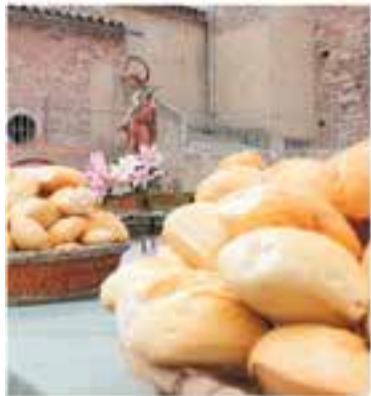
Comissió de Santa Quitèria