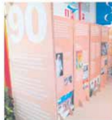
Obra Social Benèfica