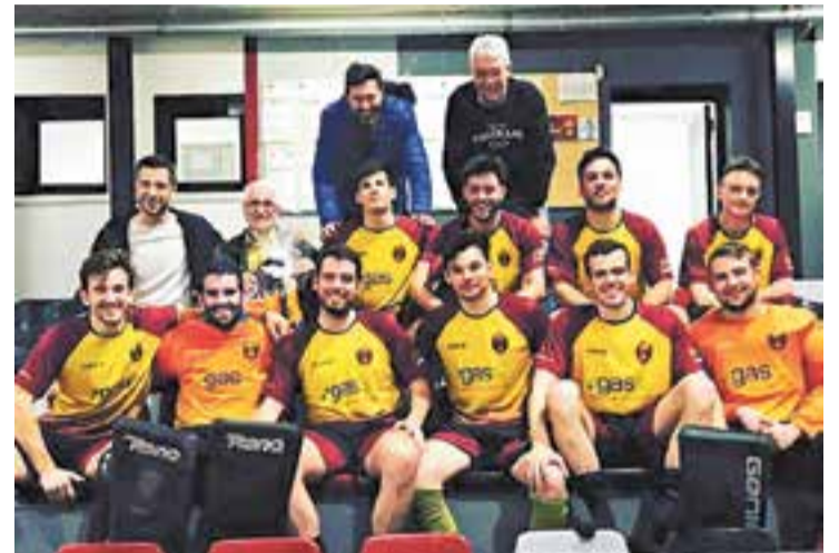
L'HC Castellar va tancar la temporada amb una derrota contundent.