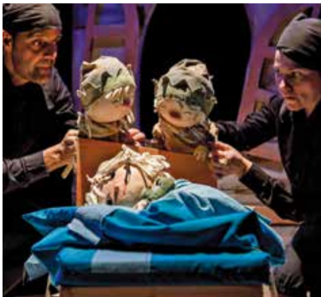
'Adeu Peter Pan', de Festuc Teatre.

Festuc Teatre va presentar 'Adeu Peter Pan' aquest diumenge