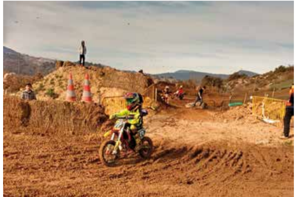
Eric Rubio amb la seva KTM abans de la cursa de Ponts.

Eric Rubio va acabar quart i es va quedar a les portes del podi en la segona cita del campionat de Catalunya de motocròs al circuit de 'El Bosquet' de Ponts (Lleida).