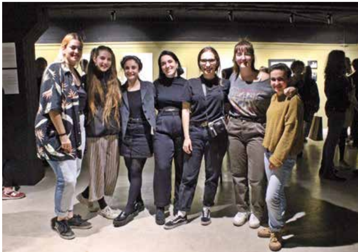
Set de les nou artistes de 'Nadryv', el dia de la inauguració a la Sala Polivalent d'El Mirador.

Les joves artistes, d'entre 18 i 25 anys, es posen al servei d'un únic tema, "la dona". A partir d'aquí exploren les possibilitats artístiques que els ofereix aquesta temàtica, des d'un prisma íntim i particular.