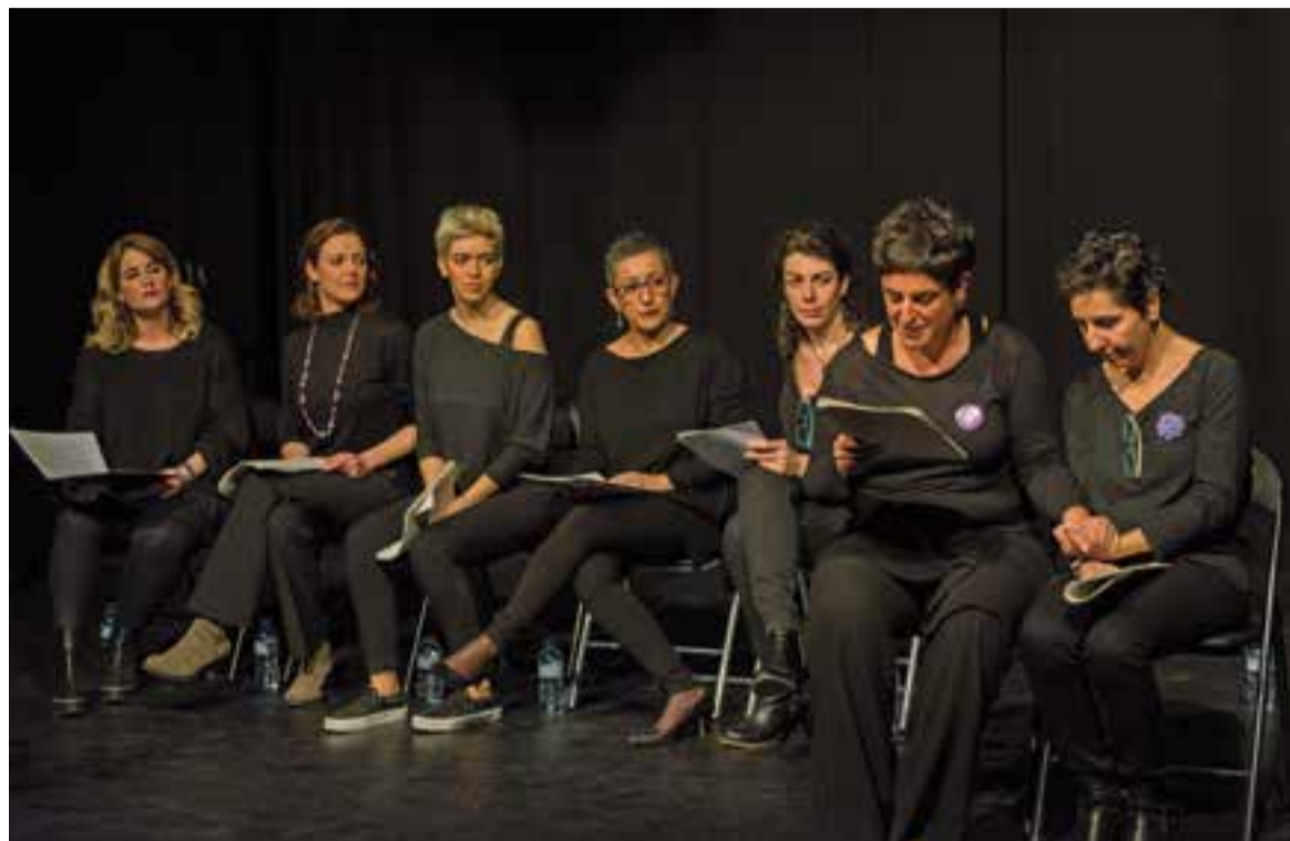
La lectura Totes 8 en diem 16, a la sala de Petit Format de l'Ateneu, divendres passat. Avui es repeteix la proposta però amb una versió reduïda Totes 4 en diem 8. Es podrà gaudir aquest vespre, a les 19 h, a la Sala d'Actes d'El Mirador