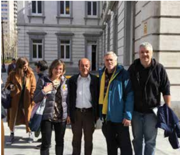
Els quatre regidors d'ERC a les portes del Suprem, dimarts passat.