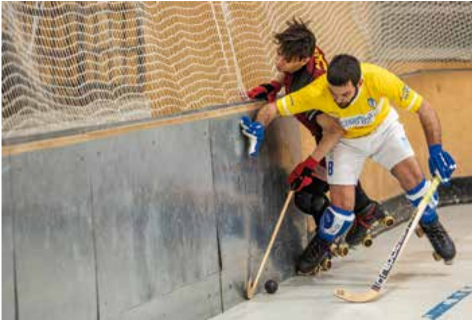
L'HC Castellar va tornar a xocar contra un rival en lliga.

Tot i seguir en la bona línia de joc, l'HC Castellar va tornar a patir l'enèsim correctiu d'aquesta temporada, després d'encaixar un 5-0 en la visita a l'Arenys de Munt. Els del Maresme, setens classificats, van ser més efectius de cara a porteria i van assegurar els tres punts amb jugadors de l'equip de Nacional Catalana.