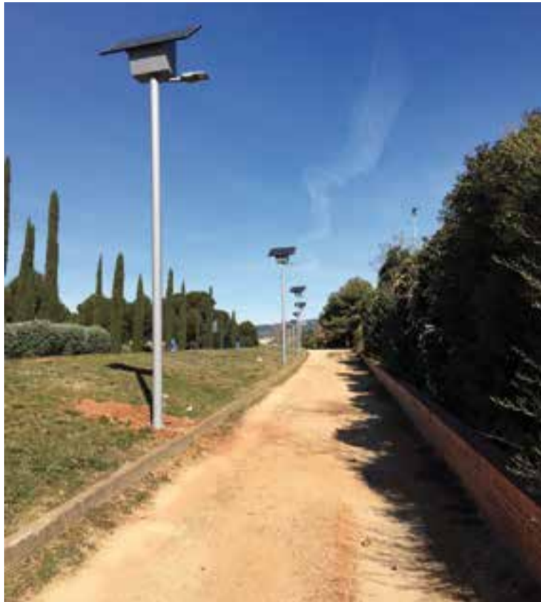
Alguns dels fanals que s'han instal·lat a l'àrea de passeig del Pla de la Bruguera.

Les lluminàries instal·lades, que compten amb una potència de 30 W cadascuna, suposaran un estalvi anual en el consum elèctric de 1.260 kWh/any, el que equival a una reducció d'emissions de mitja tona de CO 2 a l'any. La instal·lació de les 10 lluminàries LED fotovoltaïques ha suposat una inversió de 26.000 euros, 22.000 euros menys del que costaria una instal·lació convencional connectada a la xarxa elèctrica. Castellar disposa ara d'un total de 15 punts de llum amb panells d'energia solar: 8 a l'àrea de passeig del Pla de la Bruguera, 4 a l'aparcament del carrer de Sot de Golerès, 2 al parc de Colobrers i 1 a l'aparcament de Les Arenes. ✦