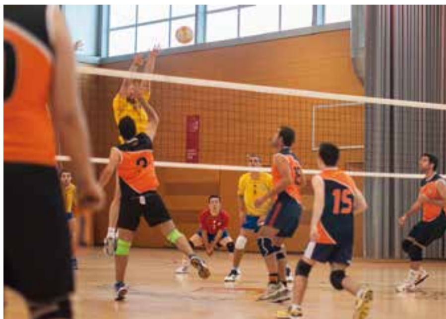
Els jugadors del sènior masculí en un partit al Puigverd, en imatge d'arxiu.