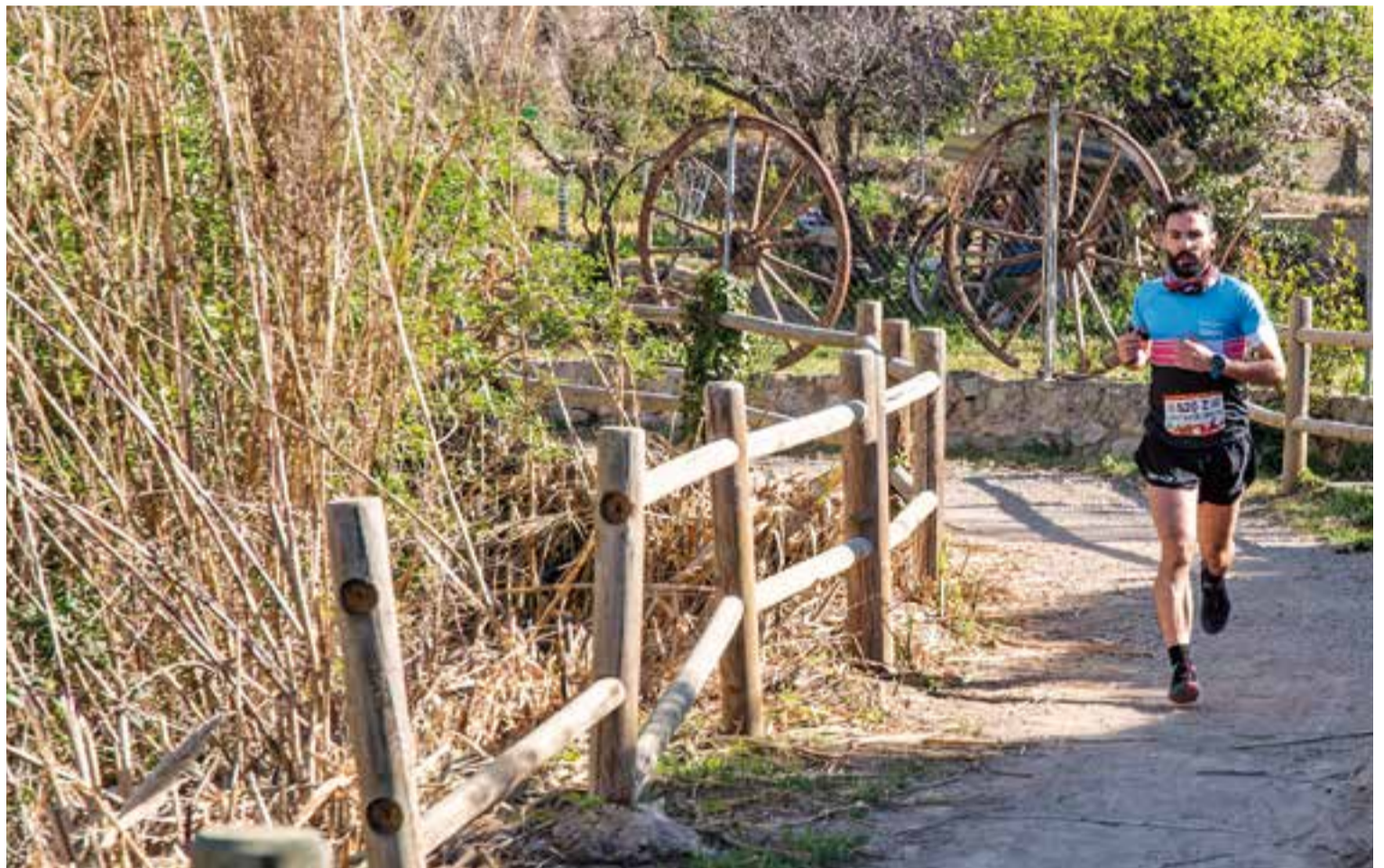
Un dels participants de la cinquena edició de la Corriols del Vallès, a l'últim tram no asfaltat de la cursa.