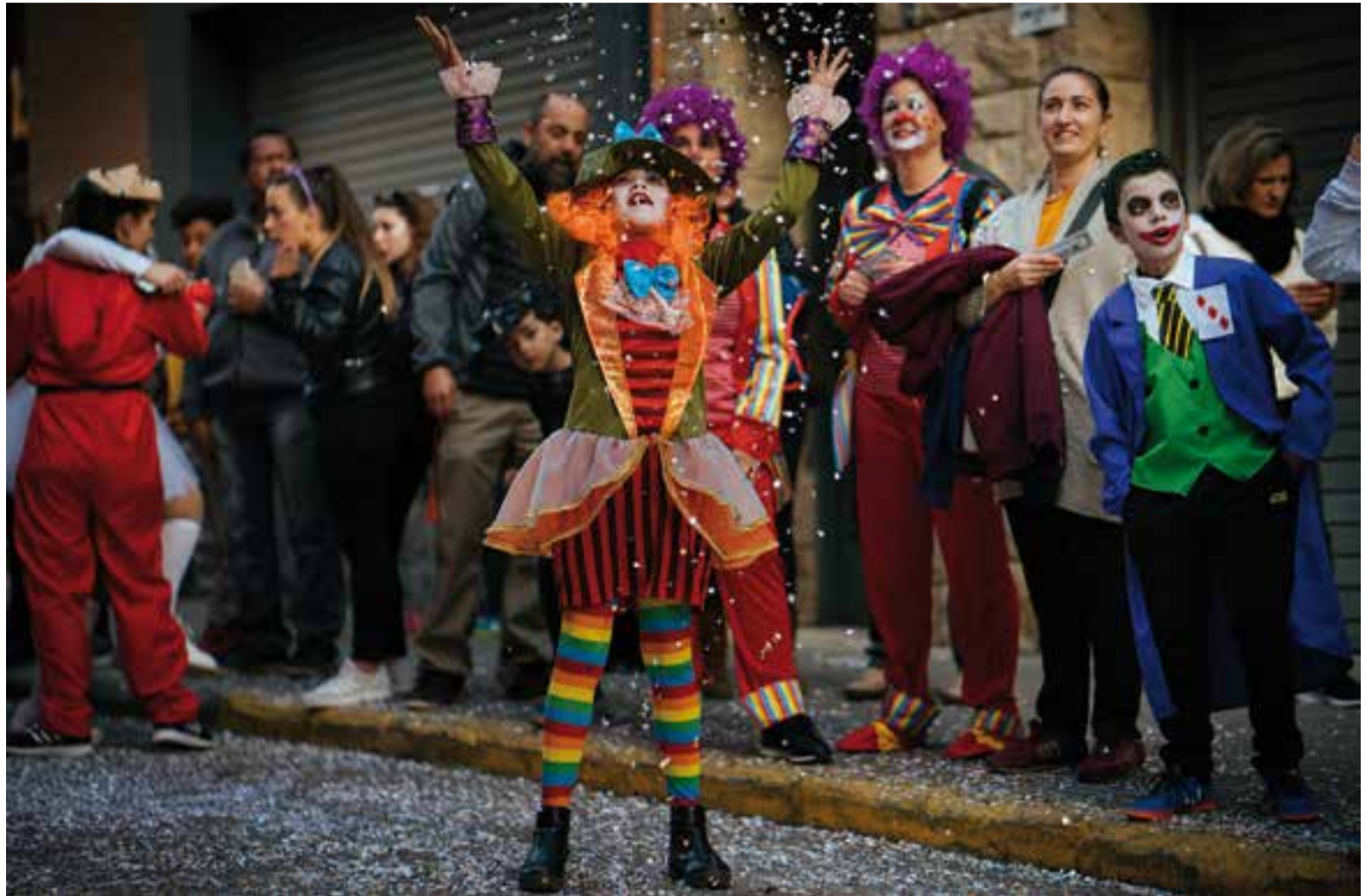
Una nena disfressada del Barretaire d'Alicia al País de les Meravelles juga amb confetti durant la rua de Carnaval, dissabte passat.

Entregades a la causa, les diferents comparses no van deixar de ballar durant més de dues hores i mitja, saltironejant pels carrers de