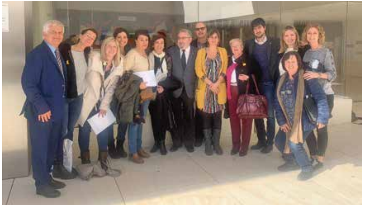
Foto de família en el marc de la jornada de treball 'Experiència i futur'.

COMSalut pretén impulsar la reorientació del sistema sanitari cap a la promoció de la salut i la salut comunitària, així com la lluita contra les desigualtats i la promoció de les polítiques públiques saludables en l'àmbit local. "Aquesta és una línia que s'ha engegat darrerament dins del Departament de Salut de la Generalitat però en què històricament Castellar, tant des del CAP com des de la regidoria de Salut de l'Ajuntament, hi ha cregut molt. Des de fa tres anys fem prescripció social amb l'objectiu que la salut no vingui només donada per uns indicadors farmacològics sinó que es facin activitats de caràcter més social com caminar, fer zumba o un cafè tertúlia".