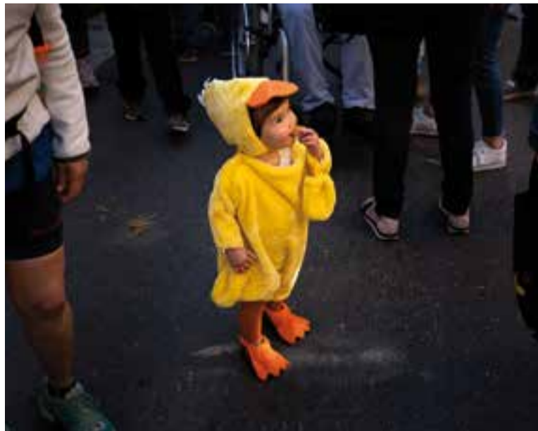
Un infant disfressat d'aneguet al Carnestoltes del carrer Major.

Els veïns, alguns disfressats de pagesos, també han decorat el carrer Major amb cistells de vímet i forques ancestrals. Un absolut homenatge als oficis rurals del passat. Hi ha un toro de cartró i vaques, i algunes cantonades, a més, s'han adornat amb flors. I, ara que som en temps de brandar banderes, n'hi ha una que havia quedat una mica arraconada i que ha recobrat protagonisme. Per sobre de les altres. El groc, el vermell i el blanc, llampanants sota la solejada, han tenyit els balcons del carrer Major. ✦